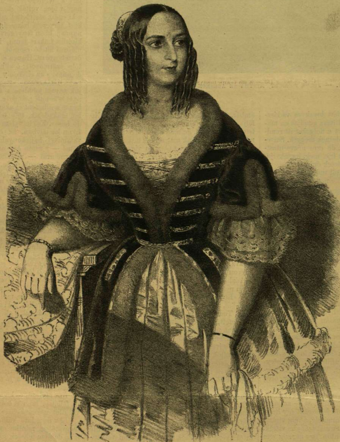
LABORFALVI RÓZA MINT RÓZSA.

dani, hogy ő írjon nagysádnak. Oh, Jolán nem szokott elfeledkezni barátairól. — Az nagyon kedves lesz tőle. Ah, de már mennem is kell... S kezdett szedelőzködni. — Megkérném, hogy legyen szerencsénk egy kis reggelire, ha nem félnék, hogy ily egyszerű vadásztanya, éppen kiürítettése percében, alig fog valami élvezhetővel szolgálni nagysádnak! — Istenem! Hogy a kastélyból erről nem is gondoskodtak! Igazán megfoghatatlan — — Kérem, sebj, Mrs. Bell fog azért valamit találni. Lesz szerencsénk? — Köszönöm, hogyne! Örömmel elfogodom. — Ah, a kedves Mrs. Bell! Fölkeresem egy percze. Szobájában találta az élemedett kora derek