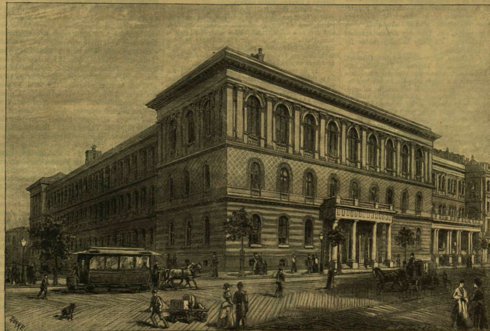
A KIR. JÓZSEF-MŰEGYETEM ÚJ PALOTÁJA.