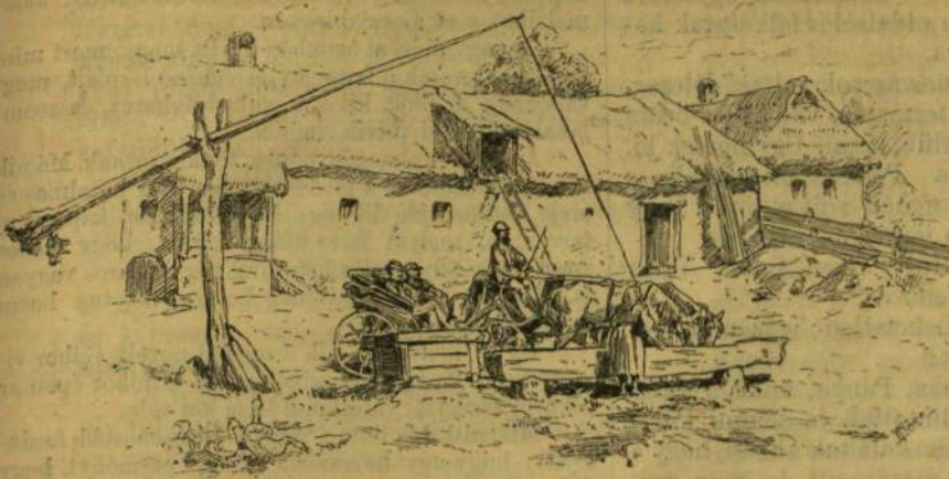
A szt.-katalini állás alatt.

A következők az lett, hogy másnap, midőn az orvos által meghívott előjáróság a kórházban megjelent, a betegek mind kiugrottak az ágyból s a betegséget az orvost a kialakultó héren kívül, még jól megjutalmazta. Mire észrevették, hogy a betegek állapota az ijátság s erőltetés miatt még rosszabb lett, a doktor elűnt s szolgáltatásul más városban ismételte ugyanezt a fogást.