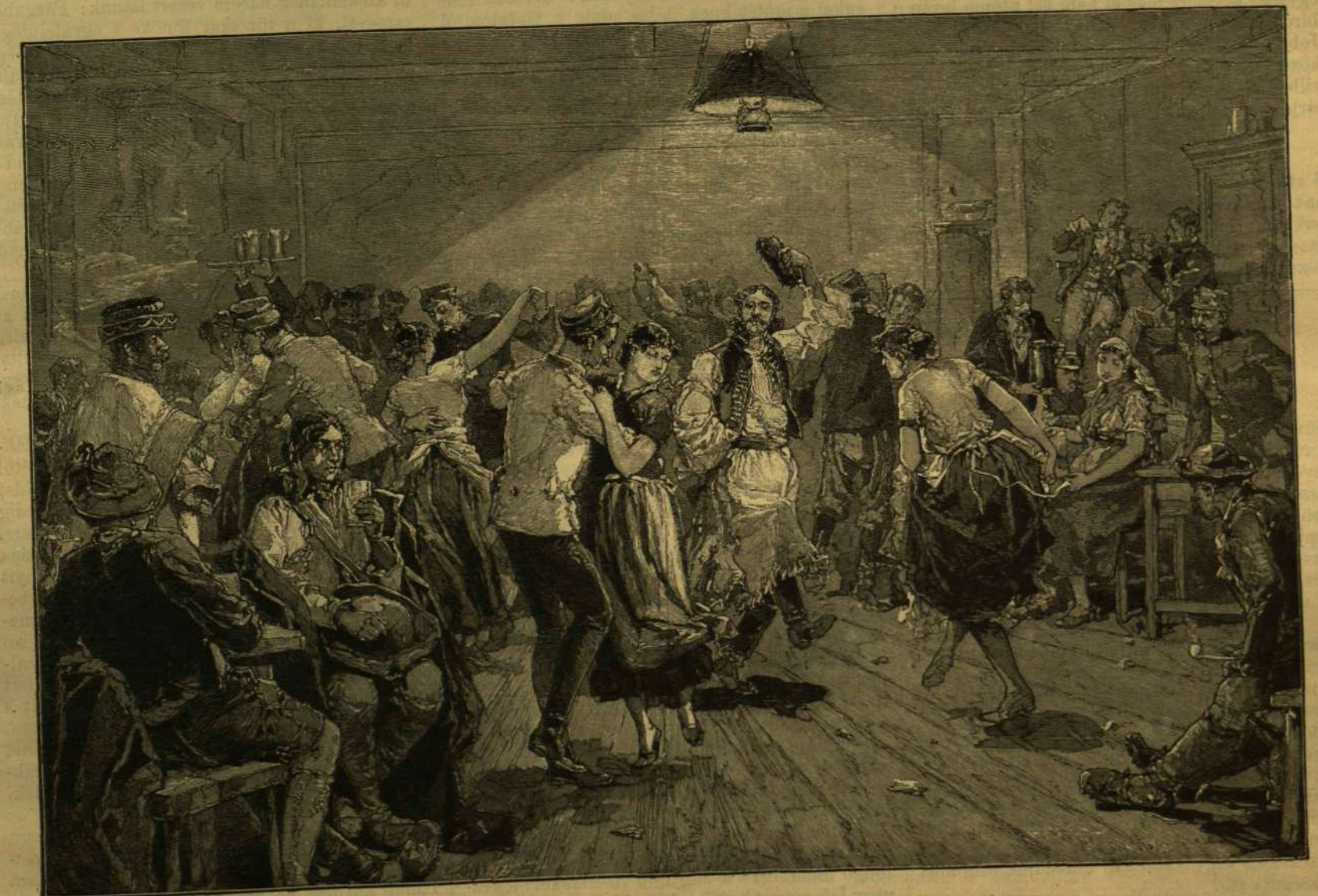
MAGYAR BAKÁK DÁRIDÓJA EGY BÉCSI KÜLVÁROSI KORCSMÁBAN.