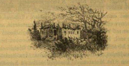
Az elpusztult udvarház.

«Nem is mertem, midőn azonban alkotmányunk visszaillesztott, 1867-ben elővettem kéziratomat, a beszély eredeti kidolgozását, s itt-ott javítva rajta valamit, kiadtam összegyűjtött beszélyeim között («Válalok és képek. Pest. 1867»). Ez alakban veszi az olvasó e harmadik kiadást is. Az az értelem, a hangulat, a mely írására ösztönzött, hála Istennek, nincs többé sem az én kedélyemben, sem az olvasóban. A magyar nemzet megküzdött az idők mostohaaságával és nem esett se a lázas szenvedélyek, se a télen fásultság martalékánál. De beszélyem talán így sem vesztette el minden érdekét, mint a múltnak egy oly képe, melyben az egykor időszerű nemzetit némi általános emberi is támogatja».