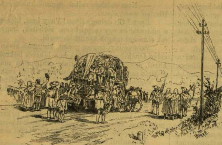
Két mokány hegyi ló húzta, s mintegy husz ember ült rajta.