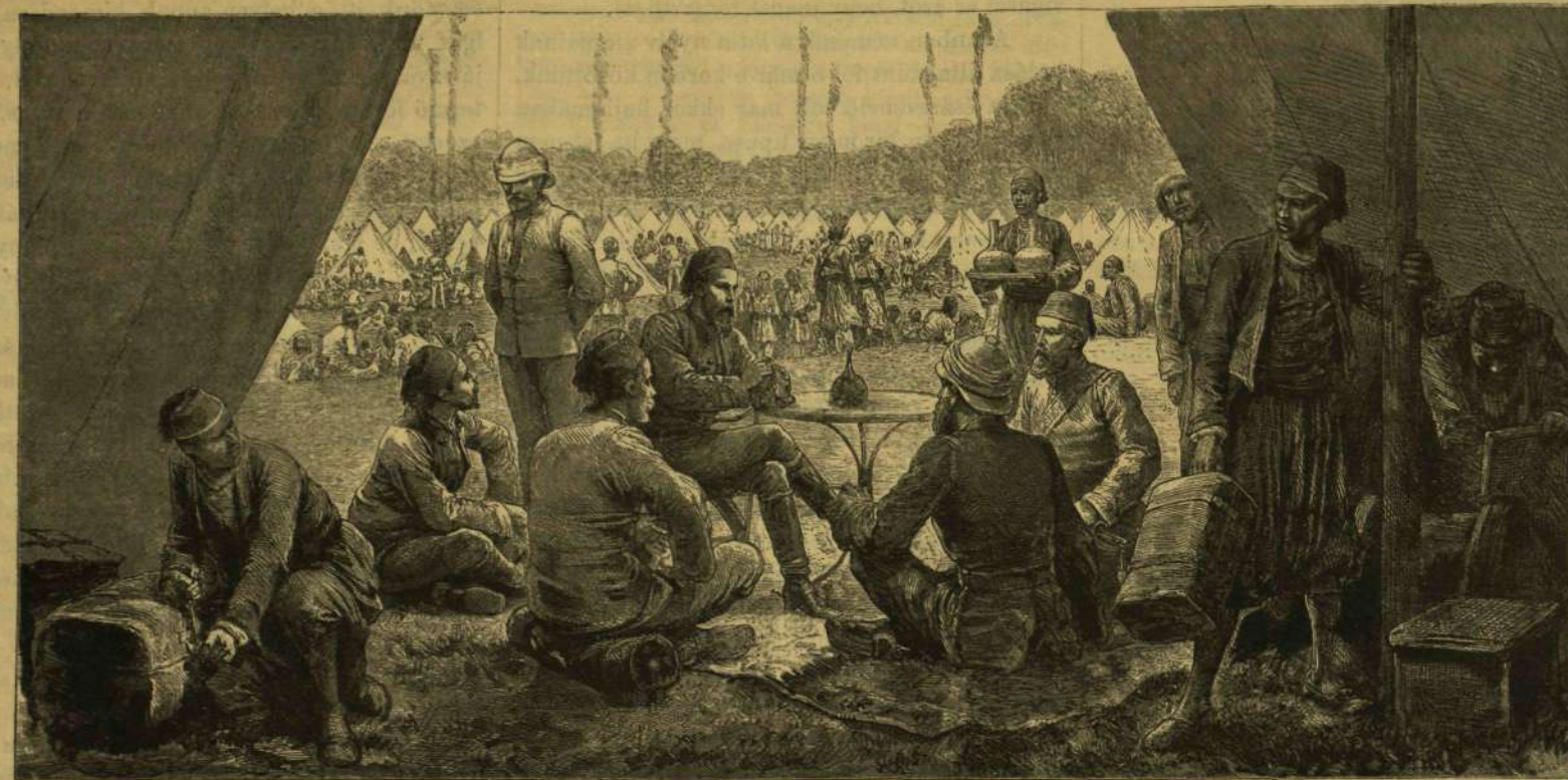
A SZUDÁNI HARCZTÉRŐL. — HICKS PASA ÉS TÁBORKARA AZ ASSZÁLIAI CSATA UTÁN.