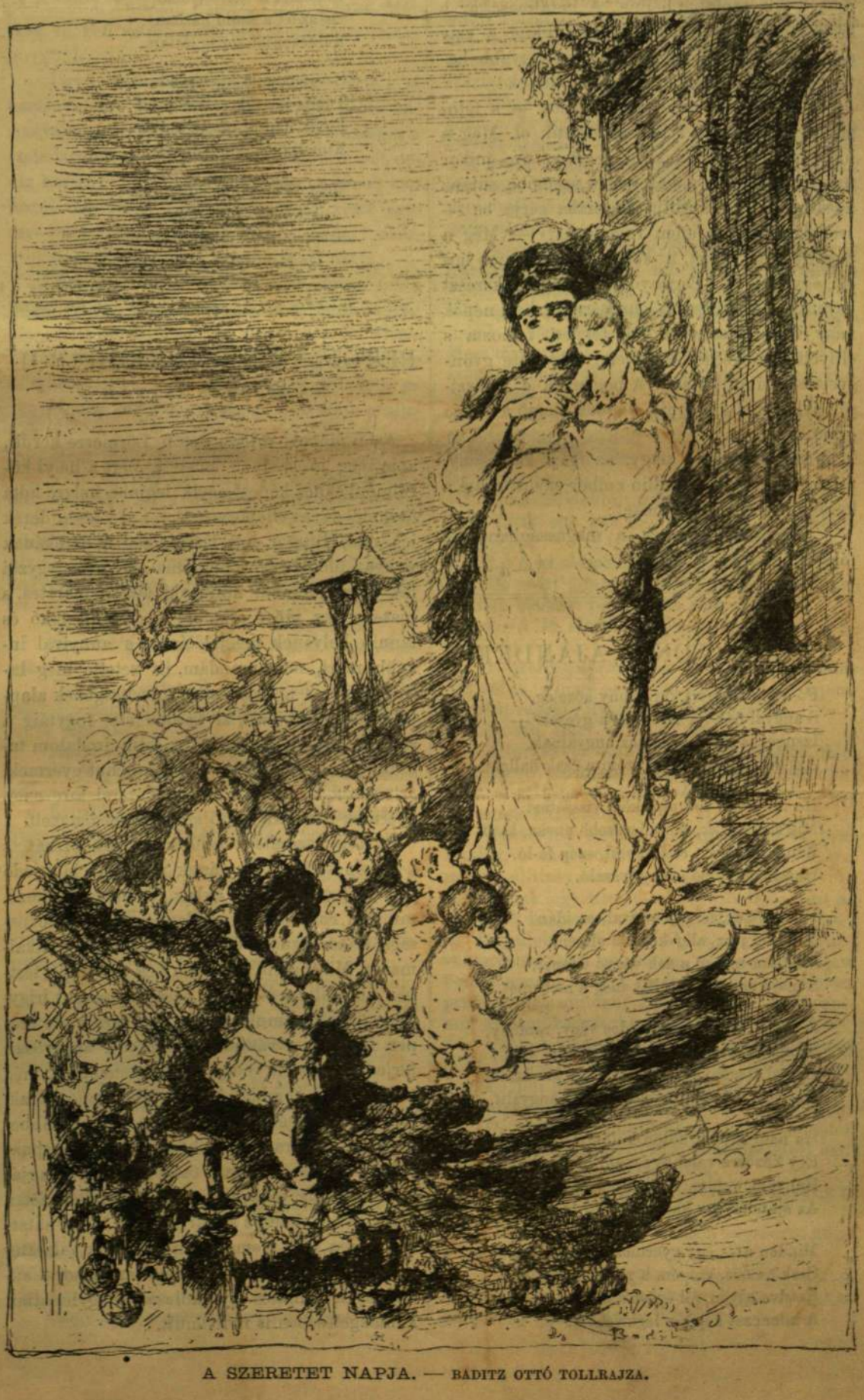
A SZERETET NAPJA. — BADIŰ OTTÓ TOLLRAJZA.