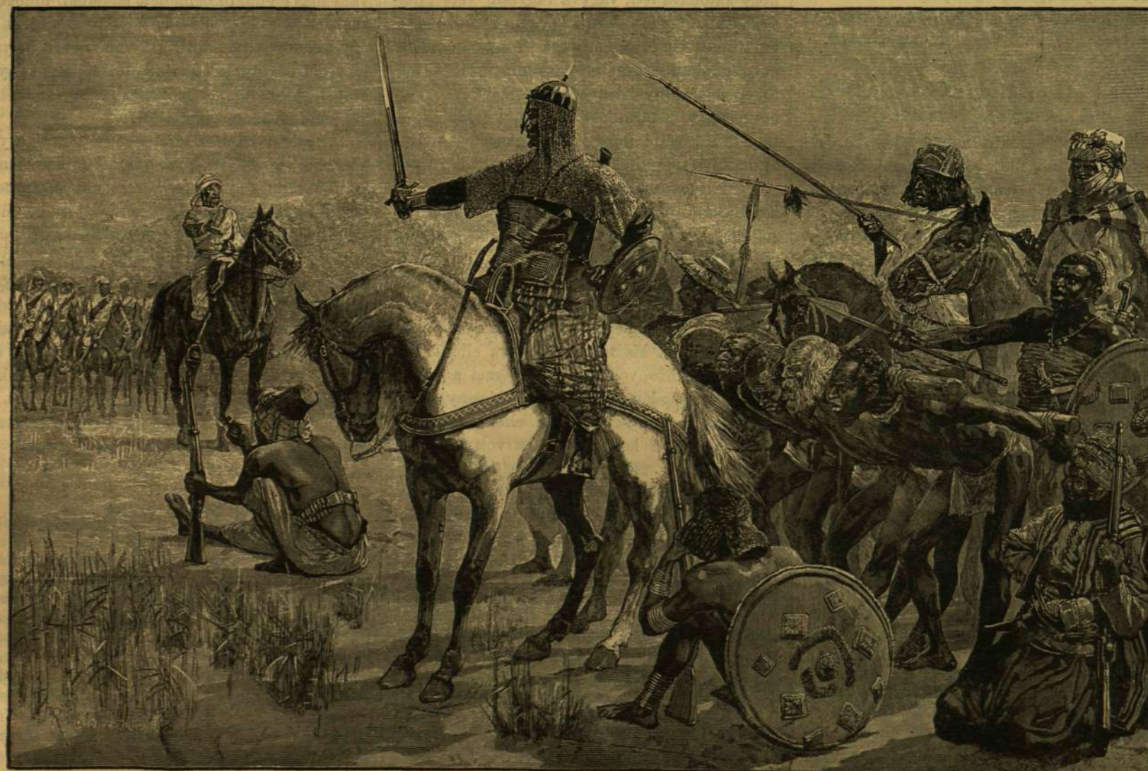
A SZUDÁNI HARCZTÉRŐL. — TANÁCSKOZÁS AZ UTON.

sággal igazítja utba az eltévelygett földit, kit szinte ismerni vél valahonnan gyermekkorából, mikor még a hosszú katonáskodás nem szakította ki hazájából, hogy aztán meghonosítsa a császár-város büszke szolgálatában. Nem csodálkozunk rajta, bár kellemesen lep meg az, hogy még a lövönatu vaspálya szolgálati személyzete közt is honfiakra találunk, kik kitüntető előzékenységgel halmoznak el, ellenben szinte fájdalmas hangulatba hoz az a pár német szó, melyet saját édes kanászaink és gulyásaink paprikás ajakáról hallunk ellebbenni. Pedig ha tudnók, hogy mily veszedelmes csábbal bir a nagy világváros közelsége határszéli megyeink egy-némely községére, hol, mint Pozsony, Sopron, Győr, Vas- és Mosonyban, tősgyökeres magyar gazdák komencióra szegődtek el gyerekei-