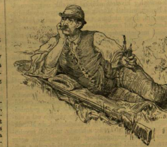
Félkönyökére dülve, kihívó tekintetet vetett ráink.

Még egyszer megnézte őket, futólag, le-nézőleg.