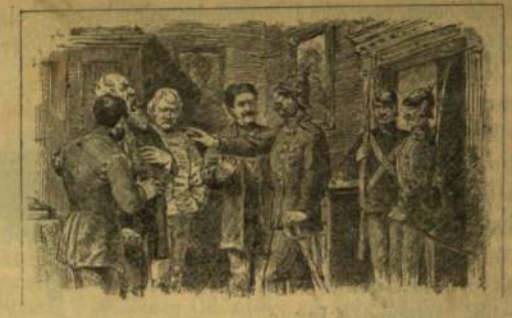
A zsanártiszta Radnóthyra tette kezét...

Mayne Read kapitány északi Irlandban született 1816-ban. Presbyter papnak nevelték, de nem éreztetett hajlamot e komoly pályához. Szenvedélye az utazás és a kaland volt s hogy elérje vágyait, Amerikába vitorlázott, alig huszonegy éves korában. Kereskedésen és vadászaton kezdte a Vörös folyó indinajai társaságában. 1840-ben egy önkéntes csapatához szegődött, mely Texasba, mexikói fegyveres bandák ellen volt indulandó. Öt évig maradt ott, a prairie-ken vadászgatva s a Misszourin fölfelé utazgatva. Midőn 1845-ben kiűtött a háboru Mexikó és az Egyesült-Államok közt, kapitányi rangban lépett az amerikai hadseregbe, s több ízben kiűtette magát vitézségével, így Vera-Cruz ostrománál és bevételénél, a Churubascoi utolsó gyalogsági összecsapásnál és Chapultepec reménytelen ostrománál. Mikor a háboru bevégeződött, épen részt akart venni a magyar forradalomban, egy New-York-ban toborzott önkéntes-csapatnál, midőn híret vette a világi fegyverletételnek. Ezután Londonba ment, magát irodalmi pályára szentelendő. Egész sorozat novelláit írt, melyek közül a «Skalp-vadászok», «A fehér főnök», és «Oocela» a legismeretesebbek. Mayne Read kapitány Maıda-Hill-ben halt meg, mult hó 22-dikén. Özvegye szigoru viszonyok közt maradt hátra, s mint írják, barátai azon fáradoznak, hogy segélyt eszközöljenek ki számára a királynőtől.