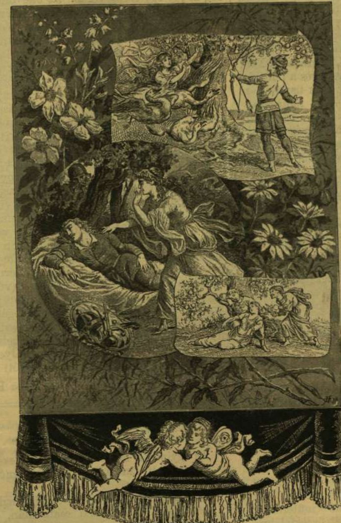
ÁRGYIRUS KIRÁLYFI ÉS TÜNDEK ILONA.