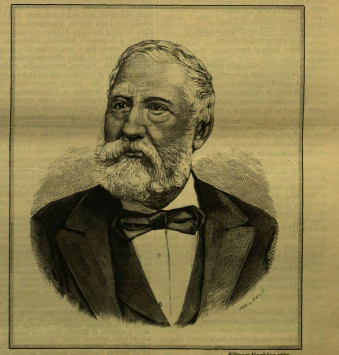
Gróf Cziráky János.

Legutolsó szereplése a főrendiház utóbbi nagy vitájában, az ugynevezett zsidó-keresztény házasság tárgyában beadott törvényjavaslat elleni tüzes harc volt. Tudva van, hogy ő nemcsak ellenzői közé tartozott a javaslatnak, de ellenzésében talán még a főpapok is túlhajtott — és fő eszközlője volt a százezerekre menő aláírások szerzésének azon körvényekhez, melyek a törvényjavaslat ellen a főrendiházhoz beadattak. Ez ugyan nem volt konzervatív eljárás, mert a vox populira és a plebiscitumra hivatkozni: inkább forradalmi eszköz mint konzervatív szokás; de itt a buzgó katolikus győzött a nyakas konzervatív. Vallásos buzgósága idézte elő, mint hiteselem állítják, halálát is, közvetlenül legalább. Mert Gyertyászentelő ünnepeknél előestéjén (febr. 1.) annak vigiliát lovasberényi kertjében a Boldogságos szűz szobra előtt térdelve töltötte, imádságba s a litániák éneklésébe merülve s a hús este és a nyirkos föld behatásától erős tüdőhurutot kapott, mely ágyba ejtette s néhány nap alatt, rohamos fejlődéssel, koporsóba vitte. Mint hívő keresztény — félelem nélkül nézett szembe a halállal s csak a szent atya utolsó áldását kérte Rómából, melyet távirati úton meg is kapott. Így, a halotti szentségek ájtatos felvétele után, nyugodtan aludt el az Urban, febr. 9-én. Előbb említett utolsó politikai szereplése