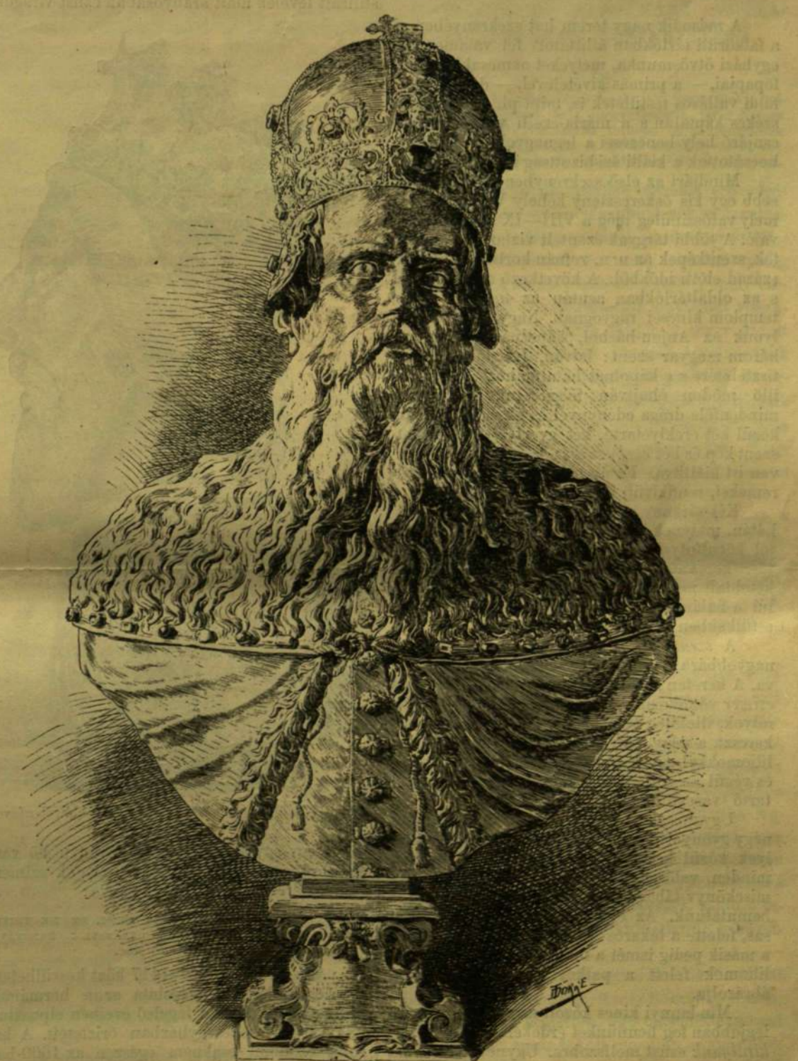
szent istván király ezüst mellszobra. A nágrábi székesegyház kincseiből.

meg figyelmünket, mindannyi az ország területéről gyűjtve. Különböző nagyságu sárarany karikák, melyek talán azon kor forgalmi pénzei s alkalmilag dísz tárgyak, ékszerek voltak. A közepebbi székényben egy olyan, csaknem párat-