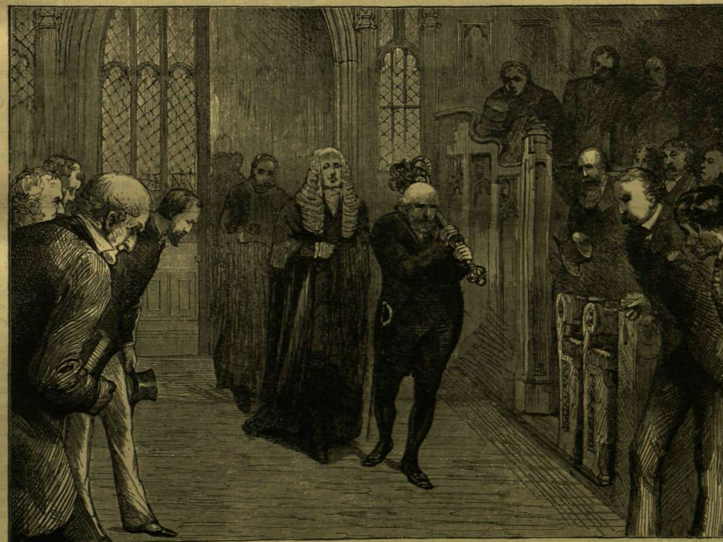
•AZ ELNÖK JÖ!•