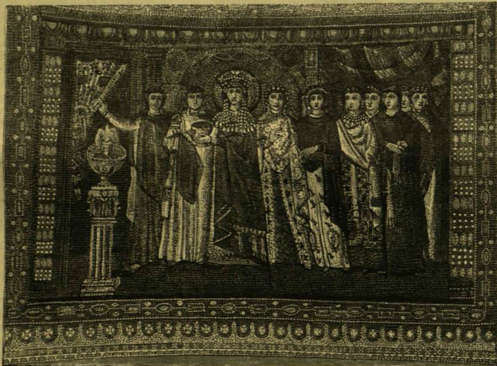
THEODORA CSÁSZÁRNŐ S UDVARA. MOZAIK-KÉP A SZ. VITÁL TEMPLOMBAN.

pedig ártatlanul szenvedtek. Akkor végezték ki Martinovicsot és társait. S azután azt mondta testvérenek: itt van egy ládika irás, ezt tedd el jól. Majd halálom után jönnek többek, kik téled irományokat fognak kérni, de senkinek ki ne add; hanem ezen ládika tetéjére van ragasztva egy elszakadt papíros-darab; csak annak add oda, a ki ezen papír-darab hozzá illő hiányzó részét neked elő mutatja. Igaz, ugy volt. Ő meghalt a Martinovics lefejeztése után 14 napra. Holta után jöttek többek, még a nádor is küldött egy megbízottat, hogy kell irományoknak nála lenni és utána maradni, de edes anyám eltagadta; míg végre az igazi eljött, ki nagyon sirt Kármán elhunyt fölé, de soha edes anyám