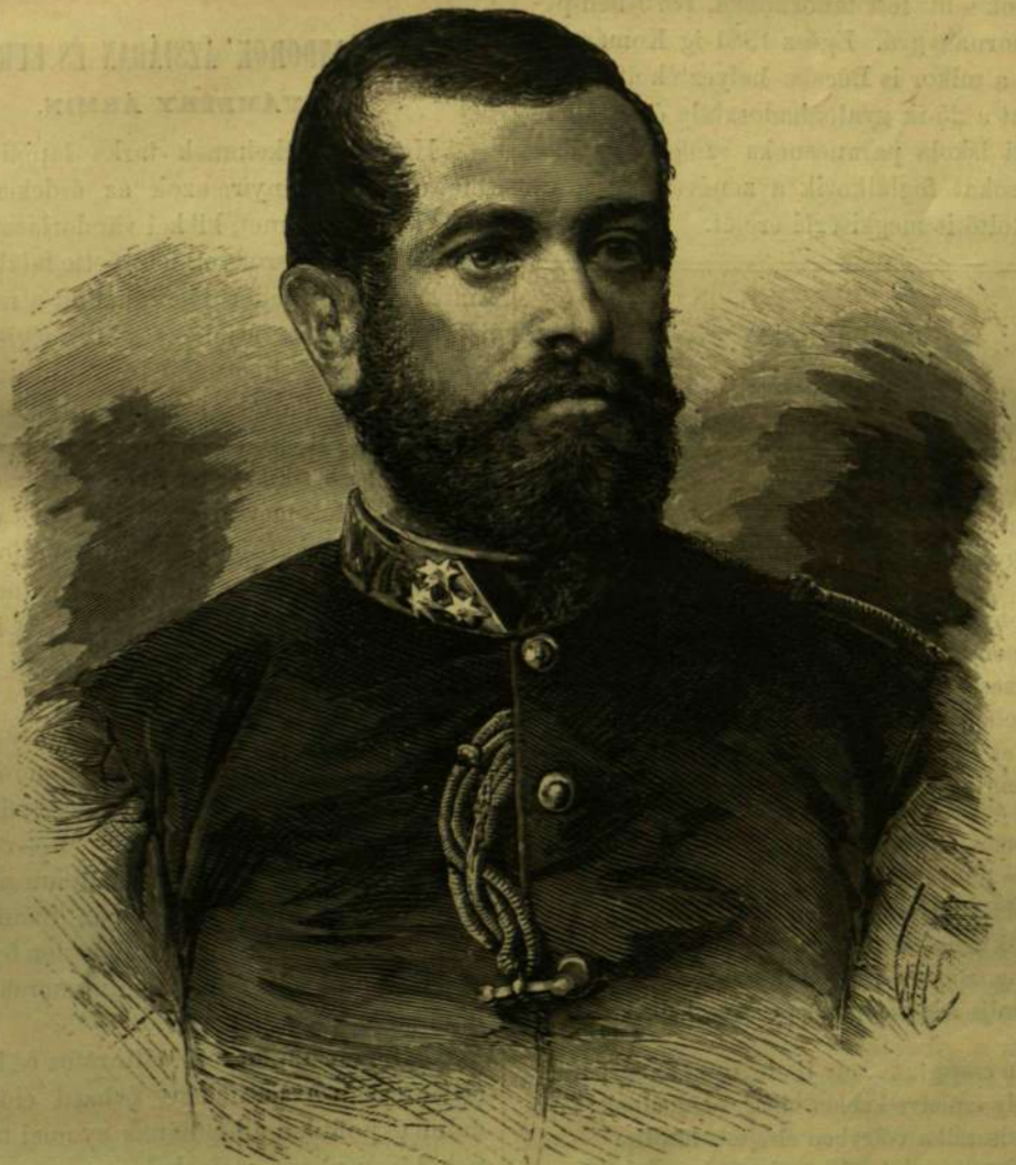
SALVATOR JÁNOS FŐHERCEG.