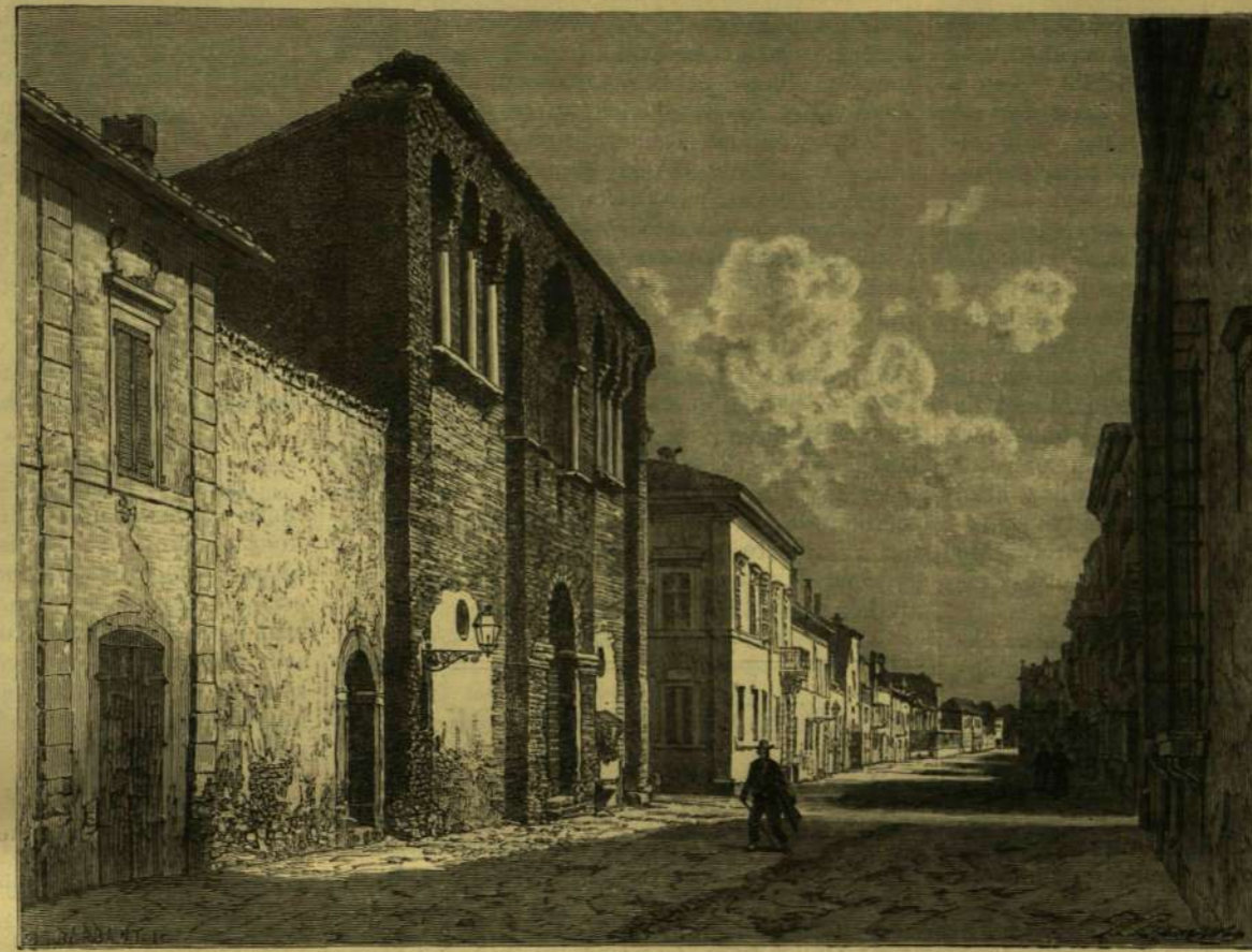
RAVENNAI KÉPEK. — THEODORIK PALOTÁJÁNAK ROMJAI.