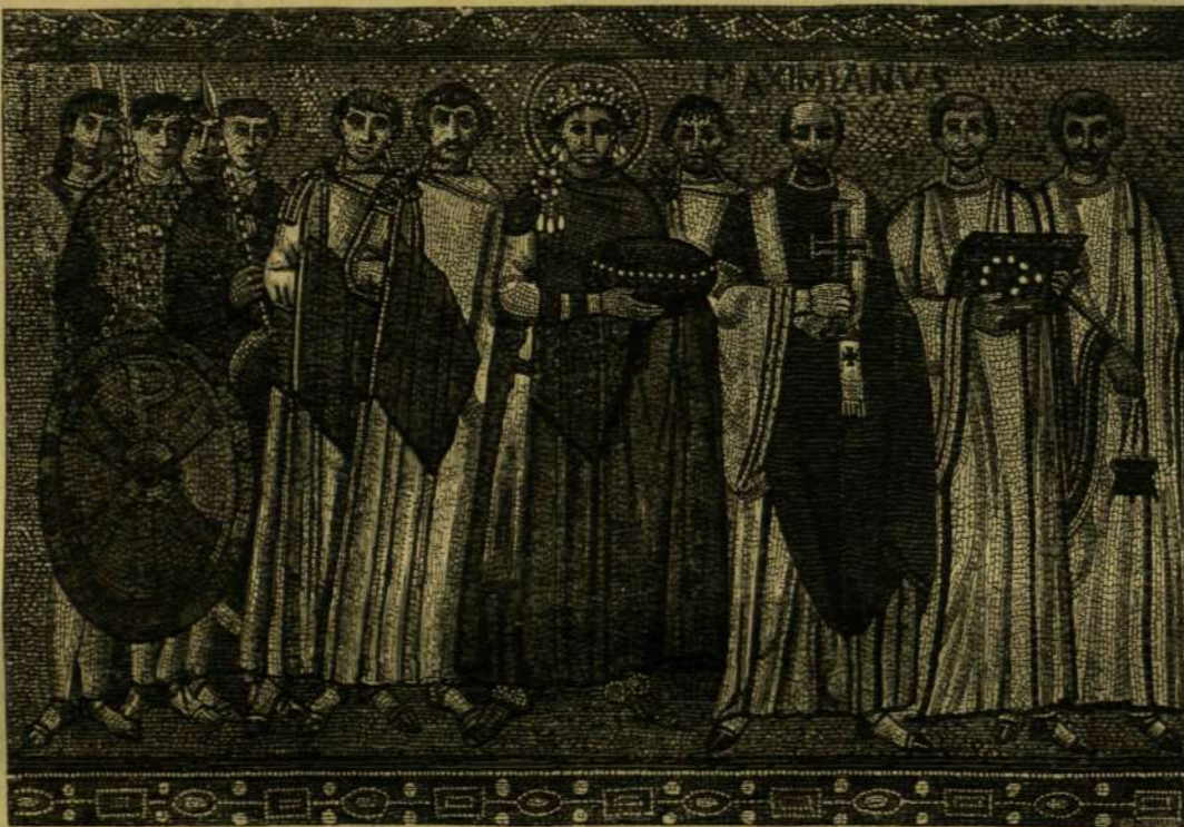
JUSTINIÁN CSÁSZÁR S MAXIMIÁN ÉRSEK. MOZAIK-KÉP A SZ. VITÁL TEMPLOMBAN.