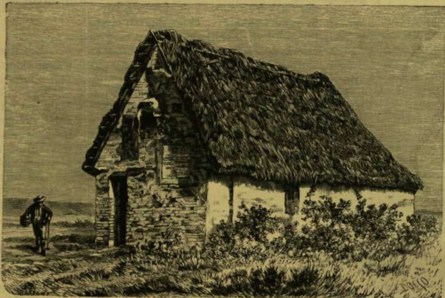
GARIBALDI MENEDÉKHELYE 1849-BEN, RAVENNA MELLETT.

Ravenna jelenkori lakosai azonban sokkal kevesebb fontosságot tulajdonítanak e mozaikoknak és sokkal kevesebb áhitattal tekintenek Theodorik palotájának romjaira, mint egy, a város kikötőjétől nem messze fekvő egyszerű kis modern kunyhóra. Bemutatjuk képben e kunyhót is, bár sem művészeti, sem arkhaeológ-