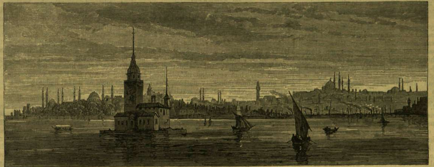
KONSTANTINÁPOLYI KÉPEK. — SZŰZ TORNYA, AZ ARANYSZARV FELŐL.

A csendes, nyugodt városi élet a törökök