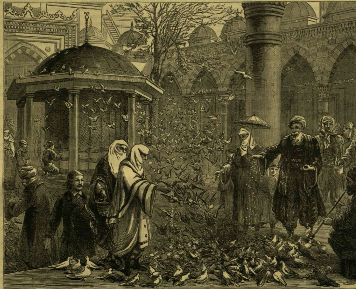
GALAMBOK ETETÉSE A BAJAZID-MECSET UDVARÁN.