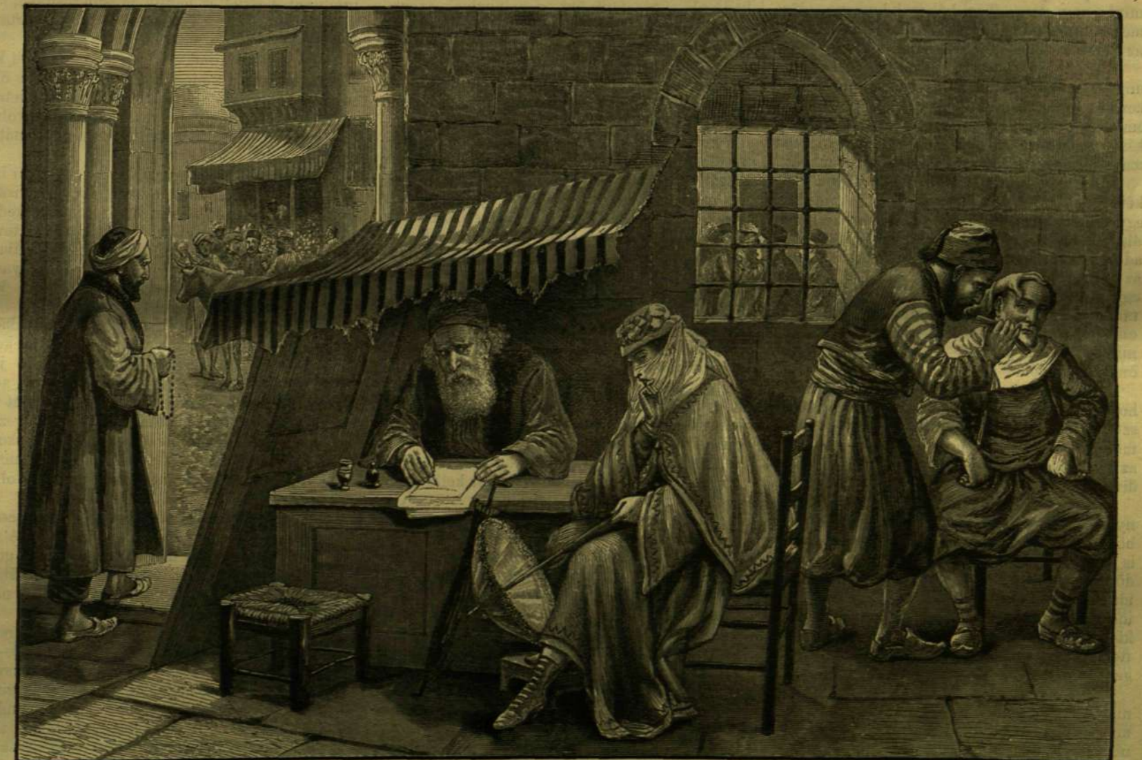
KONSTANTINÁPOLYI KÉPEK. — EGY MECSET BEJÁRATÁNÁL.