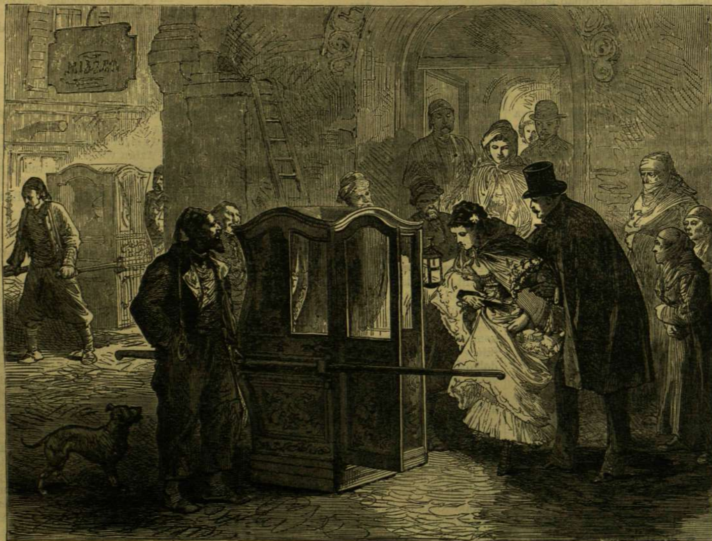
BÁLBA MENŐ NŐK.