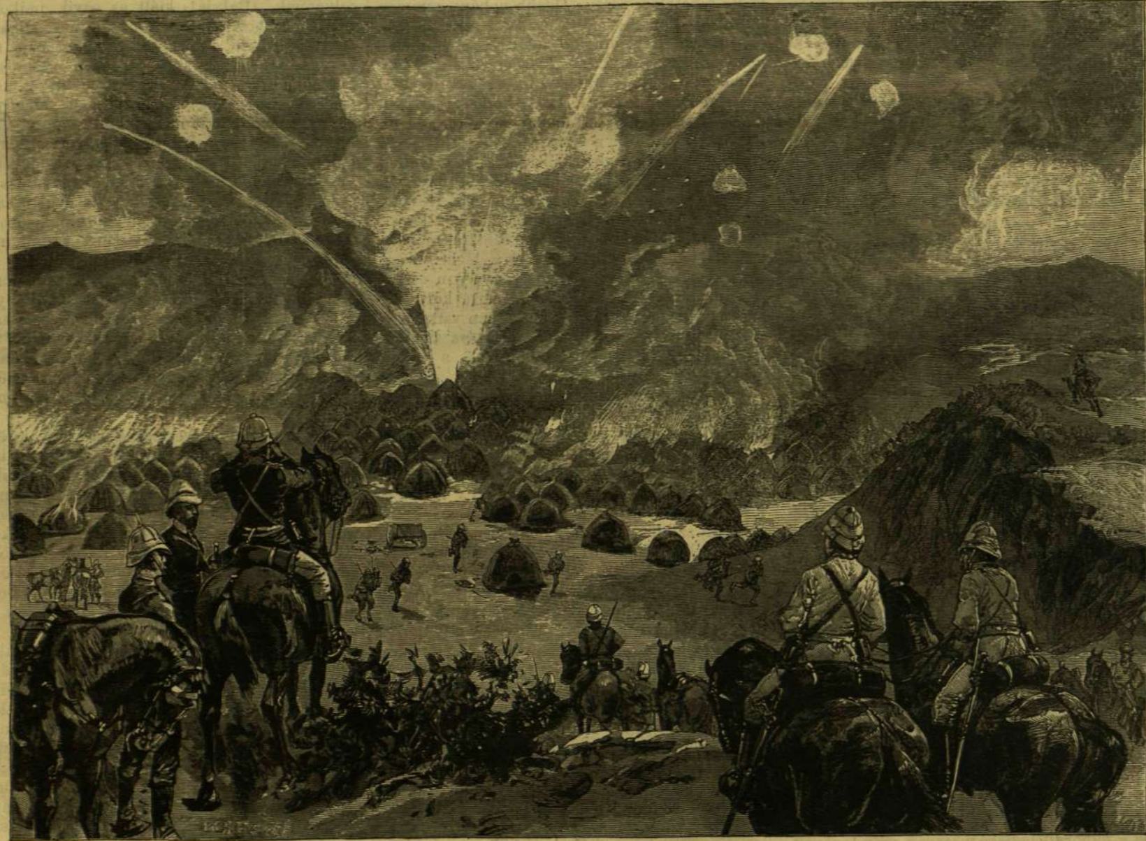
A SZUDÁNI HADJÁRATBÓL. — A TAMASI CSATA.

* A nyilvános mesemondók intézménye még mindig igen kedvelt Japánban, bár az új szokások sok régi divatot megsemmisítettek. Magában Tokióban 600 ily utcai mesemondó (kosakusi és hanasika) van. Egy kis asztal, legyező s papírpálca képezi