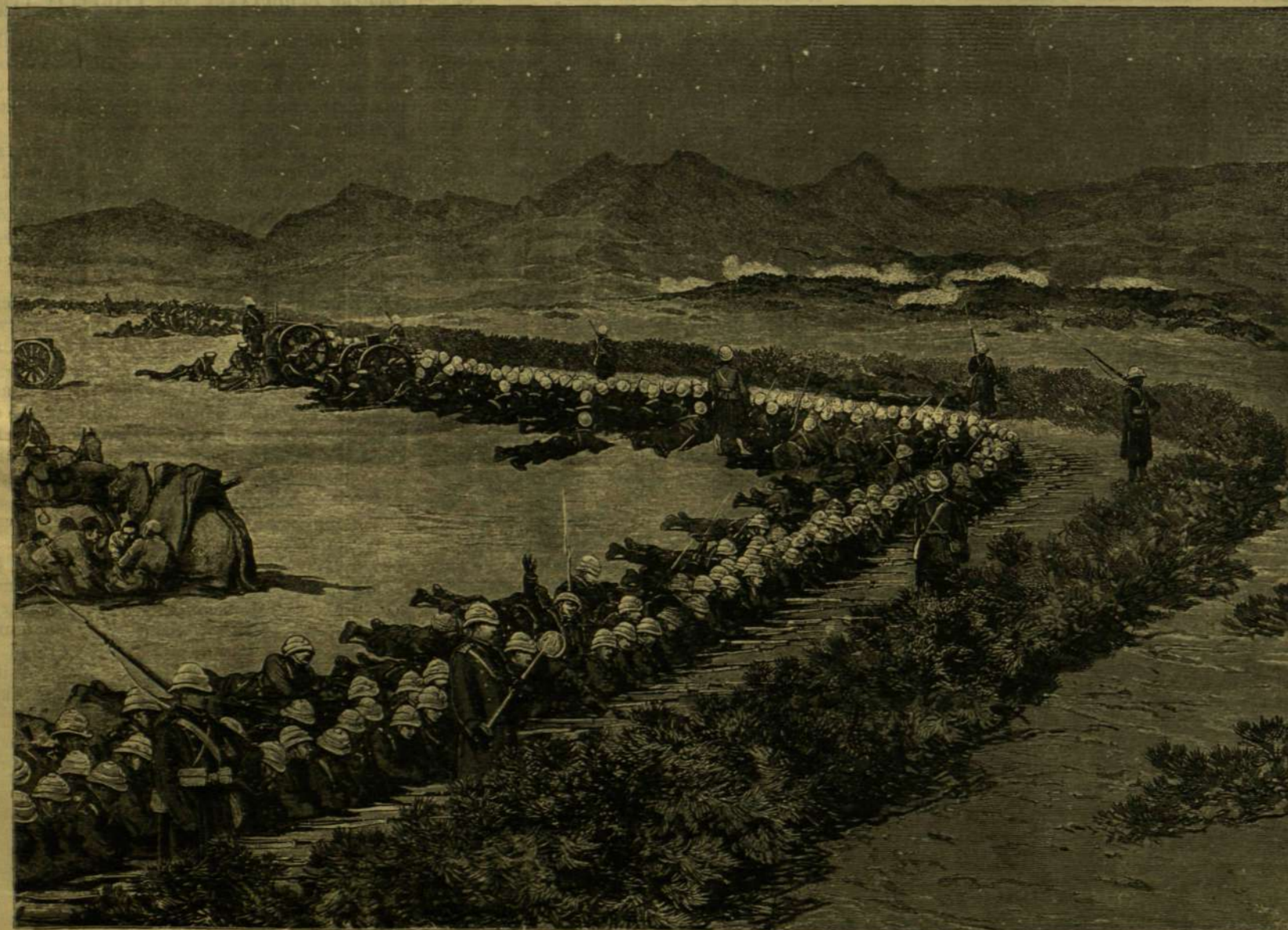
A SZUDÁNI HADJÁRATBÓL. — AZ ÉJJELEI HARCS MÁRCZIUS 13-ÁN TAMASINÁL.