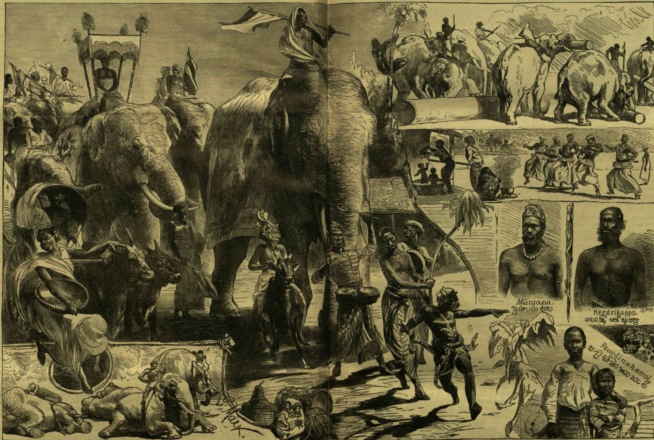
A SZINGHAL KÁRAVÁN BUDAPESTEN.