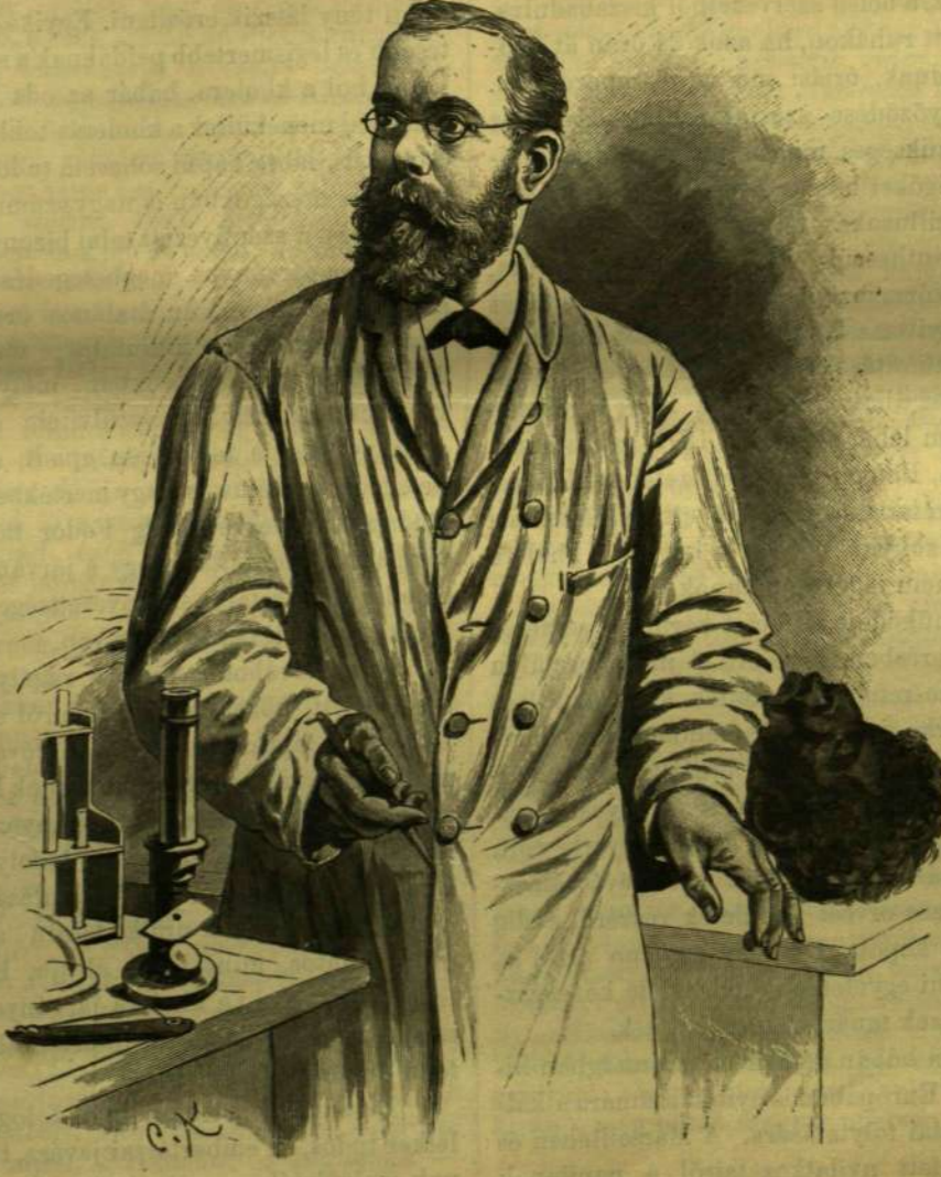
Dr. KOCH ROBERT.

Koch ugyanis fölfedezte a gümőkórnak (tuberculosis) okozóját, a bacillus tuberculosisnak nevezett hasadó gomba képében. E parányi élősdű gomba állatokba oltva, azoknál gümőkört idéz elő s elpusztítja azokat. Koch 273 tengeri malacot, 105 házi nyulat, 3 kutyát, 13 macskát, 2 görényt, 10 tyukot, 12 galambot, 25 fehér egeret, 44 mezei egeret, végül 19 patkányt oltott be, és mindegyiken észlelte a tuberculo-