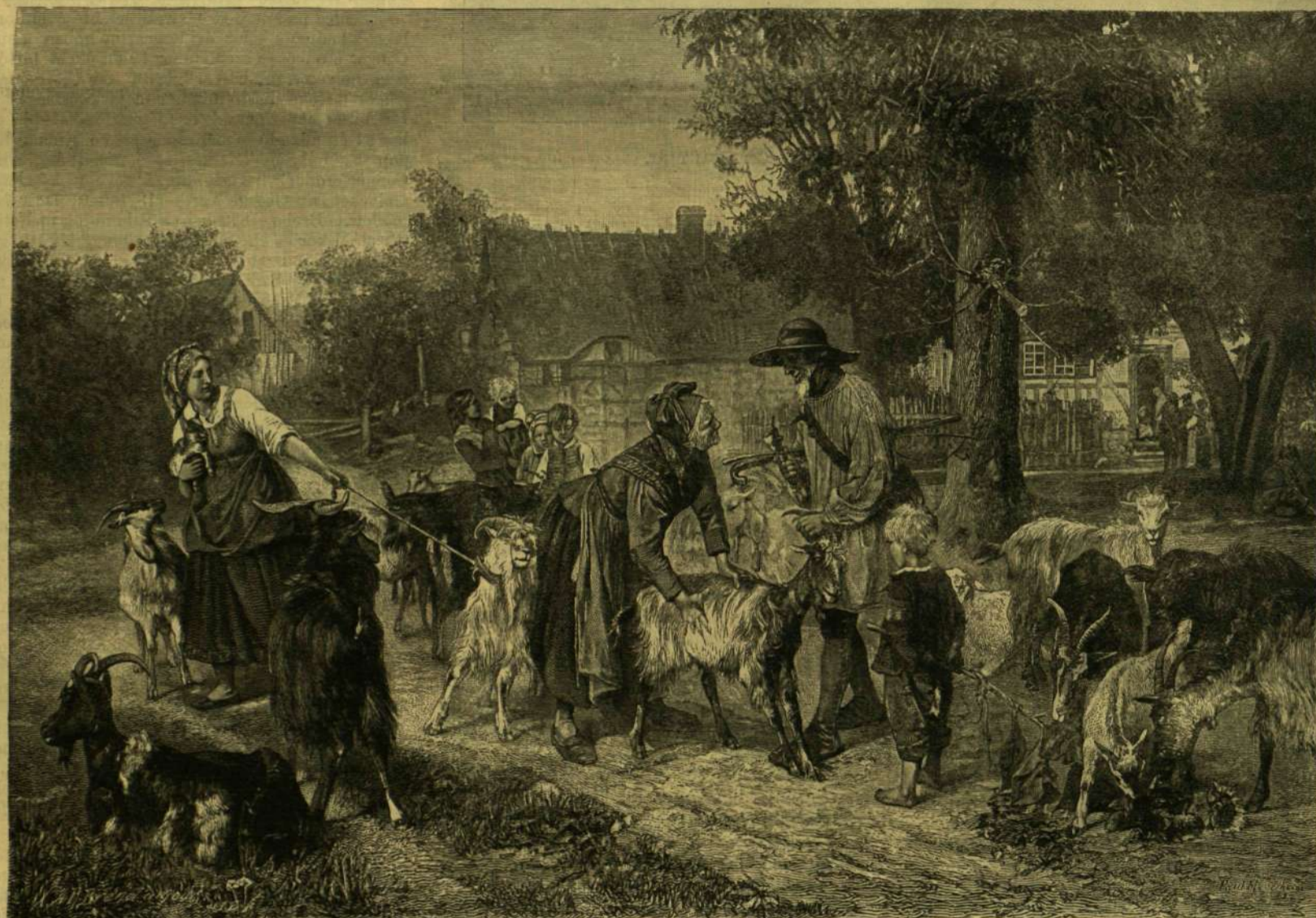
KECSKEVÁSÁR. — MEYERHEIM PÁL FESTMÉNYE UTÁN.

* Negyvenezer forint értékű nemzeti jelvény