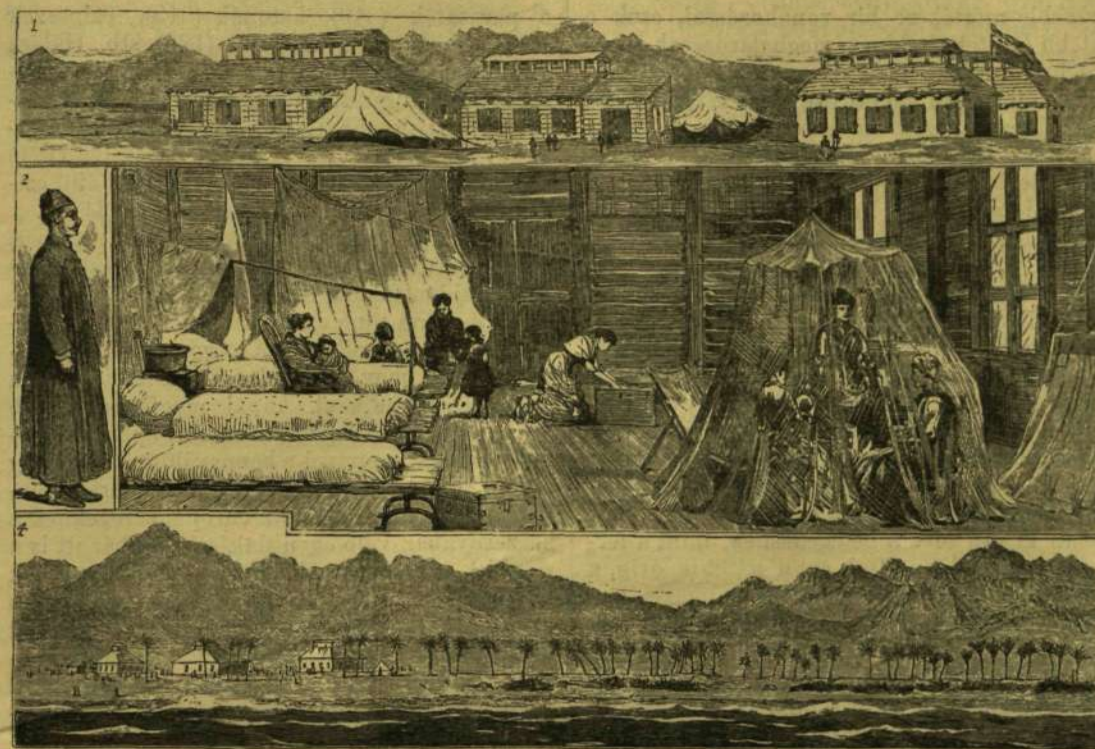
EGY ANGOL HAJÓ UTASAI VESZTEGZÁR ALATT, EL-TORBAN, AZ ARAB PARTOKON.

* A tevé lassanként elszaporodott Kalifornia sivatagjain s a Kolorado folyó partjain s most szabadon csatangolva jól érzi magát. Legelőször e tevéket Ujmexiko s Arizona hadserege számára az amerikai hatóság hozta be, később a bányászok használták s a vadon élő tevék ezentől származtak.