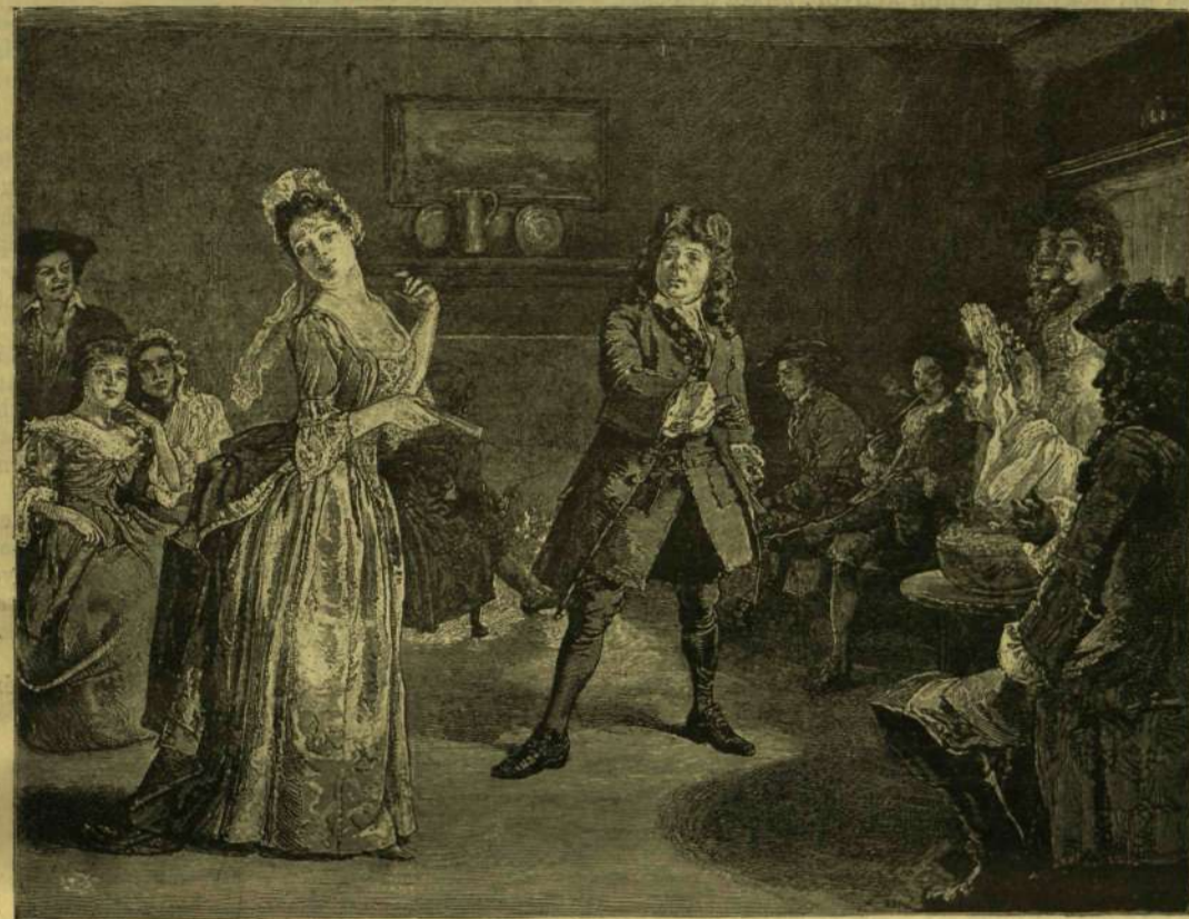
OLY MOZDULATOT TETT, MINT A KI KARDOT AKAR RÁNTANI.