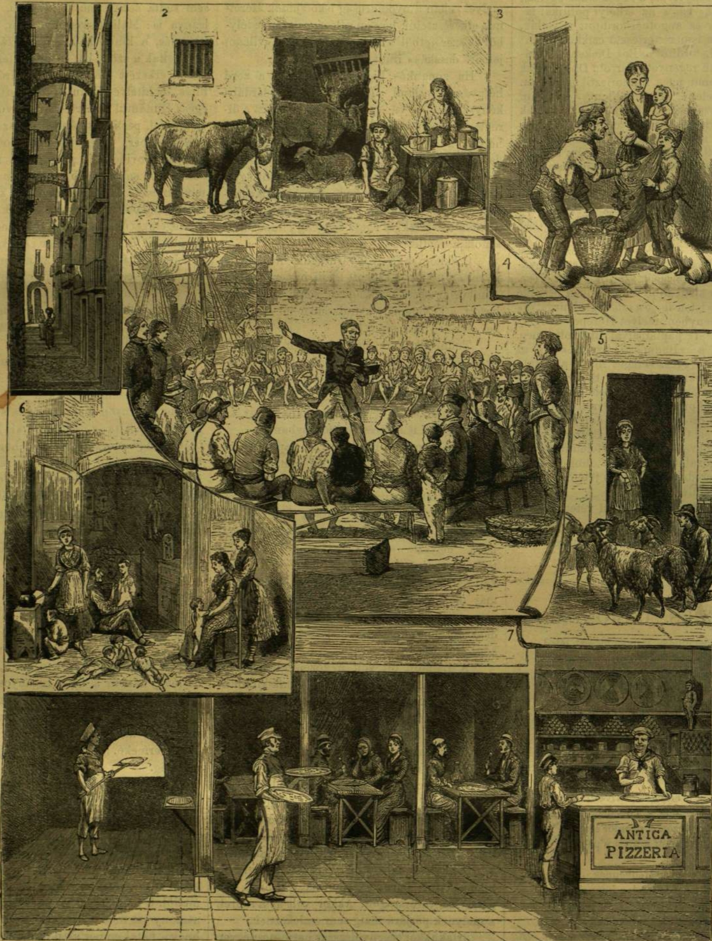
1. Kis utca a régi Nápolyban, a lazzaronik lakóhelye. 2. Tejes bódé és istálló. 3. Utczai gesztenyéárus. 4. Nyilvános regélő (cantatore) és hallgatói. 5. Kecsketej-árus. 6. Lazzaroni család otthon. 7. Pástétomárus boltja.

gek szórakoztatására kifundált! Derék ember! Jókedvű ember! mondta mindenki. De különösen fiskális Mérey András urának tetszett meg a fiatal ember, s ezt a tetszését nem is igyekezett titkolni senki előtt, sőt inkább majd minden perczben össze-vissza ölelgette Kosztolányi urat, fel-felköszöntve rá a poharát: