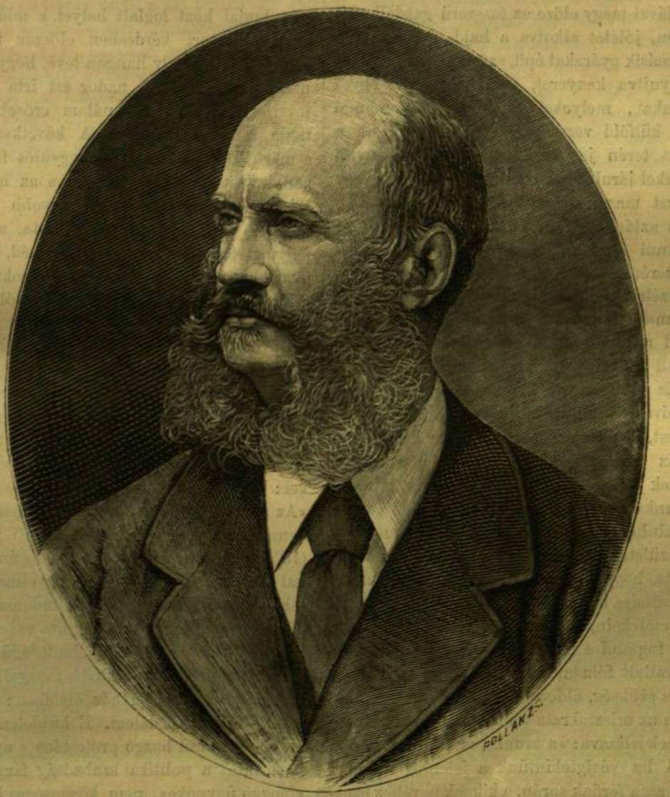
BÁRÓ PODMANICZKY FRIGYES.