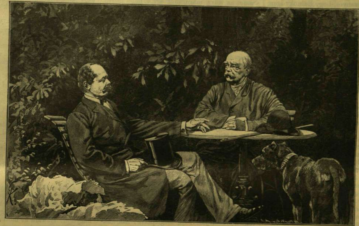
BISMARCK HERCZEG ÉS KÁLNOKY GRÓF TALÁLKOZÁSA.

A mi a három császár e hó 15—17-ke közti szkjernyeviczei találkozásának leginkább megadja politikai jellegét s azt a meggyőződést kelti, hogy az nem csupán a három uralkodó személyes baráti érzelmeinek kicserélésére szolgáló alkalom vala, hanem nagy fontosságú po-