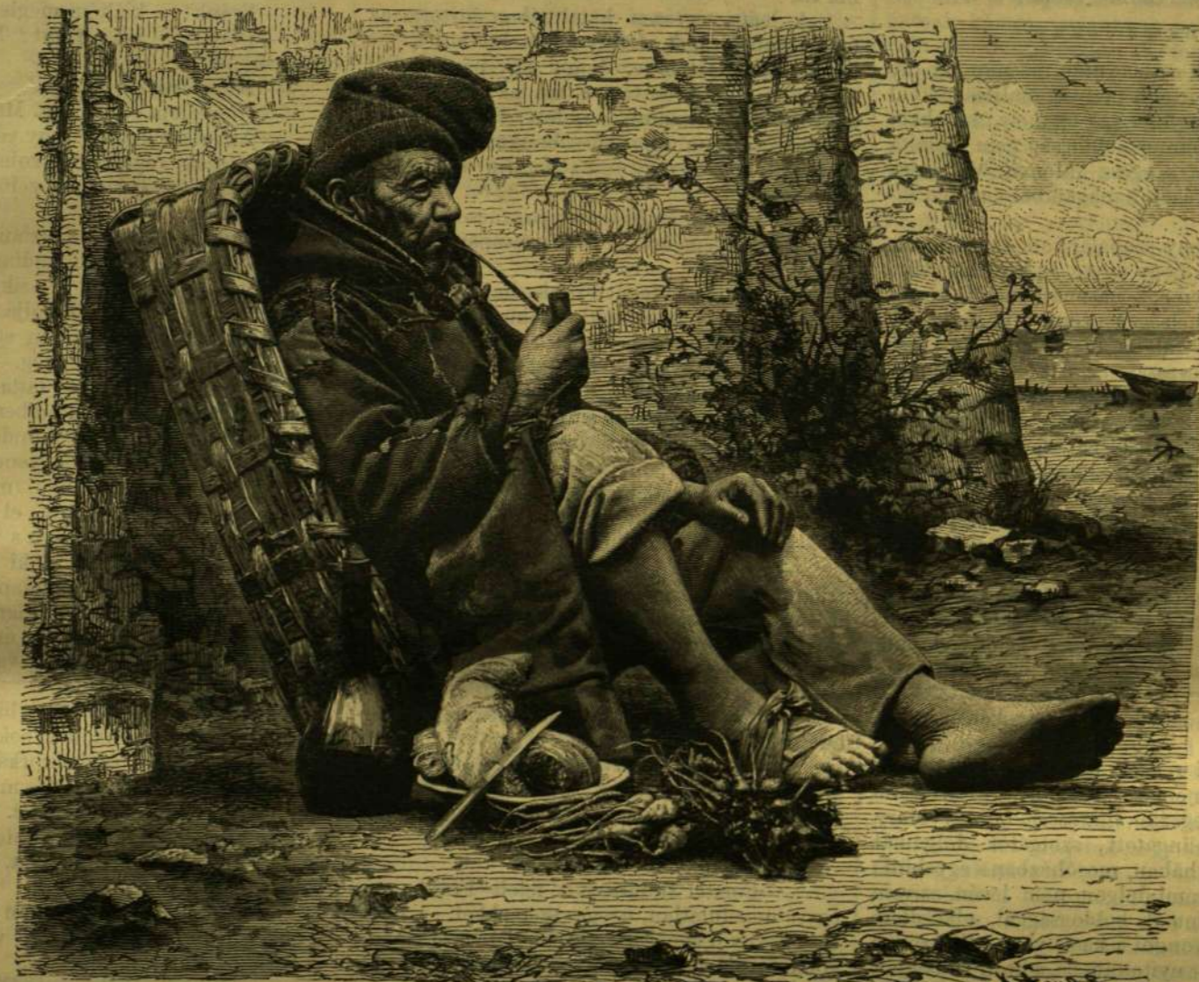
KÉPEK NÁPOLYBÓL. — LAZZARONI A NÁPOLYI TENGERPARTON.