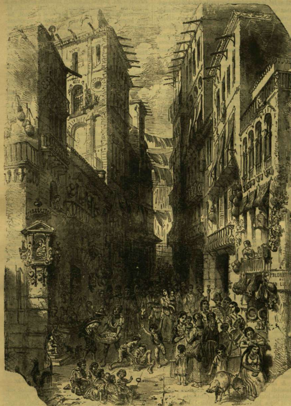
KÉPEK NÁPOLYBÓL. — SANTA LUCIA UTCA.

Megvan tehát a passzus, megvan a «pakkod». Főlmegy a pajtásokkal a legközelebbi csapszéke, megiszszátok a «Glück auf»-ot s másnap kora reggel — istenhozád Waratah! Údvöz-