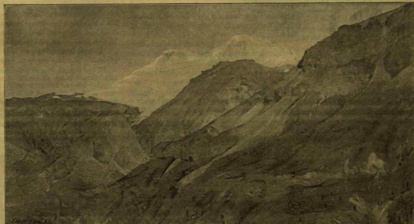
AZ ELBRUZ A BAKSAN VÖLGYBŐL. — DÉCHY MÓR FÉNYKÉPE UTÁN.

Déchy utazásából az is, a mit eddig ismerünk, igen érdekes, sőt az a tény, hogy a Kaukáz egyik legmagasabb és legmeredekebb csucsát az Adai-cochot először ő, egy magyar ember, mászta meg s több száz kilométernyi utat tett