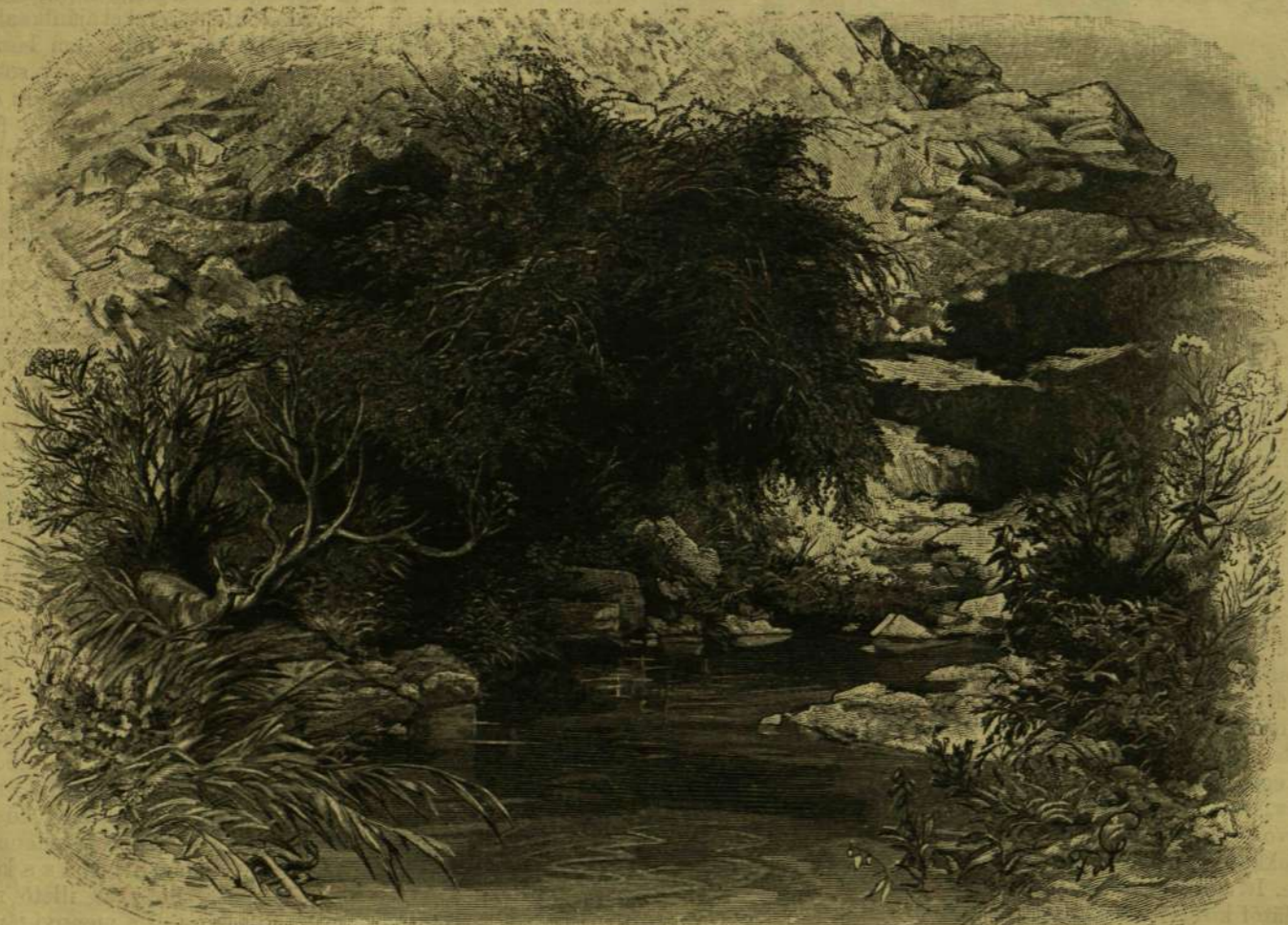
RUDOLF TRÓNÖRÖKÖS KELETTI UTAZÁSÁBÓL. — A JORDÁN FORRÁSAINÁL.

Mind ezt egy élő szemtanú, ki maga is részt