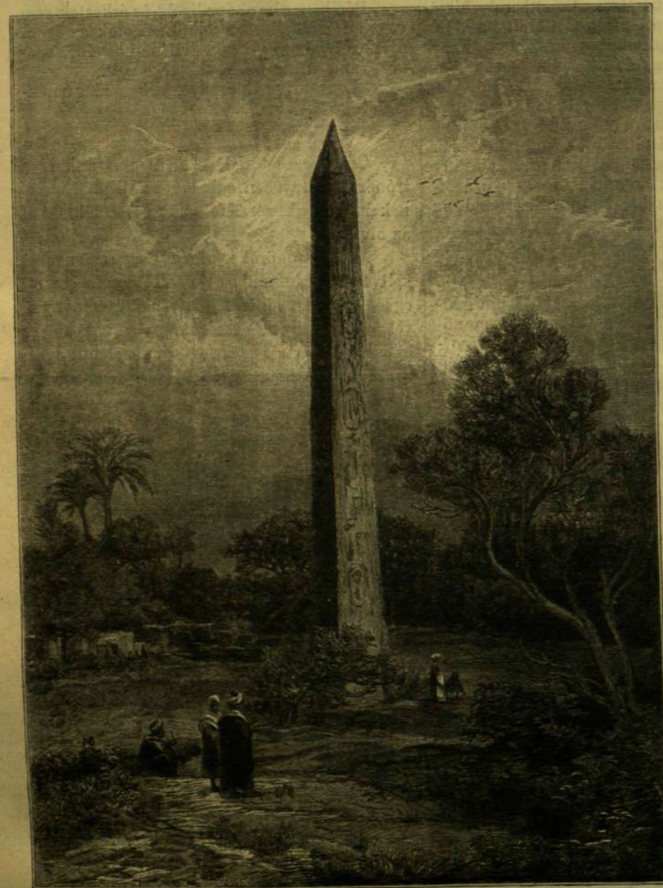
A HELIOPOLISZI OBELISZK.