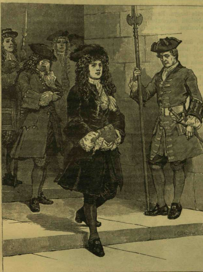
FEKETE BÁRSONY RUHÁBA VOLT ÖLTÖZVE.

Nem sokára hírül hozták, hogy a kocsi elkallottak, a kivégzendő két lord — ugymit lord Kenmore és Derwentwater — elszállítására. Mire Pippard úr fölkérte lord Widdringtont, hogy ha valami mondani valója van, végezze gyorsan s hagyja magára mylordot vele, mint gyónatatójával, utolsó beszélgetésére. Mire lord Widdrington elbucsuván szerencsétlen barátjától, eltávozott s az elítélte meg utolsó gyónását és imáit végezte, a mi megtörténvén, megindult utolsó útjára, bátran, egyenesen lépdelve a ráváró koci felé, úgy hogy még az örök, fog-