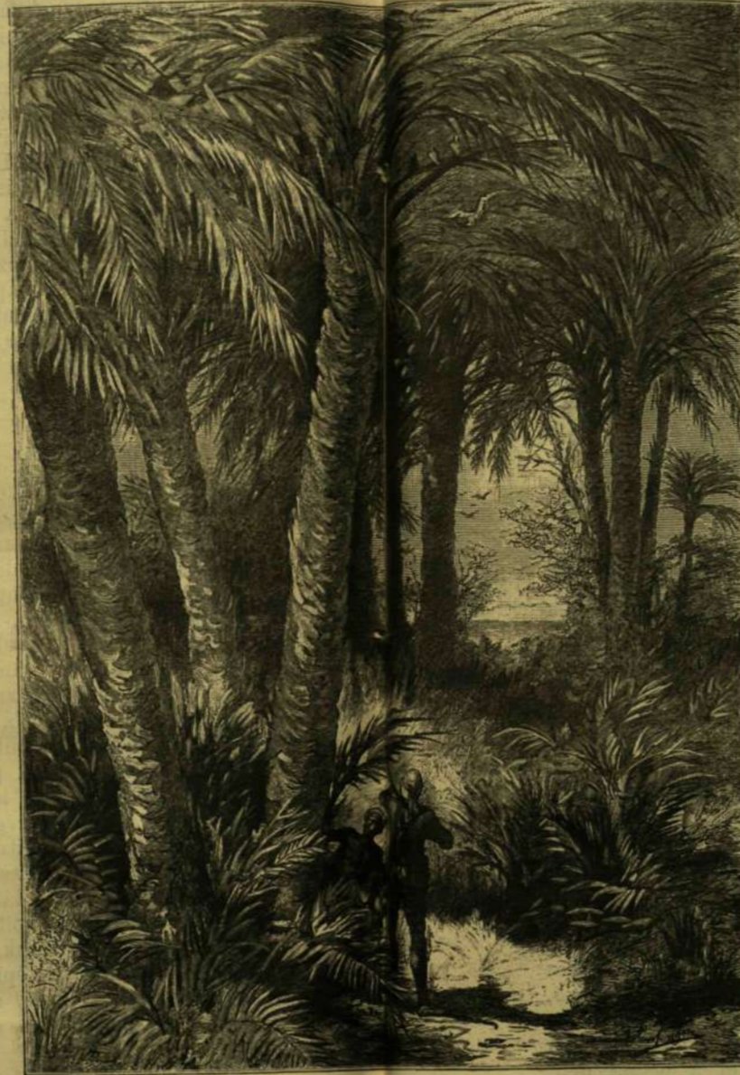
VADÁSZAT EGY PÁLMALENYEN KENEH MELLETT.