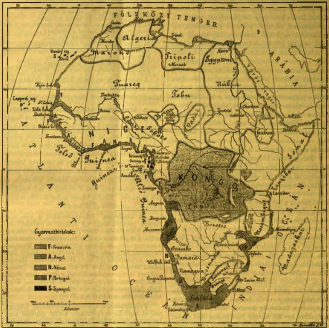
OSZTOZKODÁS AFRIKA PARTJAIN.

Az európaiak osztozkodási hajlamát korunkban több esemény mozdította elő. Legelőször a francziák tuniszi hadjárata, melynek következtében Tunisz ma már tényleg Franciaország hatósága alatt áll; az angolok hadjárata a zuluk s a máhdi ellen. Sokkal fontosabb volt Stanley törekvése, hogy a Kongót megnyitja az európai kereskedelem számára; e törekvés, melyet a belga király által alapított «nemzetközi afrikai társaság» pártfogolt, hozta létre a szabad Kongo államot, mely épen most van alakulóban, s már eddig igen tekintélyes számu — közel 50 — gyarmata van a Kongo torkolatától az egyenlítőig, sőt egy pár a közepafrikai tóvidékekig. Ez hozta létre továbbá a francziák terjeszkedését is különösen Brazza gróf vezetése alatt Közép-Afrikában s ez oly sikerrel történt, hogy ma már Afrika nyugoti partjának középrésze, melyet tíz évvel ezelőtt a szoros értelemben vett partvonalon kívül alig ismertek, európai birtoknak tekinthető. A leg-hatalmasabb ok volt azonban a németek beavatkozása, kik Dél-Afrikában Angra Pequena öböl környékén s a másik oldalon Santa Lucia öböl táján nagy területeket okkupáltak, az egyenlítőn