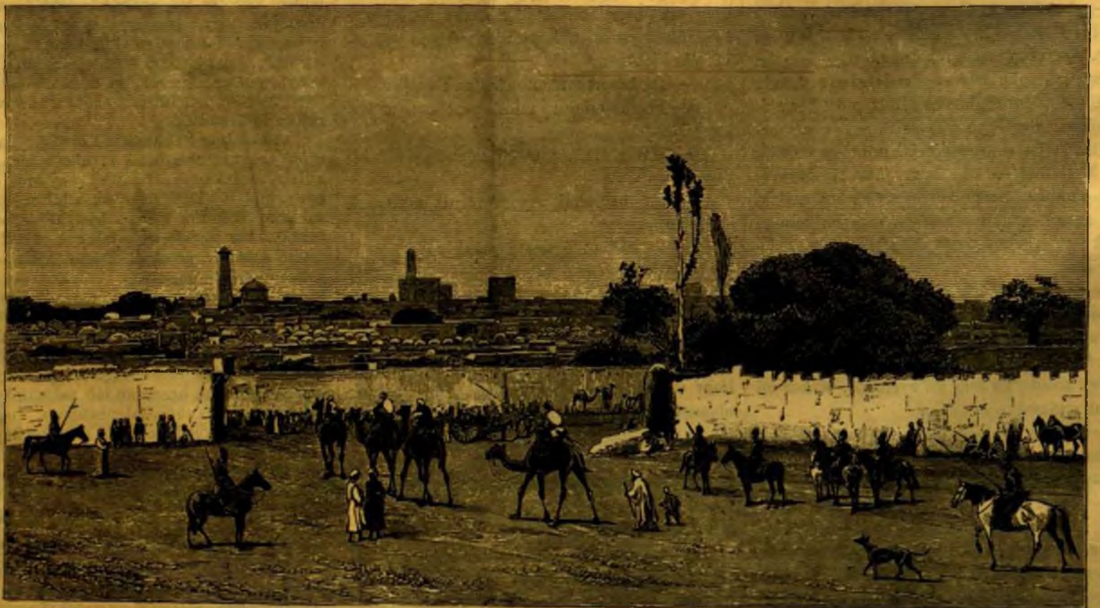
KHIVA A HAZARASP KAPU FELŐL.

Először is tehát azon kezdette meg reformját, hogy azon 80 nap különbséget kiegyenlített és a Krisztus előtti 46-dik évet, mely Róma építése 708-dik évének felelt meg, 80 nappal meghosszabbítani, tehát 445 napra tenni rendelte.