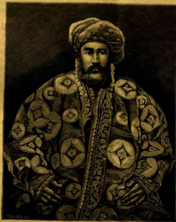
MUZAFFAREDDIN BOKHARA EMIRJE.

Khivát, a már Herodot által is említett khorazmok hazáját, keletről, északról és nyugatról az Amu-Darja és az Aral-tó, délről Perzsia és Afghaniisztán által határolt országot, a középkorban az özbékek foglalták el, kik ma is törészet teszik a 700 ezerre becsült lakosságának.