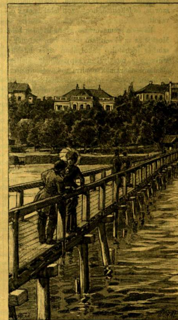
Nyaralója Balaton-Füreden. (Fénykép után.)

Hányat kellett a költőnek egymás mellétennie, míg ez a könyvtár így együvé