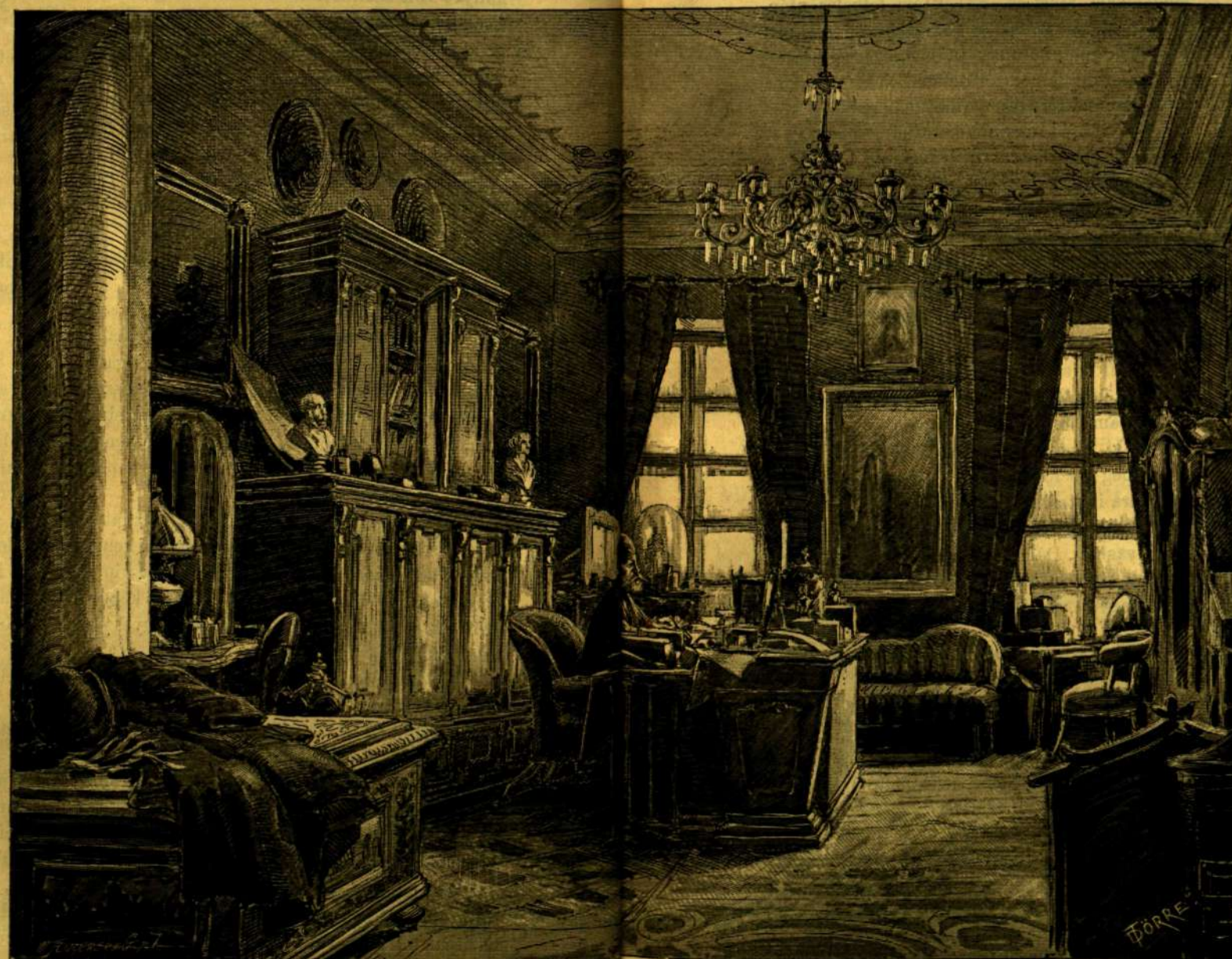
Dolgozó-szobája 1882-ben. (Dörre Tivadar rajza.)