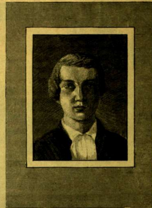
Jókai Mór 18 éves korából. (Saját egykoru olajfestményében.)

ték a homokvárakat. Reggel jókor már hitta őket.