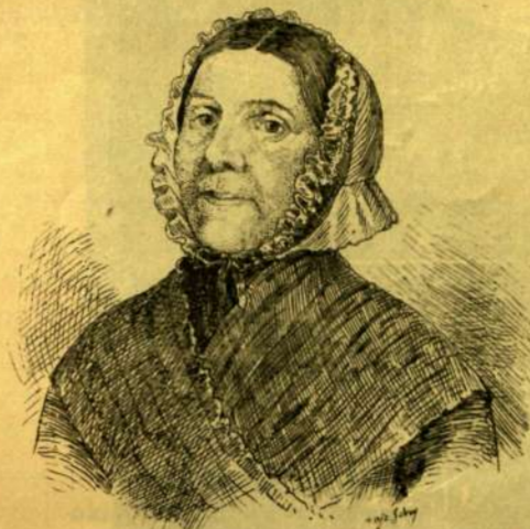
Jókai Mór édes anyja. (Jókai M. olajfestménye után 1843-ból.)