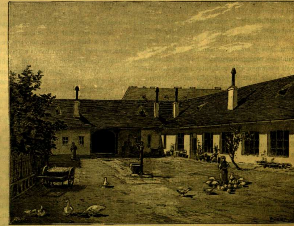
Stáció-utcai házának udvara 1882-ből. (Fénykép után.)