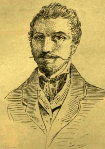
Jókai Mór 24 éves korából. (Saját egykoru rajza után.)

Móríz is szeretett ott játszogatni a hús vadgesztenyefák alatt a térs udvaron. Voltak ott a juhásznak több gyermekei, — persze tótok, — a kikkel Mórízka magyarul beszélt és építet-