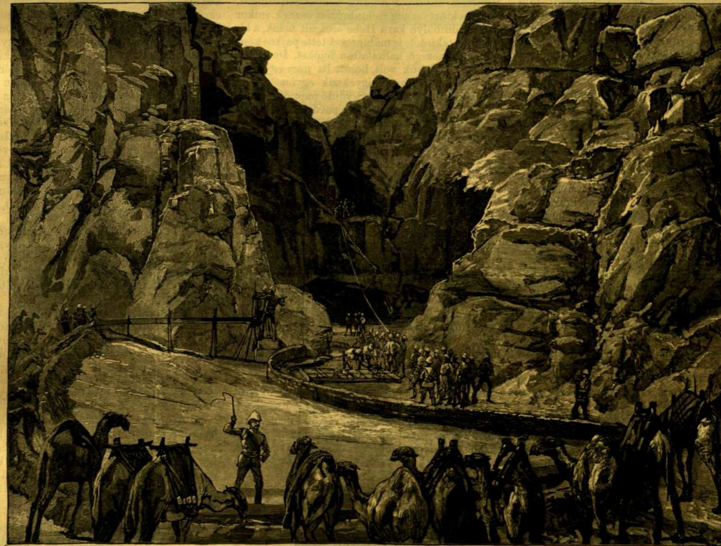
AZ ANGOLOK SZUDÁNBAN. — AZ ABU-HALFAI FORRÁSOKNÁL.

Lehulltak már az utolsó ácsolt burkolatok, melyek alatt a sugárut kiépítési munkája folyt, s impozáns pompája egész díszében emelkedik ki a főváros legujabb, legnagyobb szerű alkotása. Ott terül el a hatalmas ut, mint egy igéző kilővöllő sugár a magyar főváros tündöklő koronájából; hosszú lámpasora belehasít fényével a városligt elhagyatott fájnak homályába s tarka képek változata izgatja és köti le szünetlenül a figyelmet. Merész ellentétek, a minőket csak az élet bír kigondolni, árny és fény, nyomor és