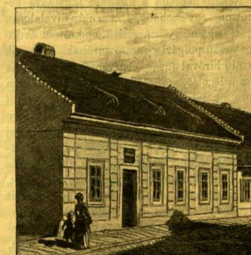
Gyermekkorai lakháza, Komáromban, az emléktáblával (mostani fénykép után).

Egy másik üveg-szekrényben vannak a különböző alkalmakkor kapott emléktárgyak: aranytollak, billikomok, ezüst koszorúk, disz-