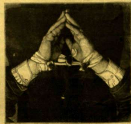
Az összekötött kezek.