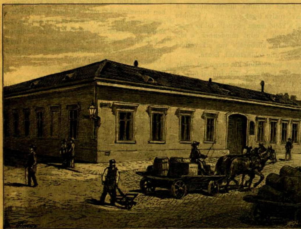
Stáció-utcai háza 1882-ből. (Fénykép után.)

Csak elolvasni is nagy föladat, a mit Jókai életében összeirt. Azt hiszem, nem egy napra néző erős szem gyengülne meg bele. Pedig Jókai nem csak hogy maga írta mindezeket, — diktálni soha nem szokott — hanem könyvalakban megjelent minden művét maga nézte át, maga