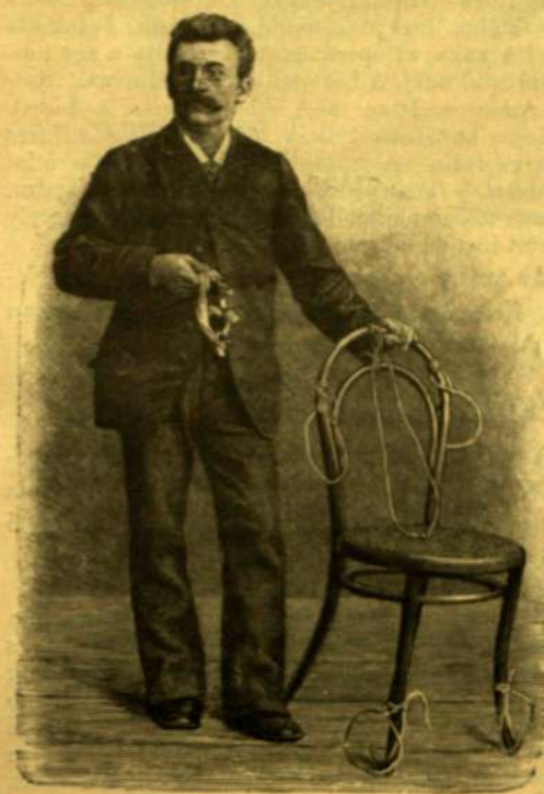
Bellini kötelekeit föloldva.

Az Encke üstökös tehát, inkább mint bármily más égi test, tanúsítást nyújt nekünk az égi testek fejlődési törvényeiről s kimutatja a jövőt, mely egykor bolygó-rendszerünk s ma-