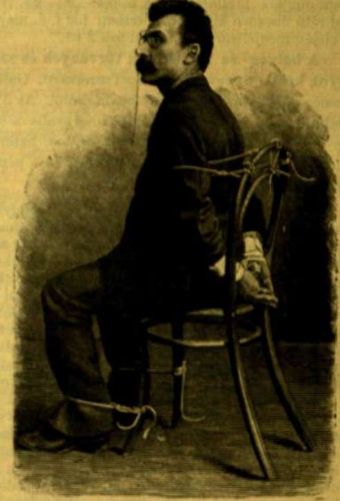
Bellini a székhöz kötözve.

gát az anyaföldet érheti. Elpusztulunk, mert ez végeztünk. A vigasz csak abban áll, hogy e végezet nem egyhamar következik be.