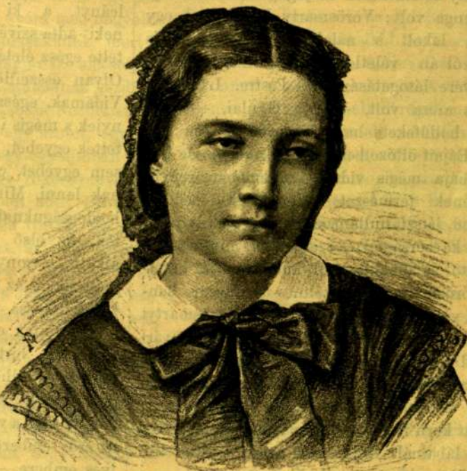
PETŐFINÉ SZENDREY JULIA.