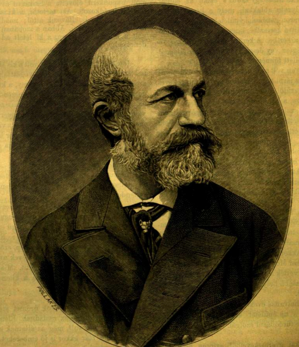
JÓKAI MÓR.

A „Vasárnapi Ujság“, melynek megalapításakor és megindulása első éveiben Pákh Albert mellett Jókai Mór volt a főszozlopa, segédszerkesztője és főmunkatársa, azzal akarja megünnepelni e nap emlékét, hogy fölelevenit egyes részleteket, melyek a nagy író élete pályájára tartoznak vagy a melyeknek az kölcsönöz érdekét, hogy összefüggnek vele. Jókai Mór gyermekéveire vonatkozólag most is az a legbővebb és leghitelesebb forrás, melyeket testvérnénje, Vályi-Jókai Eszter tett közzé a hatvanas évek közepén egy rendkívül vonzóan írott, közvetlenségével és melegségével a Jókai Mór irányára emlékeztető cikksorozatban.