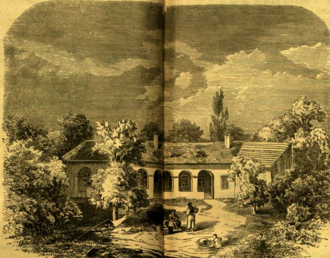
Születési háza Komáromban, 1825-ben.

Dolgozó-szobája butorai mind becses antikdolgok: csavart lábu asztalok, arany- és gyöngyház-beraka-