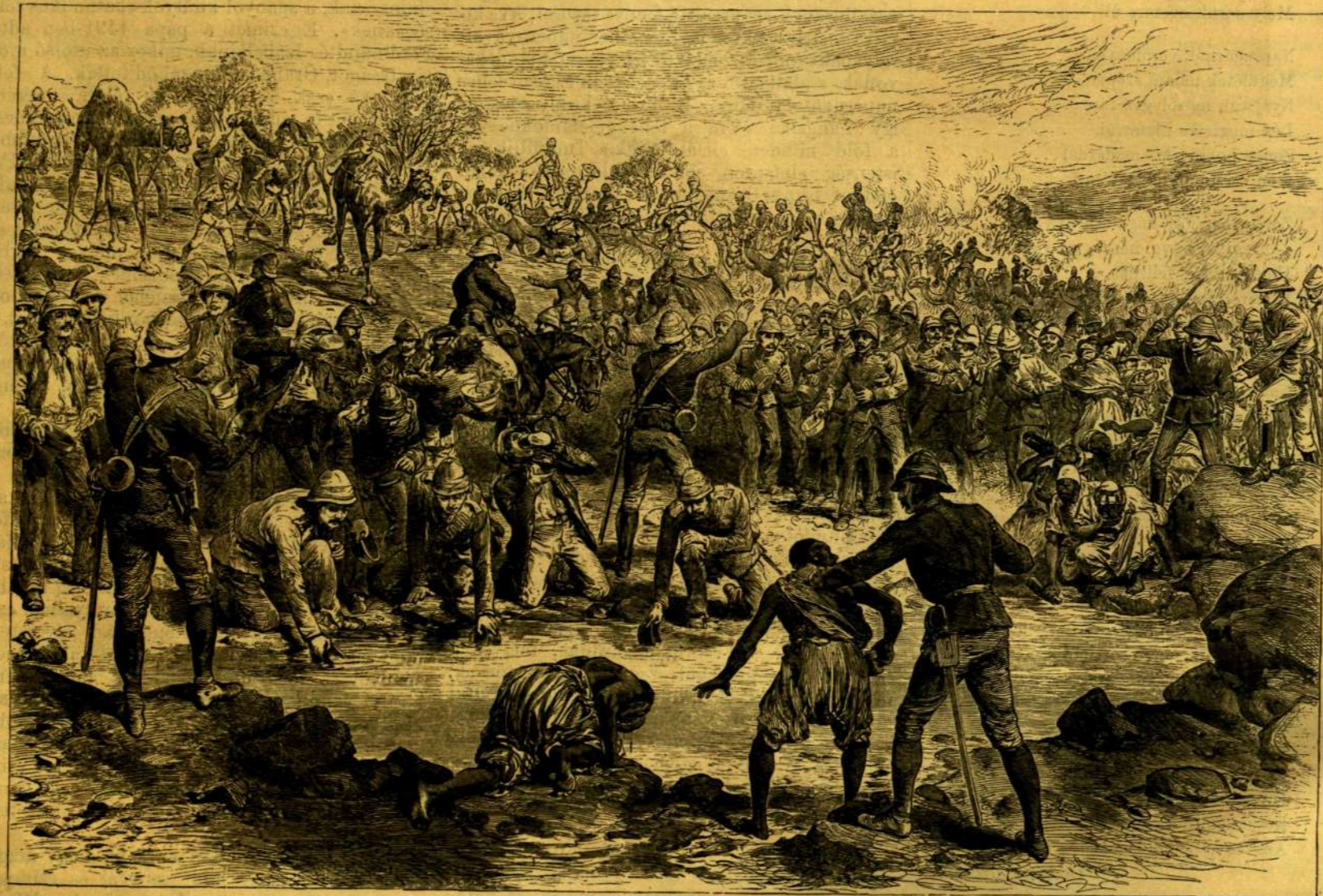
AZ ANGOLOK SZUDÁNBAN. — AZ ABU-HALFAI FORRÁSOKNÁL.

Nemcsak szellemében, de nyelvében is legdemokratább e tekintetben a francia, s mondat-szerkezetében találozón fedi föl az oly bürokratikus kitételek neveléséges oldalait, a milyenek