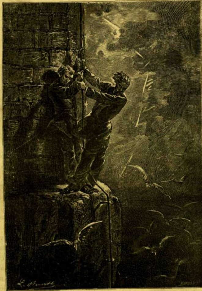
ÓRIÁSI VILLÁM HASITOTTA ÁT A LEVEGŐT...