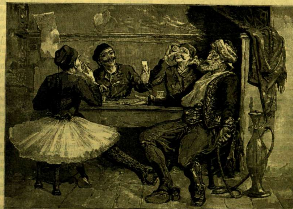
GÖRÖG KÁVÉHÁZ PIRAEUSEAN.