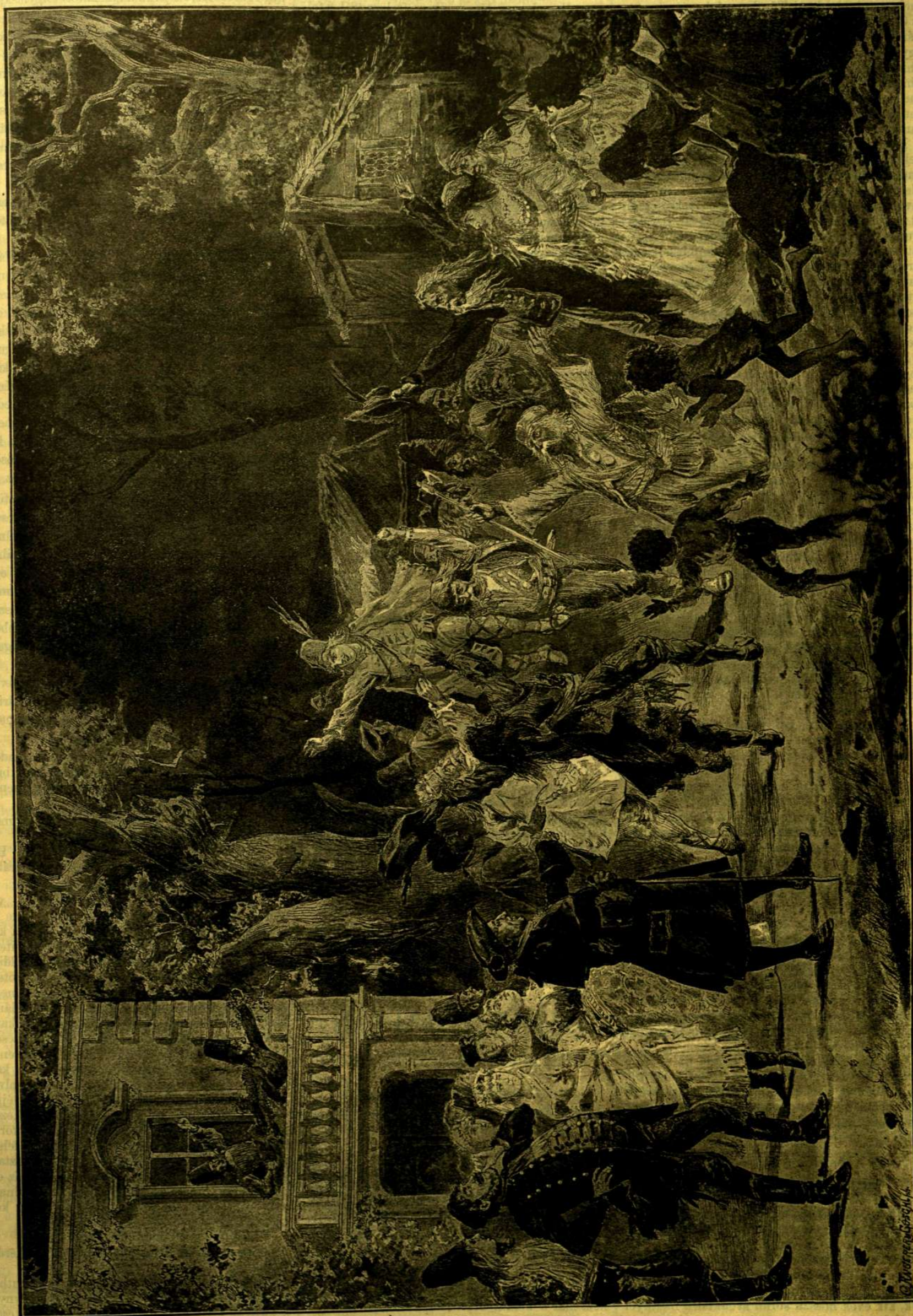
JELENET A 'CZIGÁNY BÁRÓ'-BÓL.