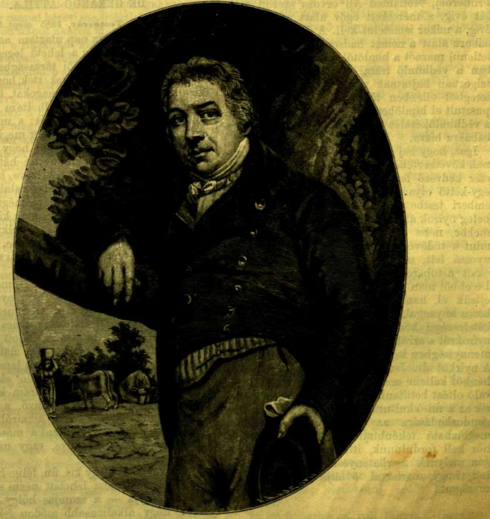
Dr. JENNER EDUÁRD.

iskolatanító már 1791-ben gyermekeket oltott be a tehénhimlő nyirkával. Mi az oka mégis, hogy a mivelődés története e nagyfotosságú vivmány dicsőségét a Jenner nevéhez csatolja? A Jenner fölfedezése nem szorított csupán az oltás tényére magára, de az ahhoz kötött ellenpróbát is felölelte. Csak midőn a kis Jemest a vaccinatio után még kétszer beoltotta emberhimlő-nyirokkal, s az újabb beoltás teljesen fogatlan maradt: akkor tűnt ki elfogadható bizonyossággal, hogy a gyermek teste az emberhimlő iránti fogékonyságát valóban elvesztette. Dr. Jenner ettől kezdve egyre gyűjtötte az újabb bizonyítékokat s csak 1798-ban lépett fölfedezésével a nyilvánosság elé s gazdag tapasztalatokon és észleteken alapuló munkáját kiadván, eddig hallatlan lelkesedésre munkáta