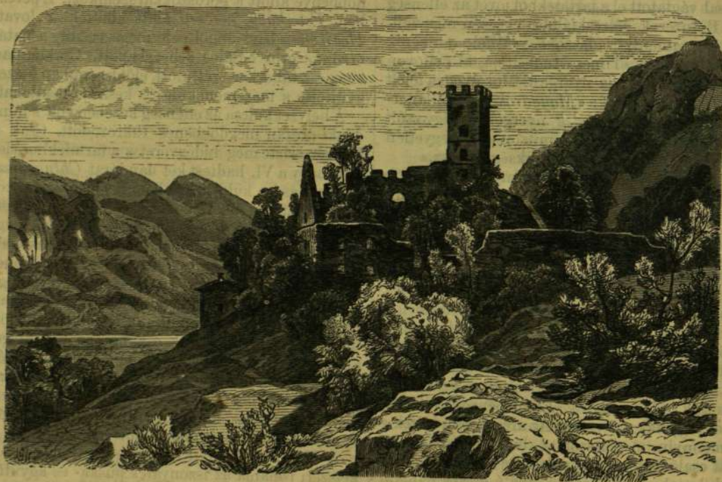
FALKENSTEIN VÁRA AZ INNVÖLGYBEN.