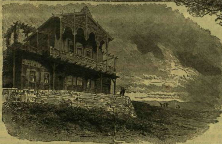
A SCHACHENI KIRÁLYLAK.