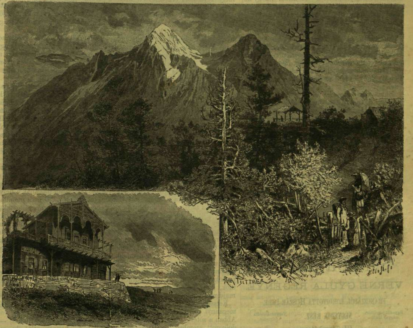
KILÁTÁS AZ ALPSPIZT ÉS HOCHBLASSENRE.