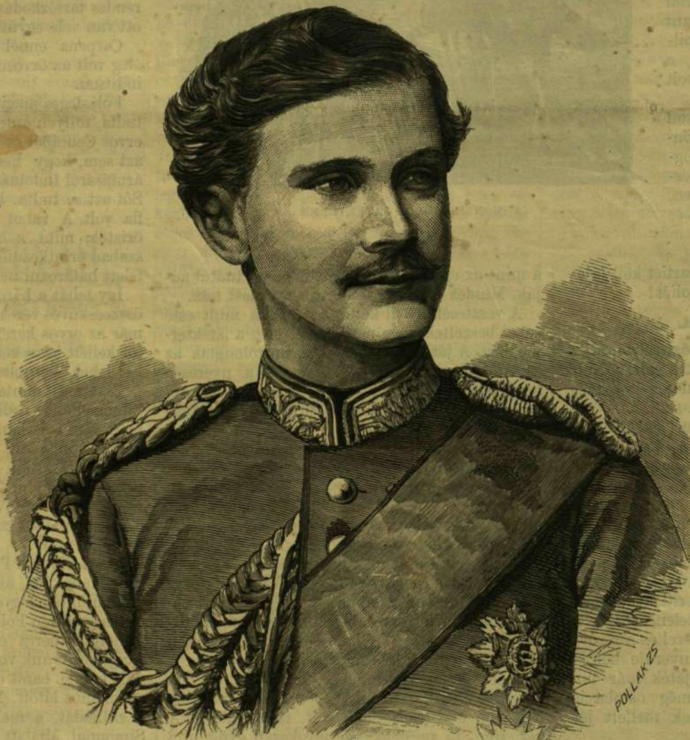
I. OTTÓ, AZ ÚJ BAJOR KIRÁLYA.

De a háború után csakhamar előtörték rajta az elmeháborodottság jelei, melyek elkerülhetlenné tették, hogy orvosi felügyelet alá helyeztessék. Betegsége első korszakában nagy kímélettel bántak vele s tán még több szabadságot engedtek neki, mint a mennyivel annak előtte birt. Így történt meg, hogy a herceg 1875-ben a müncheni Boldogasszony templomában egy-