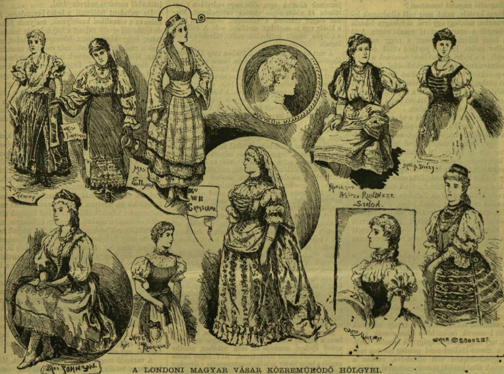
A LONDONI MAGYAR VÁSÁR KÖZREMŰKÖDŐ HÖLGYEI.

* A tubákoló ember egy Stanhope nevű angol számitása szerint szenvedélye kielégítésére évenként 36 1 / 2 napot kénytelen fordítani, mivel átlag másfél percet vesz igénybe minden szippantás.