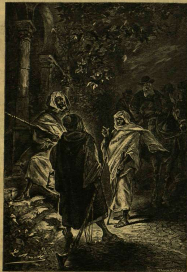
MIUTÁN NEHÁNY SZÓT VÁLTOTTAK.