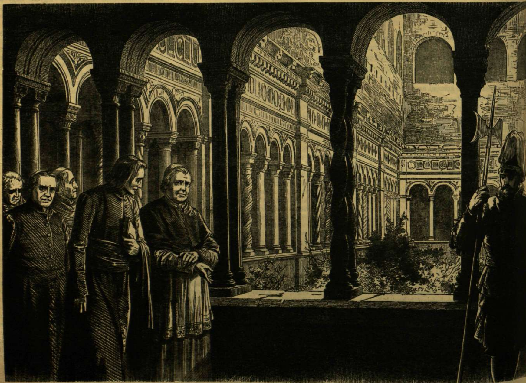
LISZT FERENCZ, IX. PIUS PÁPA ÉS ANTONELLI BIBOROK TÁRSASÁGÁBAN, A LATERAN-TEPLOM OSZLOPCSARNOKÁBAN.