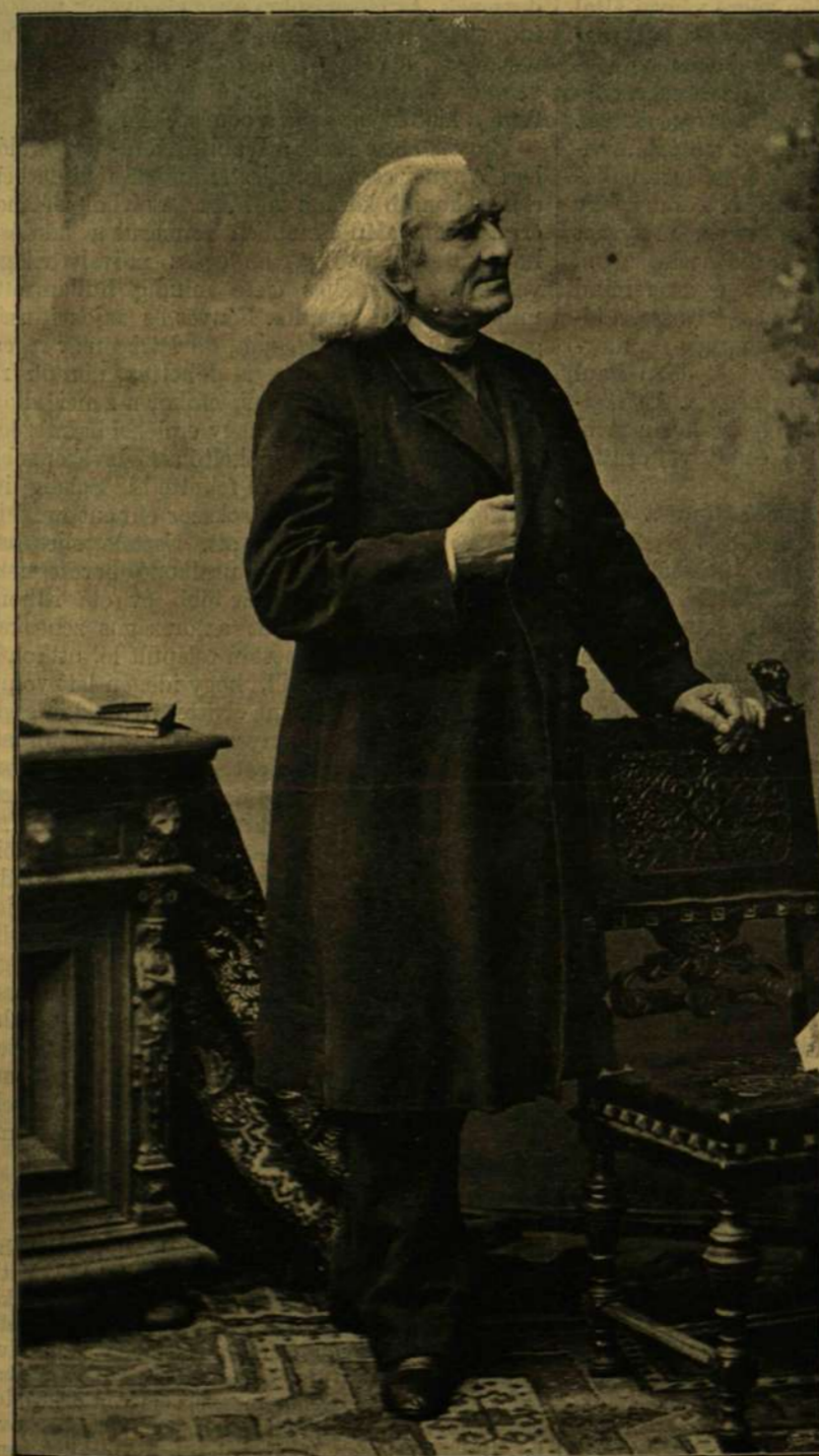
LISZT FERENCZ.

* Dél-Kaliforniában Ventura mellett gazdag petróleum forrást fedeztek fel, mely naponként 50 tonna petróleumot ad.