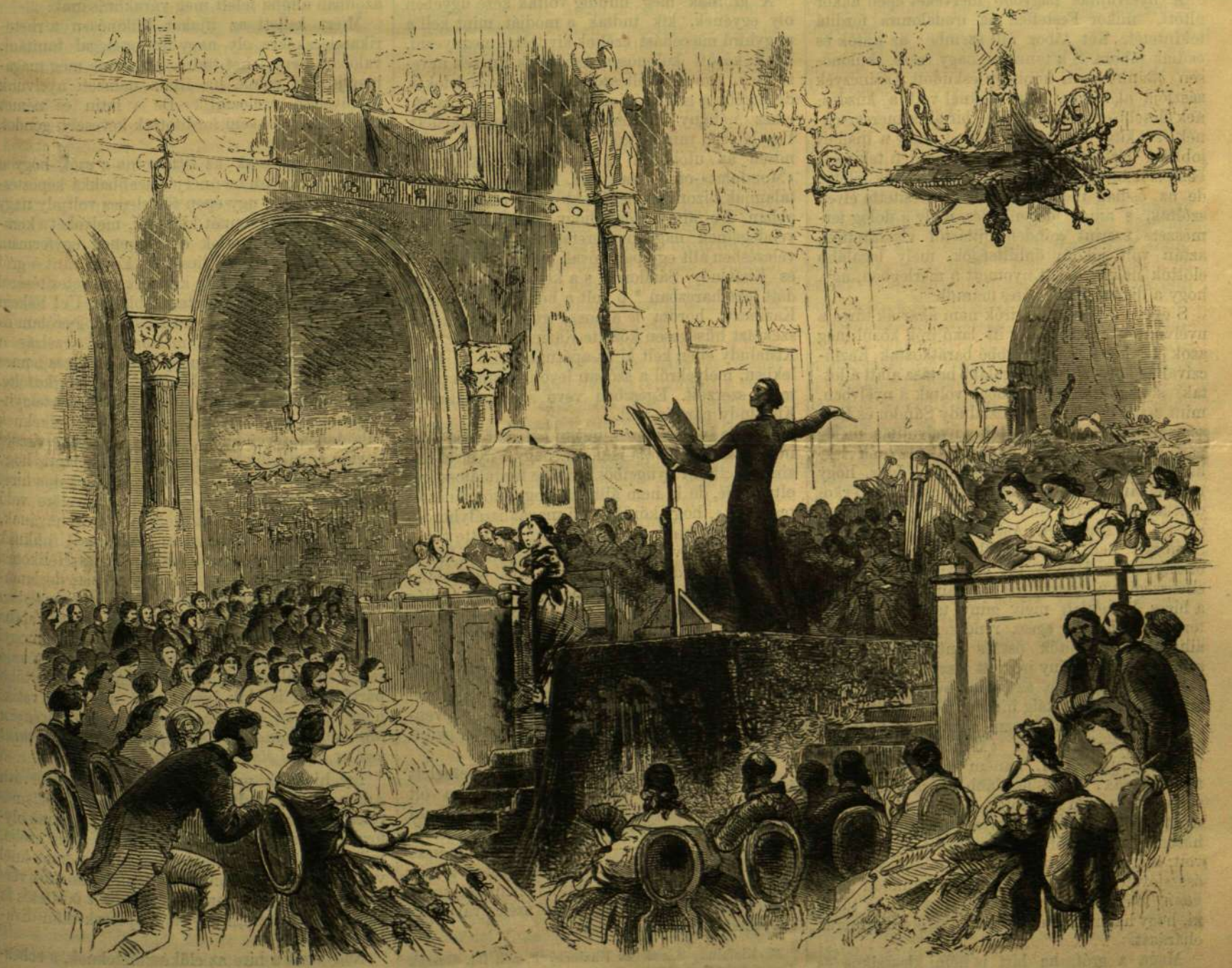
LISZT FERENCZ «SZENT ERZSÉBET» ORATORIUMÁNAK ELSŐ ELŐADÁSA A BUDAPETI REDOUT-TEREMBEN 1865. AUG. 15-ÉN. Székely Bertalan rajza.