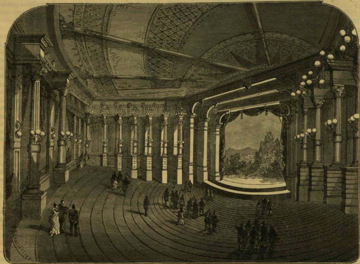
A BAYREUTHI SZINHÁZ BELSEJE.