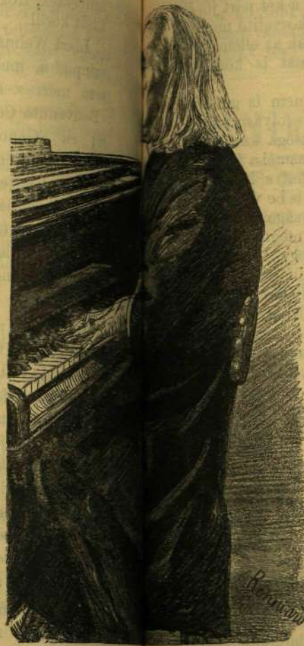
LISZT FERENC (1886.)