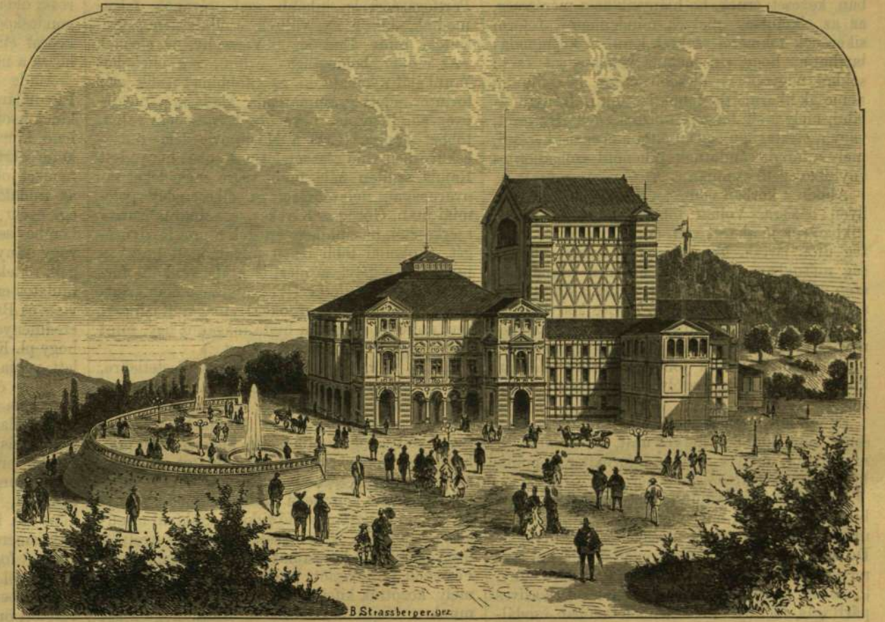
A WAGNER-SZINHÁZ BAYREUTHBAN.