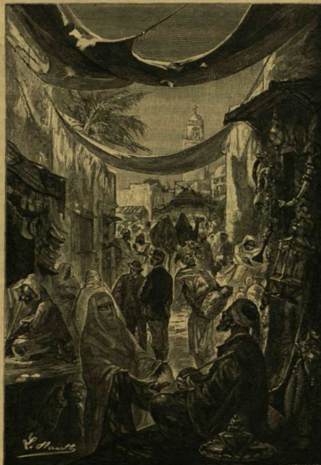
E TARKA NÉPSÉG KÖZEPETTE ...