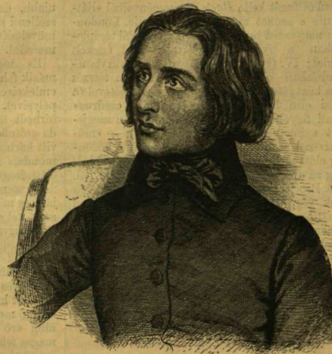
LISZT FERENCZ. — 1838-IKI METSZET UTÁN.