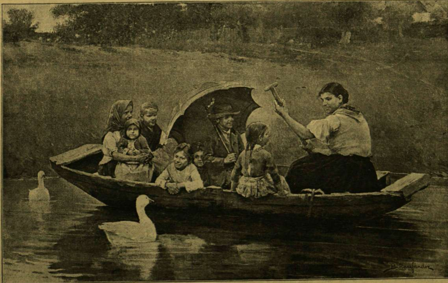
KÉPJUTAZÁS A ZAGYÁN. Bihari Sándor festménye.