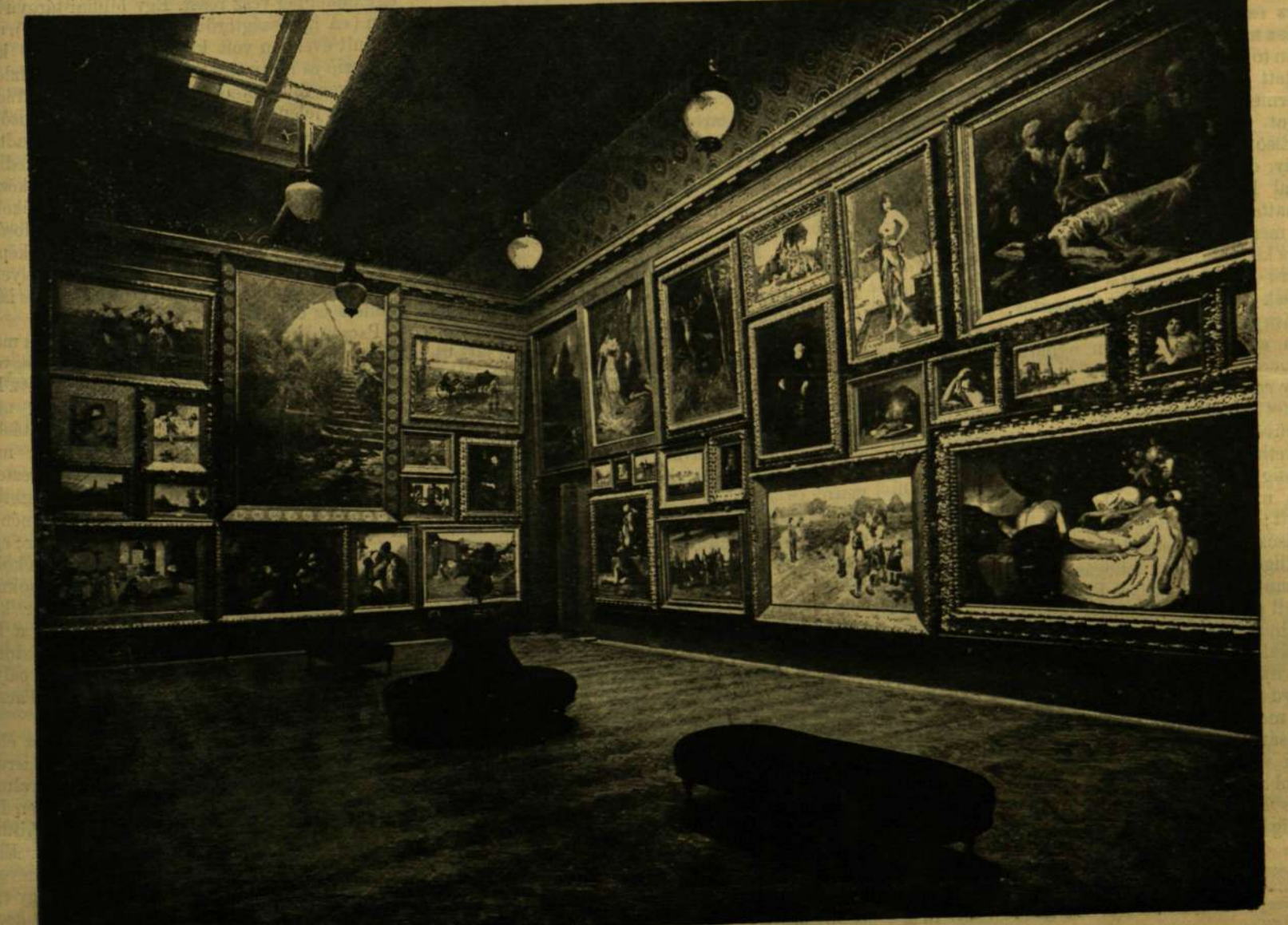
A KÉPZŐMŰVÉSZETI TÁRSULAT JUBILÁRIS KIÁLLITÁSA. — A MŰCSARNOK NAGY TERMÉNEK ÉSZAKNYUGATI OLDALA.

hogy ha komolyabb tanulmányokhoz akarnak fogni, külföldön keressék azokat. Itthon nem volt se iskola, se művészi élet. Még az elemibb ismeretekre is vajmi kevés alkalom és mód. Meglett művészeink egészen másképp elfoglalták, hogysem tanítványok is igénybe vehessék őket. Ma már fejlődik a művészi élet, a képzőművészetek művelőinek egy kis gyarmata keletkezett és Benczur mester-iskolája, Lotz Károly műterme, az országos minta-rajztanoda tényezők a művészi élet itthoni gyarmatában. Művészeink mellett tanítványokat is sürűben találunk. München művészi tradíciói, festészeti akadémiajának jeles tanárai nevezetes szerepet visznek hazai festészetünk történetében. Bécsnek