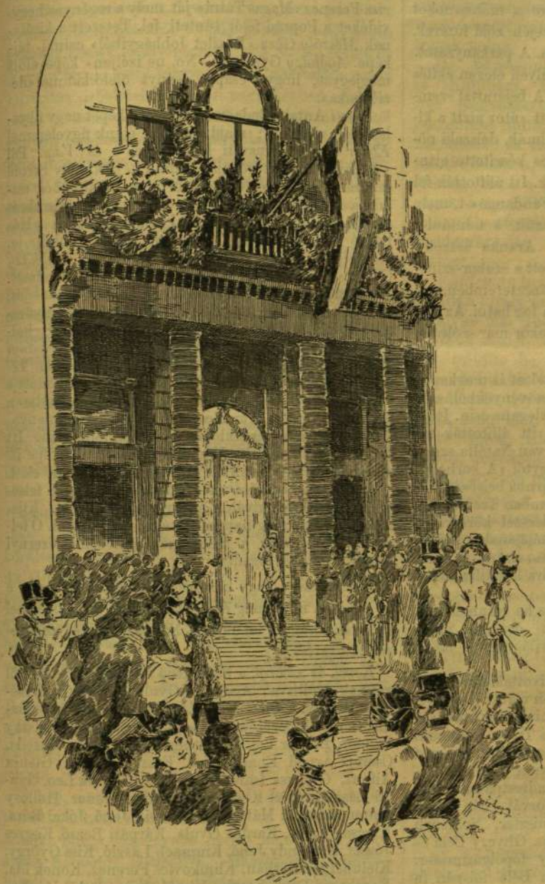
A KIRÁLY MEGÉRKEZÉSE A MÜCSARNOKHOZ. Goró Lajos rajza.