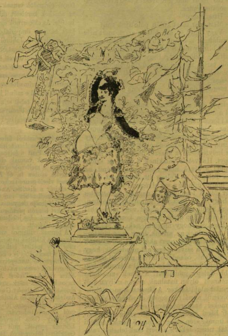
FANDANGO. Strobl szoborműve. Hány Gyula rajza.