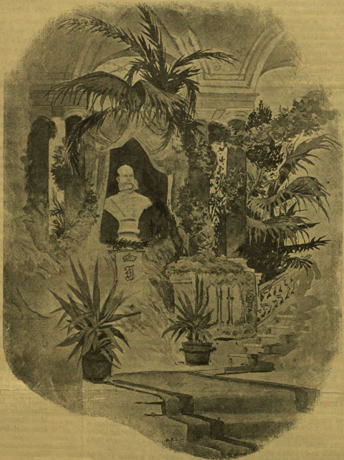
AZ ORSZÁGOS KÉPZŐMŰVÉSZETI TÁRSULAT JUBILÁRIS KIÁLLÍTÁSA. A KIRÁLY MELLSZOBRA STROBLTÓL AZ ELŐCSARNOKBAN.