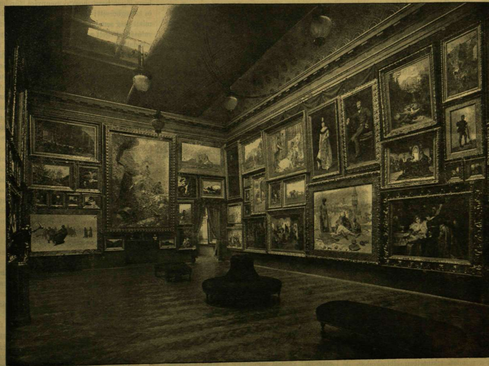
AZ ORSZÁGOS KÉPZŐMŰVÉSZETI TÁRSULAT JUBILÁRIS KIÁLLÍTÁSA. — A MŰCSARNOK NAGY TERME.

«Főtisztjeink valóságos ellenszenvvel fogadták a Magyarország elleni expedíció híret, mert minden erőlködés dacára, mely osztrák részről ki lön fejtve az iránt, hogy az egész mozgalom a világ előtt leginkább republikánus irányu lá-