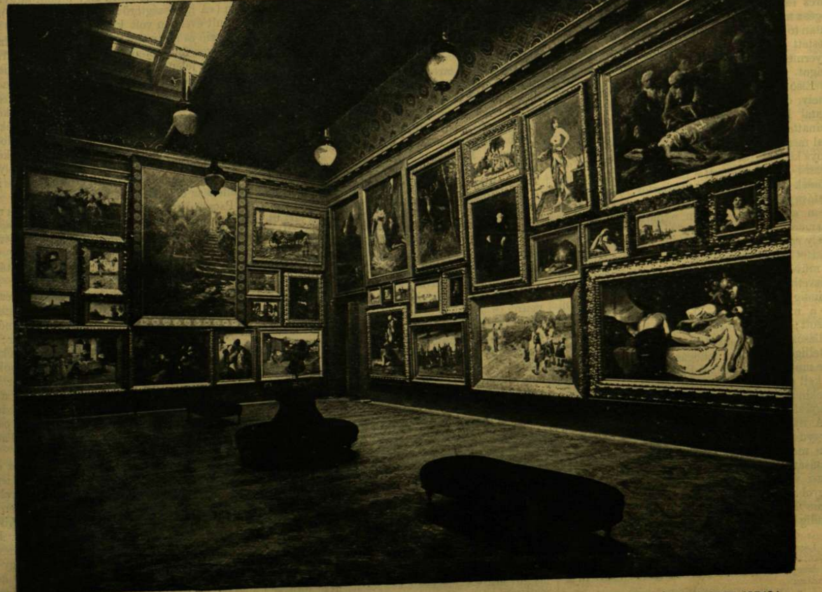
A KÉPZŐMŰVÉSZETI TÁRSULAT JUBILÁRIS KIÁLLITÁSA. — A MŰCSARNOK NAGY TERMÉNEK ÉSZAKNYUGATI OLDALA.