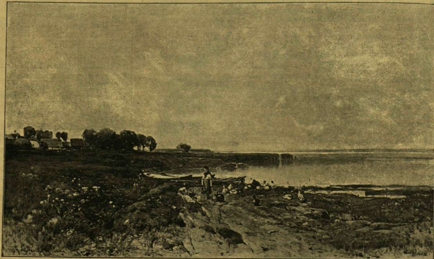
A BALATON SZÁNTÓDNÁL. — Mészöly Géza festménye.