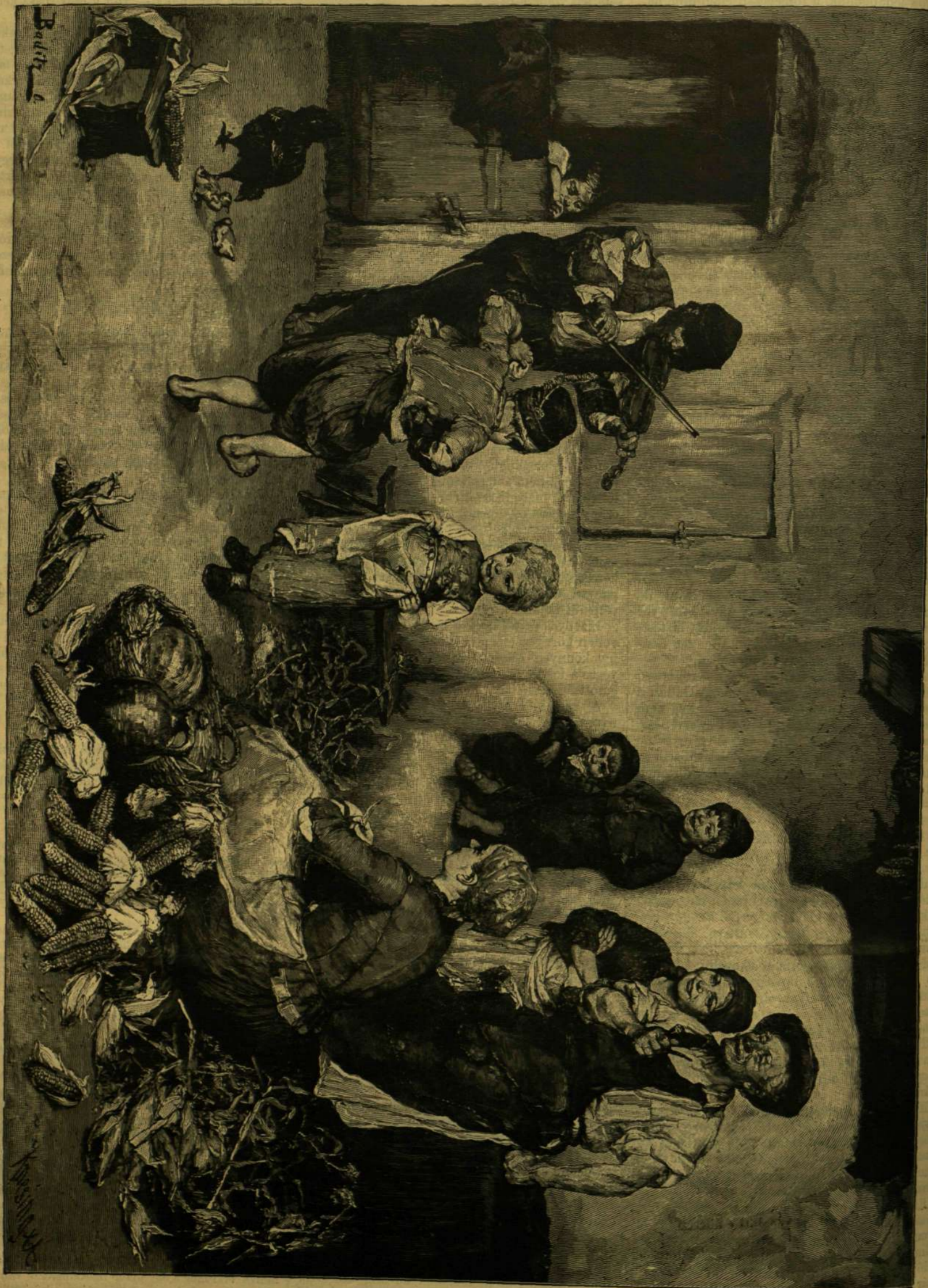
A KÉPZŐMŰVÉSZETI TÁRSULAT JUBILÁRIS KIÁLLÍTÁSA. — AZ ELSŐ CSARDA. Baditz Ottó festménye.