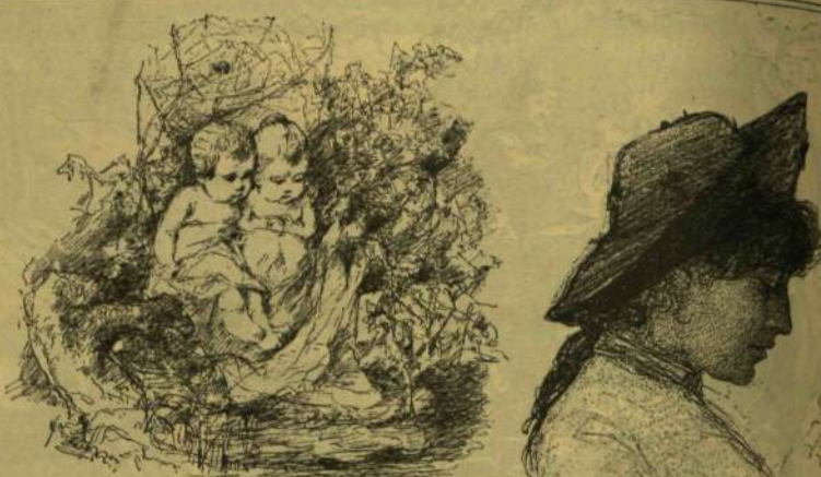
Baditz könyv-illusztrációiból: Gyermekek.