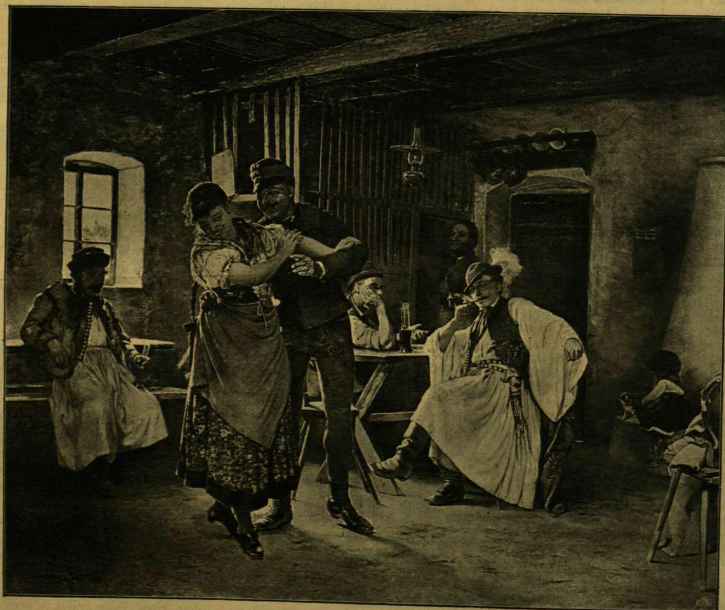
«NO NE IZÉLJEN!» — Aggházy Gyula festménye.

Felmentem tehát a kaszinóba, a hol minden ismerősömet együtt találtam; szörnyen örültek