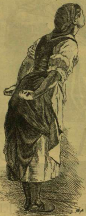
„A dagasztó menyecske”, Aggházy Gyulától.

A nyáron a berlini kiállításán egy magyar tárgyú életképet halmozott el dícsérettel. Ez van most bemutatva a műcsarnok jubiláris kiállításán is s jeles fiatal festőnket egészen a derült falusi világban mutatja be. Baditz tárgyainak nagyobb részét a magyar népeletről veszi. Műterme Münchenben van, de az év egy részét mindig itthon tölti. Körülbelül tíz év esik életé-