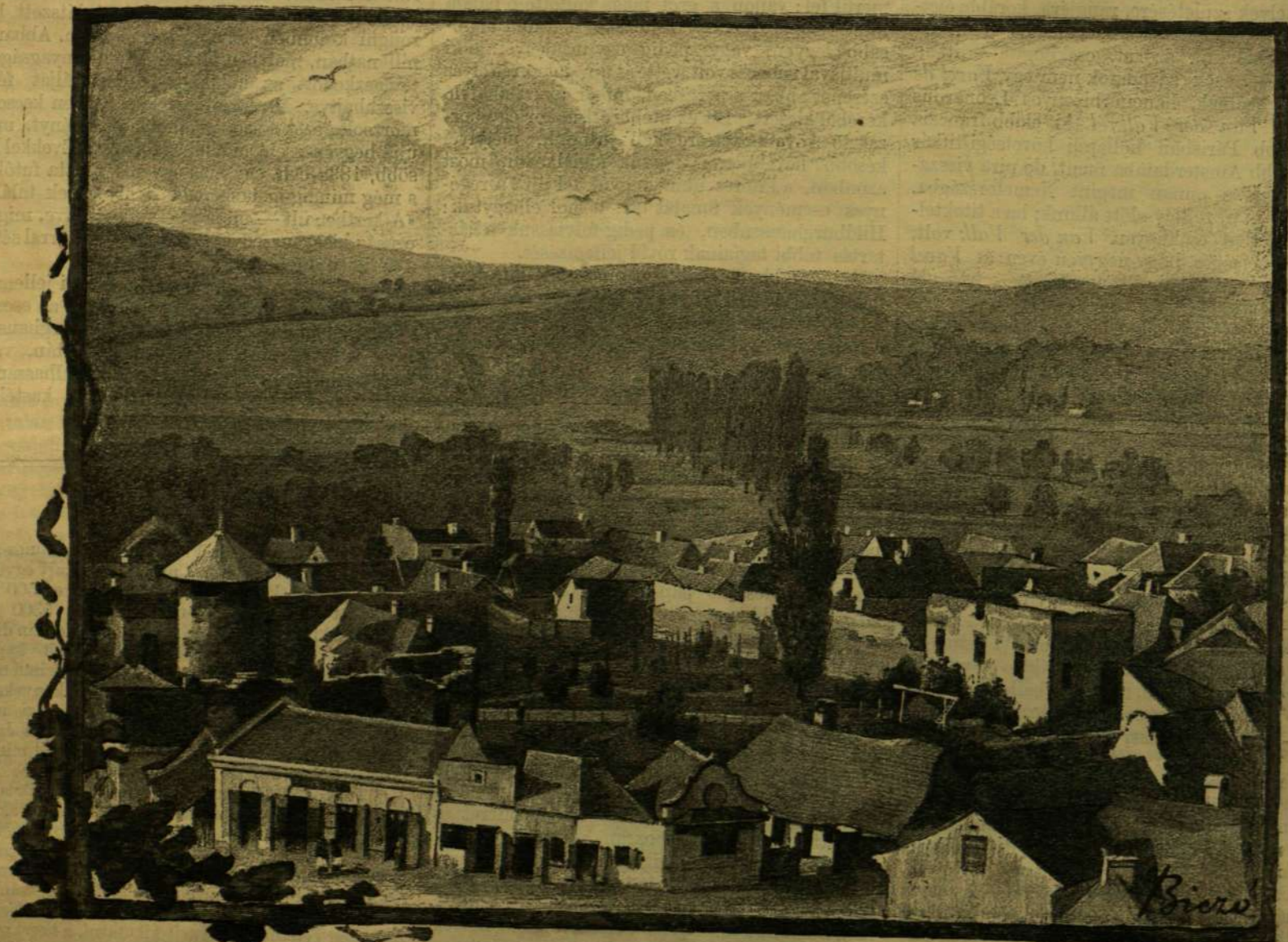
A BÁTHORY-KASTÉLY UDVARA SZILÁGY-SOMLYÓN. Fénykép után rajzolta Biczó Géza.