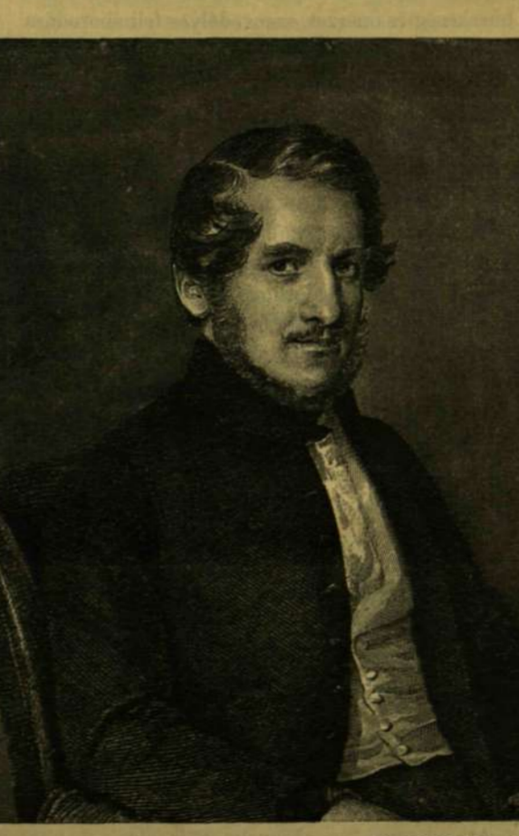
BAJZA JÓZSEF. Barabás Miklós rajza.

Nemzeti életünk egész körére kiterjedő, nagy átalakulásnak, valódi ujászületésnek kora volt ez, melynek törekvései és eredményei állami és miveltégi fejlődésünknek legfontosabb tényezőivé lettek. A tespedés és fásultság álmokorságából ébredező nemzet az 1825-iki országgyűlésen látta legelőször pirkadni az új korszak hajnalát. Ez az országgyűlés nyitotta meg a nagy reform-korszakot, mely rohamos erővel terjedett elmaradt nemzetünket a nyugoti művelődés színvonalára emelni.