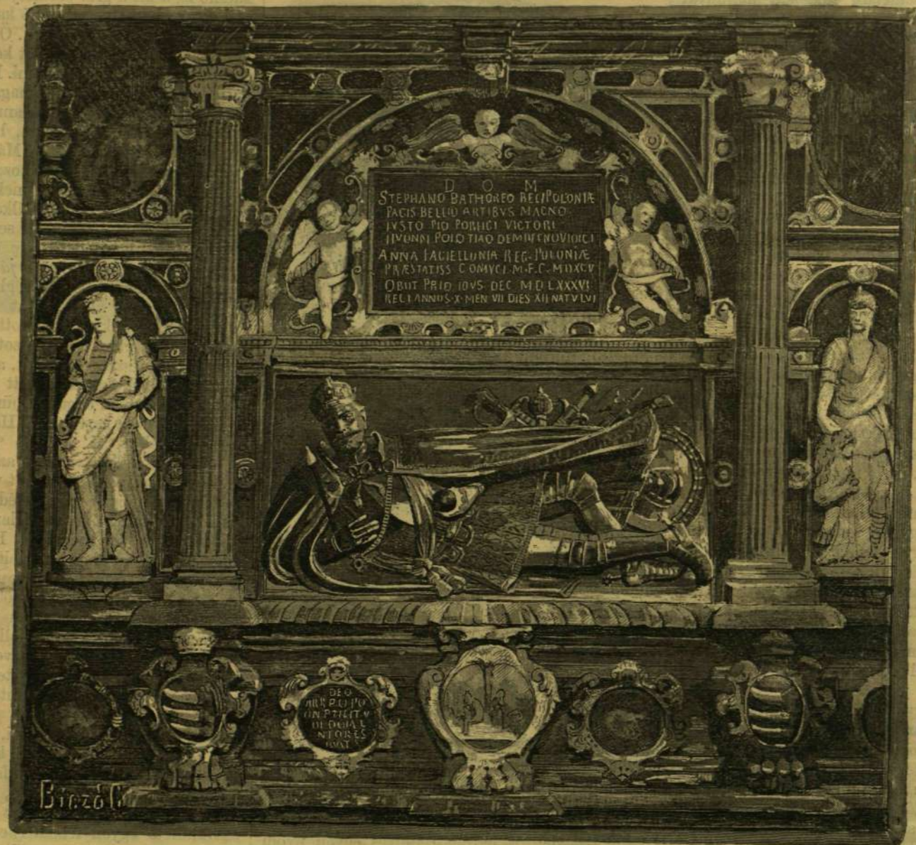
BÁTHORY ISTVÁN SIREMLÉKE A KRAKKÓI KIRÁLYI TEMPLOMBAN. Fénykép után rajzolta Biczó Géza.