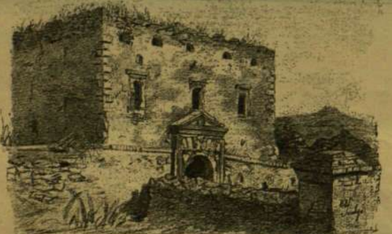
A SZILÁGYISOMLYÓI BÁTHORY-VÁR KAPUJA.

Az ős Báthory-várat a város a Bánffy-családtól 50 évre kibérelvén, annak udvarán már is csinos sétányt és tornahelyeket alakított; a vár északnyugoti sarkán, az ismertetett kapuépület mellett a vár romjaiból épült a kétémeletes gimnázium-épület; a várral szemben a régi Bánffy-fele udvarházban már a harmincas évek óta virágzó kaszinó van; s a vártól nyugatra emelkedik, az új városháza mögött, a múkedvelők által szerzett