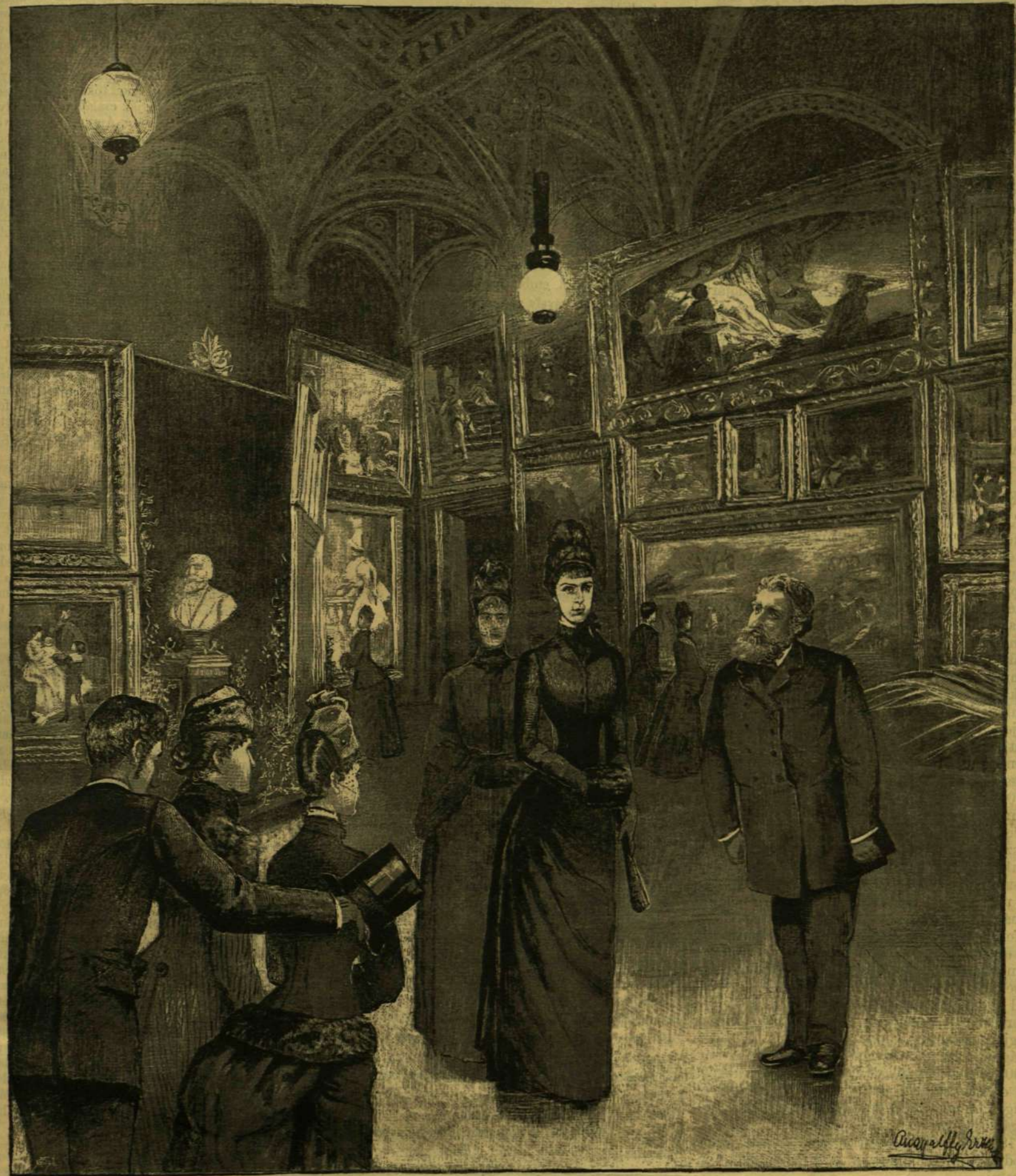
A KIRÁLYNÉ A MŰCSARNOKBAN. — Angyalffy Erzsébet rajza.