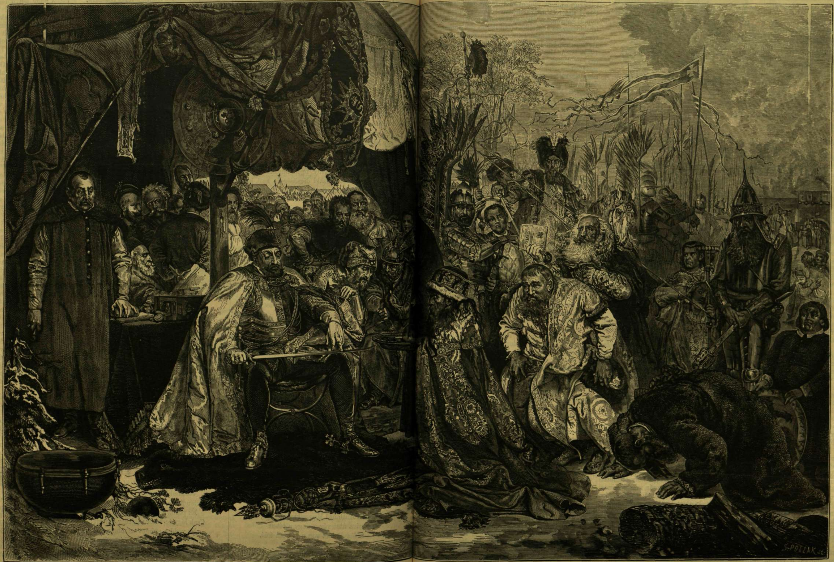
A MUSZKÁK HÓDOLATA BAI ISTVÁN ELŐTT. — MATEJKO FESTMÉNYE.