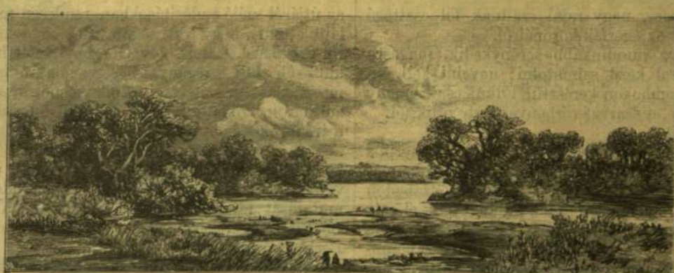
A DUNAI LIGETEK TÍPUSA.

Egy szakadékos magas part fölött, égerfák és nyárfa-csalit közt siklunk előre térdig fölázva a harmatban uszó széles levelű magas növényektől, bokros csalánok- és szálas dudvaktól. Egyszerre csak lóvérehez hasonló durranással szöknek szárnyra egy pillanat alatt a vigyázatos kacsák; észrevettek bennünket, s a bizalmatlan gemek is hosszán nyújtott figyelmeztető kiáltozással lebegnek el a víz tükre fölött. Iyenkor mozdulatlanul kell várakozni, mert a hirtelen zajtól megzavart szarvasok felbeszakítják reggeli dalukat. De ez