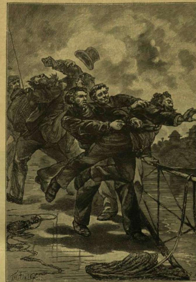
EZÚTTAL NEM ADTÁK MEG MAGUKAT ELLENTÁLLÁS NÉLKÜL.

Itt már megszüntek a porfelhők. Egy hegyfok hosszában európai modorban épült házak látszó-