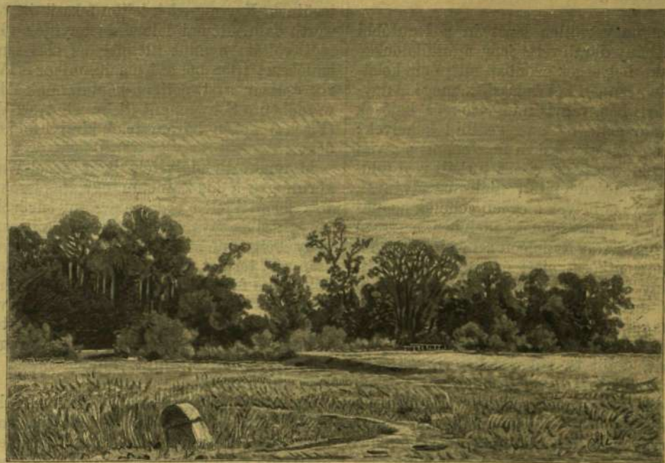
A GUNTRAMSDORFI LIGET.

A Lobau közepén egy tágas rét terül; a nagy lapúlnak egyes kis bozótok, pompás sudar szilfák, valamint itt-ott levő magános tölgyek adnak élénkítő változatosságot; s a melyen bevágódó völgyteknőkben és árkokban az évenkénti nagy áradások idején felszivárgó forrás-tiszta víz gazdag moocsári növényzetet hagy maga után. E nagy rétnak a szegélyzetét erdőszéleleg beosztott erdő-állományok képezik; dús aljnövényzetű sudar fák, csaknem áthatolhatatlan bozótok, égerfacsoportok, vad gyümölcsfák, magas növesű füvek, széles levelű növények s a különféle növényalakokból álló tenyészet dús gazdagságú fajai váltakoznak itt egymással az árnyas ösvények- és apróbb rétektől szeldelt talajon. A felszín nem sík; völgyteknők, emelkedések és hullámzatos mélyedések hirdetik, hogy itt valaha a Duna ugyancsak garazdálkodhatott. A vadak számára pompás tanyákat rejtget ezen, a Duna szeszélyeitől most már megmenekült liget. A sűrűséget nagy vadak népesítik: igen sok őz, valamint mezei és tengeri nyulak, fácánok és foglyok vi-