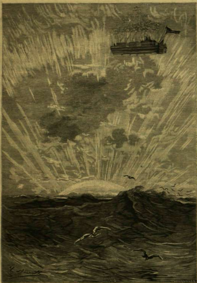
SAJÁT SZERŰ ALKONYATI FÉNY.

* A berlini szabadkőműves-páholyok jótékony czélokra jelentékeny összeget fordítanak. A német országos páholy például a múlt évben 56 gyermekért fizetett 4965 márká tandíjat, szabadkőművesek egyetemi hallgató fainak gyámoltására 7645-öt, elhunyt testvérek leányainak 2190-et. Az Augusta-alapítvány-