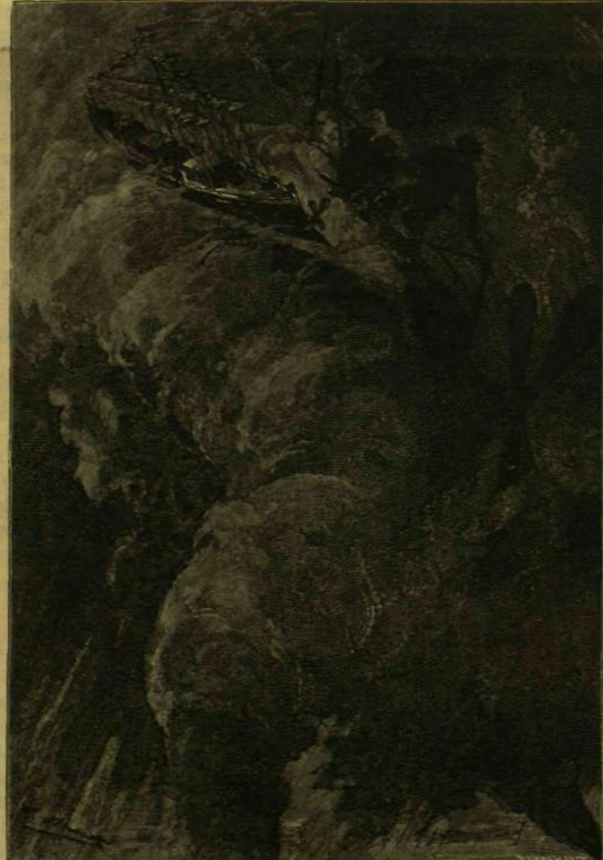
AZ ALBATROS A VÍZTÖLCSÉR FORGÓ SZELÉBEN.