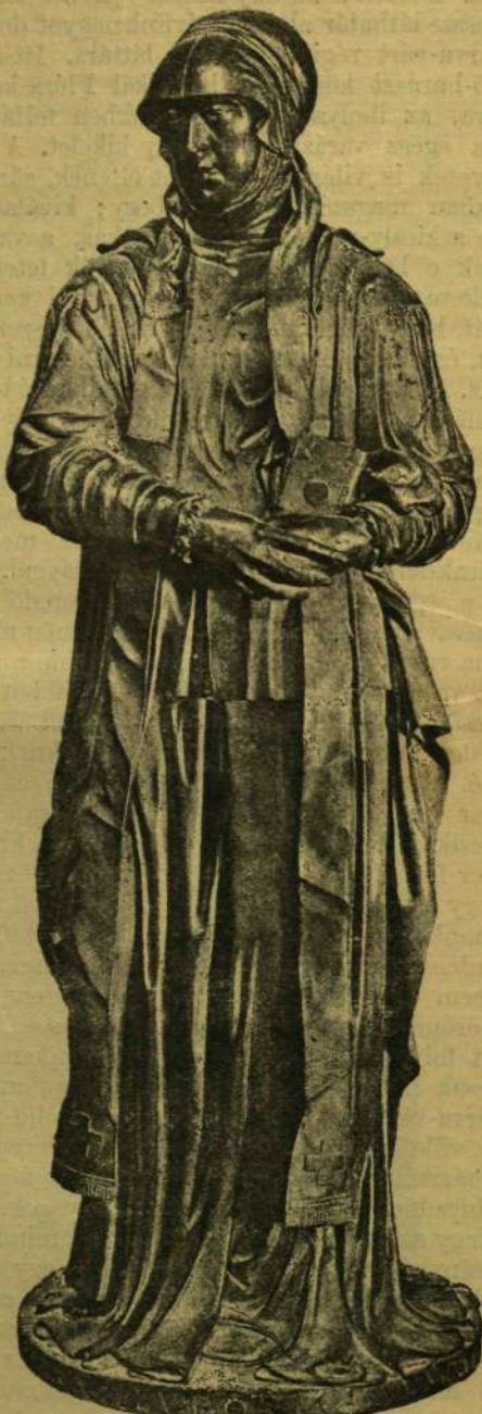
MÁRIA, II. LAJOS ÖZVEGGE. Bronzszobor Leone Leonitól az El Prado muzeumban Madridban.

Milanóban öntötték és 1556-ban Landriába vitték, és a művész fia, Pompeo Leoni végezte be teljesen, jóval későbbben. Madridban Bernudes spanyol historikus idejében e szobor a San Pablo de Buen-Retiro kertben egy ház homlokzatát díszítette, párja II. Fülöp szobra volt; átellenben