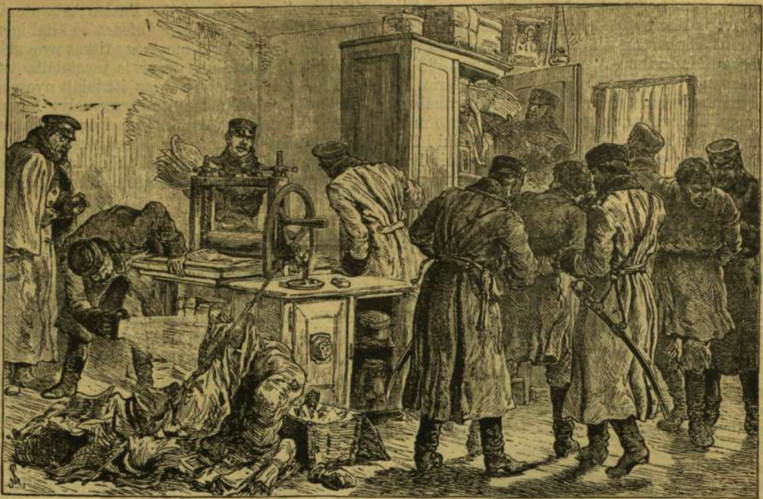
EGY NIHLISTA MYOMDA FÜLFEDEZTETÉSE SZENT-PÉTERVÁRTT.