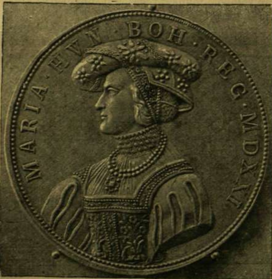
MÁRIA KIRÁLYNÉ, II. LAJOS NEJE.

E szoborra nézve Pompeo Leoni leltárában, melyet márcz. 12-én 1582-ben készített Madridban levő műhelyéről, az alkalomból, hogy atyjához Milanóba utazott, a következőket találjuk: