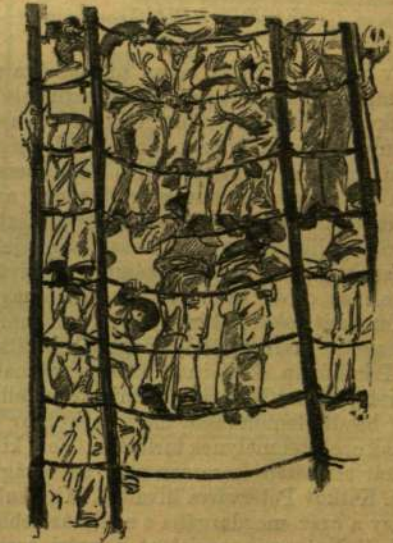
A LEGÉNSÉG A KÖTÉLZETEN.