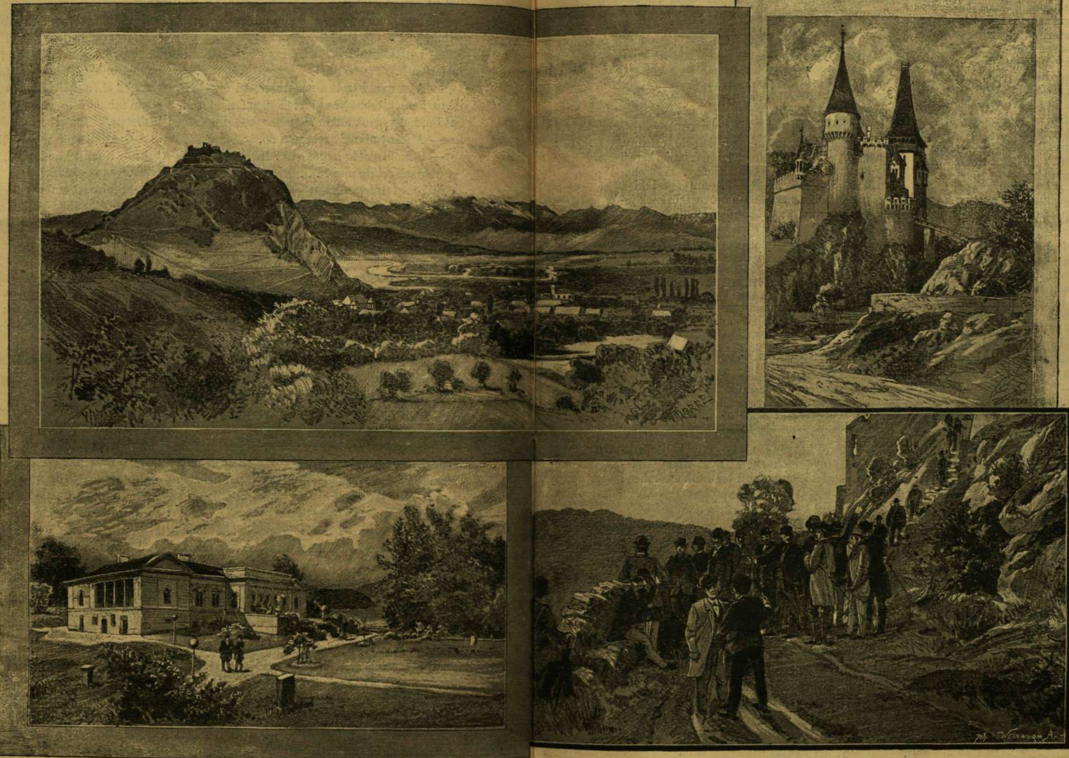
A MAROS-NÉMETHI KASTÉLY.

Már említettem, hogy a megyének négy városa van. Szászváros, a mely legpolgárisabb jellegű és legnagyobb, csak a legújabb szervezés óta tartozik ide. Az előtt, mint a Királyföld része,