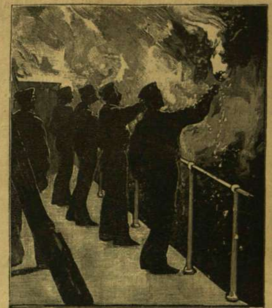
BENGALI FÉNY A «SILVERTOWN» HAJÓN.