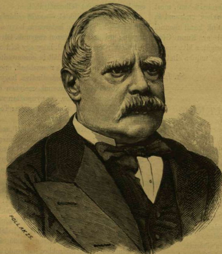
GRÓF SZÉCSÉN ANTAL.

Családi összeköttetéséinél fogva gyakori érintkezésben állott Metternich herceggel, a nagy-hírű és hatalmas osztrák államférfival, a ki nagyon korán felismerte benne a ritka éleseszű és tisztán, higgadtan gondolkozó embert. Alig volt 24 éves, midőn a pozsonyi országgyűlésen, 1843-ban, mint a főrendiház tagja fellépett s itt tartott beszédeivel annyira magára vonta a közfigyelmet, hogy Metternich herceg felszólította,