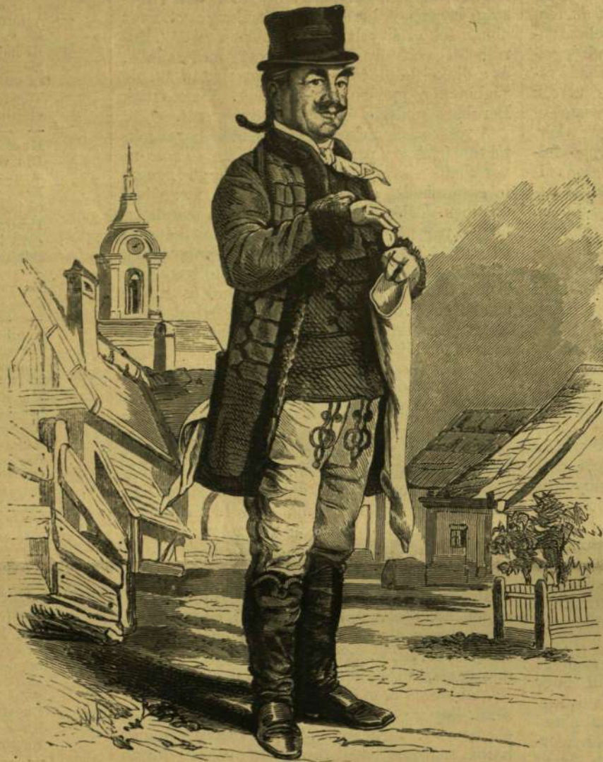
BENZA, MINT MISKA DOPPLER «ILKA» CZIMŰ DALMŰVÉBEN.