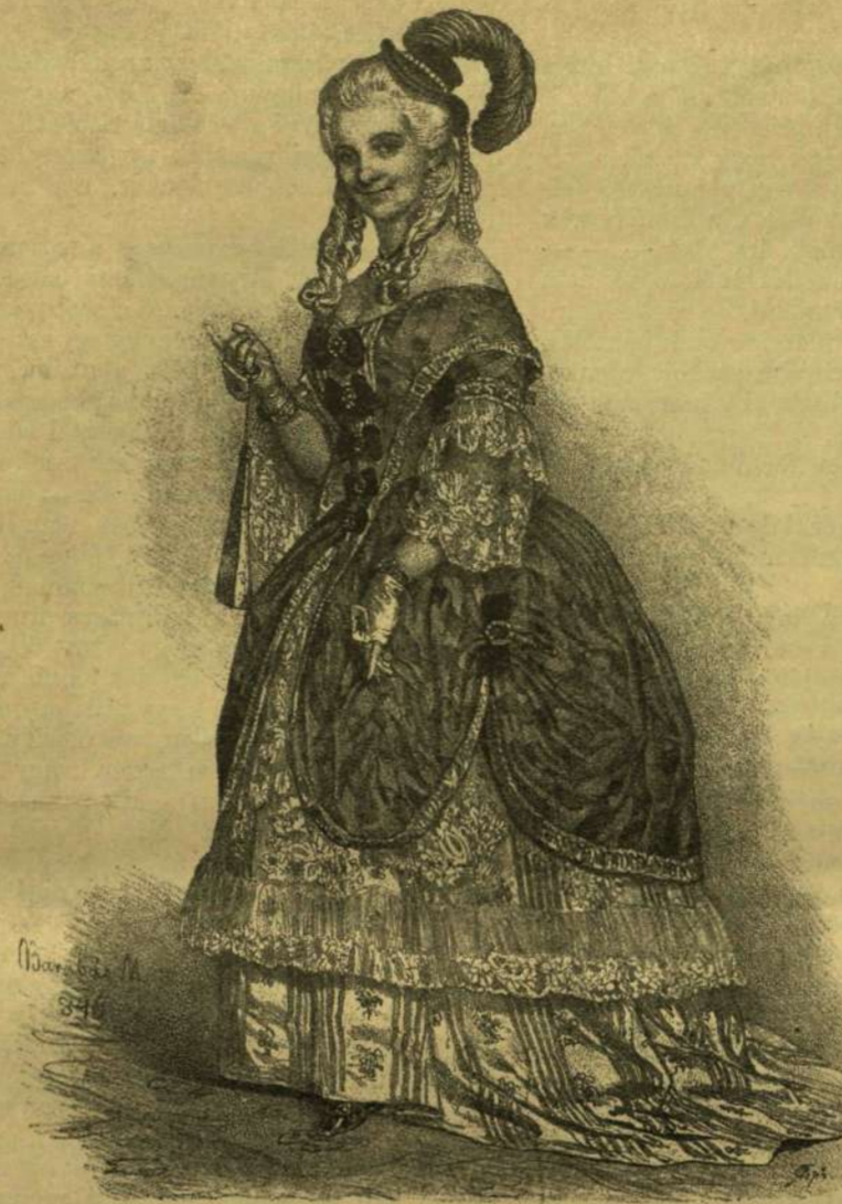
SCHODELNÉ, MINT NORINA «DON PASQUALE»-BAN.