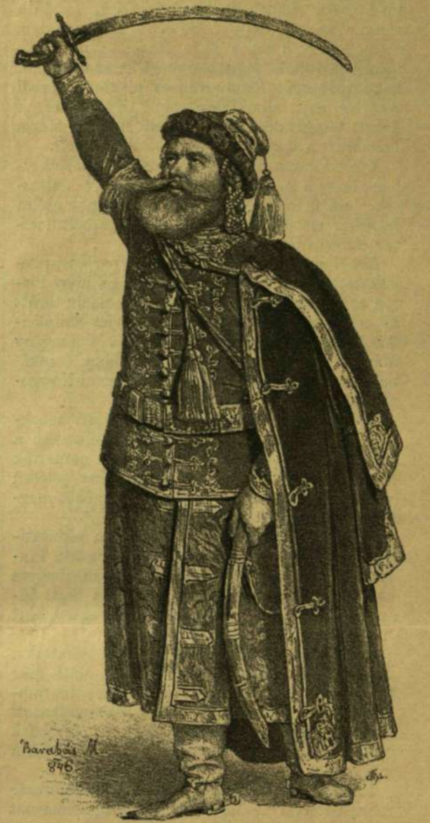
SZENTPÉTERY, MINT ZÁCH.