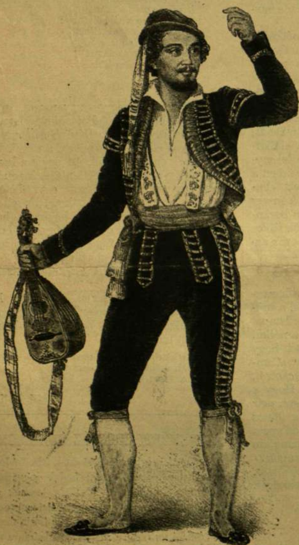
FÜREDY, MINT FIGARO.