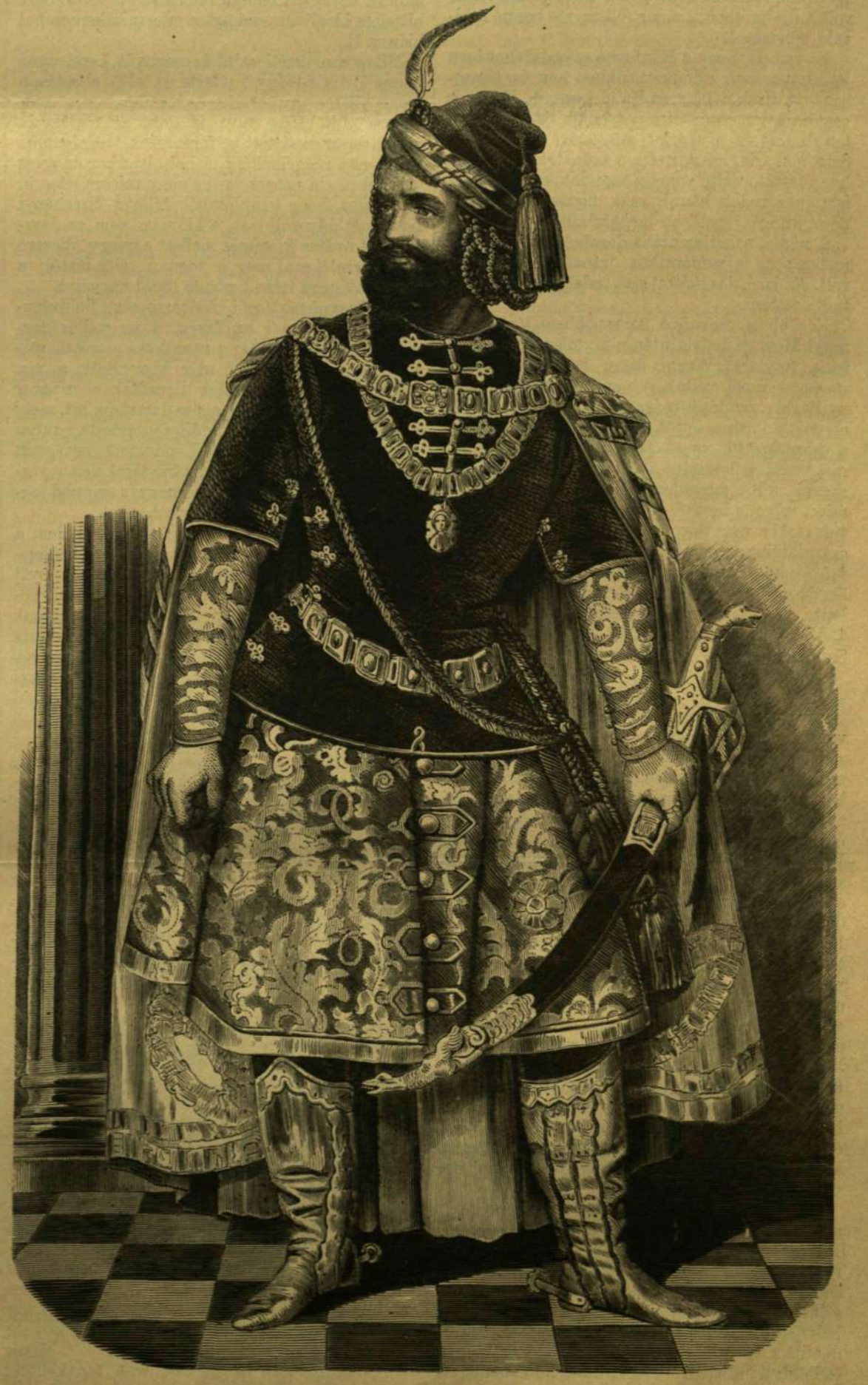
LENDVAY, MINT BÁNK BÁN.

Törökországi bujdosását naplójában írta meg, s mire hazajött, 1850-ben, úgy találta, hogy a színpadról mint kompromittált egyén le van tiltva. Nem is lépett fel egész 1854-ig, a mikor Lear királyban ismét ragyogóbban mint valaha mutatta be művészetét. Ez időben kapta később oly végzetessé vált szerepét is, Brankovics Györgyöt, a korán elhalt Obernyik bevégzetlenül maradt művét, melynek czimszerepéért a szerb ifjúság is megkoszorúzta s e koszoru oly kedves volt előtte, hogy meghagyta, hogy azzal temessék el. Sokoldalú tehetségéről tesz tanúságot jeles tankönyve, melyet «A színészeti könyve» czimén írt s tanári működése, melyet az országos színi kepezdenél kifejtett. Éltető eleme azonban a színpad maradt, s az adta neki a halált is. Már 1864 jun. 20-án Scríbe «Egy pohár vízben» Bolingbroke szerepében rosszul lett; az orvosok, a kik ezuttal megmentették, azt a tanácsot adták neki, hogy hosszabb ideig vonuljon nyugalmába. Csak hogy az igazi művész-termeszet nem tudott ily előhalott lenni s bár nyelve dadogott s jobb kezét nem bírta, újra színpadra készült. Szerepét