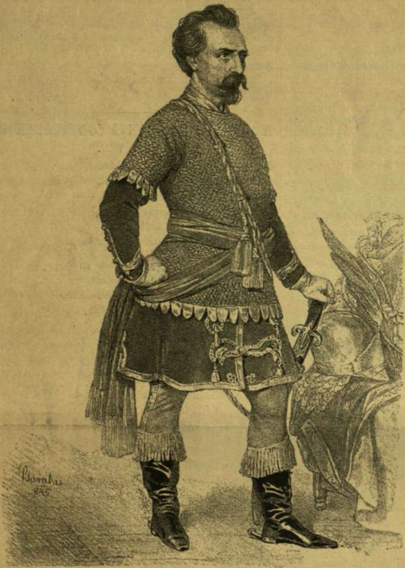
EGRESSY GÁBOR, MINT GRITTI.