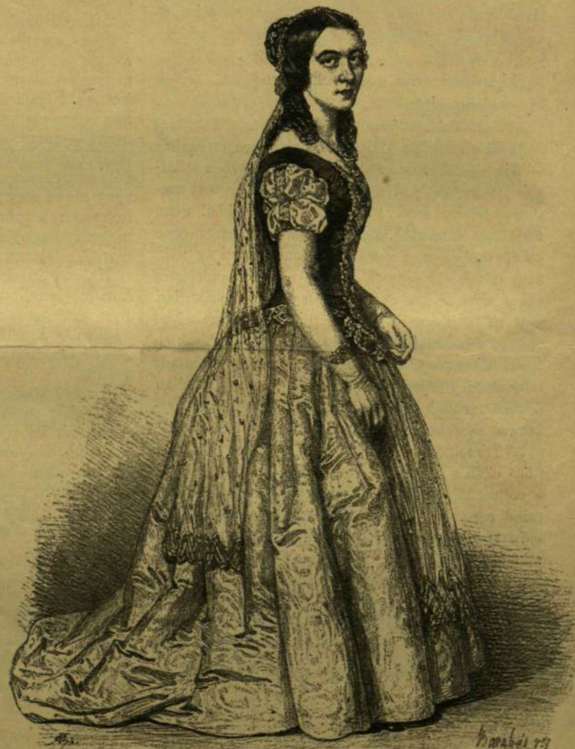
KAISER ERNSTNÉ, A «KUNOK» CZIMŰ DALMŰBEN.