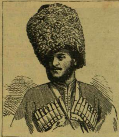
KATONA, A PERSA HATÁRRÓL.