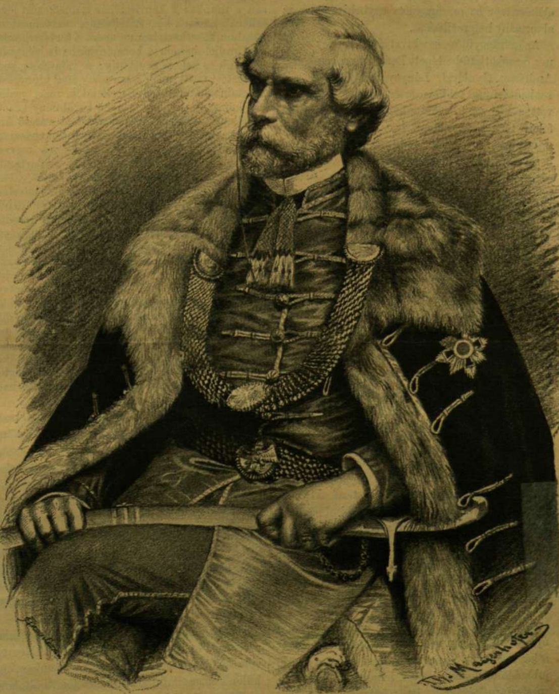
BÁRÓ SENNYEY PÁL.

Mikor az 1848-iki alkotmány visszavételére irányuló armányok és erőszakoskodások, az alattomban fölizgatott nemzetiségek támadásai s Jellasics betörése fegyveres ellenállásra kényszerítették a nemzetet s a honvédelmi bizottmány megalakult, — Sennyei Pál október havában le-