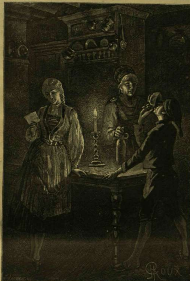
EGY CSÖPP SEM MARADT A POHÁRBAN.