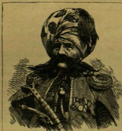
KOZÁK ATAMÁN (EZREDES).