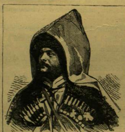
CSEKESZ, A KUBÁNI TARTOMÁNYBÓL.