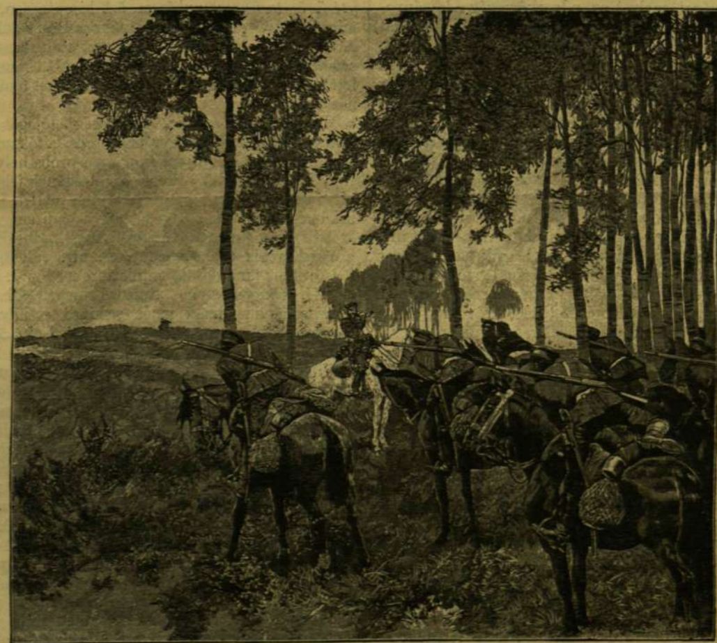
GYALOGOSÍTOTT LOVASSÁG. — SZUBONYT FEL — ELŐRE!