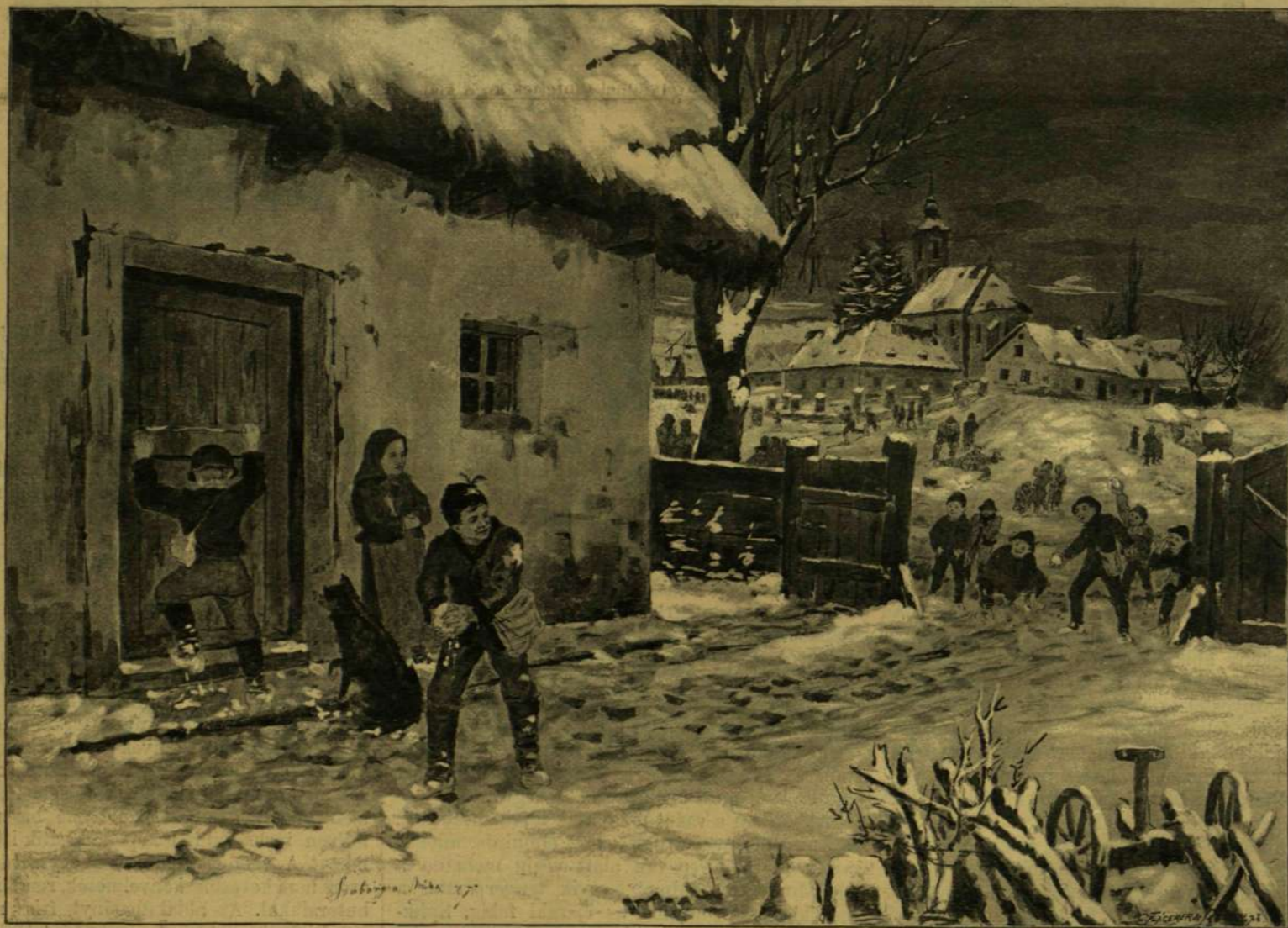
LÖVÖLDÖZÉS HÓ-LABDÁKKAL. — SZOBONYA MIHÁLY RAJZA.

Közel a két óra, s rektor uram az ilyen dologban nem érti a trefát. Az egyik fiú már veri le csizmájáról a havat a szentély ajtaja előtt. A lövöldözést meg csak az a nagyobbik állja — úgy látszik, valamennyi között a legerősebb és legvittebb — s aztán ő is megrúhoz a nagyobb tekintély előtt. Jóakaró passzivitásban nézte a