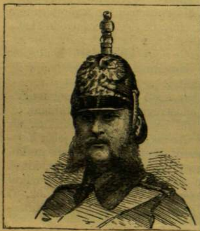
GRÁNÁTOS, A CSÁSZÁRI TESTŐRSÉGBŐL.