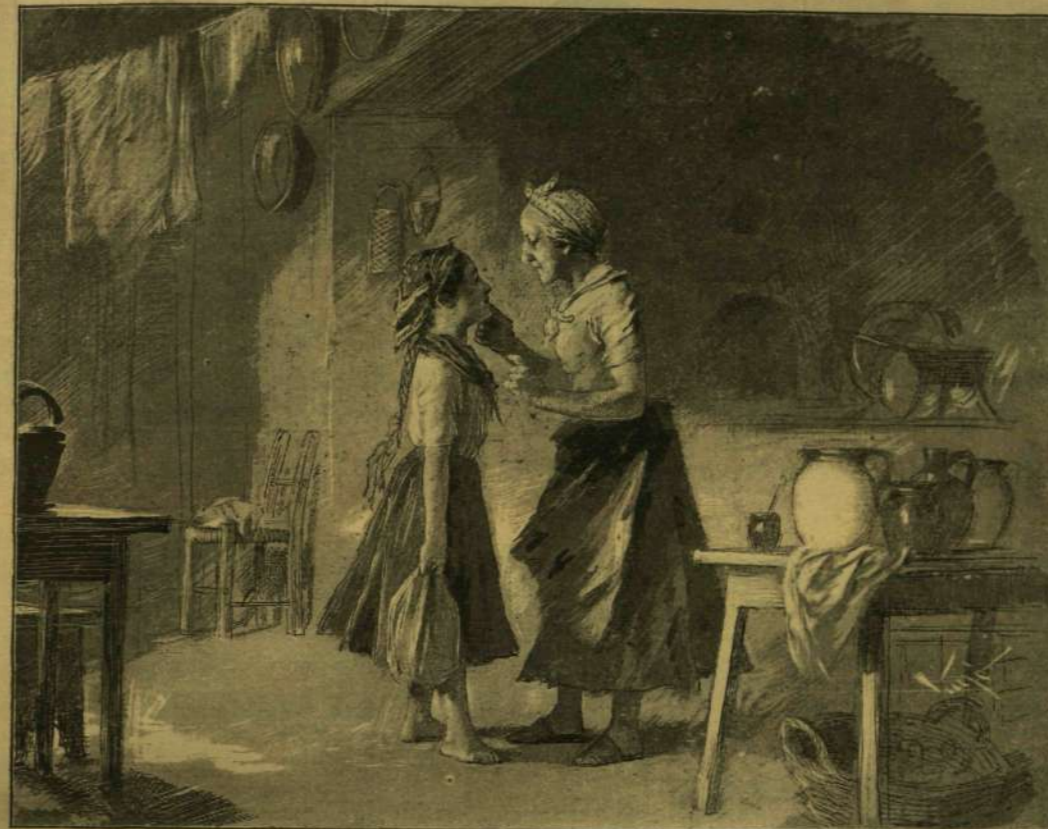
JÓL LELEKÉRE KÖTÖTTE KIS LEÁNYÁNAK, HOGY GYORSAN SZEDEGESSE LÁBAIT.

Aztán lassankint egymás után jöttek az új vándormadarak, a kiket ember soha nem látott még itt. Jött a «zsandár», azután jött a «fináncz»