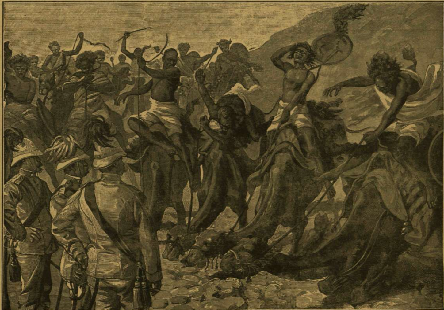
AZ EZER TEVÉS KARAVÁN MEGÉRKEZÉSE MASSZAVÁBA.

Valószínűleg legrosszabb híre van a példabeszédekben a görög népnek. A délszlávok igen sok közmondásban ítélik el őket. Egyik szerint: «Három török és három görög együtt hat pokol.» Tovább: «A rák nem hal, a görög nem igaz ember.» Majd: «Egy görög évenként csak egyszer mond igazat» — vagy: «a cigány megcsalja a zsidót, a zsidó a görögöt s a görög az ördögöt.» A velenceiek szerint az, a ki a görög szavában hisz, boldondabb, mint az örült. Még a normandiknál is rossz híre van a görögnek, mert a váratlan visszafizetett kölcsönről mondják: «ezt a görög fizette meg.» A »graeca fides« történeti híri jelentése, tudjuk, hogy voltaképen csak a példiáti írja körül ironikusán.