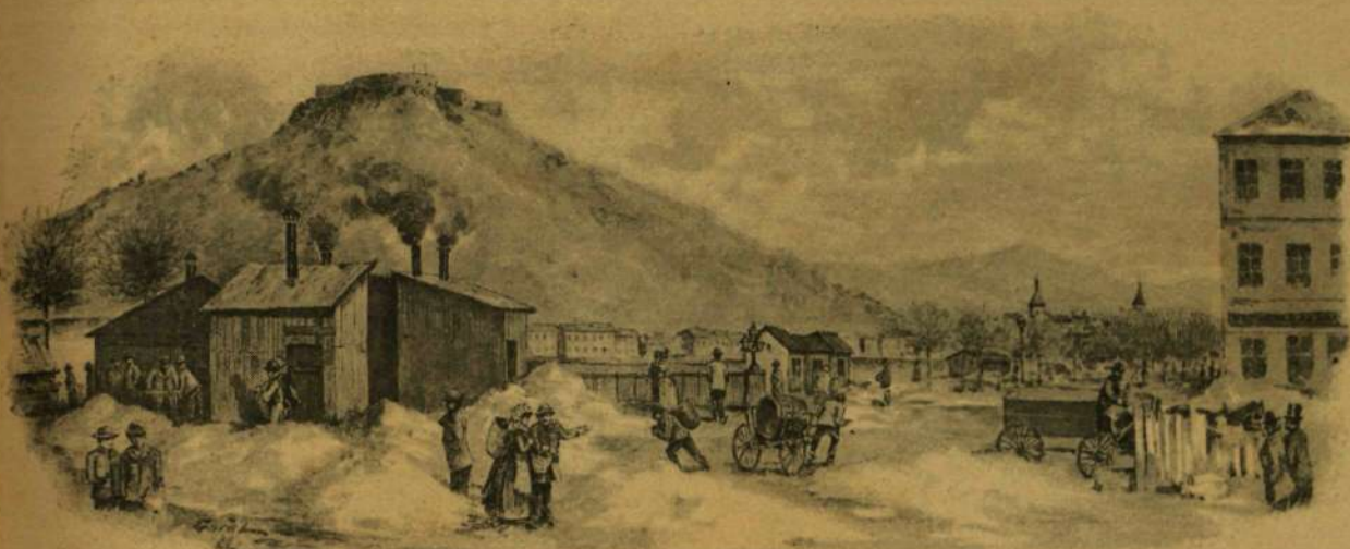
SHIVATTYUS GÉPHÁZAK AZ ALSÓ-DUNAPARTON.