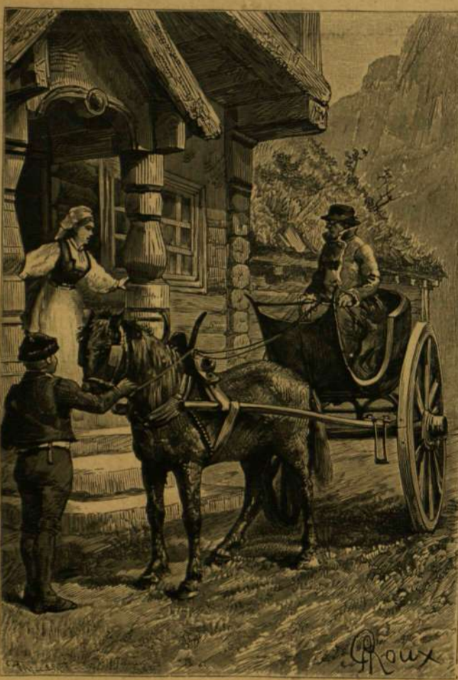
«EZ A HANZENNÉ ASSZONY VENDÉGLŐJE?»

* A csukahal ősatyját felfedezték Oregon államban, egy Portland közelében levő sziklarétegben, 3000 láb magasságban a tenger színe felett. A megkövesült halból a fark, fej, valamint az uszonyok még elég jól láthatók, hossza 17 1/2 hüvelyk, szélessége 6 hüvelyk s kétségkívül több ezer éves.