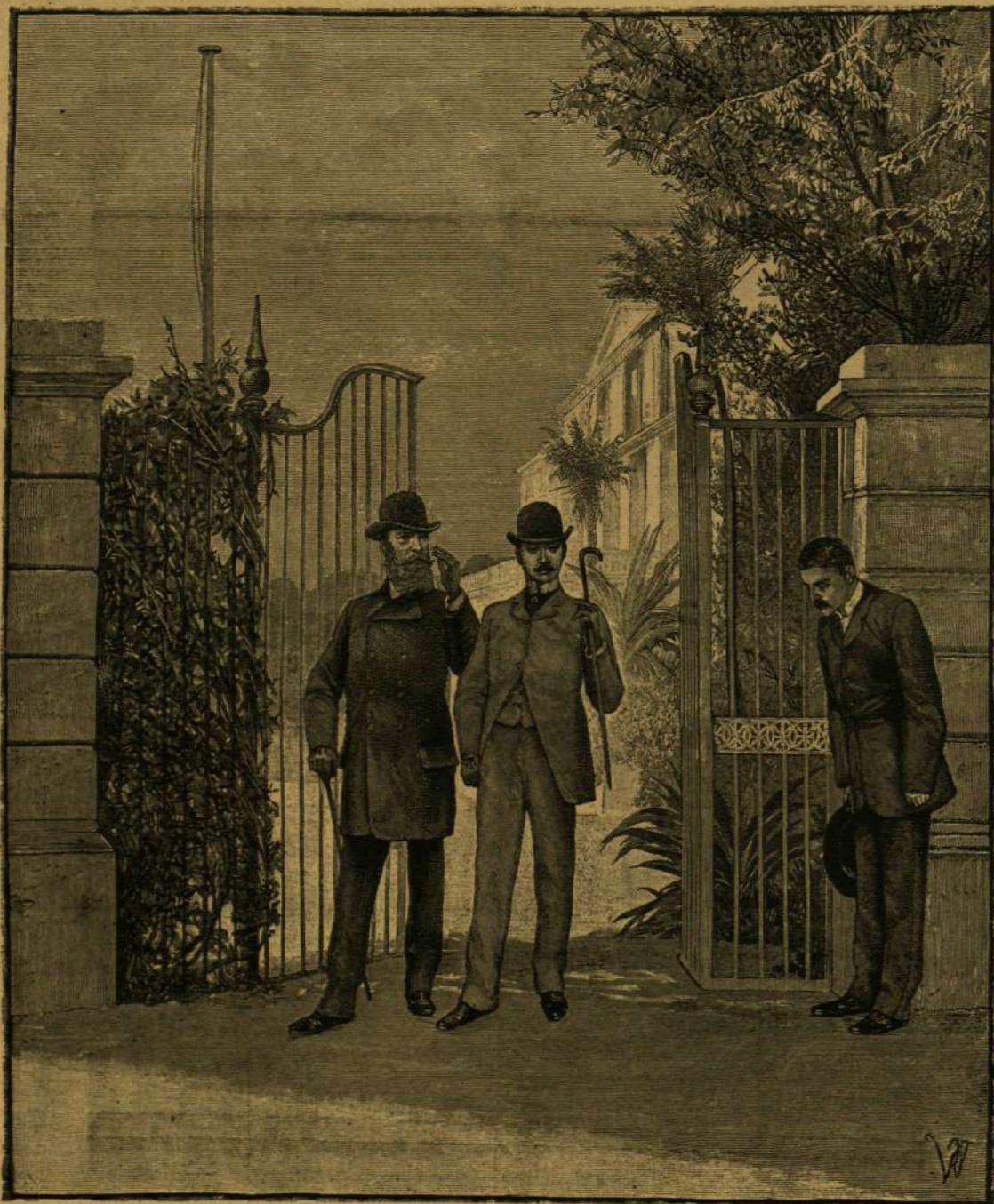
A NÉMET TRÓNÖRÖKÖS DE MACKENZIEVEL A ZIRIO-VILLA KAPUJÁBAN, SAN-REMOBAN.

Midőn a német trónörökös torokbajának gyógykezelését a német orvosok s különösen Bergmann tanár tanácsa ellenére, kik radikális gégemet-