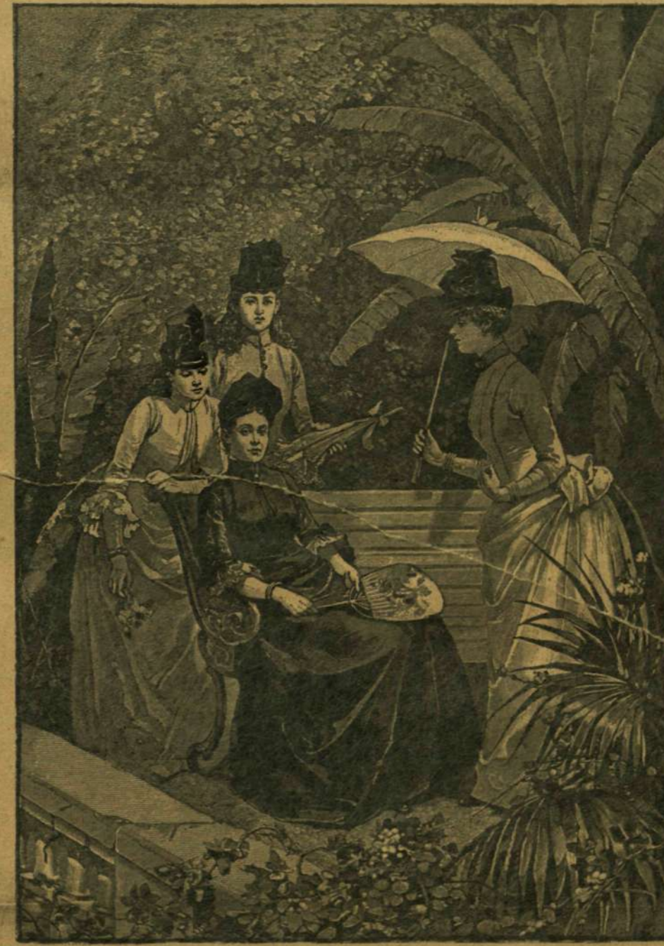
A NÉMET TRÓNÖRÖKÖS NEJE ÉS LEÁNYAI SAN-REMOBAN.