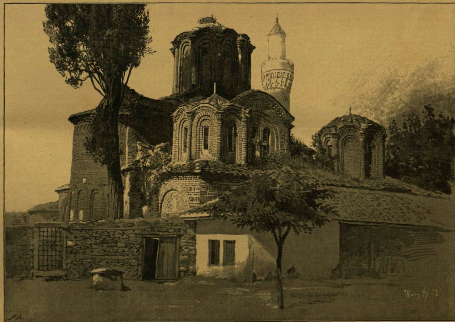
SZALONIKI: SZENT DEMETER DZSAMIA.

kások hatását, ezuttal pontosan betartotta a kitűzött határnapot és május hó 19-én csakugyan megnyitotta a nemzetközi kereskedelemnek egy nagy fontosságú forgalmi útja, mely Közép-Európát Szalonikival összeköti. E vasut megnyitja ránk nézve már annál is nagyobb fontosságú, mert első fő állomása Budapest, s így a magyar kereskedelem és ipar a legtermészetesebb módon vonatik be a közvetlen keleti forgalomba. Kétségkívül nagy esemény ez, és eléggé sajnálatos, hogy bár ennek bekövetkezését régen előre láthattuk, jóformán készületlenül találta iparos és kereskedői köreinket. Pedig ama fogadtatás után ítélve, melyben a megnyitó vonat a Balkán-félsziget egész területén részesült, azt lehet következtetni, hogy kultur-munkára, gazdasági működésre szívesen látnak bennünket ott.