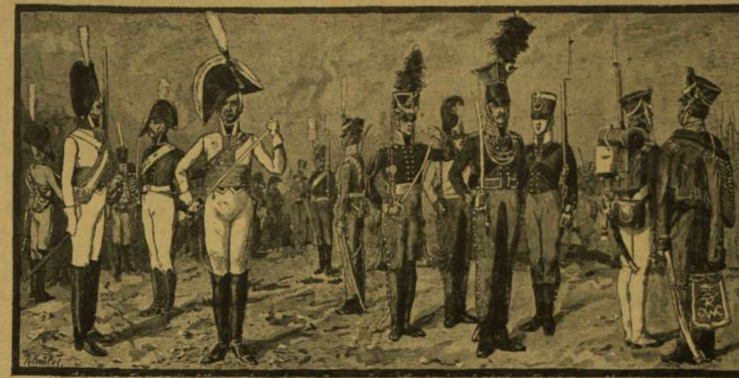
A POROSZ HADSEREG EGYENRUHÁZATA E SZÁZAD ELEJÉN.