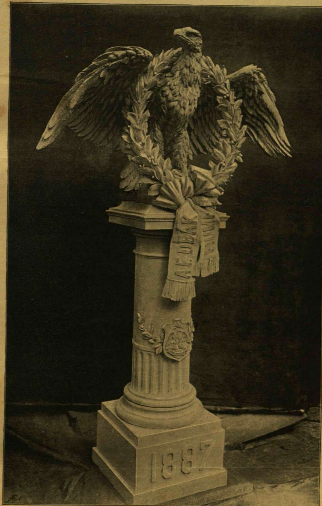
FIUME KOSZORÚJA DEÁK SIRJÁRA.

Az egységet ily kényes helyzetben termé-szetesen bajos mindig mozdulatlanul megtar-tani. Egyes töredékek a municipium számára sokszor szinte parlamenti jogokat követeltek. Az államhatalommal ismételve kisebb-nagyobb el-lentétek állottak elő. A kik az ily ellentéteket elmérgesítették, szintén nem hiányoztak.