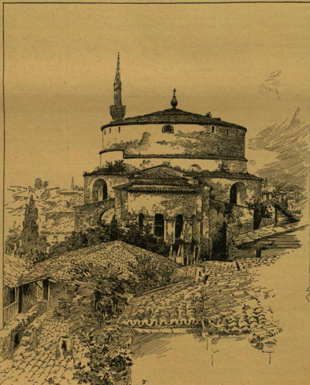
SZALONIKI: SZAUK SZULI DZSAMIA.

Az öreg Enyedi pedig a két kezére hajította fejét az asztalon és úgy nézte azt a csomót, azon azt a címet, míg egyszerre csak csupa könny lett a szeme, egy betű helyett kettőt látott azon át s a 200-as már 2000-esnek tetszett előtte... Hát ő mégis csak jobban értette a fia beszédét, hogy az volt most annak a végrendelete... Mi-