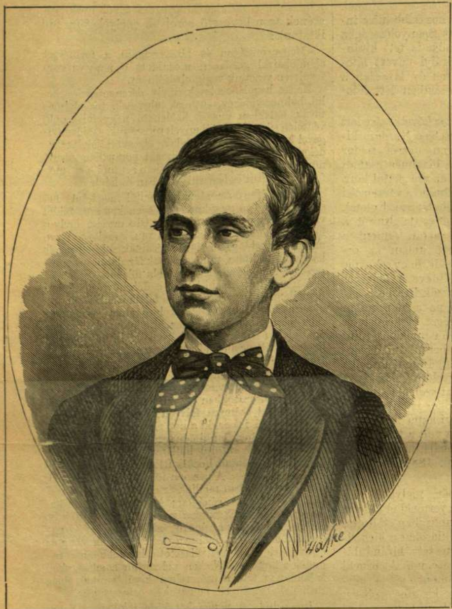
RUDOLF TRÓNÖRÖKÖS 14 ÉVES KORÁBAN (1872.)