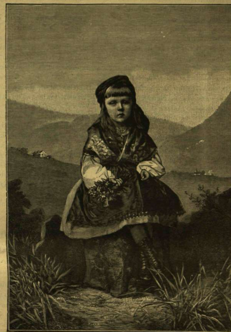
ERZSÉBET FŐHERCEGNŐ 1888. NYARÁN.