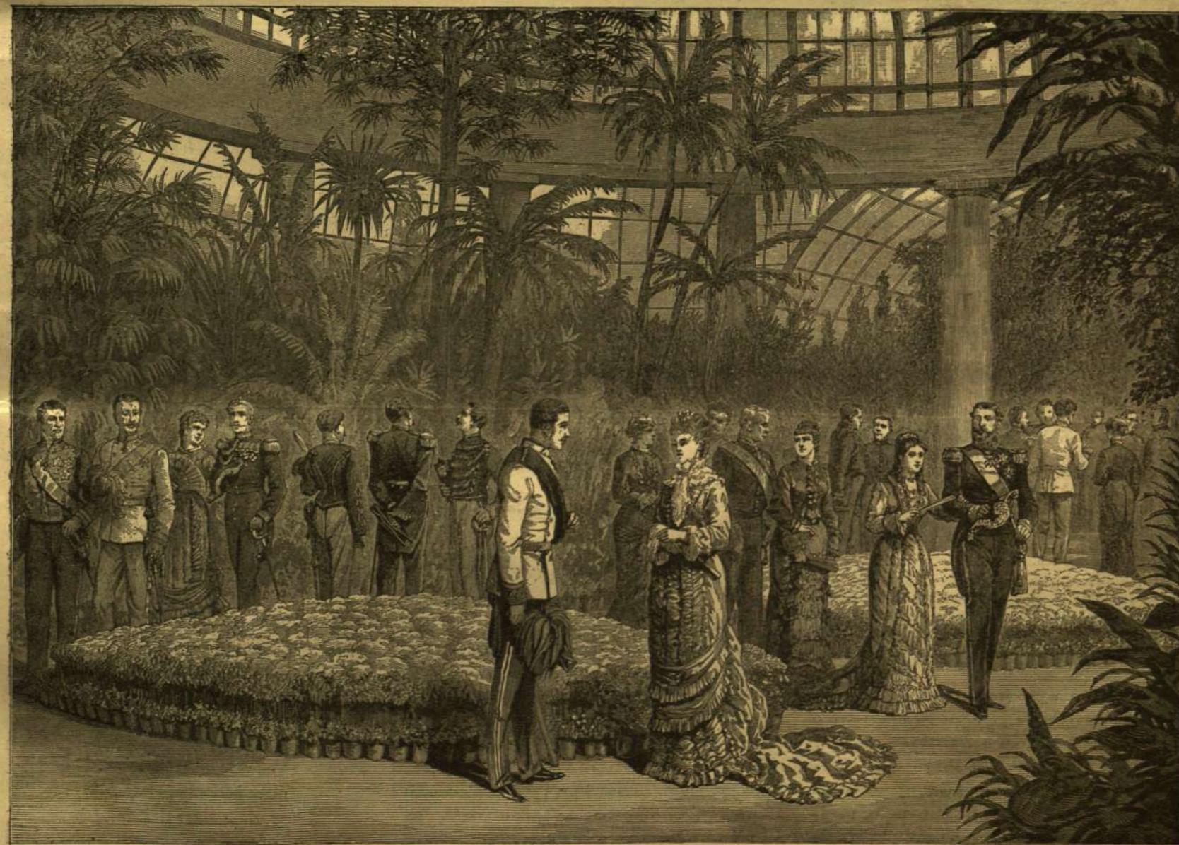
RUDOLF TRÓNÖRÖKÖS ÉS STEFÁNIA HERCEGNŐ TALÁLKOZÁSA LAXENBEN (1880.) RUDOLF TRÓNÖRÖKÖS ÉLETÉBŐL.