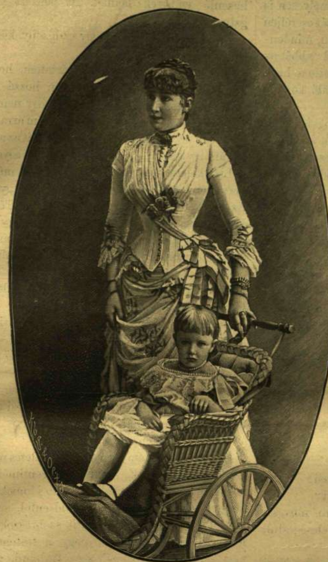
STEFÁNIA FŐHERCEGASSZONY LEÁNYKÁJÁVAL ERZSÉBET FŐHERCEGNŐVEL (1886.)