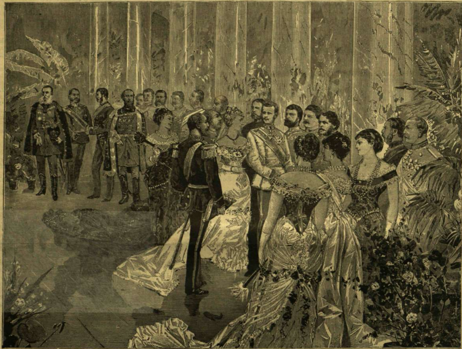
CERCLE A TRÓNÖRÖKÖS NÁSZÜNNEPÉLYÉN (1881.)