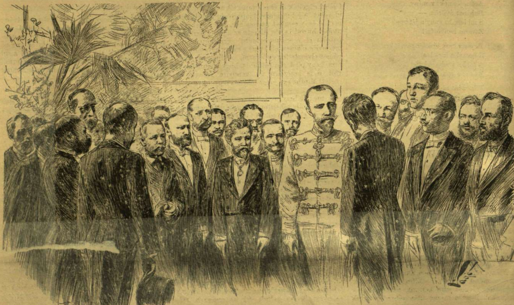
RUDOLF TRÓNÖRÖKÖS MAGYAR IRÓK ÉS MŰVÉSZEK KÖZÖTT. Bemutatók az „Angol királyné” társalgó-termében. 1888. február 12-én

visa a Nellemes és társai napokra, misztet főszereplő Budapesti től, töltünk