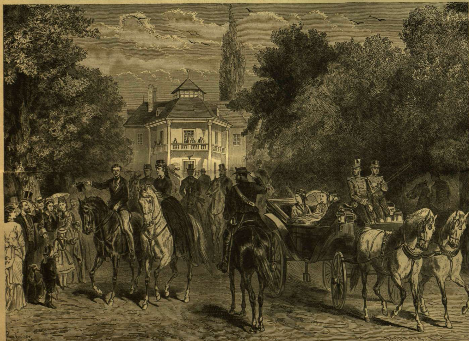
A KIRÁLYNÉ ÉS A TRÓNÖRÖKÖS A PRÁTERBEN (1875.) RUDOLF TRÓNÖRÖKÖS ÉLETÉBŐL.