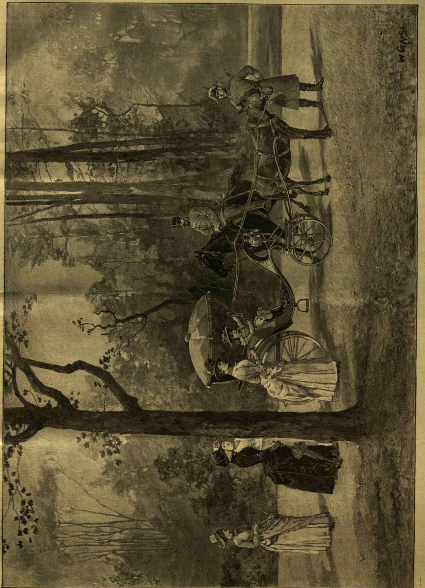
RUDOLF TRÓNÖRÖKÖS ÉS CSALÁDJA A LAXENBURGI PARKBAN (1887.)