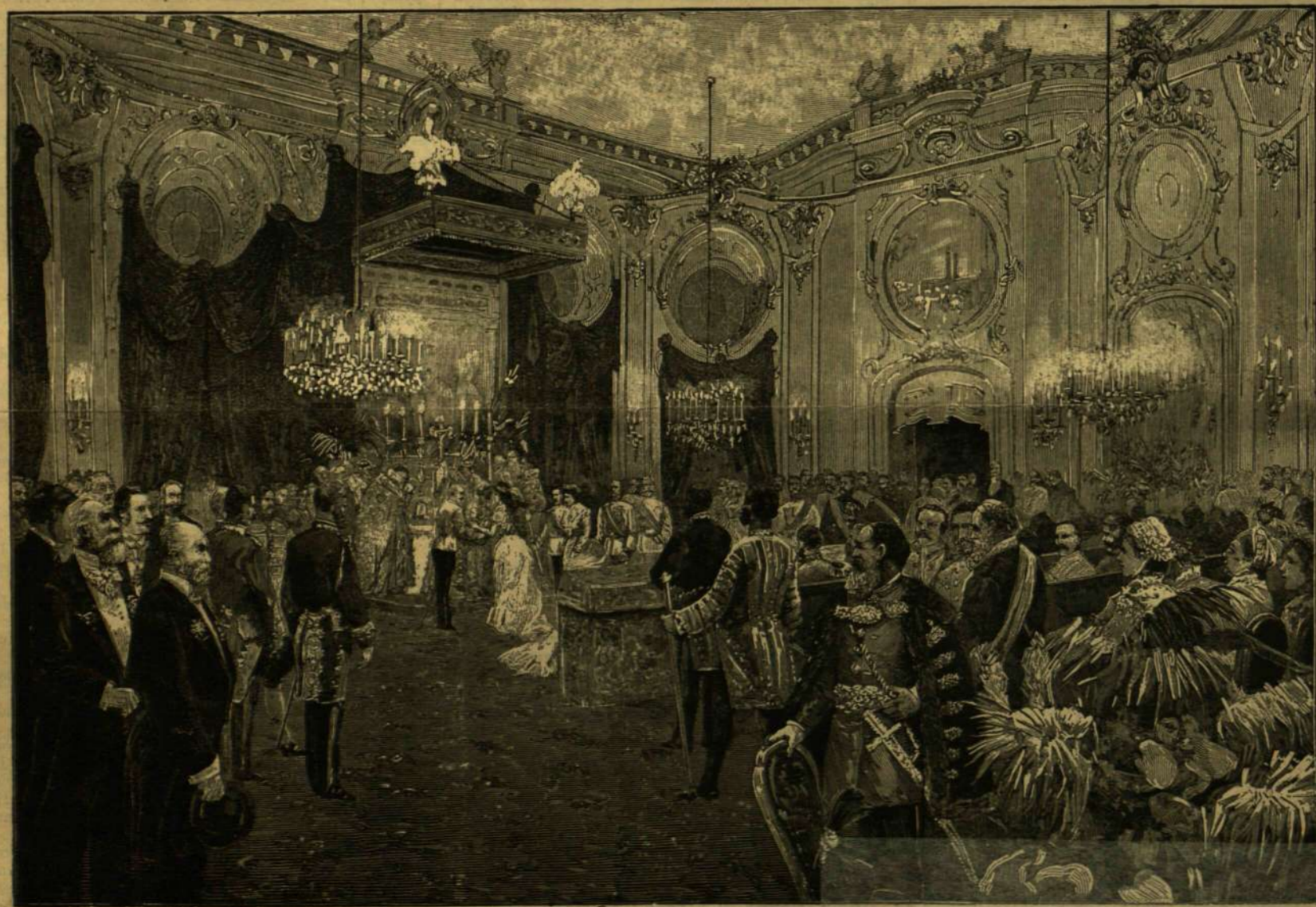
ERZSÉBET FŐHERCEGNŐ KERESZTELÉSE LAXENBURGBAN 1883. SZEPT. 5-ÉN.