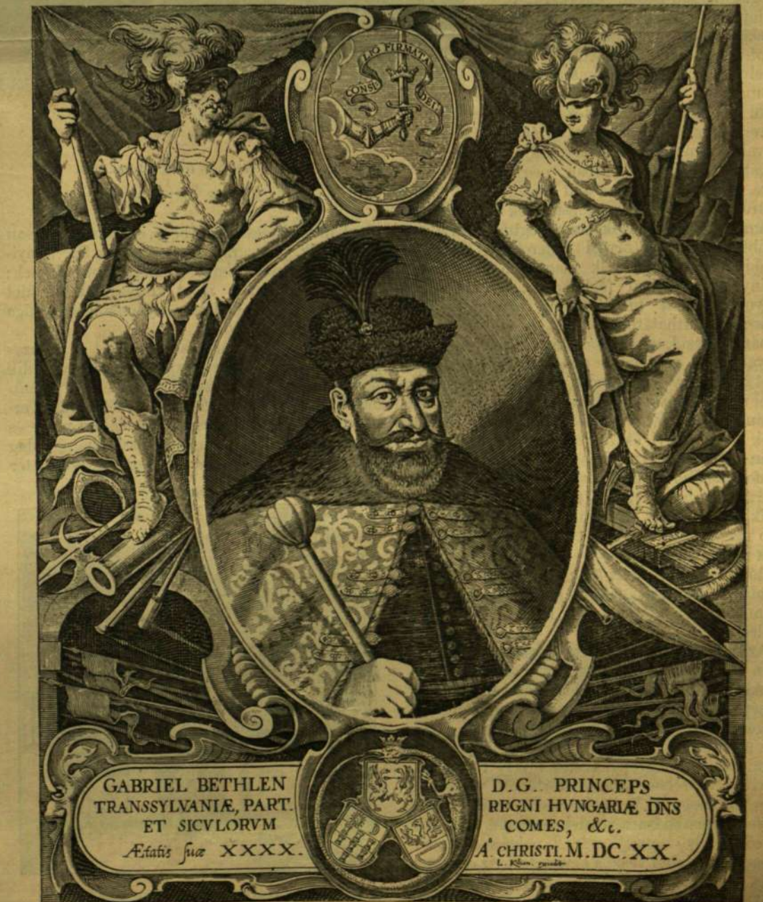
BETHLEN GÁBOR FEJEDELEM, A BETHLEN-KOLLEGIUM ALAPÍTÓJA. Kilián 1630. évből való metszete.