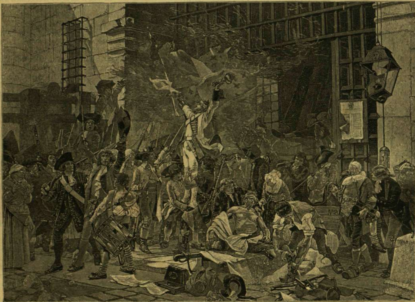
A BASTILLE OSTROMA. — FLAMENG FESTMÉNYE UTÁN.

* Érdekes hidpróbat tartottak nem rég Bridgeport amerikai városban. Barum 10 elefántját, melyeknek összes súlyok mintegy 900 mázsa volt, egy-szerre vitték át az új hidon s ugyanakkor tómerdek