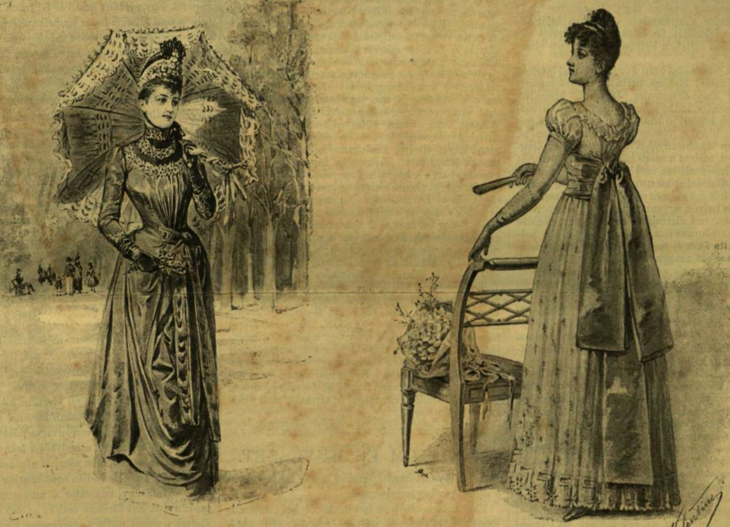
REGGELI LÁTOGATÓ RUHA.

És már titokban készülöben is van a nagy összeesküvés, mely a dícsőséggel uralkodó divat-irányt le fogja rántani trónjáról, hogy helyet szoríttasson vele a XV. és XVI. Lajos korabeli