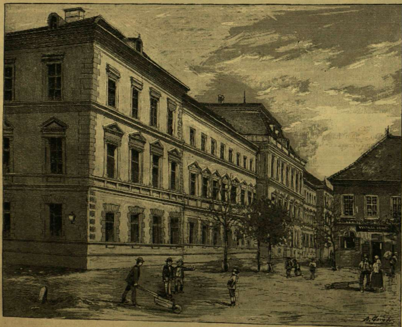
A NAGY-ENYEDI BETHLEN-KOLLÉGIUM UJON ÉPÜLT FŐHOMLOKZATA.

és ada kegyelmednek egy szép szelid leányzót: a fiatalok szeretik egymást, egymás nélkül nem tudnak élni, így hát mi okon választaná el kegyelmed őket? Mi okon kívánna e szép pár vesztét? Mert hogy a tiltásnak veszedelem lesz a gyümölcse, azt az én anyai szívem világosan érzi!