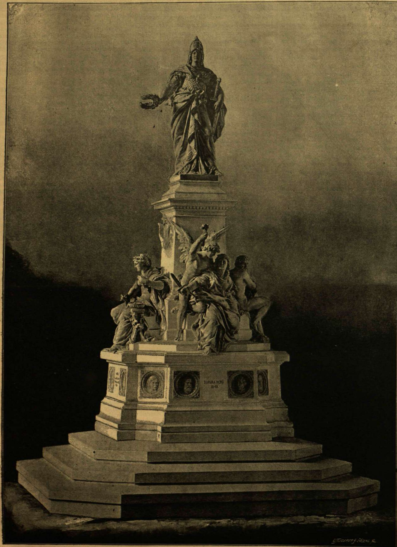
AZ ARADI VÉRTANUK EMLÉKSZOBRA. — HUSZÁR ADOLF KIS MINTÁJA.