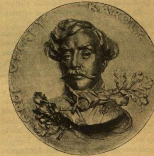
DOMBORMŰVÜ ARCZKÉPEK A SZOBOR TALAPZATÁNAK OLDALÁN.

felelém 19 éves eszemmel, — Klapka tábornok nem ragadtatja el magát szenvedélyei által.