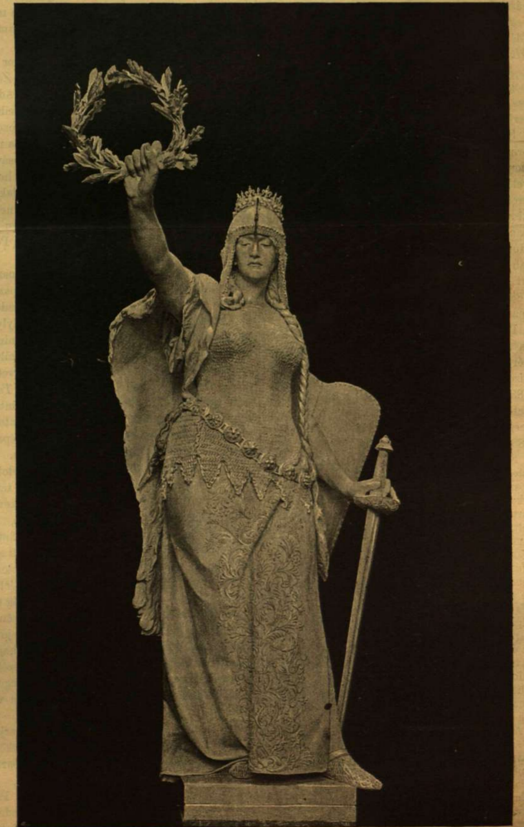
HUNGÁRIA AZ ARADI VÉRTANUK EMLÉKSZOBRAÉNAK FŐALAKJA. Zala Györgytől.