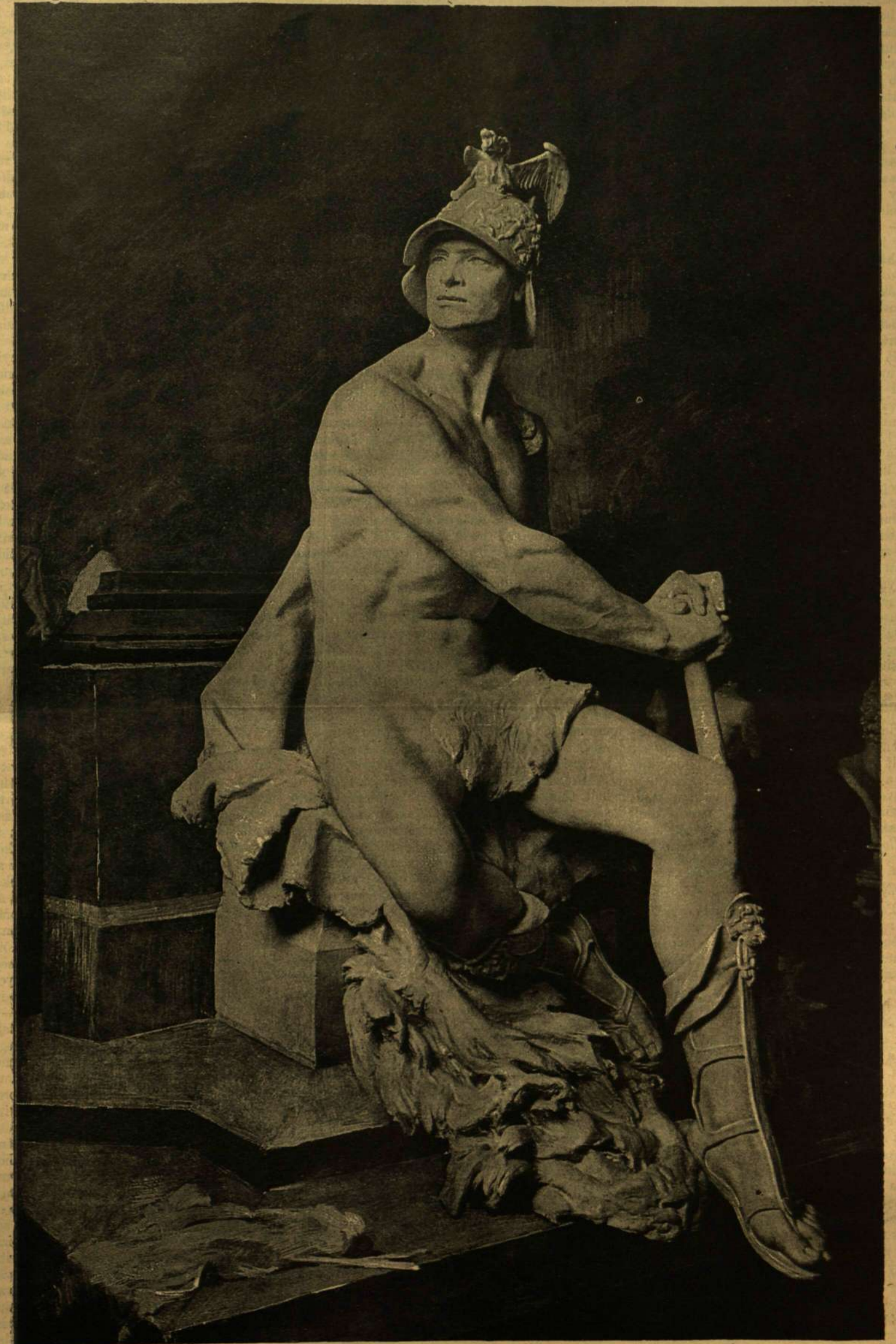
HARCZÉKSÉG. RÉSZLET AZ ARADI VÉRTANUK EMLÉKSZOBRÁRÓL. Zala Györgytől.