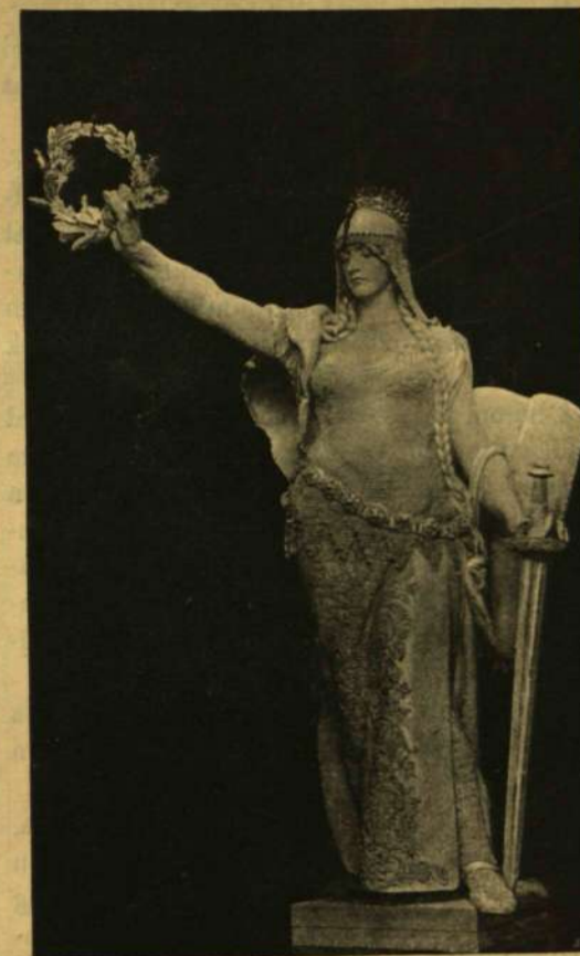
HUNGÁRIA, AZ EMLÉKSZOBOR FŐALKAJA.

— Attól ugyan ne tartson Exzellenziád, —