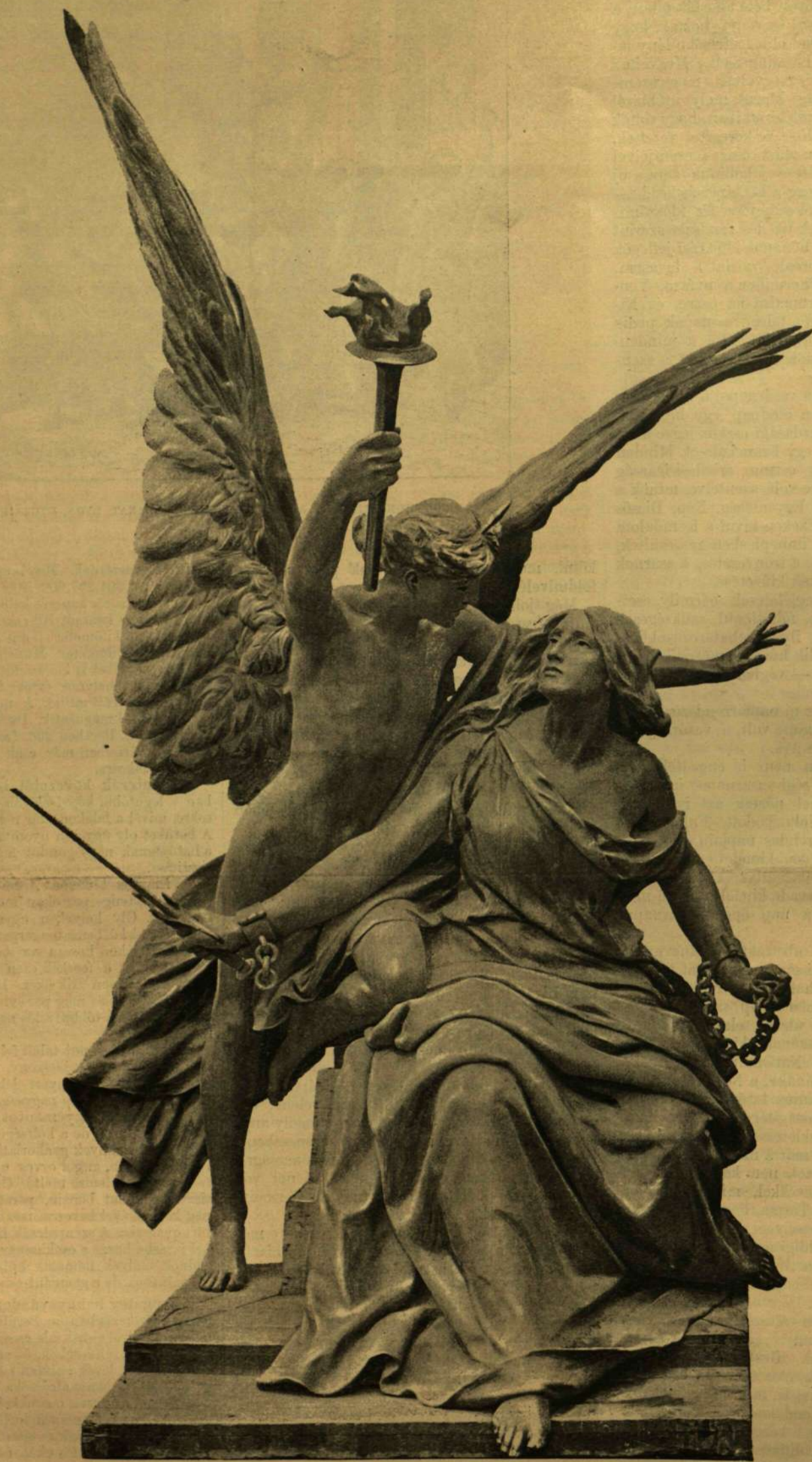
AZ ÉBREDŐ SZABADSÁG. RÉSZLET AZ ARADI VÉRTANUK EMLÉKSZOBRÁRÓL. Zala Györgytől.