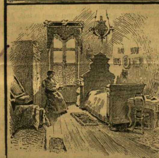
EGY SZOBA AZ OTTHONBAN.