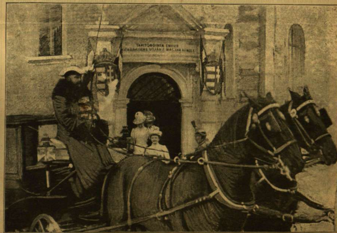
Ellinger Ede pillanatnyi fényképe után.