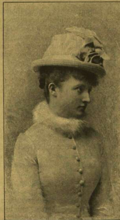
MÁRIA DOROTHEA FŐHERCEGNŐ.