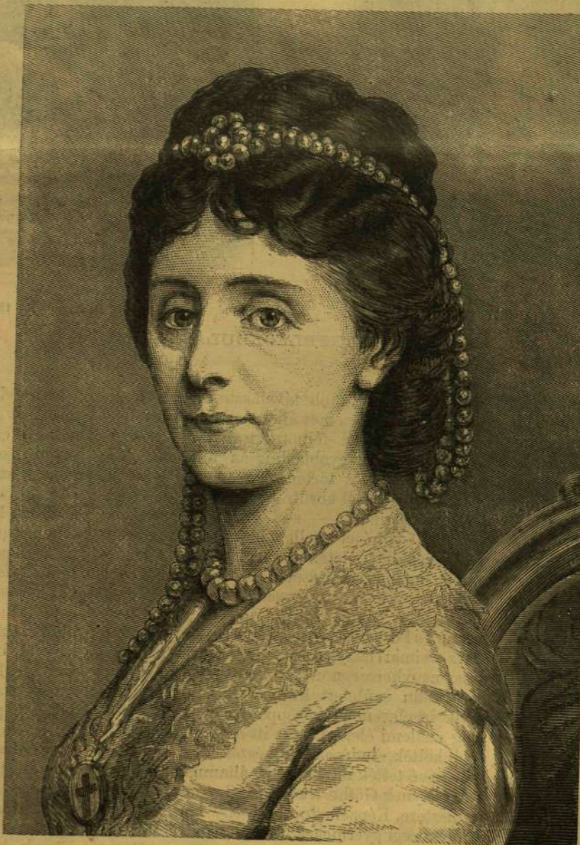
AUGUSZTA NÉMET CSÁSZÁRNÉ, I. VILMOS CSÁSZÁR ÖZVEGYE.

* A jégdarabok nagyságára nézve számos rendkívül hangzó hiteles adat maradt fenn. Darwin szerint a délamerikai pámpákon alma-nagyságú jégdarabok hullottak, melyek nagy állatokat is megölték. Volta szerint 1787 apr. 20-án, midőn egy zivatar Como városát elpusztította, 18 lats jégcséppel is hullottak. Halley 10 latsokat látott. Nöggenrath szerint 1822-ben május 7-én Bornban 4—26 lats jégdarabok hullottak. Abich 1869-ben a Kaukázusban galambtojás nagyságú s részben igen szép rhomboéder alakú jegeket látott. Hasonló jegecsalaku darabok hullottak le 1874 június 21-én Lyonban.