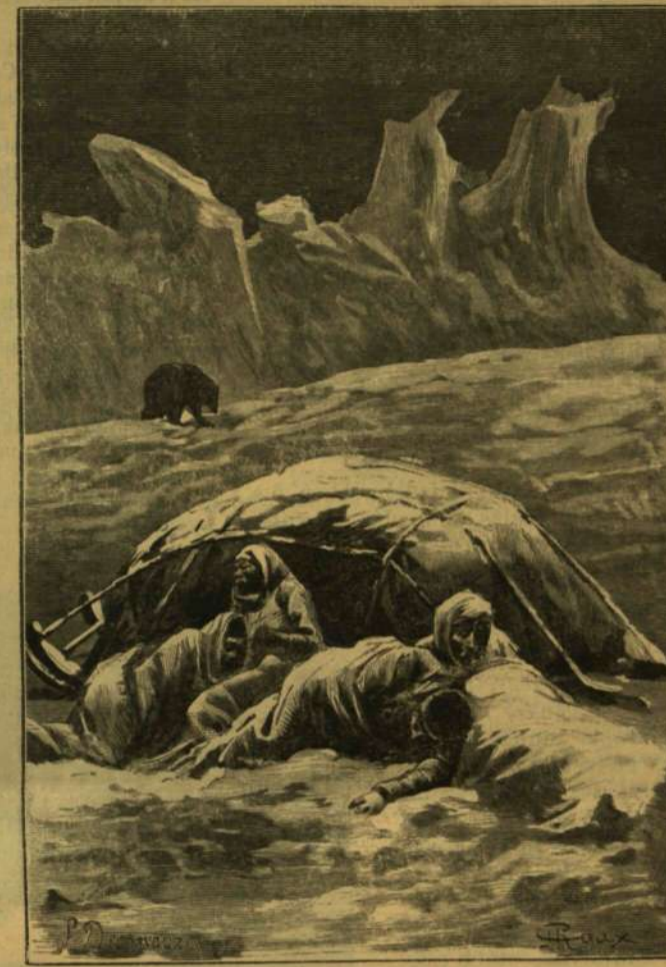
A MERÉSZ BELLOT, KI 1853-BAN HALT MEG.