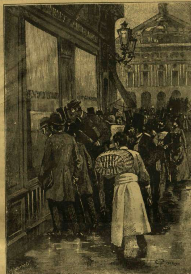
A HIRDETÉST A „NEW-YORK HERALD” KIADÓHIVATALÁBA HOZTÁK.

Hetvenkilencedik évében ragadta el a halál, s e hosszú életen keresztül része volt mindenben, a mit az élet változatossága a halandók