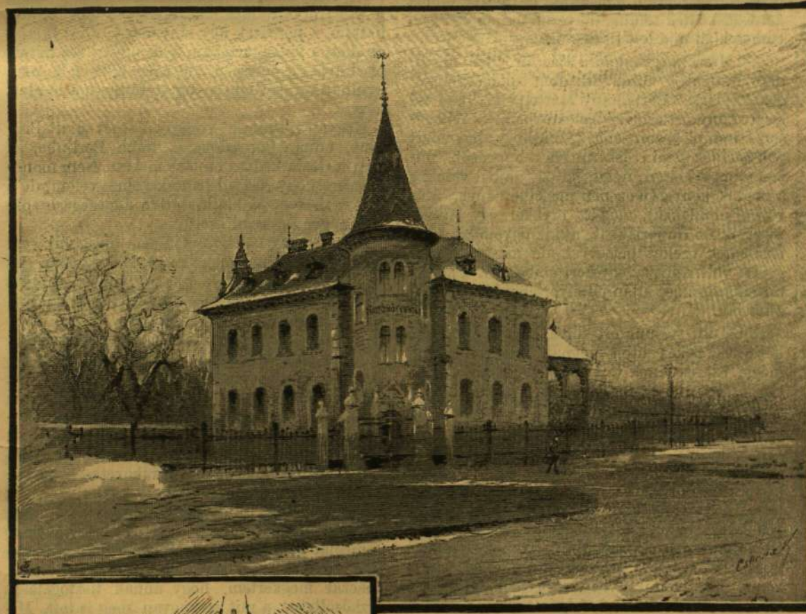
A TANITÓNŐK OTTHONA.