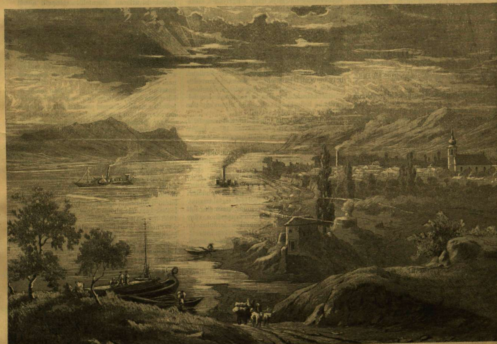
SZOBB A DUNA MELLETT.