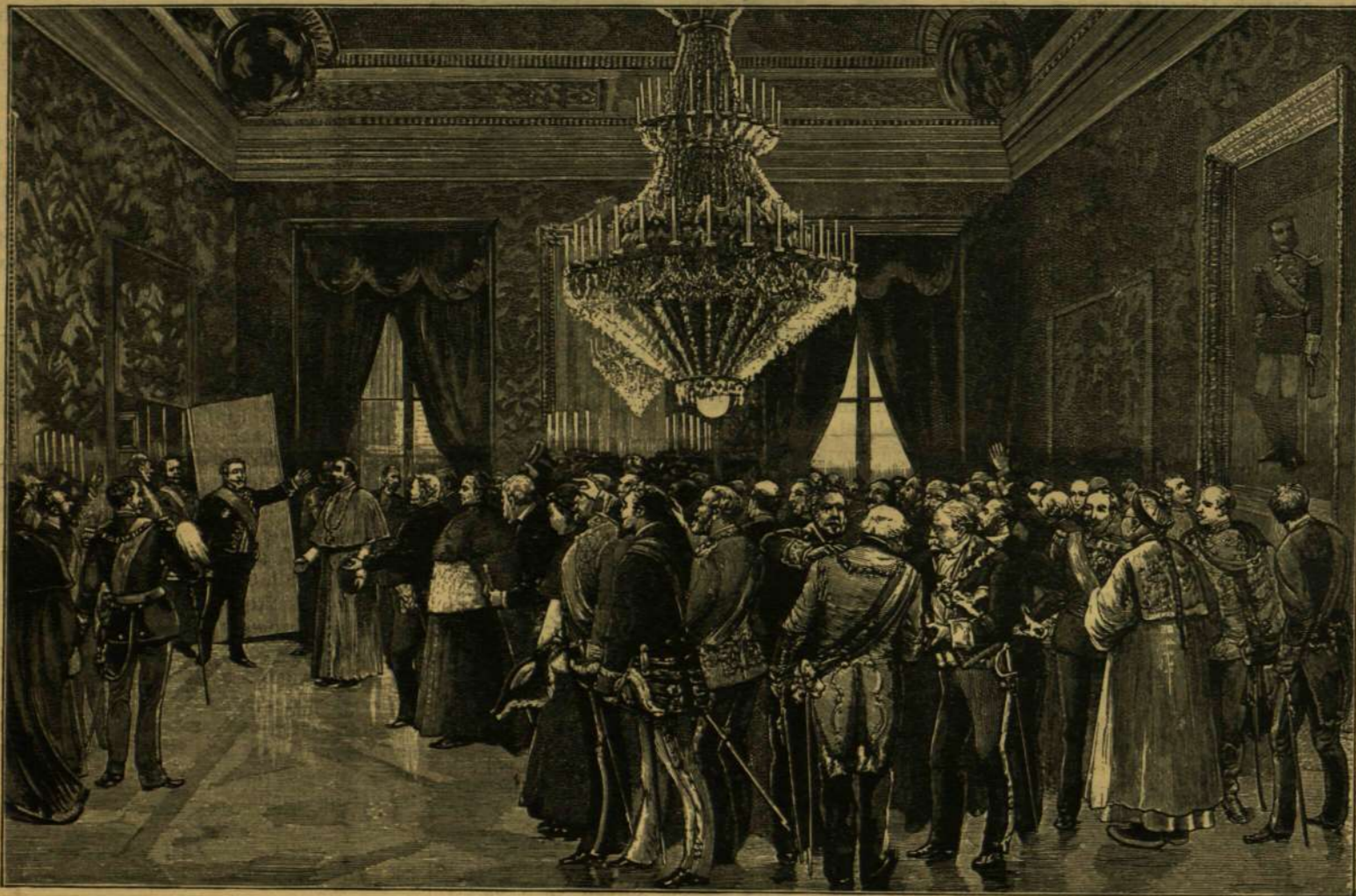
A SPANYOL MINISZTERTANÁCS ELNÖKE KIHIRDETI A SPANYOL KIRÁLY SZÜLETÉSÉT A MADRIDI KIRÁLYI PALOTÁBAN. (1886. MÁJUS 17-ÉN.)

* Influenza jelmezben jelent meg egy nő Szent-Petervárt az álarcos bálna. Keleties öl-