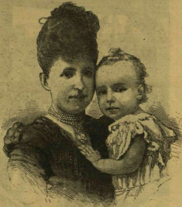
ALPONZO SPANYOL KIRÁLY, ANYJÁVAL KRISZTINA URALKODÓ KIRÁLYNŐVEL. (1890.)