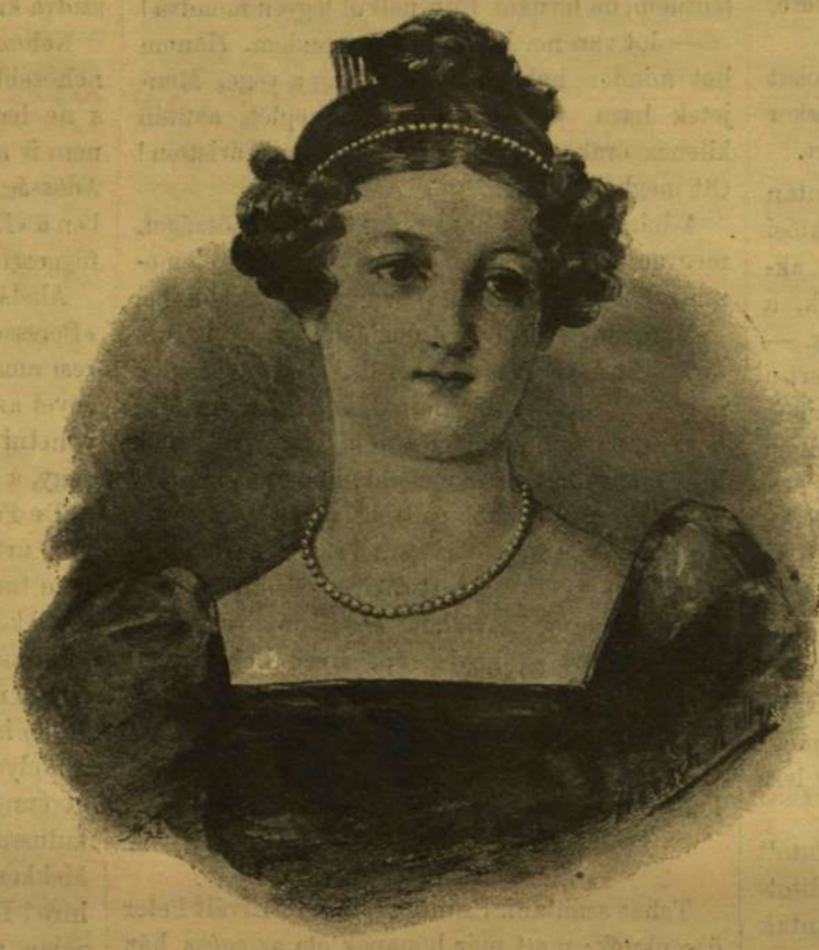
Markó Károly miniatúr-festménye után rajzolta Hirsch Nelli.

A keszthelyi csikósok nagyra voltak vele, hogy ők csak a gróf emberei, míg a huszárkáplár azt vitatta, hogy az ő gazdája mégis nagyobb ur, mert ennek még az ő grófjuk is szolgál.