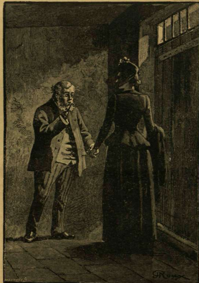
IGY VÉGZŐDÖTT A PÁRBSZÉD.