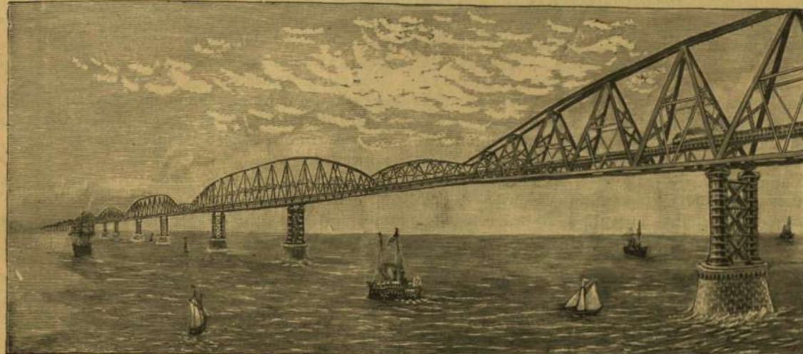
A CALAISI CSATORNA FELETT, ANGLIA ÉS FRANCZIAORSZÁG KÖZÖTT TERVEZETT HID.

* Villamos vasut az éjszakai sarkon. Szent-Pétervárról Archangel sarkvidéki városok villamos vasutat akarnak építeni, mely a Balti- és Fehér-tenger közt levő 800 kilométernyi távolságot kötné össze, s különösen a sarkvidéki kereskedés előmozdítására szolgálna. Egy kilométer mintegy 60,000 forintba kerül.