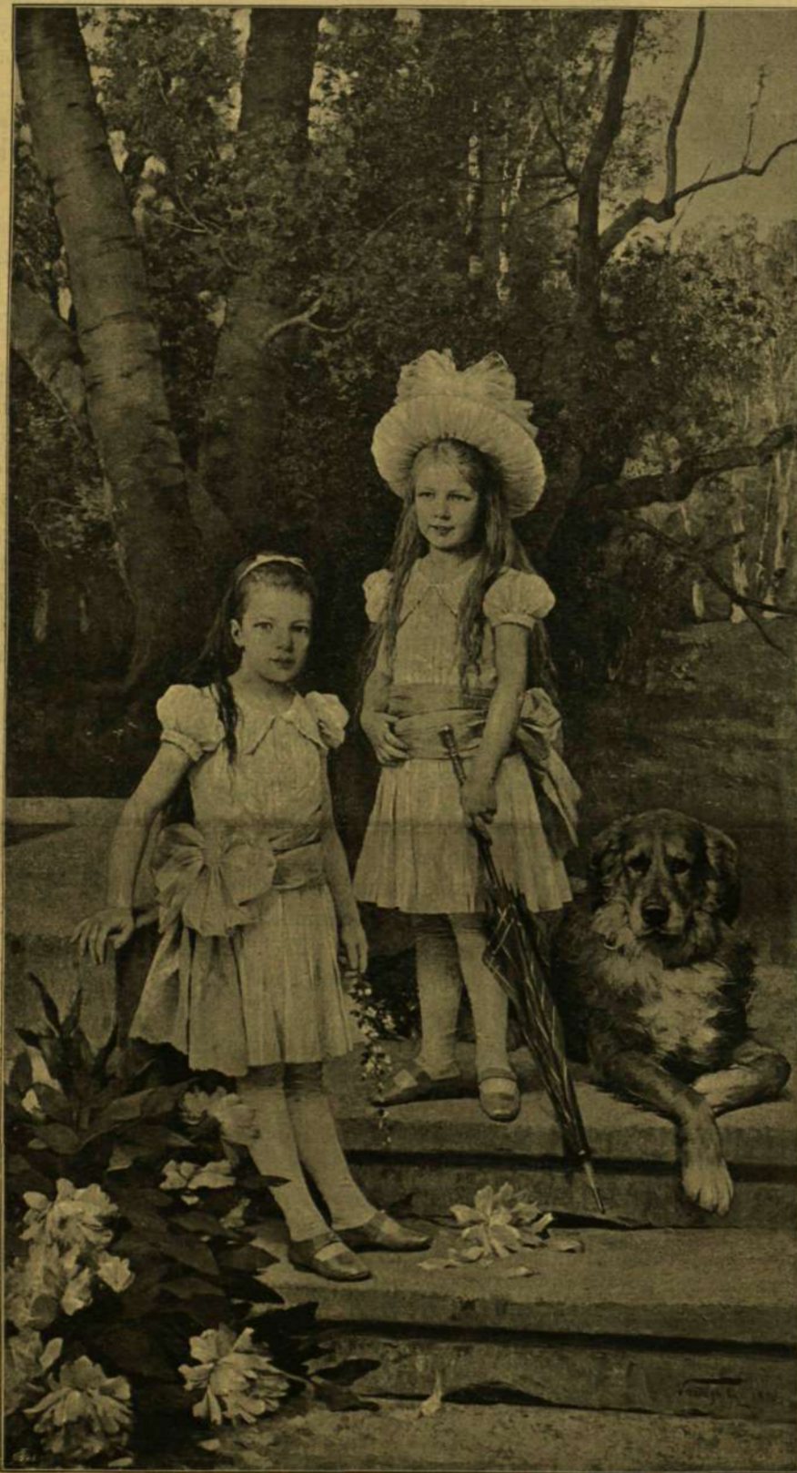
ERSZÉBET ÉS KLOTILD FŐHERCEZGNŐK ARCZKÉPEI.

Nem nevelték a világtól elrekesztett külön főúri légkörben; hogy az életet ismerje, azzal érintkezék s benne okosan élni tudjon: őt is, mint a többi testvéreket, köziskolába adták, s a gymnasiumot a budapesti kegyesrendiekéül végeztették velök. Gyula utóbb a bonni egyetemre ment s mint egykor atyja, — legbensőbb barátjával, Széchenyi István nal, — ő is beutazta, ismételve is, a külföldet, hogy lássa a világot. Volt egyszer Amerikában is sokat időzött Svájcban , a szabadság földén, hol édes anyjának genfi háza gyülekező helye volt az ország felszabadítása érdekében működött magyar emigránsoknak. A fiatal gróf ez időben többször végzett politikai megbízatást is.