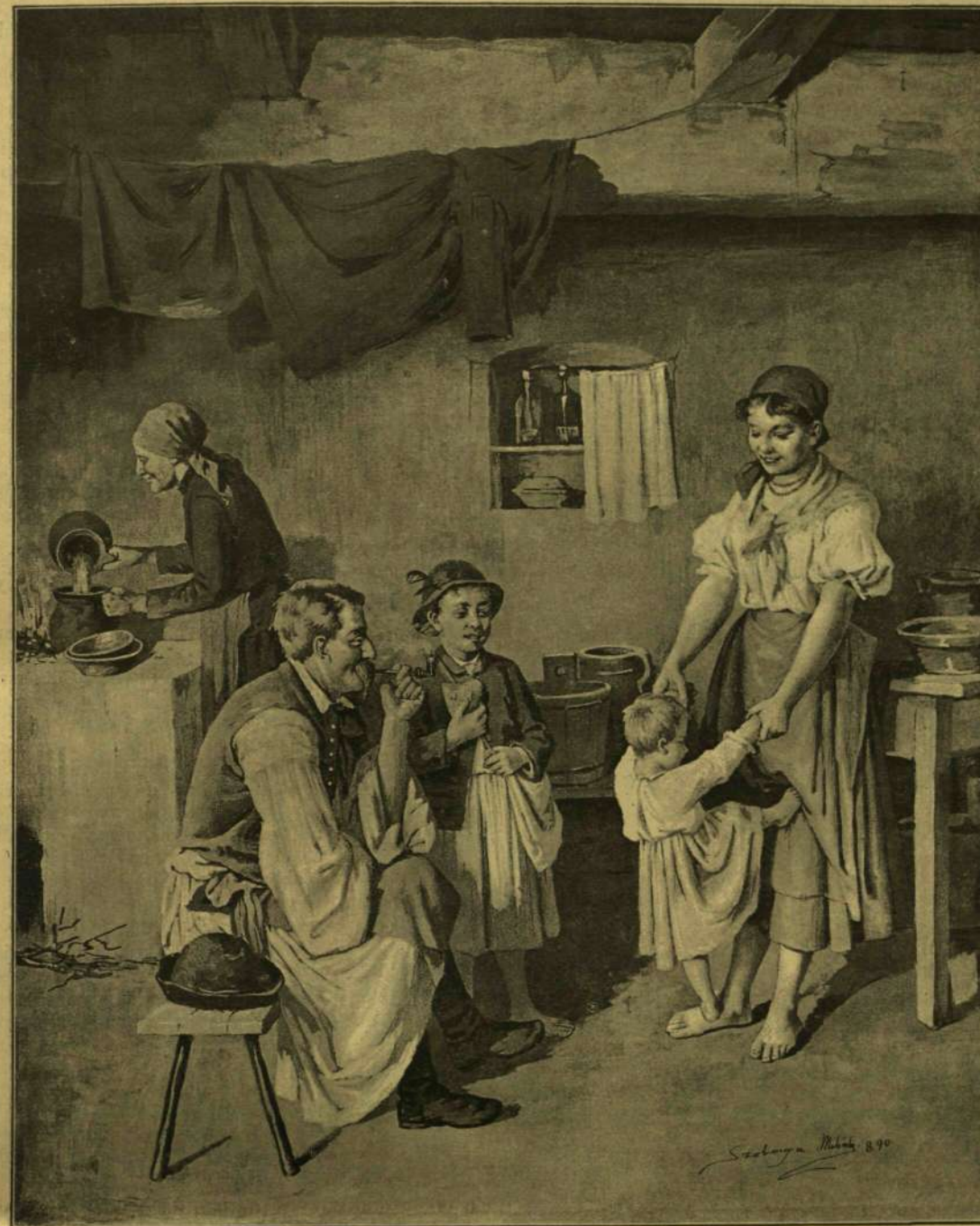
— MEGLÁSSÁTOK EBBŐL A KÖLYÖKBŐL MÉG ÖREG BÍRÓ LESZ VALAMIKOR. Szobonya Mihály rajza.

— Ne csak induljunk pedig, hanem kotródjunk! — felelt neki a patikárus. Hallod-e azt a