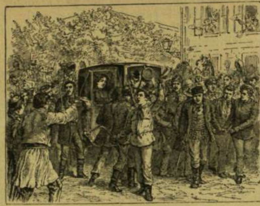
Natália száműzetése Szerbiából. — A tanulók visszaviszik Natália kocsiját lakására.

Midőn a jelenlegi szerb király anyját, Natáliát, a regensek Milán királylyal kötött szerződésük értelmében, Belgrádból erőszakkal eltávolították s a szerb főváros utcáin vér is folyt e miatt: nemcsak mi magyarok, de a külföldön is sokan megdöbbenéssel tekintettek délkelet felé, aggodva, hogy vajon nem most fog e fölrobbanni az a sokszor emlegetett löporos hordó a Balkán-félszigeten? Szerencse, hogy ez a véres epizód — legalább egyelőre — súlyosabb következmények nélkül maradt; de maga az esemény minden-