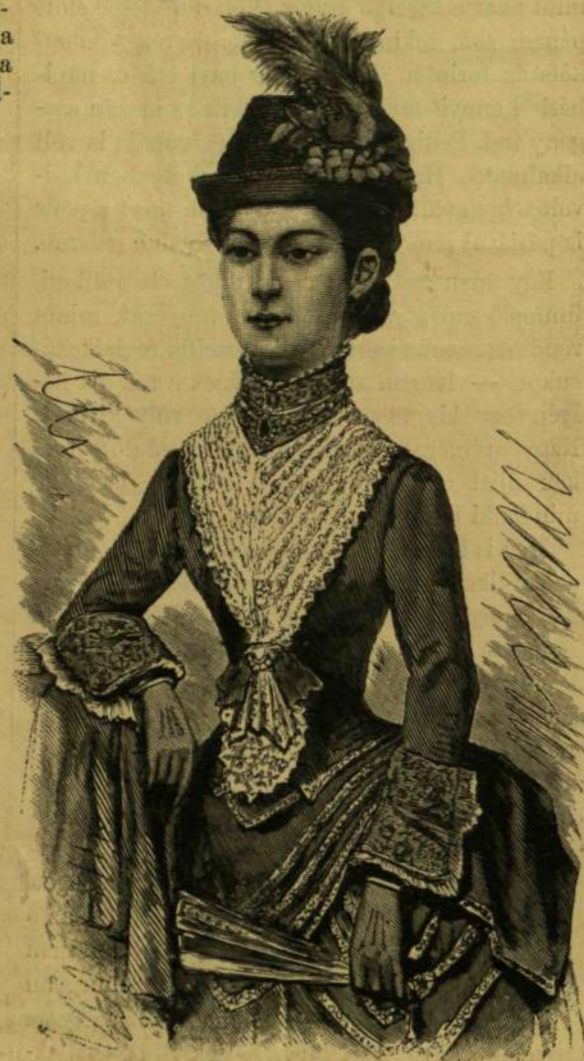
A JAPÁNI CSÁSZÁRNÉ EURÓPAI ÖLTÖZETBEN.