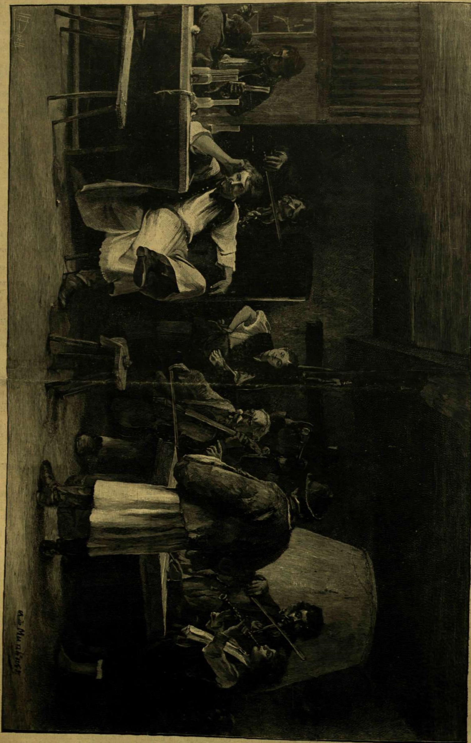
OSARDA BEISEJJE. — MUNKÁCSY MIHÁLY DRÓGLÁBÁB PESTIENYÉ.