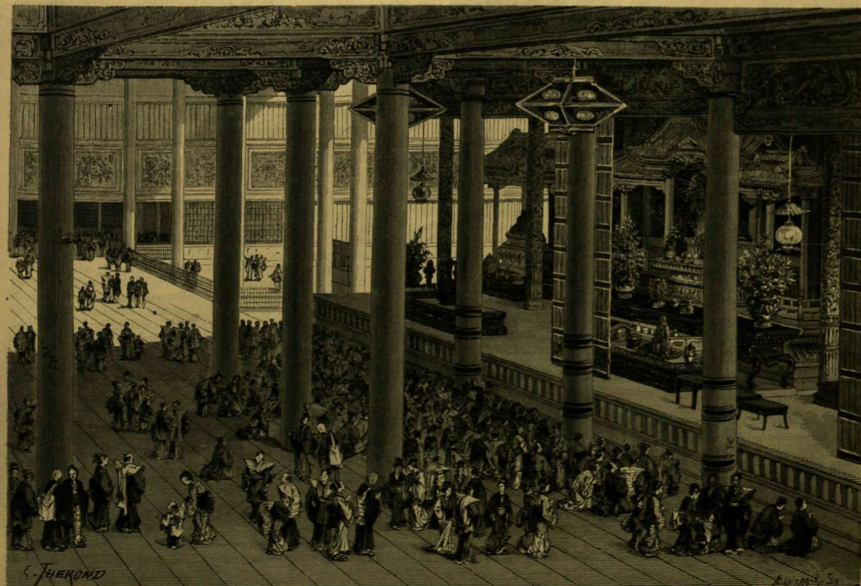
AZ ASAKUSA-TEMLOM TOKIÓBAN.

1868-ban, midőn a szerződés megújításáról volt szó, az angol diplomataik voltak azok, a kik, a japán történelmet tanulmányozva, reá-