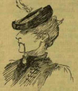
A legjobb csárdás táncos (Bodzás-Ujlak).