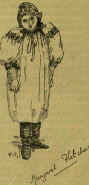
A kis széky (Bánffy-Hunyad).