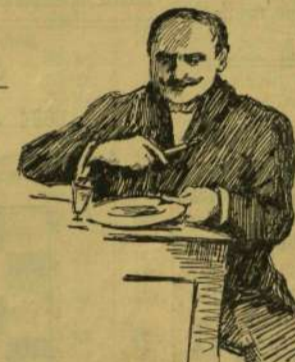
A cigányprimás vacsorája.