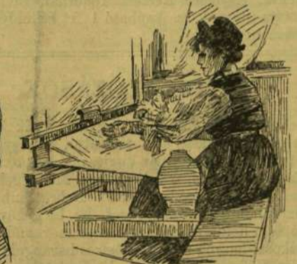
Szövés (Gyergő-Szárhegy, Csik-megye).