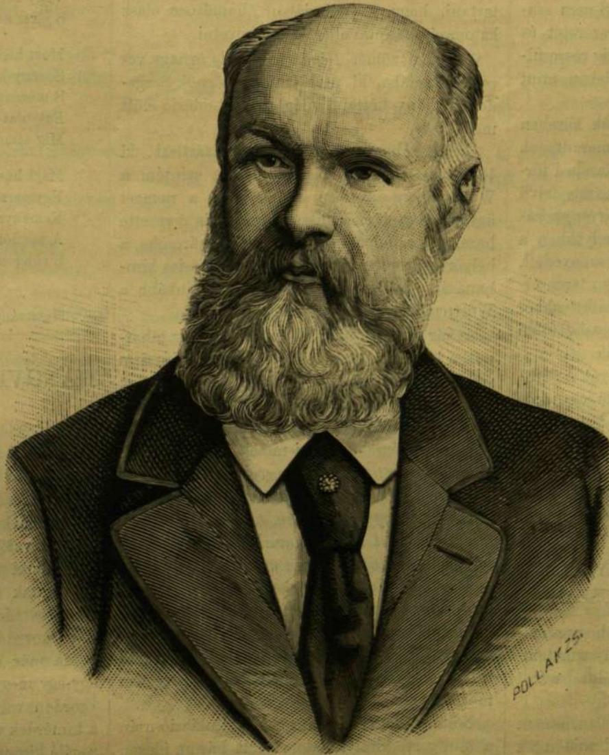
I. KÁROLY, WÜRTEMBERGI KIRÁLYA.