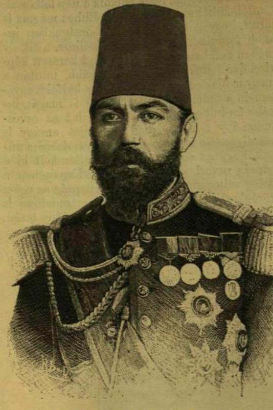
Dzsevad pasa, az új török nagyvezir.

Dzsevad pasa, az új nagyvezir, aránylag véve ismeretlen ember a török katonai és hivatalos körökön kívül, s ezért eddigi pályafutásából nehéz megítélni, mennyiben fogja megállani helyét a szultán által reá bízott új állásban. Őgy utván