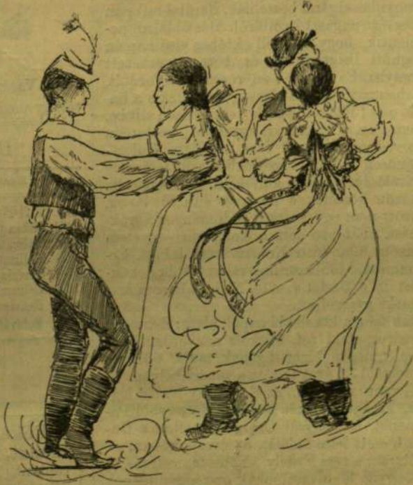
Paraszt lakodalom (Bodzás-Ujlak, Zemplén).