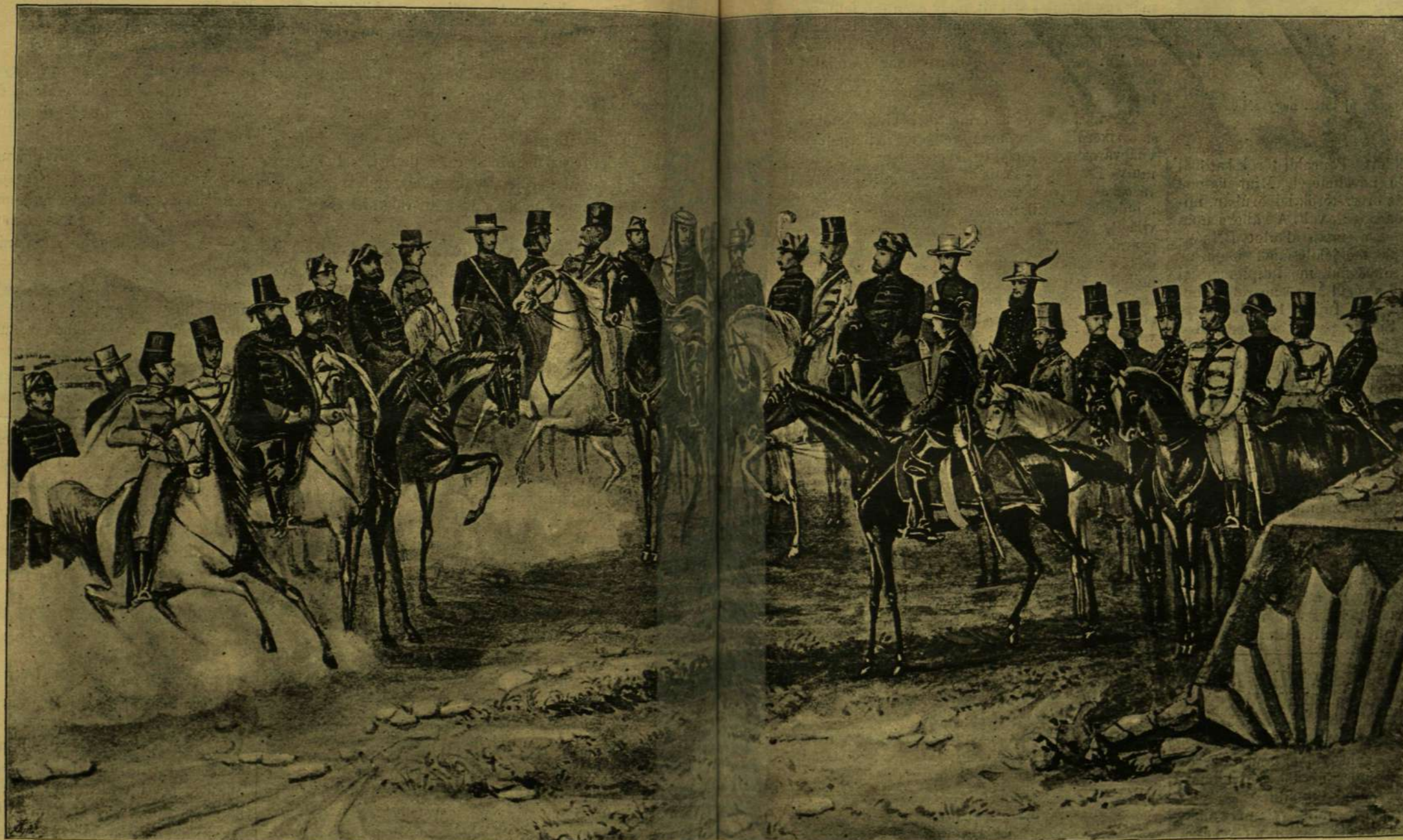
GÖRGEI VEZÉRKARI ÉS KATONAI KISÉRETE.