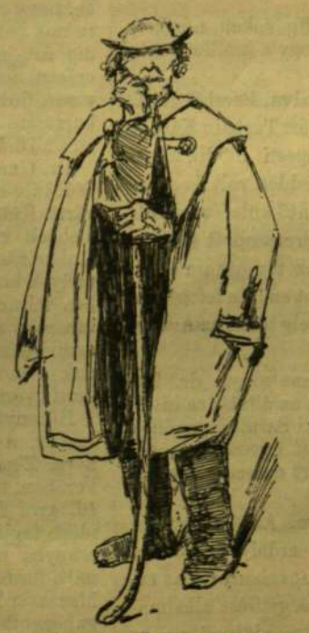
A vén gulyás (Velejte, Zemplén).