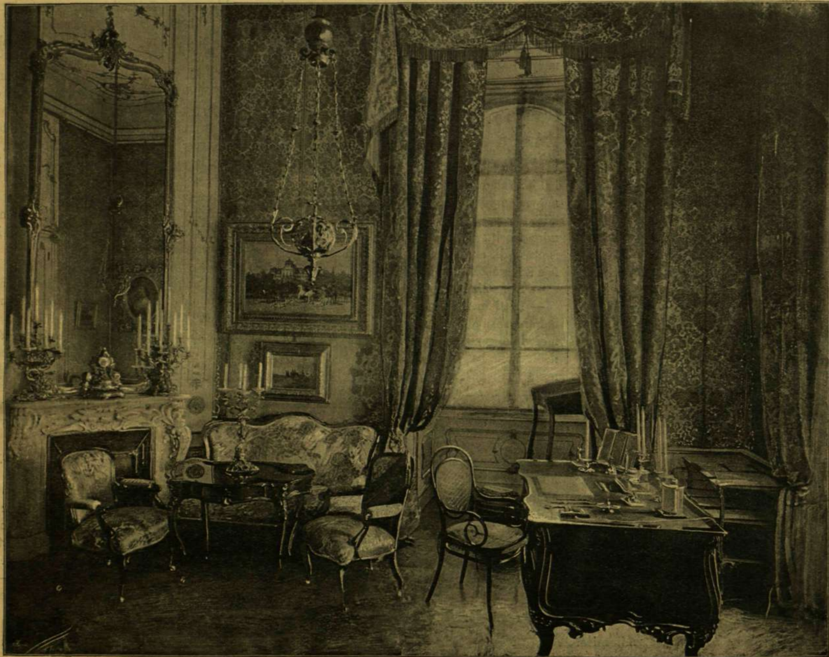
Báró Stillfried fényképe után.

Ilyen formán kel aztán még el egy sereg mesés