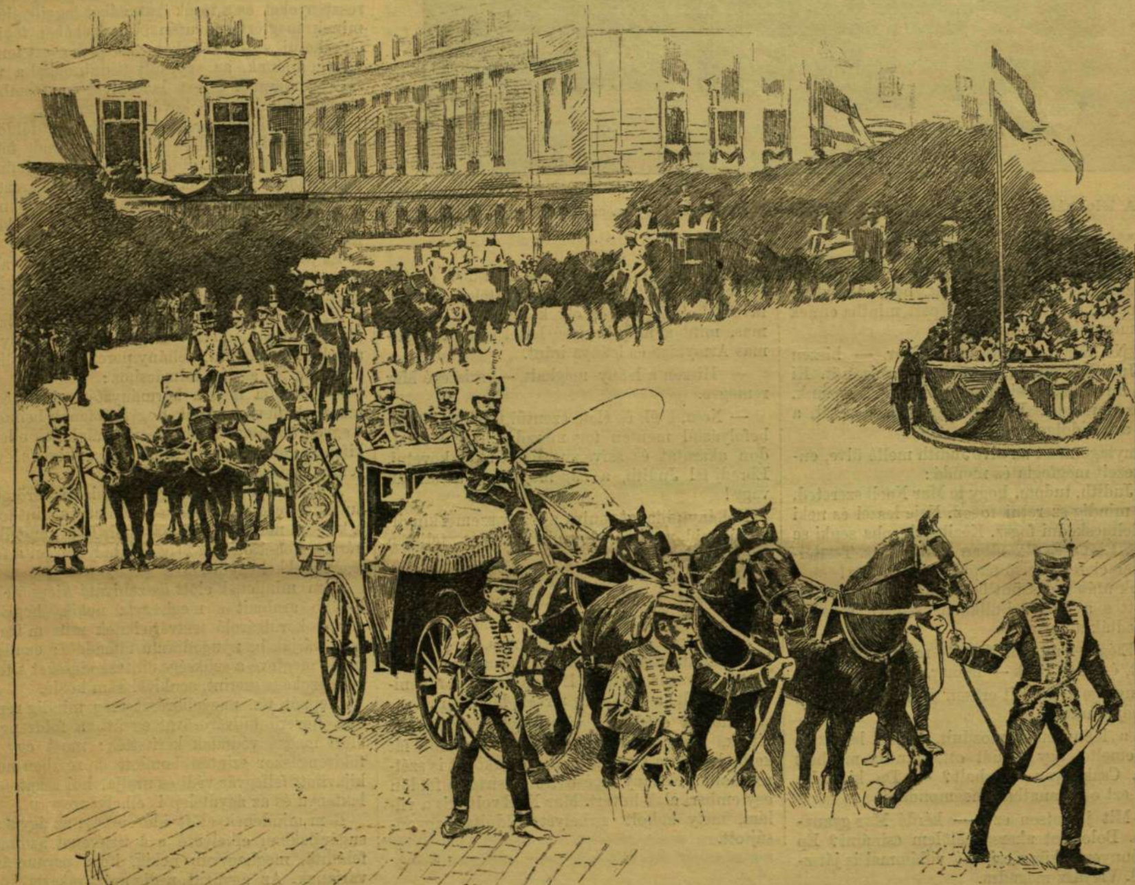
Janyik Mátás rajza.

* A zsák szó eredete. A zsák szó feltűnően hasonlít egymáshoz csaknem minden művelt nép nyelvén. Egy humoros nyelvész ezt a rokonságot azzal magyarázza, hogy a Babel-torony építésénél, midőn a biblia szerint az emberek nyelve megzavarodott, a munkások zsákjaikat élmeli szerekkel megtöltve osztották szét a világ minden részébe s ezért mindeneknek emlékeztében megmaradt a zsák eredeti elnevezése.