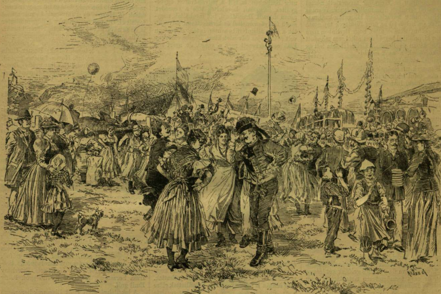
A NÉPÜNNEP A BUDAI VÉRMEZŐN.