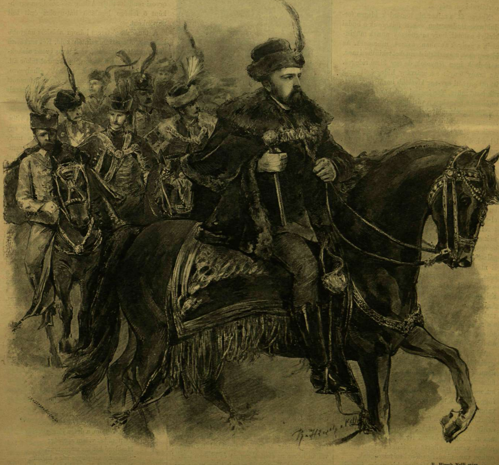
A KORONÁZÁS EMLÉKÜNNEPE. — A DISZBRANDÉRIUM ELSŐ CSAPATA, ELÉN GRÓF KÁROLYI ISTVÁNNAL.

Előfizetési feltételek: VASÁRNAPI UJSÁG egész évre 12 frt fél évre 6 frt. Csupán a VASÁRNAPI UJSÁG egész évre 8 frt fél évre 4 frt. Csupán a POLITIKAI UJDONSÁGOK egész évre 5 frt fél évre 2.50. Külföldi előfizetésekre a postalg megfizetésű vitélőj is csatolandó.