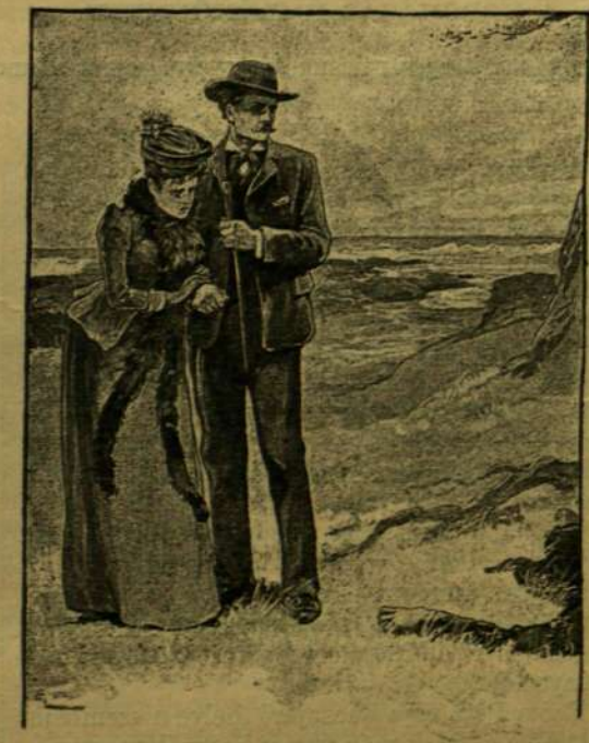
A lélekvásár. — Látták, hogy a villám a legterebélyesebb fát kettéhasította.