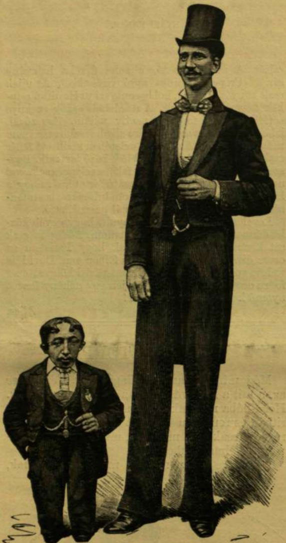
ÓRIÁS ÉS TÖRPE A BERLINI PANOPTIKUMBAN.