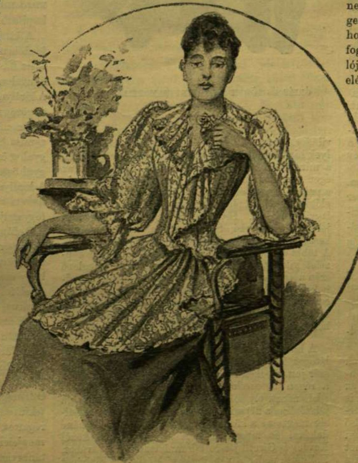
NYÁRI OTTHONI RUHA.

Az persze már nem felel meg a valóságnak,