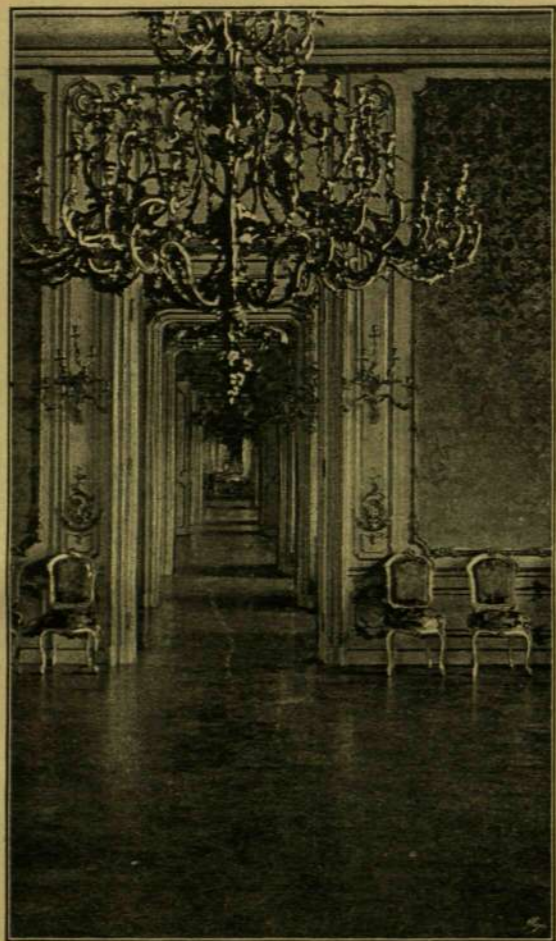
Baró Stillfried fényképe után.

A butorzat fődarabja a mahagoni-fából faragott széles, alacsony íróasztal, a melyen arany-bronz írogarnitúra, két gyertyatartó s egy villamos szivargyújtó gép van elhelyezve. Az asztal előtt közönséges nádfonatú Thonet-szék van.