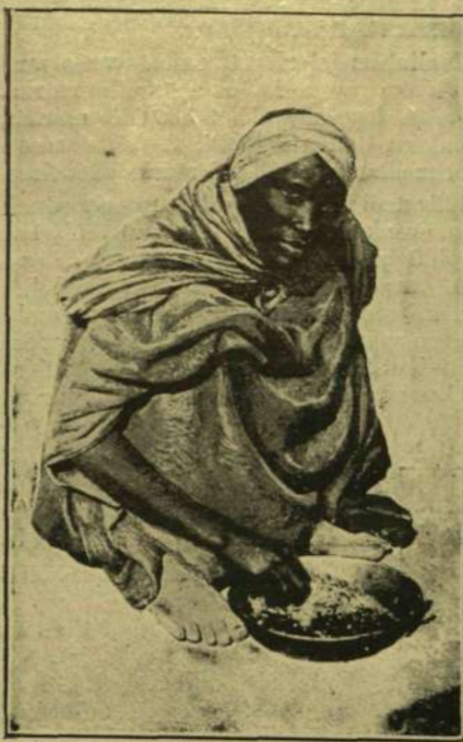
Dahomeji benszülött étkezés közben.

A vásárosok helyét lassanként rendes, bejegyzett kereskedők foglalták el. Így a század elején 94 nagykereskedő, 50 fűszeres, 25 rövidárú, 15 posztókereskedő, 12 vászonkereskedő, 40 divatárú, 6 illatszerezés, 25 vaskereskedő, 7 papírkereskedő, 15 sajtos, 7 bor-nagykereskedő, 17 káposztavágó, 246 keresztény és 12 zsidó szatócs, 6 keresztény és 25 zsidó zsidárú, 52 dohánykereskedő, 31 lisztes, 3 lócsiszár és 9