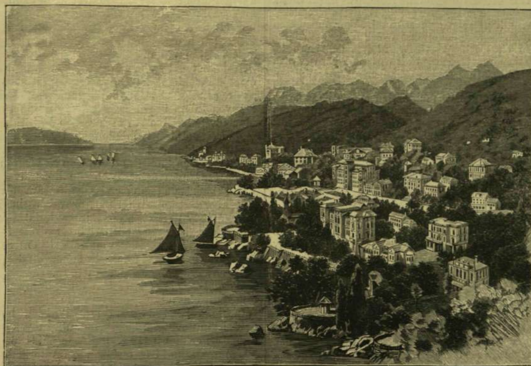
ABBAZIA ÉJSZAK FELŐL.

* Tollakkal jó napvilágra tojásából a talagalla nevű ausztráliai madár, sőt tapasztalták azt is, hogy a pelyheit már a tojásban levedli. A talagalla nem maga költi ki a tojásait, hanem rendszeren rothadni kezdő gaz közé tojik, hol a meleg magától kikölti a madárakat; más ehhez hasonló eset a mai madárvilágban nincs.