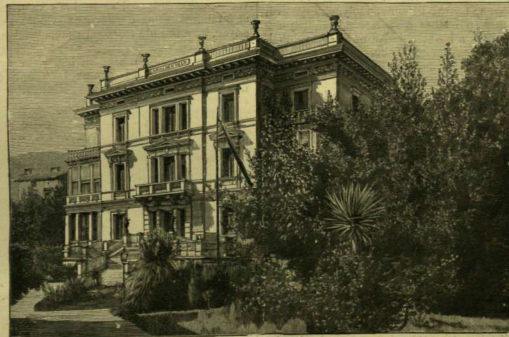
AZ AMÁLIA-VILLA ABBAZIÁBAN.

Hosszú, sok örömmel és búval teljes 40 év