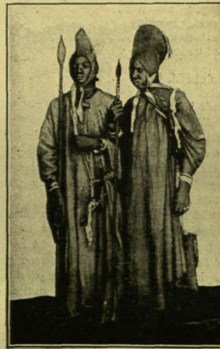
Dahomeji fiatalok ünneplő ruhában.

Hogy a benszülötték úgy félnek az európai-tól, az abból magyarázható, hogy vallásuk tanítja őket arra. A civilizálás itt igen nagy akadályokra talál épen a fanatikus vallásban. A benszülötték nagy része, ha enged is a tértésnek, ezt csak hiúságból teszi, hogy a többenél különbnek tarthassa magát, s hogy hasznót húzzon belőle. Régi szokásaikat azonban így sem hagyják el.