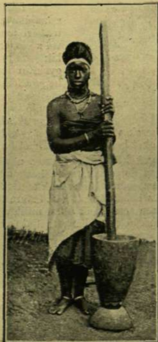
Dahomeji amazon béke idején.

Egy mérő búza öt forint; egy szak krumpli negyvenhat krajczár; egy pár csirke harminczhat kr; huszonkét tojás huszonégy kr; egy iteze tej öt kr; egy iteze bor nyolcz kr; egy pohár sör hat kr; egy iteze pálinka tizenkilencz kr; egy mázsa finom liszt hét frt harminczhat kr; a feketé liszt pedig két forint harminczhat