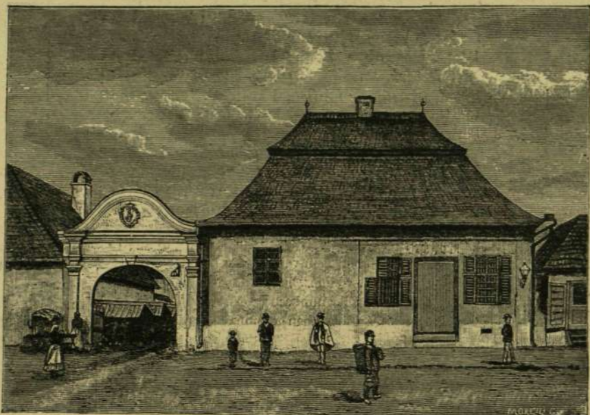
BÁRÓ JÓSIKA MIKLÓS SZÜLŐHÁZA TORDÁN.