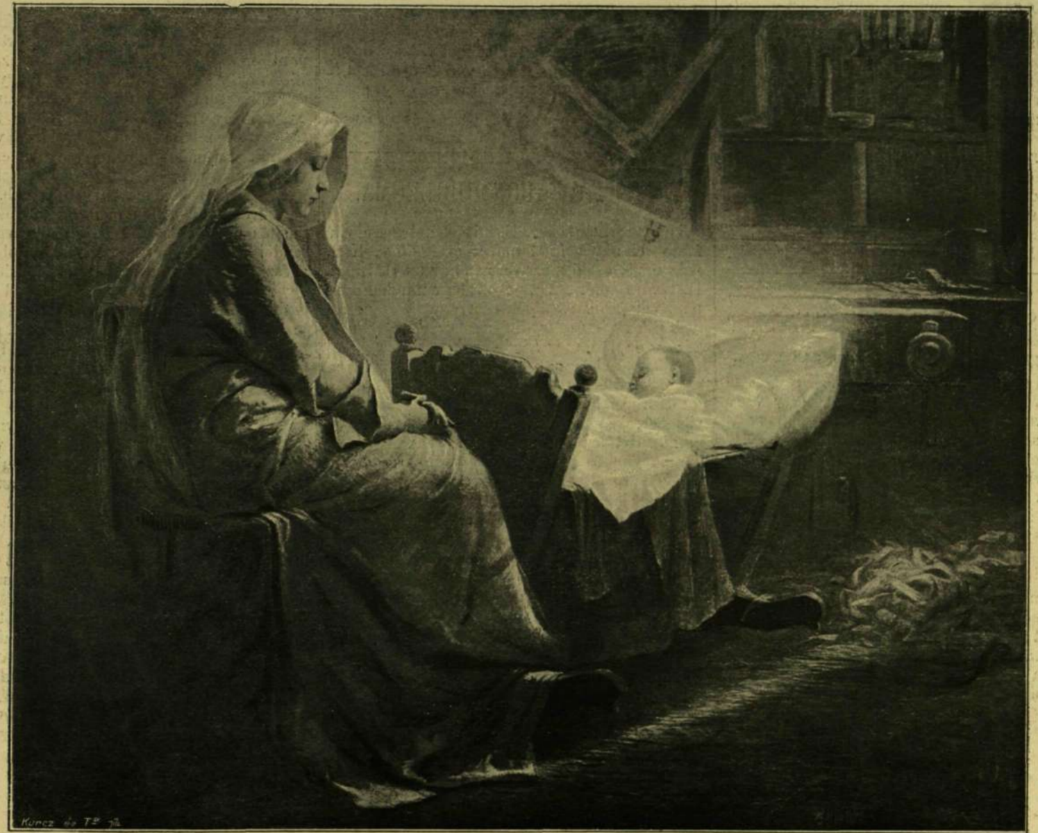
MÁRIA JÉZUSSAL. — Ujváry Ignác festménye a Képzőművészeti Társulat tavaszi kiállításán.

A műcsarnok tavaszi kiállításán is, mint mindig, az életkép a legtöbb, ezekben kívánnak leginkább feltűnni festőink, ezek tárgyat kínálják legközvetlenebbül a mindennapi élet s ezt a genret szereti legjobban a közönség is. A történelmi tárgyú festményt rendszeren nagyon kevés, most alig van egy; a vallásos tárgyúknak sem szokott nagyobb termékek lenni, mert az ilye-