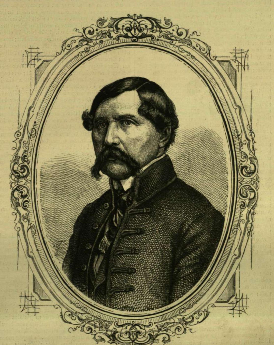
BÁRÓ JÓSIKA MIKLÓS. 1861. évi arcképe.

naivsága fogadhatta el igazi regényekül, mely megalapozott azzal, ha magyar nyelven, hazai tárgyú eseményeket s Dugonics erős magyar érzésével megfűszerezve olvasható. Kármán «Fanni»-ja , mely már magasabb igényeket is kielégítő költői alkotás, egyedül állott s ismeretlenül eltemetve maradt az «Uránia» hasábjain. Fáy András megpróbálkozik a magyar társadalmi regénnyel a «Bélték ház»-ban, de ő előtte nem a regényiró czélzata állott, hogy t. i. az élet tárgyilagosa rajzát adja, rábizva arra, hogy hasson a művészet törvényeivel; ő itt is, mint mesében s egyéb társadalmi műveiben, egyenesen tanítani és reformálni akar; s azért, műve egyéb hiányait mellőzve, a tanító elbeszélés hatását teszi ránk. Azt a műfajt, mely