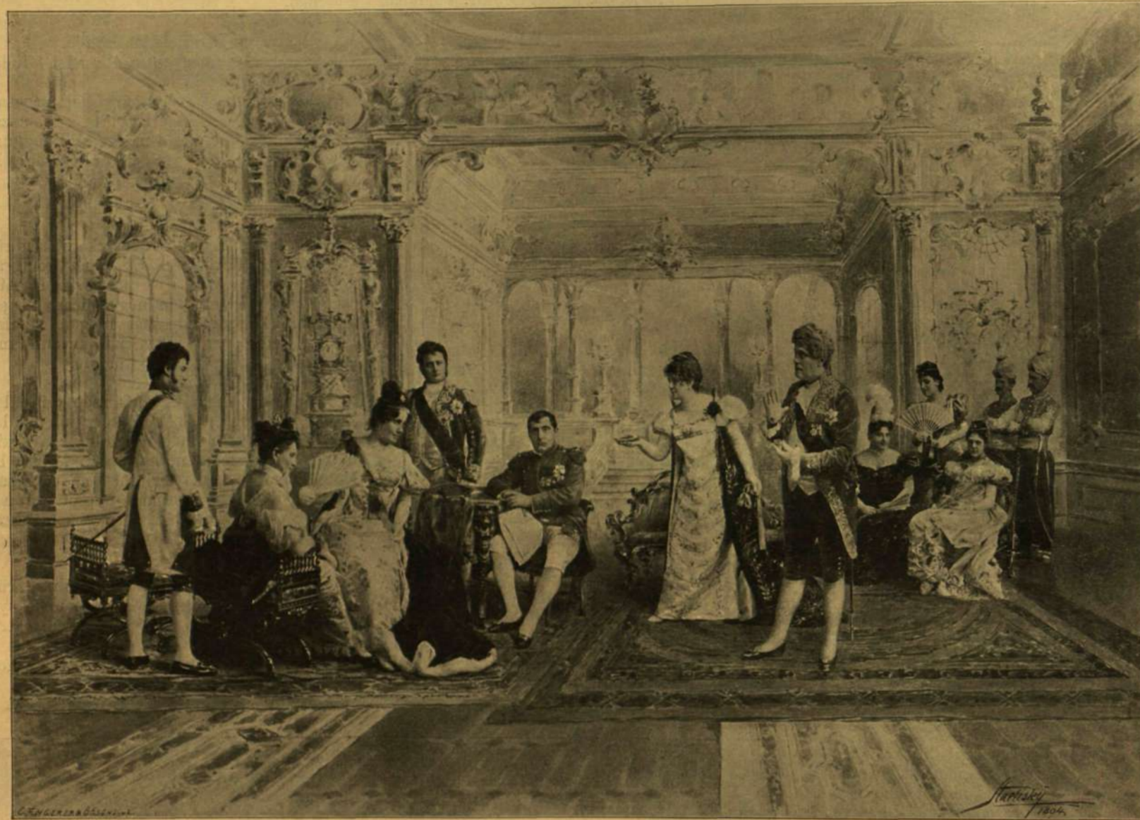
A „SZÓKIMONDÓ ASSZONYSÁG” A NÉPSZÍNHÁZBAN.

* Miért jó, ha nőszemély a hóhér? Bécsben a hóhéri állás betöltésekor egy nő is pályázott s kérés