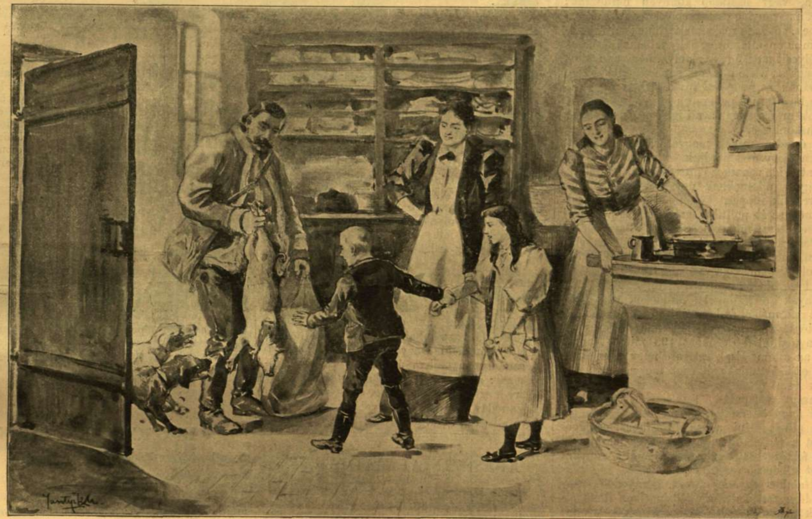
AZ ÚJ-ÉVI MALACZ.

Napoleon gógós nővéreit nagyon boszantja, hogy a mosónőből lett marsalné oly nagy mér-