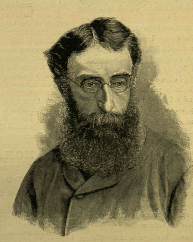
SERMONETA HERCEG KÜLÜGYMINISZTER.