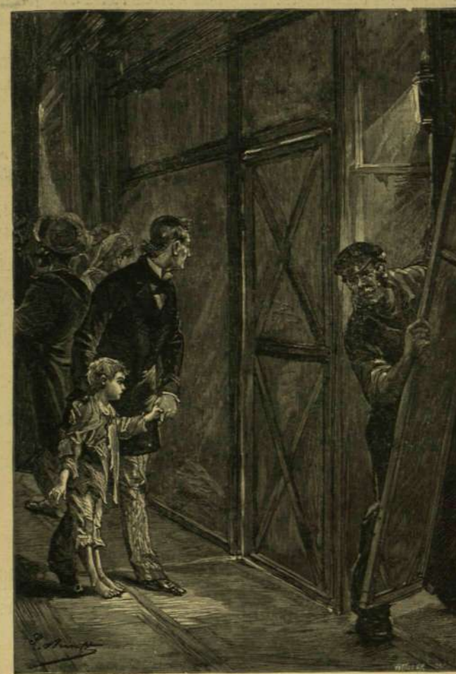
Várta a jelenetet.

A kunyhó ajtaja kinyílt és a rendező betolta a gyermekét, épen a végszónál.