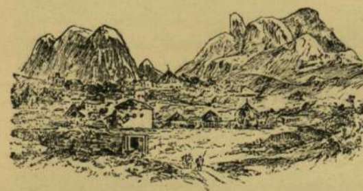
AZ ADUAI ERŐD.

Az aduai vereség, a melyben az olaszok legálább 7000 embert és 72 ágyút veszítettek el a félévad és tökéletlen fegyverekkel rendelkező abessziniaiakkal ellen, lázas izgatottságha hozta az olasz népet. Népgyűlések és tüntetések voltak az ország minden nagyobb városában, a parlament forrongott, s a király kénytelen volt régi hű tanácsosát, Crispit elbocsátani a miniszterelnökségből. A minisztereknek kívül azonban magában az afrikai hadseregben is találtak bűnbakot s valószínűleg nagyobb okkal, a főparancsnokot Baratiert tábornokot, kinek eljárása sok tekintetben egészen okadatlanak látszik,