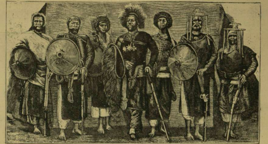
MENELIK ABESSZINIAI KIRÁLY ÉS VEZÉREI.

Az aduai vereség, a melyben az olaszok legálább 7000 embert és 72 ágyút veszítettek el a félévad és tökéletlen fegyverekkel rendelkező abessziniaiakkal ellen, lázas izgatottságha hozta az olasz népet. Népgyűlések és tüntetések voltak az ország minden nagyobb városában, a parlament forrongott, s a király kénytelen volt régi hű tanácsosát, Crispit elbocsátani a miniszterelnökségből. A minisztereknek kívül azonban magában az afrikai hadseregben is találtak bűnbakot s valószínűleg nagyobb okkal, a főparancsnokot Baratiert tábornokot, kinek eljárása sok tekintetben egészen okadatlanak látszik,