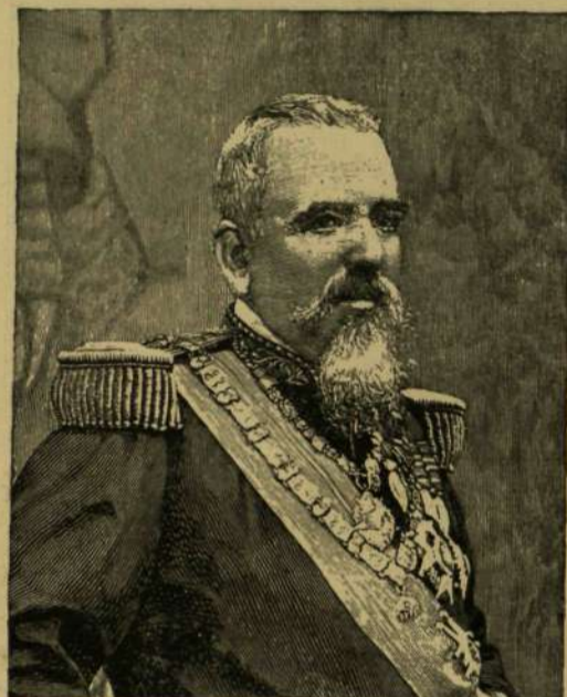
Martinez Campos Kuba sziget volt katonai kormányzója.

A menet legpompásabb látványosságai lesznek a díszhintők, amelyek a koronát, továbbá a korona-