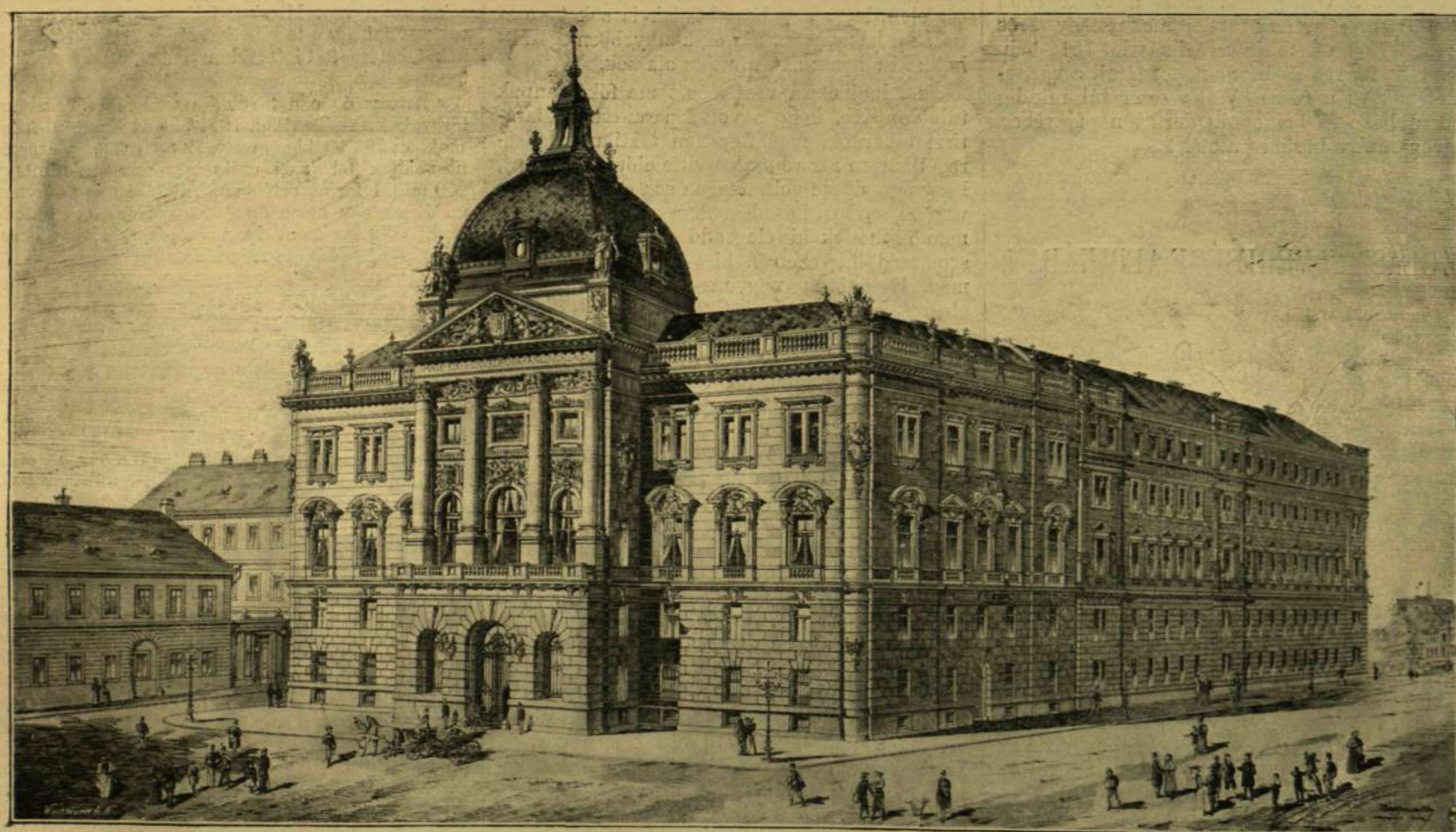
A PALOTA A DISZ-TÉR FELŐL NÉZVE.

A M. KIR. HONVÉD FŐPARANCSNOKSÁG ÚJ PALOTÁJA BUDAPESTEN. — KALLINA MŰÉPÍTÉS TERVRAJZAI UTÁN.