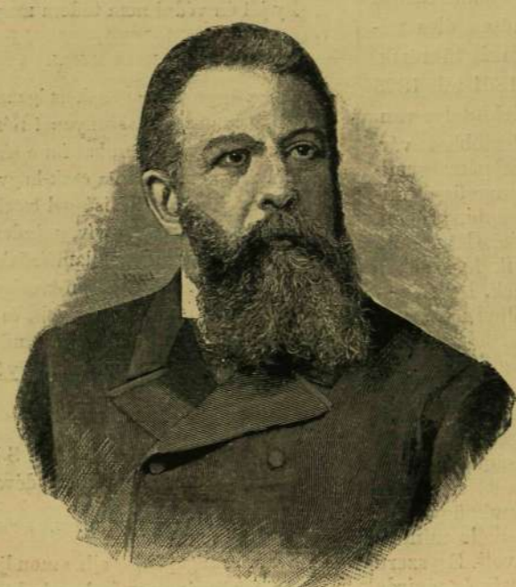
RUDINI ŐRGRÓF MINISZTERELNÖK.

Előfizetési feltételek: VASÁRNAPI UJSÁG egész évre 12 frt, fél évre 6 frt. Csupán a VASÁRNAPI UJSÁG egész évre 8 frt, fél évre 4 frt. Csupán a POLITIKAI UJDONSÁGOK egész évre 5 frt, fél évre 2.50. Kérlek előfizetéshez a postai leg- meghatározott világitól is csatlakozni.