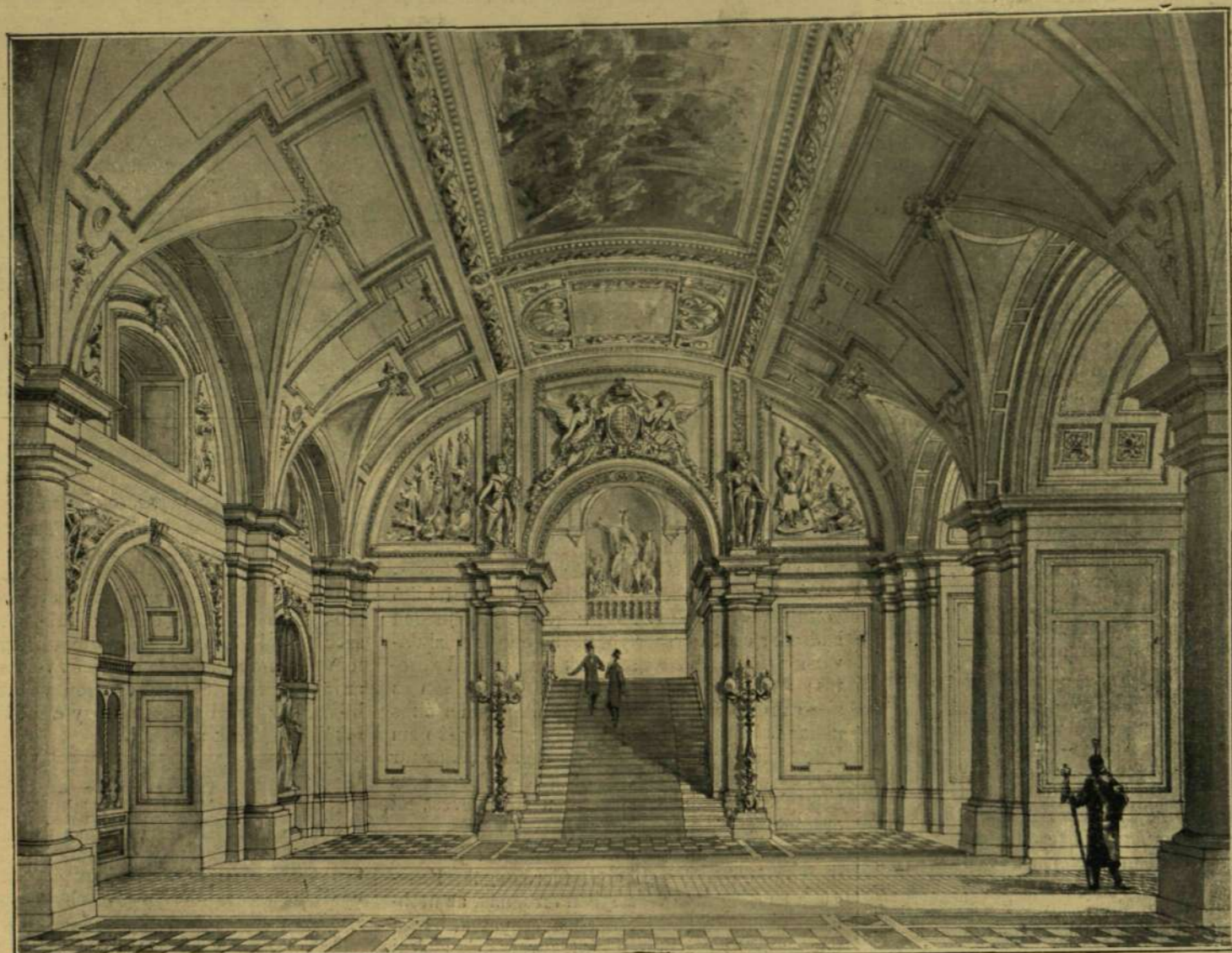
A PALOTA ELŐCSARNOKA.