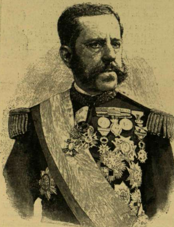
Weyler tábornok, Kuba sziget új katonai kormányzója. A «Politikai Újdonságok» legutóbbi számainak képeiből.

öröket, az országgyűlés két házának elnökségét és a miniszterelnökséget viszik. A koronát vivő hintő két oldalán a koronáőrök megy új egyenruhájában. A menetet lovasság nyitja meg és lovasság zárja be. A korona mellett menő kocsiiban a két polgármester is, kik ősi szokás szerint hajdon fölvel vesznek részt a szertartásban. Az új országházában tartandó közös ünnepi gyűlésen valamennyi jelenlevő, a főherczogok is, állva vesznek részt s épen e miatt csak néhány rövid beszédet mondanak, a melyekre nézve azonban eddig még semmi megállapodás nincs. A főherczogok számára páholyokat rendeznek be, az udvarhölgyek a karzatot fognak gyönyörködhetni a ritka látványosságban.