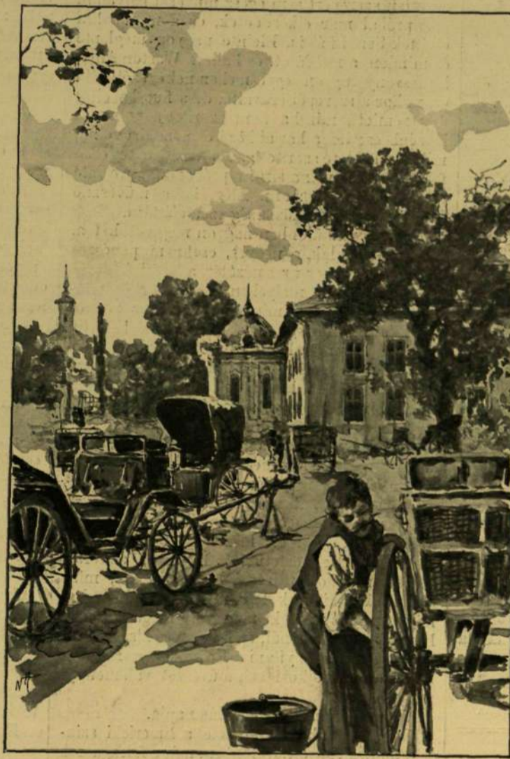
A pázsitos nagy udvaron már annyi koci áll, mint hajdan. Neogrady Antal rajza.

— Hiszem, hiszem, mert néha a megerszett