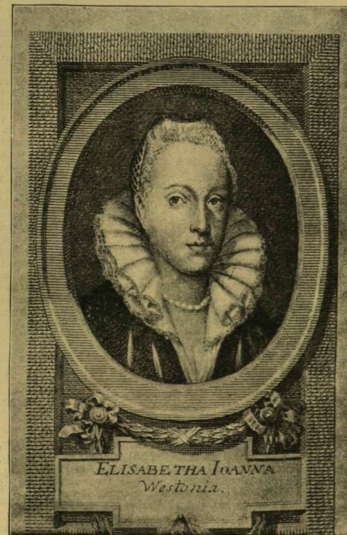
KOSSUTH LAJOS EGYIK ŐSANYJA. — Egykorú metszet után.

Még két kérésem van: 1. ha Ullmann Bernát úr e napokban kegyetekhez pénzst a egy levelet küldött