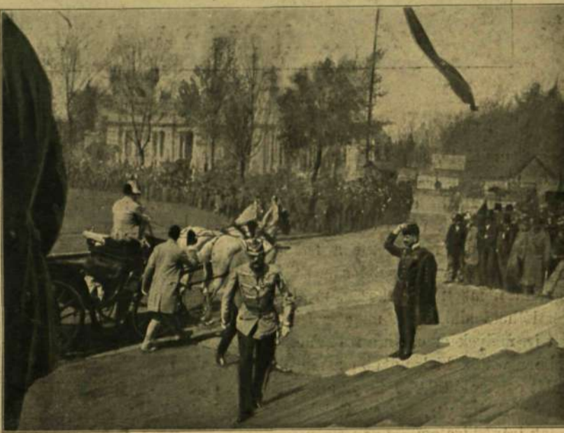
LIPÓT SALVATOR FŐHERCEG MEGÉRKEZÉSE A MŰCSARNOKHOZ.