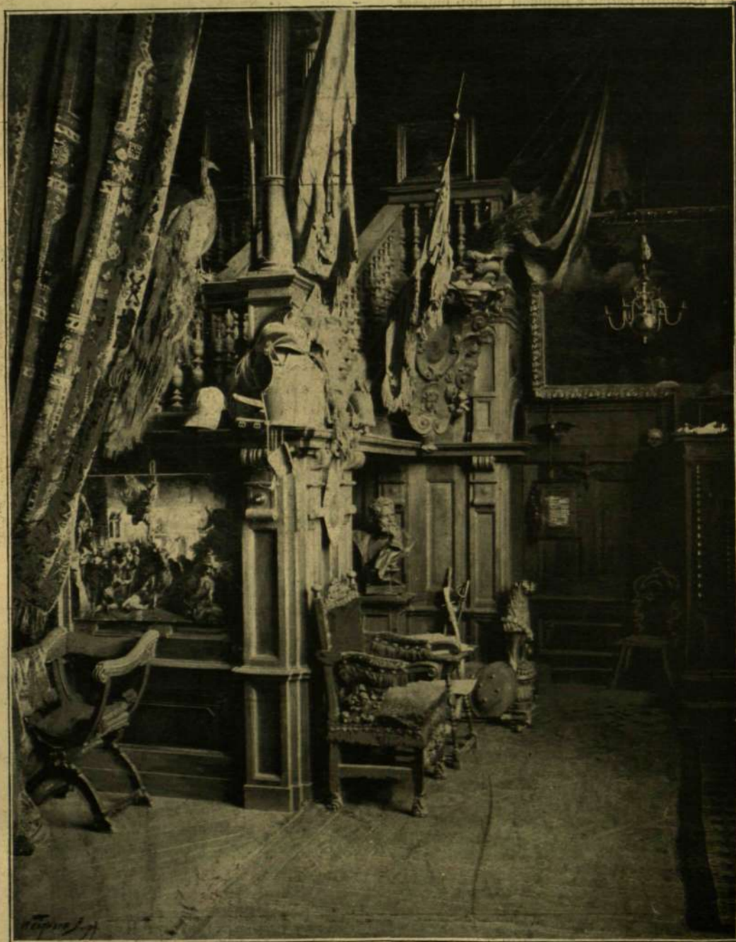
BENCZÚR GYULA MŰTERME A FESTÉSZETI MESTERISKOLÁBAN.

E hó 9-ikén és 10-ikén ünnepelt az egész ország. Az első napon az ország összes iskoláiban tartották az ezredéves ünnepet; tanítók, tanárok intéztek hazafias szöveget, költeményeket szavaltak el zászlók alatt, nemzeti kokárdákkal vonultak templomba.