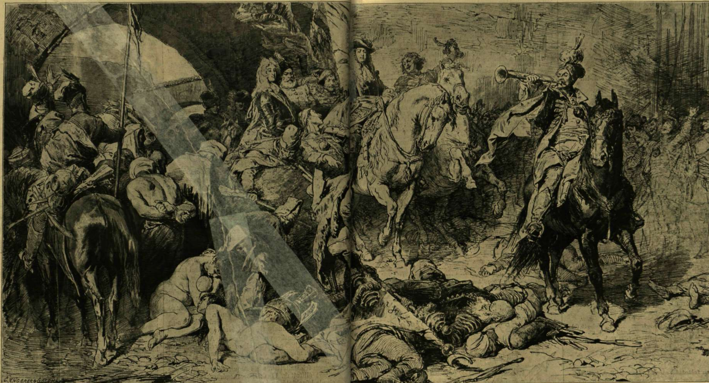
BUDAVÁR VISSZAVÉTELE 1686. BENCZÚR GYULA RAJZVÁZLATA NAGY FESTMÉNYÉHEZ.

A tavaszi löversenyek, melyek kilencz napra terjednek, május 3-ikán vették kezdetüket, s mivel egy összehoztak az ezredévi ünnepélyek kezdetével, a szokottnál is nagyobb közönség látogatta az eddigi versenyeket. A királyi család több tagja is jelen volt a közönség soraiban, ép úgy a külföldről Budapestre összegyűlt diplomaták, s főrangú világ nagy számmal. Mindjárt első napon egy nevezetes díjért futottak az Egyesített-Nemzeti és Hazafi-díj 20,000 koronájáért, melyet Jamkovich-Bésán Gy. „Gyön-gyös” nevé lora nyert el nem kis meglepetést kelte, s „Gyön-gyös” megnyerte a 3-ik verseny-napon a 15,000 koronás kanezdiját is.