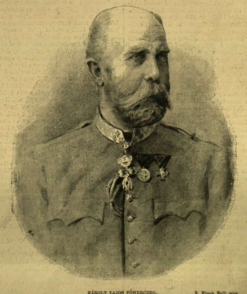
KÁROLY LAJOS FŐHERCZEG.

Igen szép vonása jellemének a családi erényekben való tündöklése. Nejét és gyermekeit rajongva szerette. Halálra betegséget is apai buzgósága okozta. Ugyanis gyógyulás végett Egyiptomban tartózkodó első fiát, Ferencz Ferdinándot, a magyar királyi baltjút volt kiság.