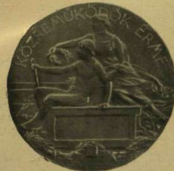
A közreműködők érme.