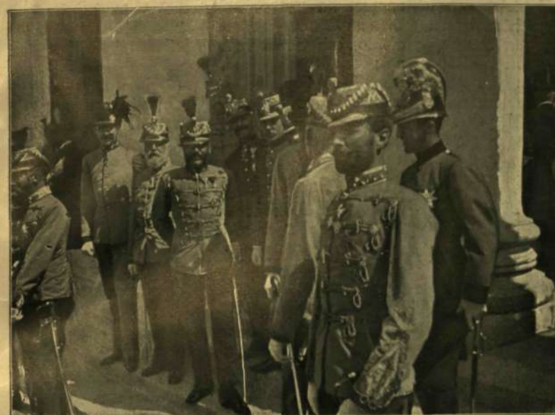
FŐHERCEGEK A MŰCSARNOK TORNÁZÁN A KIRÁLY MEGÉRKEZÉSEKOR. Lajos Viktor, Ferdinánd, a toskánai nagyherceg, Frigyes főherceg, Jenő főherceg, József főherceg.

* Andersen, a híres dán író, rendkívül ideges volt. Egyszer vasúton menve észbe jutott, hogy ládájában egy csomag gyufa van s a vonat gyors robogása alatt elgondolta, hogy a gyufa meg talál gyuladni. A következő állomáson kiszállott, levette a ládáját, kivette belőle a gyufát s ezért csak a legközelebbi vonattal utazhatott tovább.