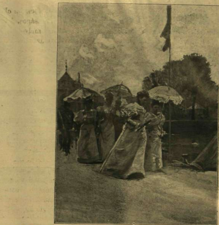
FŐHERCEGNŐK KÖRSÉTÁJA A KIÁLLÍTÁSBAN.

vagy diplomata egyenruhákban, az ország zászlós urai, miniszterei, főméltóságai és főurai káprázatos díszmagyarban, a főpapok és a tábornokok ünnepi díszben s mögöttük emelvényeken pompás tavaszi öltözékekben a hölgyek serege és a lelkes ünneplő sokaság. Olyan szingizdag, tarka, tündéri kép, a minőt nem lehet látni sehol, csak a magyar nemzet ünnepén.