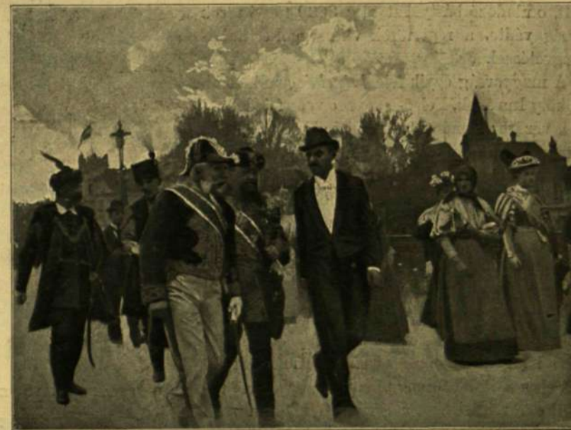
CHLUMETZKY OSZTRÁK KÉPVISELŐHÁZI ELNÖK SZÉLL KÁLMÁNNAL.