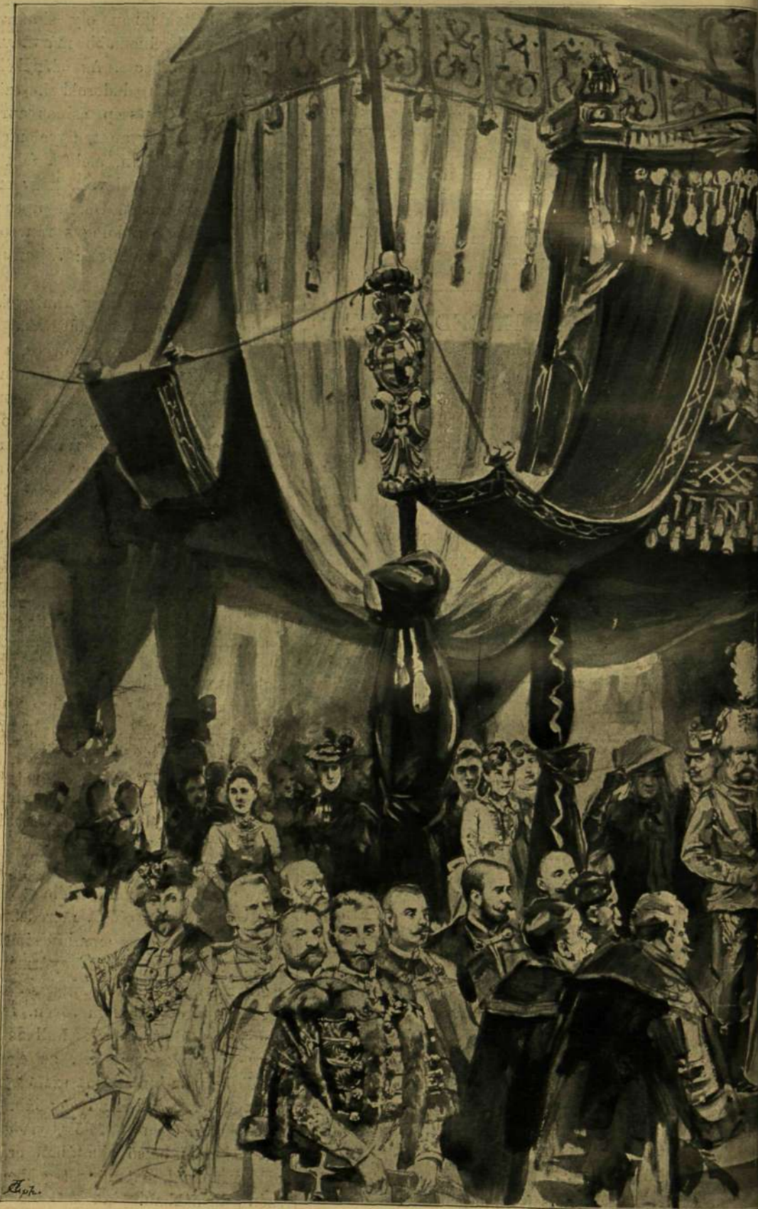
AZ EZREDEVI ORSZÁGOS KIÁLLÍTÁS NYITÁSA. — KIMNACH LÁSZLÓ RAJZA.

Ez már aztán igazi magyar nemzeti házi eszköz! Egy őskulaecs agyagból, teljesen ha-