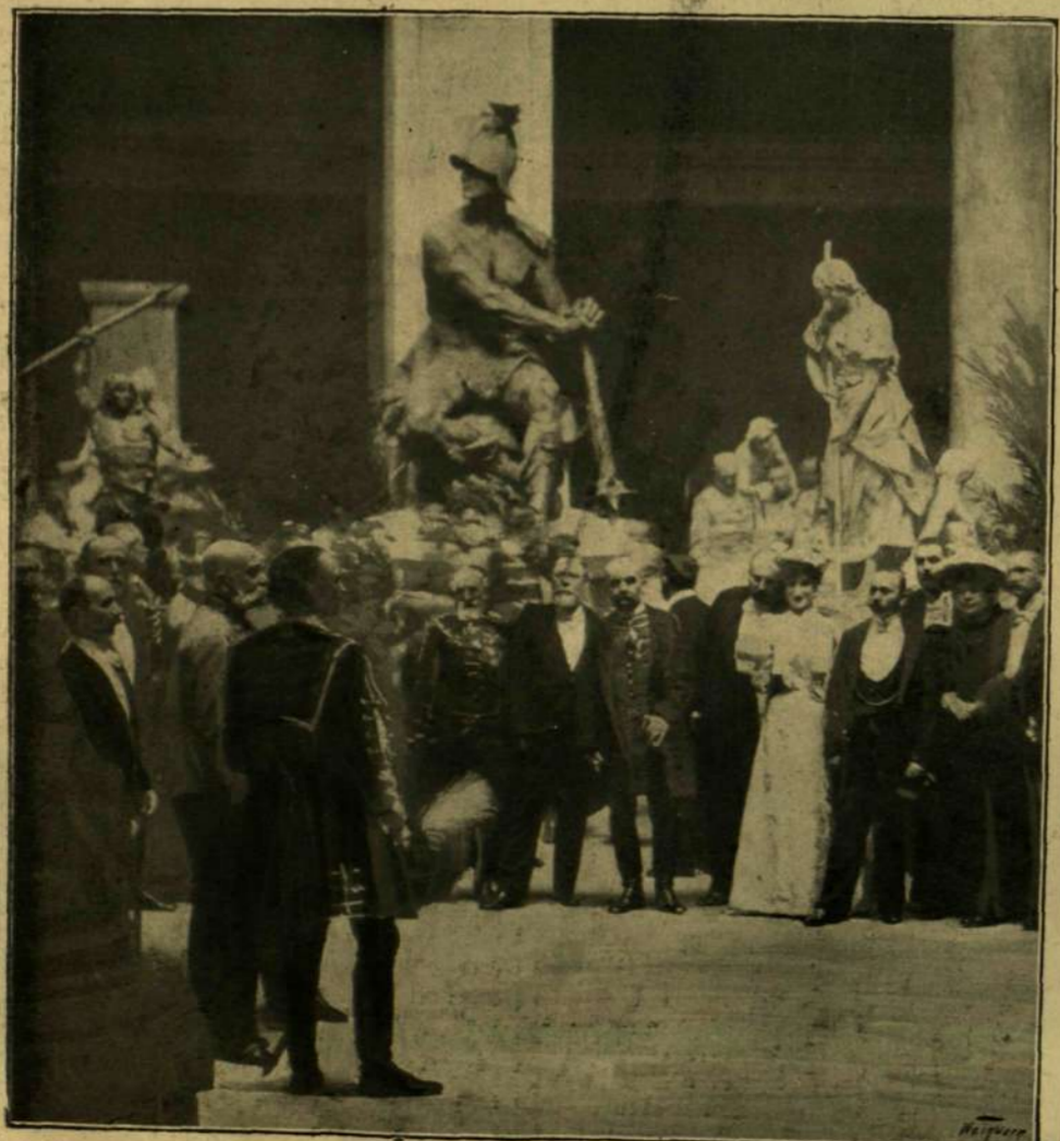
A KIRÁLY FOGADTATÁSA A MÜCSARNOKBAN.

«Szépirodalmi könyvtár» ezimel új vállalatot indított meg a Franklin-Társulat, eredeti és fordí-tott regények, elbeszélések válogatott gyűjteményét. Jeles művek könyvtárát kívánja nyújtani a magyar családoknak, oly műveket, melyek közbebecsítésá-nál az írásban, termékeikben és idegen írók fordí-tásában a választékosság és irodalmi érték a főelv. Egyes kötetek megjelenési időhöz kötve nincsenek, s nem siet okvetlenül a legtűbből, hanem válogat a legjobbak közül. A sorozatot is oly magyar író műveivel kezdte meg, ki azon kívül, hogy ez idő szerint a legtöbbgyökerebb magyarság, — a leg-kétfélebbek közé is tartozik, az igaz magyar élet mésteri rajzolójának: Bak-say Sándornak elbeszélé-seivel. Ezeket néhány évvel ezelőtt a Kisfaludy-tár-saság adta ki «Gyalog ösvény» ezim alatt, három kötetben. Ugyane becses munkák második kiadása nyitja meg a «Szépirodalmi könyvtár» sorozatát három kötettel. Az első kötetet egészen betűli Bak-saynak egész regény terjedelmű elbeszélése: «Pus-tai találkozás». A második kötet a két elbeszélés: «Nagymama karácsonya» és «Csodálatos történet» jutott, a harmadikba pedig három: «Jobb kezem», «Ispero», «Patakbanya». Mindenik a hazai elbe-szélő irodalom egy-egy jeles terméke, melyből a