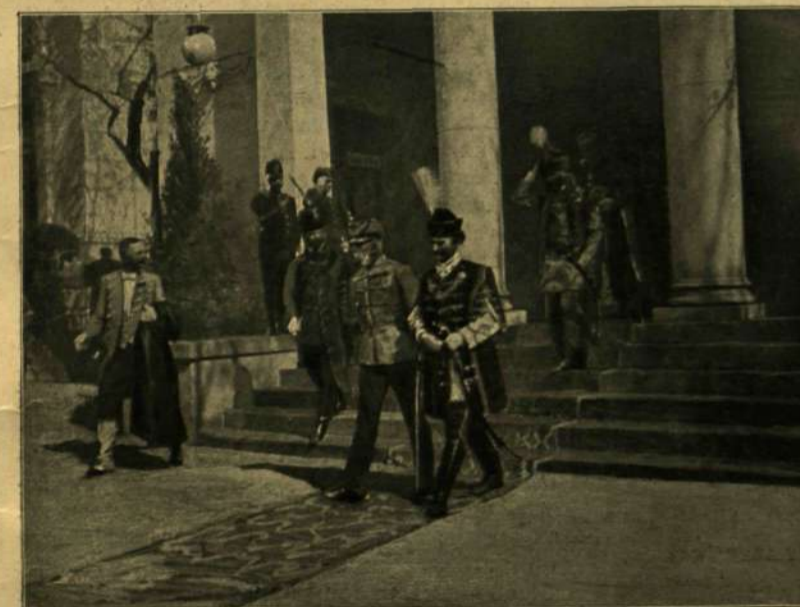
A KIRÁLY TÁVOZÁSA MUNKÁCSY KIÁLLÍTÁSÁBÓL.