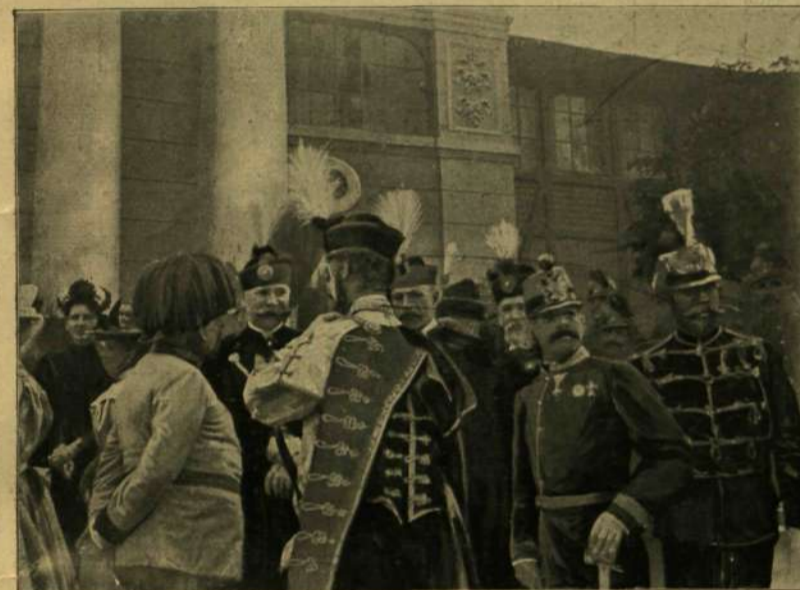
A MINISZTEREK A KIRÁLY KISÉRETÉBEN A KIÁLLÍTÁSON.