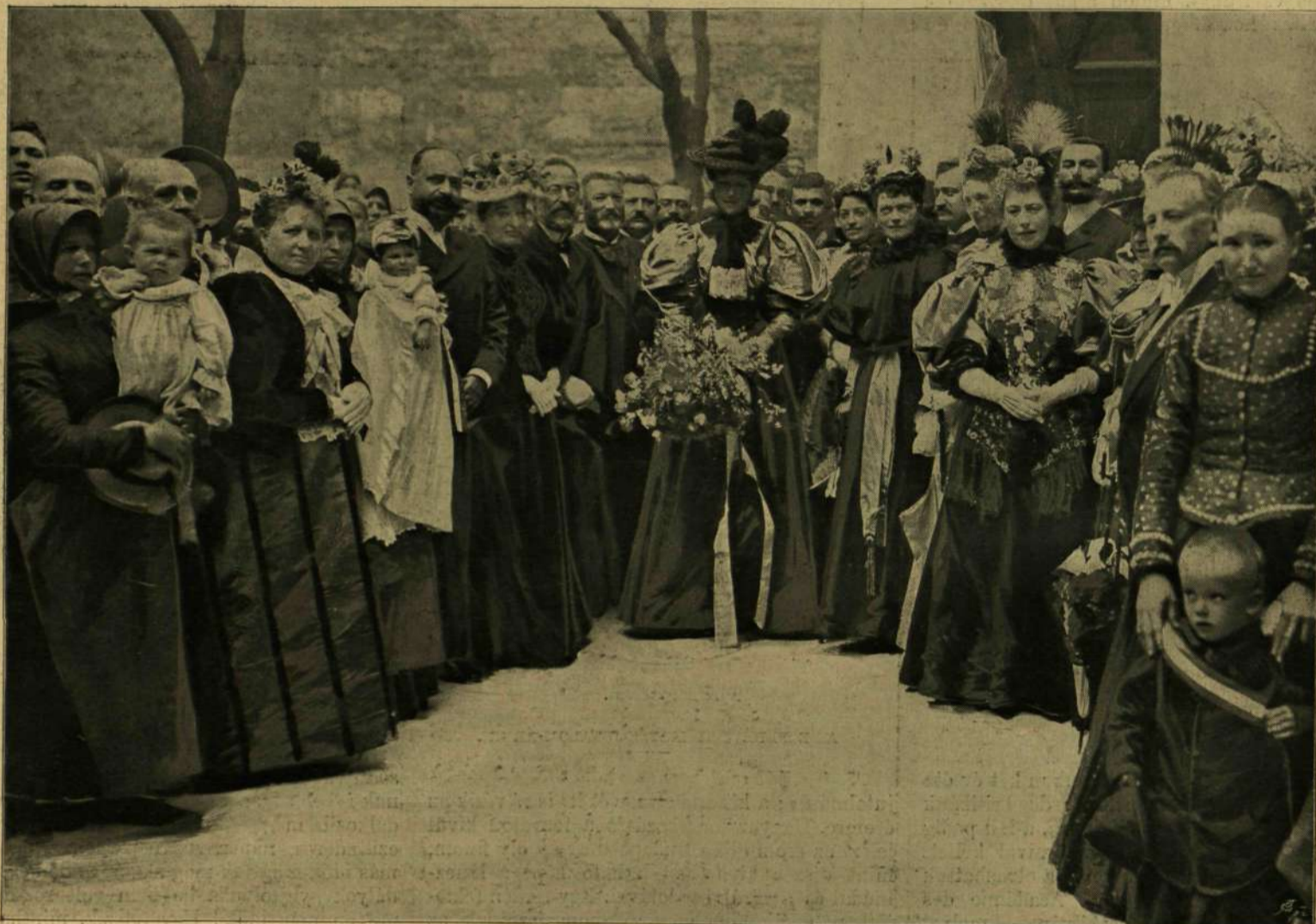
STEFÁNIA ÖZVEGY TRÓNORÖKÖSNÉ LÁTOGATÁSA A «FEHÉR KERESZT» EGYLETESEN.

* Weyler tábórnokról. Kuba mostani katonai parancsnokáról; a következő újabb részletek kerültek az európai sajtóba. Weyler , vagy teljes spanyol nevén Valeriano Weyler y Nicolau , német eredetű, de már régóta spanyollá lett családból származik. A Spanyolország keleti oldala mellett levő Mallorca szigetének Palma nevű városkájában született 1839 szept. 17-én. Nyers, de jó katona. A spanyol hadsereg tábórnokai közt a legjelesebbek egyike, de egyszersmind a legkíméletlenebb modorú is. Kubában éveken át tartózkodott; de a kubaikkal sem rokonsági, sem társadalmi összeköttetésbe nem lépett, s ezt most szintén egyik érdemének tekintik. A mostani fölkelés előtt történt legutóbbi lázadás alkalmával az ő hadsapata több fölkelőt halomra lőtt, mint a többi csapatok együtt véve. E miatt a kubaik «mészáros» -nak nevezték el. Kinevezetésének híre dühvel vegyes rettegéssel töltötte el a fölkelőket; de egyszersmind fokozta abbeli reménykedéseket is, hogy az Egyesült-Államok kormánya annál hathatósabb lépéseket fog tenni érdekében.