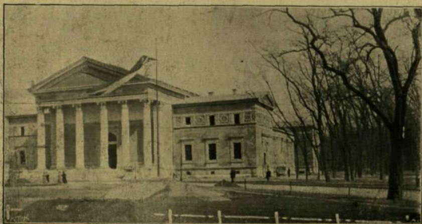
A MÜCSARNOK ÚJ ÉPÜLETE.

A főváros természetesen folytonosan zajos napokat él, hisz rendkívüli élet központjává lett. Csak az idő is kedvező volna már. De eddig még barátságatlan, hideg, esős, szeles. Reggel kiderül, délre beborul délután esik, egyik nap úgy mint a másik nap. A kiállítás látogatásában tehát a közönség fel