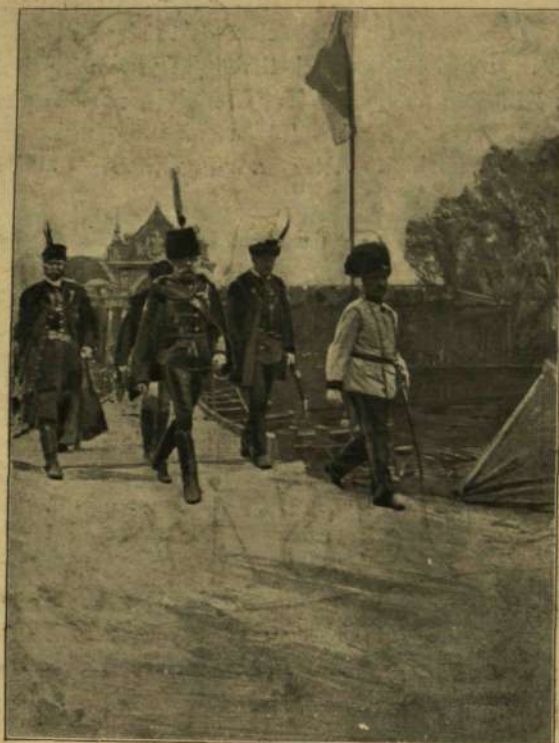
A KIRÁLY A HADÜGYI KIÁLLÍTÁSBAN.