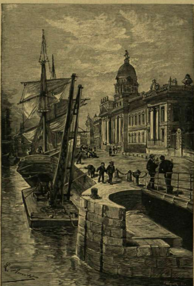
Rendre nézegették a hajókat.

hogy felviszi még a dolgát. A tapasztalt kereskedő megígérte Senki fiának, hogy tanácsosal gyámolítani fogja, s figyelemmel kíséri a kis üzlettulajdonos minden vállalatát. Aláírták kölcsönösen a szerződést, Senki fia kifizette az évi bért s ezzel a Bedford-streeti földszinti üzlethelyiség tényleges tulajdonosává lón. A Little Boy and Co.-nak bérbeadott bolt két szobából állott, egyik az utcára, másik az udvarra szólt. Az előbbi boltnak rendezték be, az utóbbit hálószobának szánták. Volt még konyha és egy kis benyíló — itt esetleg el lehet majd a szakácsné — ha lesz. Egyelőre nem volt reá a fiúknak szüksége. Akkor ebédelnek, ha vevő nem várakozik rájuk, ha ráérnek. Első az üzlet! Kelendőségre számíthatott a kis kereskedő, mert esinos üzletét dús választéku áruval tölthette meg. A mi pénze még megmaradt a bolt bérének kifizetése után, azon a nagykereskedőtől és a gyárakból vásárolt be holmit, készpénzzel fizetett mindent. S a «kis pénzes zacskóhoz» címzett bazár felszerelése teljesen megfelelt az igényeknek.