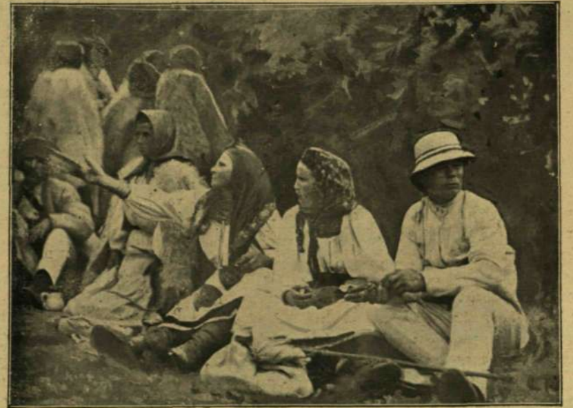
Tőkési ruthének a közös ebédnél.