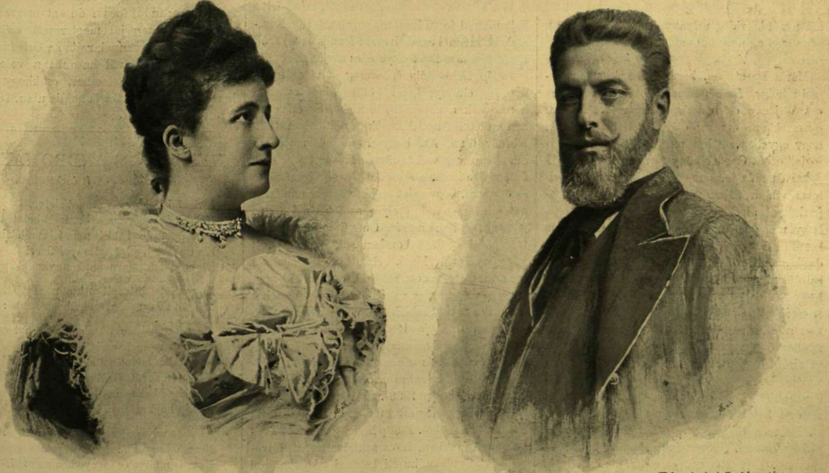
Mária Dorothea főhercegnő. Fülöp Orleansi hercege után.

kiknek körében épen oly otthonosak a polgár- erények, mint annak idején a „polgár király“ házánál. A mint fölserdült, csillagkeresztes és palotahölgyi méltóságokra emeltetett, mindaz- által csak ritkán jelent meg az udvarnál. A múlt ősz óta, mikor szeretett öcsöce, László fő- hercege oly gyászos véget ért, csaknem bú- skomorságba esett bánatában. Szüleitől együtt vigasztalhatatlan volt. E gyász miatt még az ezredévi ünnepélyeken sem jelent meg, a min mindenki igen sajnálkozott. Komoly híre járt, hogy apáczaafátolt akart ölteni, de hozzátartozói végre rábirták, hogy erről a szándékról lete- tt,