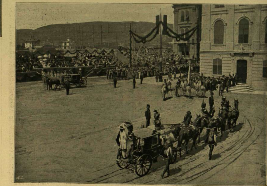
STEFÁNIA ÖZVEGY TRÓNÖRÖKSÉ FŐHERCEGNŐNEK A KIRÁLYI PALOTÁBÓL A JÚNIUS 8-IKI DÍSZMENETRŐL FÖLVETT FÉNYKÉPEL.

Belátta az öreg Dengelegi, hogy Sándor, ki pedig eddig mindig jó szófogadó fiok volt, tanácsát be nem veszi, de még édes anyjának rimánkodására se mond le szándékáról. Ezzel szakította hát végét a dolognak: — No, fiam! nem hányom én tovább a falra a borsót. Ha neked több esz van, mint nekem meg anyádnak, az a te szerencséd. Mi megtettük a magunk szülei kötelességét, tovább nem is erősködünk. Nem is haraggal, nem is semmi nélkül bocsátunk el a házunktól. Kiadom a jussod. Neked vettem meg az özvegy Gálné házát, bele viheted a falu legszébb lányát; a Kiss István-féle egész telek földet neked adom; adok lovat, marhát, juhot, sertést, s minden gazdasági eszközt, takarosan megélhettek, még gyarapodhattok is, csak gazda meg gazdasszony legyen a háznál.