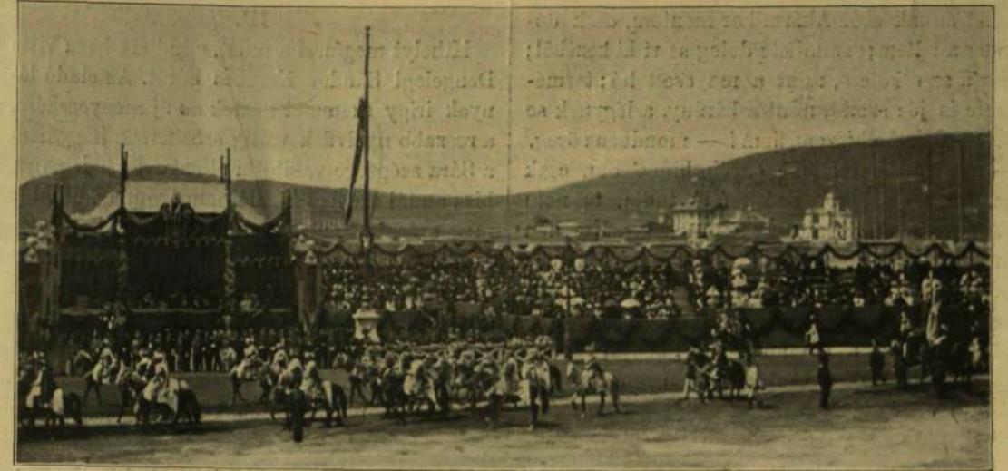
STEFANIA ÖZVEGY TRÓNÖRÖKSŐNÉ FŐHERCEGNŐNEK A KIRÁLYI PALOTÁBÓL A JÚNIUS 8-IKI DÍSZMENETRŐL FÖLVETT FÉNYKÉPEI.

Igy szólnak akkor, s csak búdat tetézik, Nagy szabadítódért mert a szívéd vérzik. De a szakadó föld temessen el engem Maga alá inkább, mint hallani kelljen A te kiáltásod, Vagy pedig szemlélni elhurezoltatásod.»