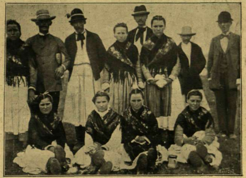
Felső-vecerek ruthének a szolymai járásból.

festője, Jan Styka új körképe a «Golgotha», Krisztus fölfejtése, melyet Lembergben a mult héten mutattak be. A nagy festményt kiváló és igen hatásos műnek mondják.