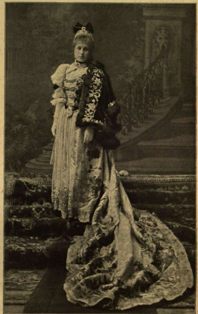
Koller atódnál fényképet után.