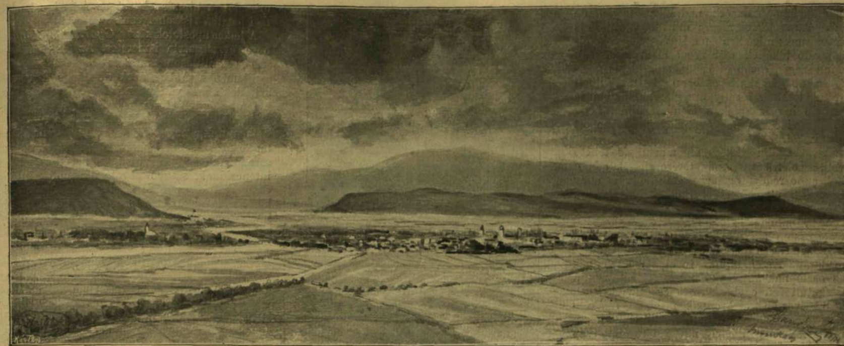
MUNKÁCS VÁROS A LATORCZA VÖLGYÉVEL. — Paár Géza rajza.