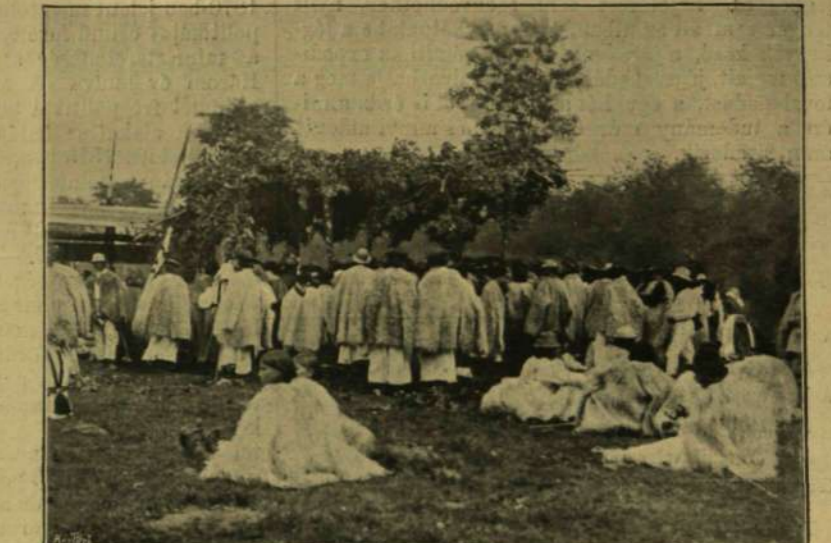
Háthegegyési ruthének az ebéd kiosztásánál.

Styka új körképe. Koscziusko győzelmének meg-