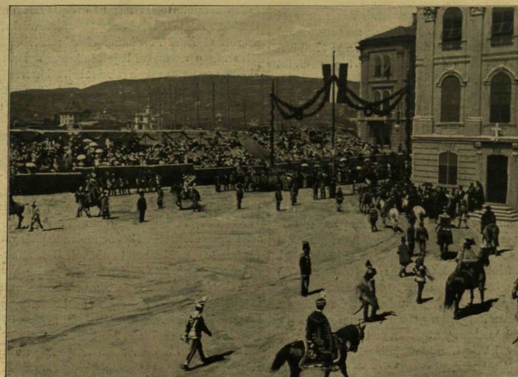
STEFÁNIA ÖZVEGY TRÓNÖRÖKSÉ FŐHERCEGNŐNEK A KIRÁLYI PALOTÁBÓL A JÚNIUS 8-IKI DÍSZMENETRŐL FÖLVETT FÉNYKÉPEL.

helyről rápattant szikra az előtt való vasárnap, a mint templomból kijövet ünnepi öltözetében gyujtotttűzet, kiégetett volt. De még egy pár disznólabát, meg egy nem régen megkezdett fél szalonnát is adott a cigány asszonyoknak.