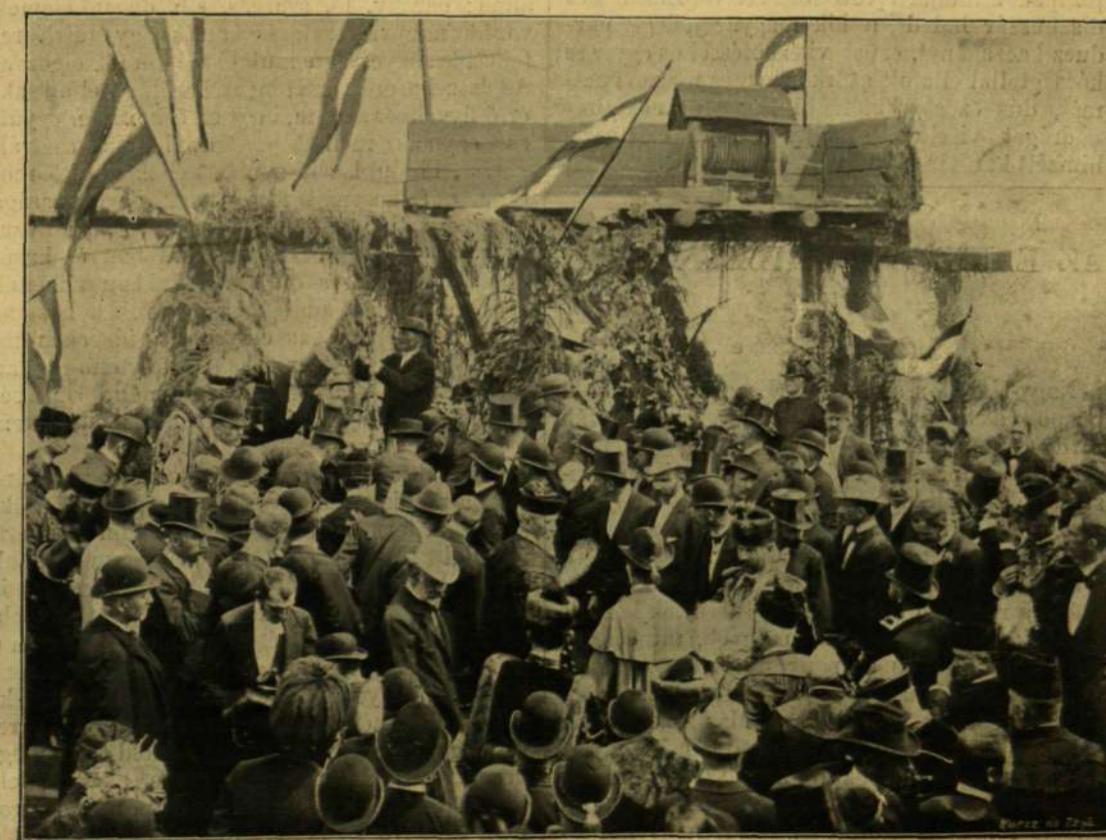
A MUNKÁCSI EZREDÉVI EMLÉK ALAPKÖVÉNEK LETÉTELE.

Az természetes, hogy az egy-egy községbeliek inkább egymáshoz húzódtak, a mit annnyival jobban tettek, mert így egy-egy nagyobb csapatban mutatták be férfi és női viseletök sajátzerúségeit. Ilyenek voltak Kis- és Nagy-Dobrony szép magyar lakosai: többnyire legények és leányok; az alsó- és felső-vereckei és verbehei ruthének, kiknek kivált az előjárói magyaros