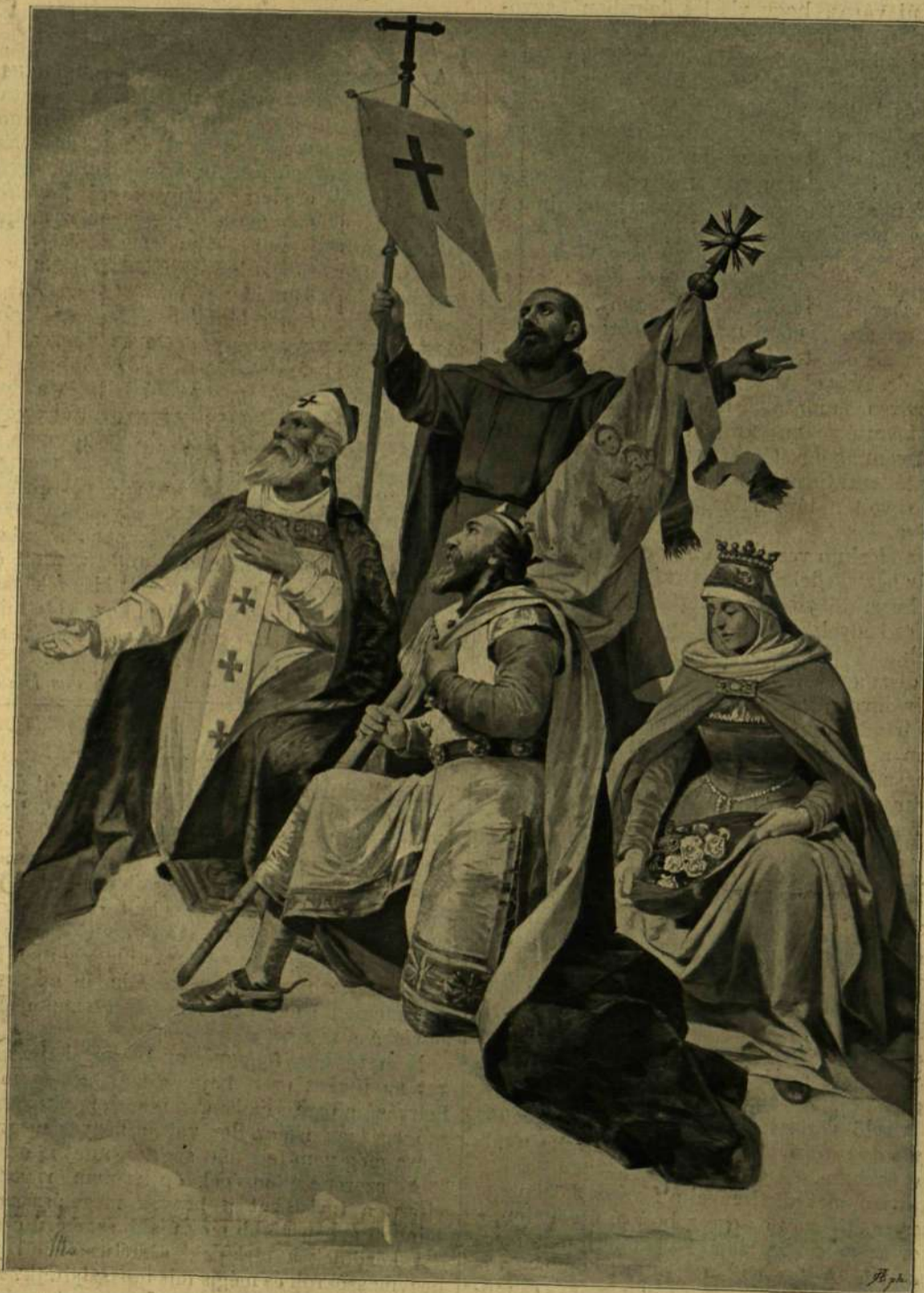
MÁRIA DOROTHEA FŐHERCEGNŐ FESTMÉNYE AZ ALCSUTHI KÁPOLNA ORATORIUMÁBAN.