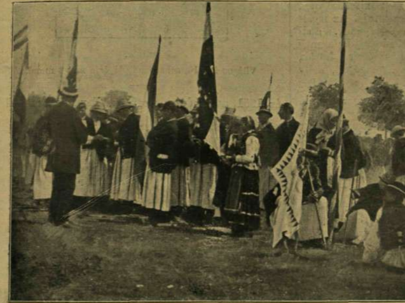
Kászonyi magyarok a tiszaháti járásból.