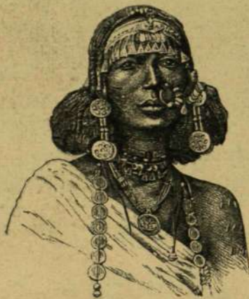
Szuðáni négrek. A VILÁGKRÓNKA KÉPEIBŐL.

Az előfizetés bármelyik hónap eljéjétől kezdve eszközölhető.