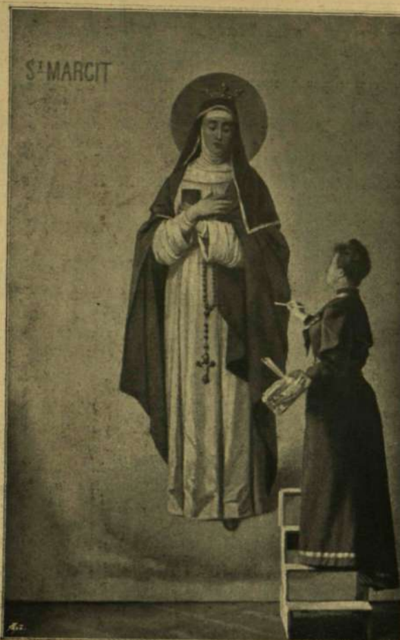
MÁRIA DOROTHEA FŐHERCEGNŐ A MINT MŰTERMÉ- SEN SZENT MARGIT KÉPÉT FESTI.

lejtőn kell járni, a honnan a legkisebb elcsúszás a mélységbe zuhintja az embert, mint 1865-ben Matterhornon történt egy előkelő angol társasággal, mely alkalommal három angol és egy vezető lelte halálát. Mäskor a glecseren kell küznie pusztá hópárkányba fogódzva vagy jégáridon kell átmennie, mely ha leszakadna, a mélységben lenné sirját. Néha meg oly sziklafokra kell fölmászni, melynek keskeny kiállóin alig fér el a lába és egy félrelépés halálát okozza. De a bátorság a hegymászók közt oly nagy, hogy egyetlen izomnak sem enged hibás mozdulatot, hanem a kifejtett egybevágó erő legnagyobb megfeszítésével és e veszély kikerülésére irányított figyelem által győzedelmeskedik az ember a veszedelmes s ura lesz helyzetének.