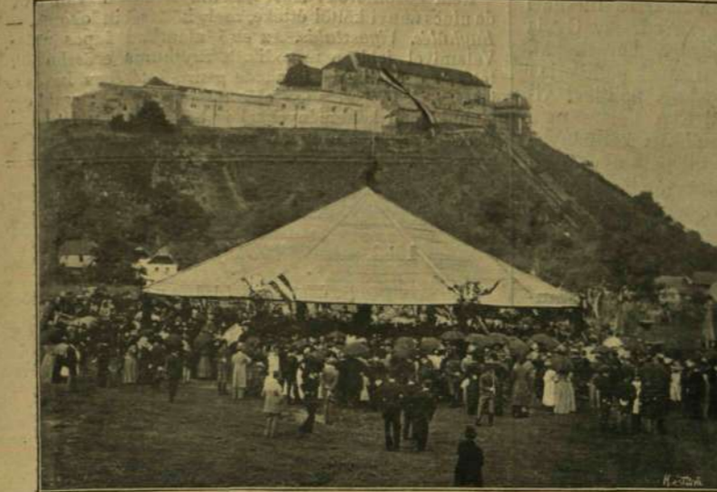
A sátor, a hol Erdélyi miniszter ünnepi beszédét tartotta. (A vár jobb sarkán az emlékfő építkezésé látszik.)