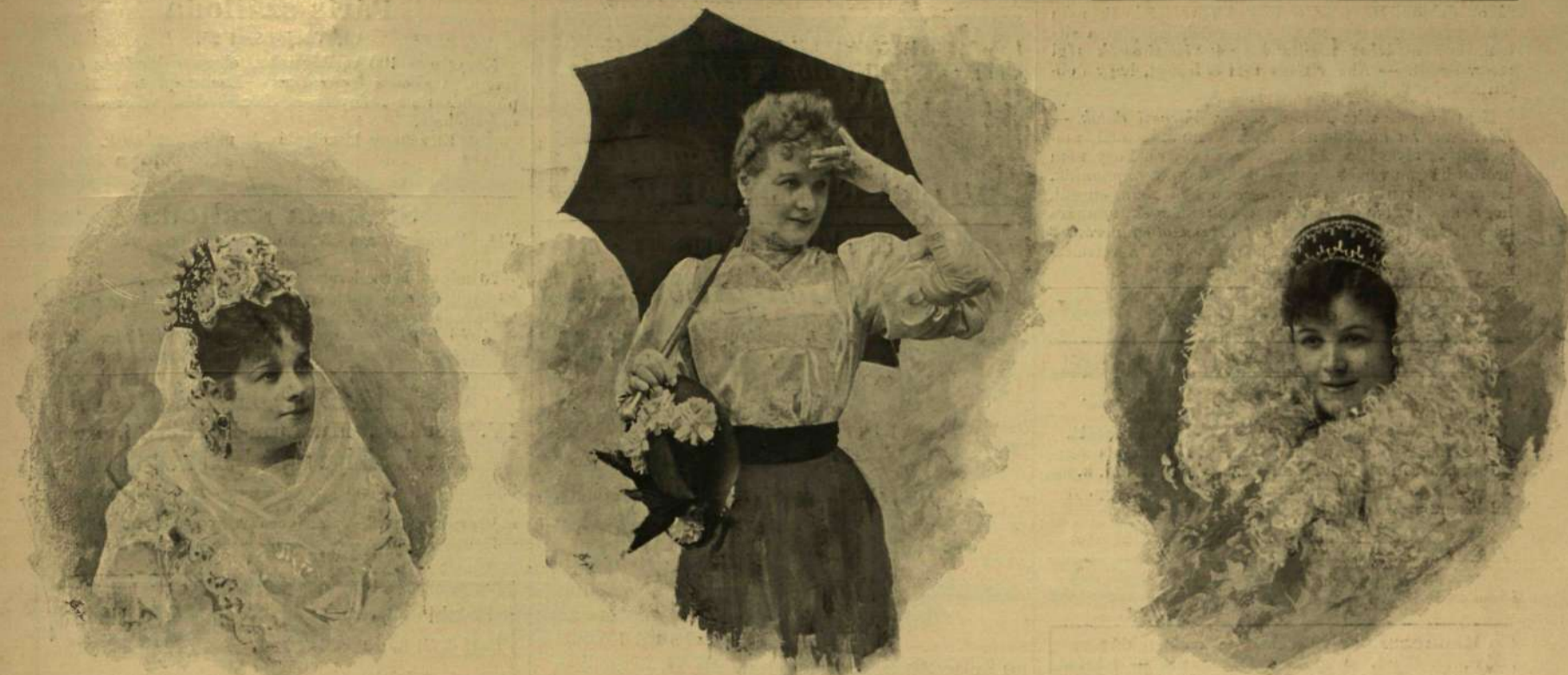
PÁLMAY ILKA KÜLÖNBÖZŐ SZEREPÉIBEN.