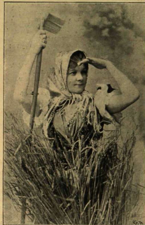
PÁLMAY ILKA KÜLÖNBÖZŐ SZEREPÉIBEN.