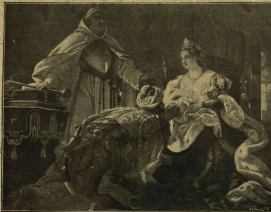
A MÜCSARNOK EZREDÉVI KIÁLLÍTÁSÁBÓL. — Madarász Viktor: Zápolya Izabella.

azt a toló zárral, s maga mindenre elszántan az ajtó elébe állott.