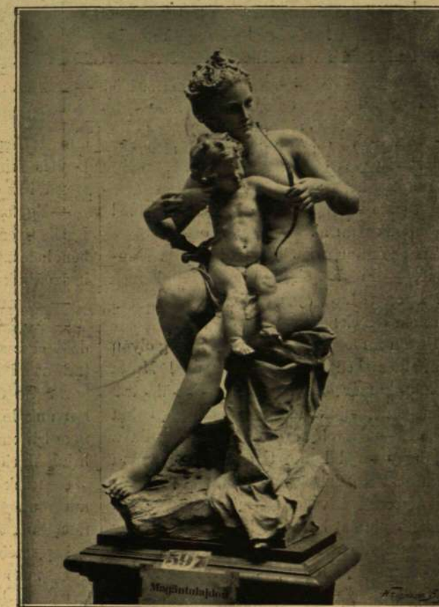
Loránfi Antal: Az első lezke.