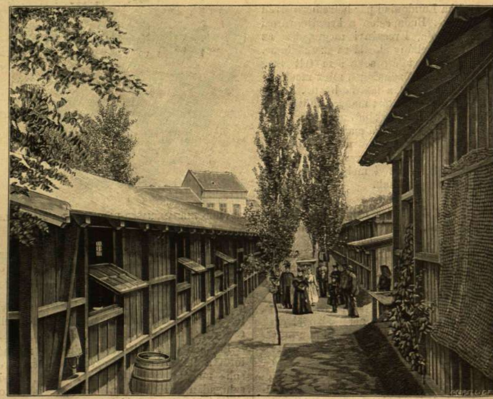
AZ EZREDÉVI KIÁLLÍTÁS BARAKJAI.

Igy például — a magyar tehetség alkalmazhatóságának nagy bizonyosságára — a természeti eredetiségünkől annyira idegen operette művelésében is oly előre haladtunk, hogy a népszínház egész önálló operetteitőri gárdát hozott létre, primadonnái pedig — ismét a magyar tehetségek