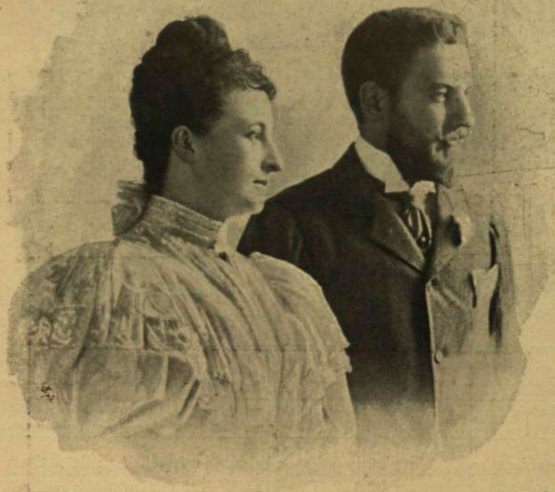
Streilly legújabb fényképe.