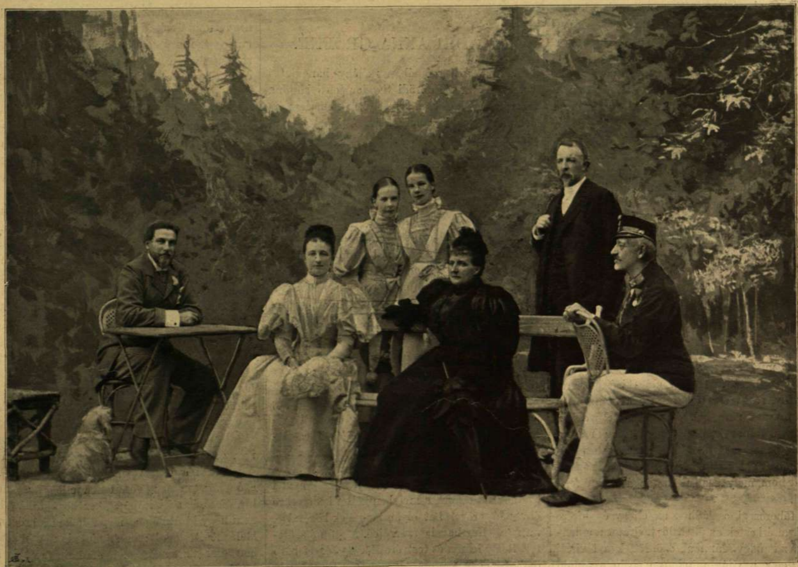
Fülöp orleansi herceg. Mária Dorothea főhercegnő. Klottid főherceggazsóny. Eu gróf. József főherceg. JÓZSEF FŐHERCEG CSALÁDJÁ FÜLÖP ORLEANSI HERCEGGEL ÉS EU GRÓFFAL.

födi ép úgy, mint a völgyényét. Egymás mellett haladva feltűnik a két szép sugár alak. A herceg magas, erős, nyúlánk szép férfi, kevessé hegyesre nyirt tömött szőke szakállal; bátor tekintetű tüzes szemei mély érzelmeket, nyálgató bátorságot és őszinte szívóságot fe- jeznek ki; járása könnyed, fesztelen, modora nyílt, nyájas s nagyon kellemes; sokban hasonlít a boldogult László főhercegehez. Ez pedig, már magában elég a jellemzéséhez. Fran- cziánul és angolul beszél; némétül nem folyé- konyan. Különös kedvelője a férfias sportoknak.