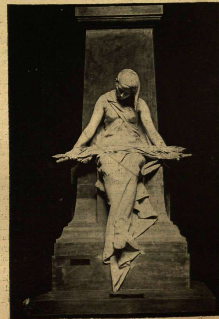
Donáth Gyula: Ligeti Antal síremléke.