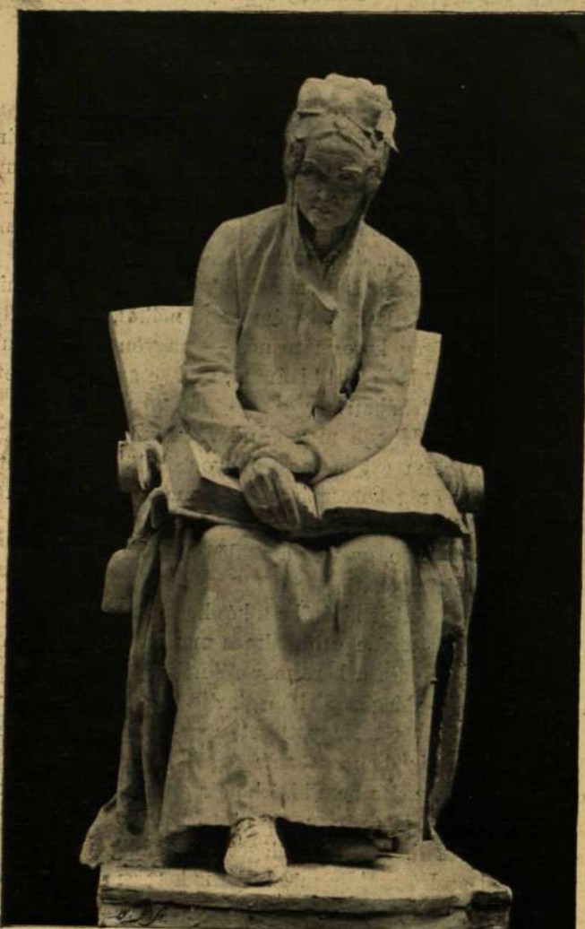
Strobl Alajos: Anyánk.