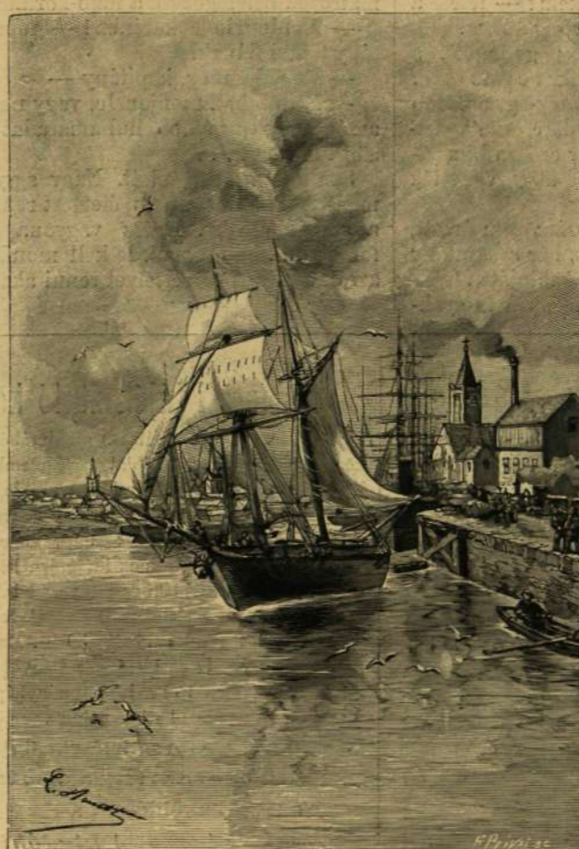
A «Doris» elhagyja a kikötőt.

Grip és Sissy esküvője után a «kis pénzes zacskó»-nál igen sok volt a dolog, lévén új esztendő. Letárolni, a sok vásárlót kiszolgálni kellett, továbbá abban is fáradoztak, hogy a bazárt nagyobbítsák, stb. Grip derekasan bele-