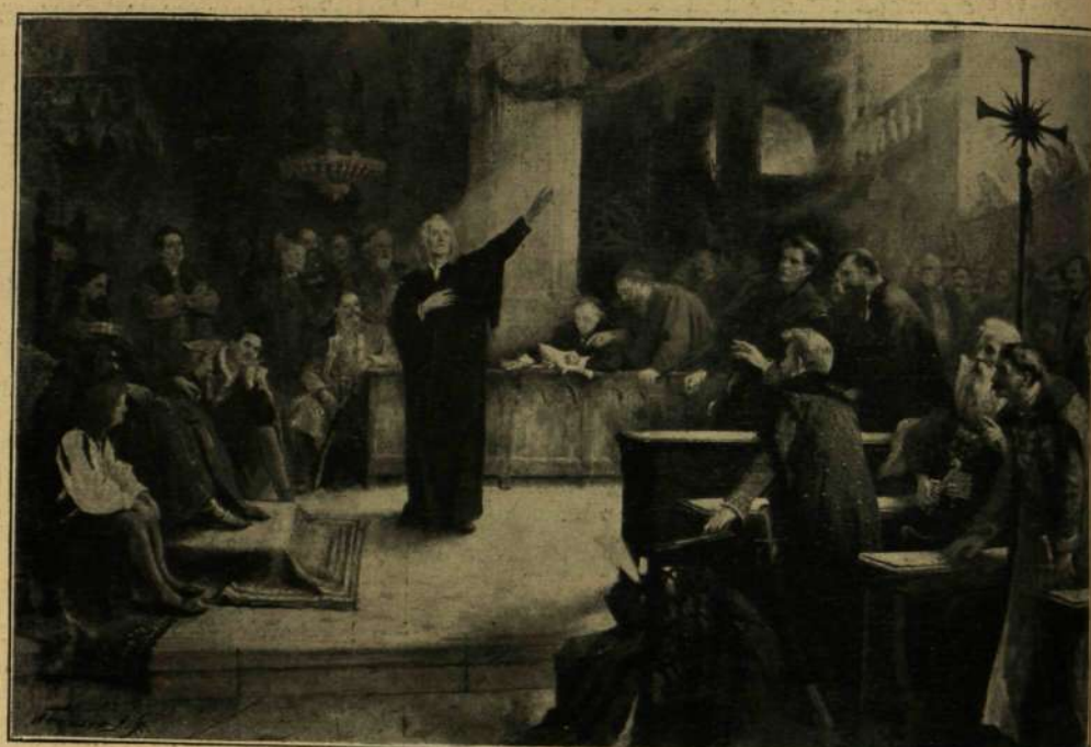
Kriesch Aladár: Az 1567-iki tordai országgyűlés, melyen először mondatott ki a vallásszabadság.