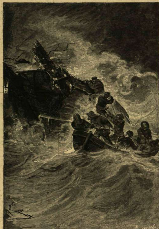
A halászkok összekaptak a zsákmányon.

dolgozta magát az új foglalkozásba, bár házas-sága még mindig úgy tűnt fel előtte, mint egy álom, mindig attól félt, hogy ebből az álomból egyszer csak hirtelen fölébred.