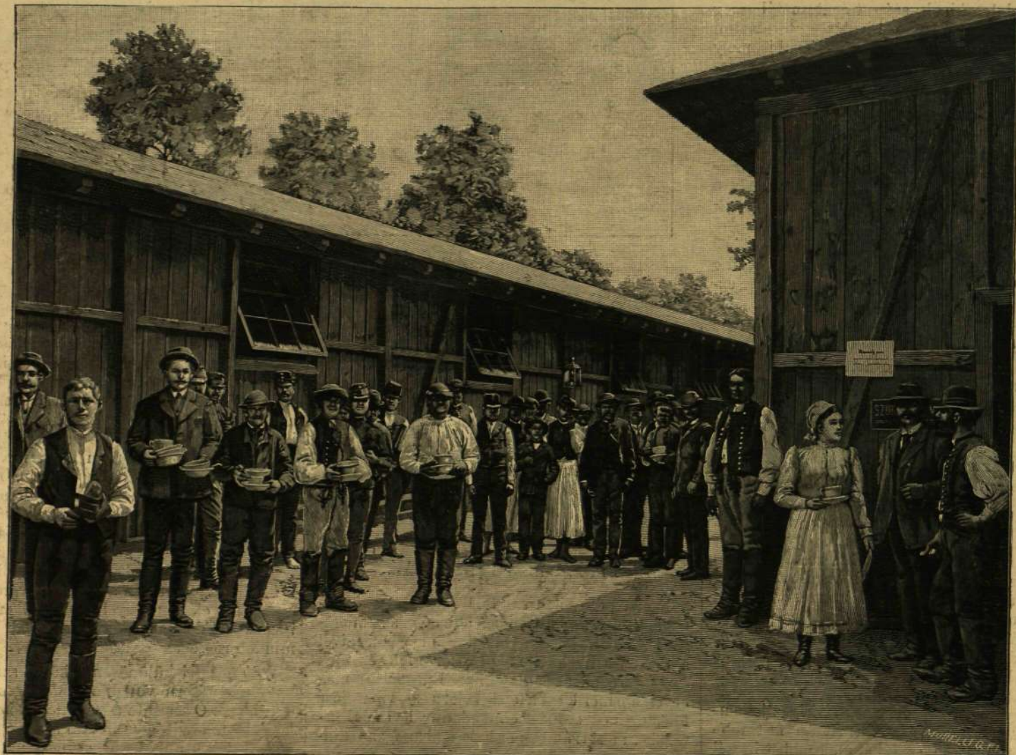
AZ EZREDÉVI KIÁLLÍTÁS NÉPKONYHÁJÁBÓL. — ÉTEL-ADAGOK ELVITELE.

* A föld mélyének felhasználása végett angol mérnökök 3600—4800 mély kútakat fúrásat ajánlják. Ily mélységből már 200 foknyi forróságú vizet lehetne kapni, mely fűtésre és gépek hajtására is alkalmas lenne, s minden esetre sokkal olcsóbb volna, mint a kőszén által adott meleg.