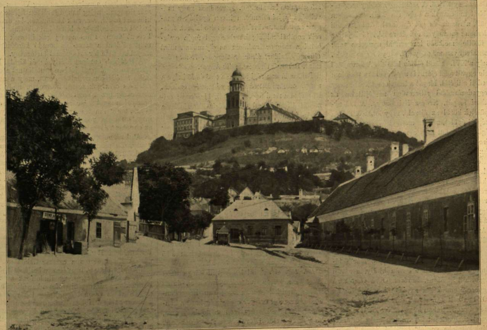
PANNONHALMA GYŐR-SZENT-MÁRTON FELŐL.