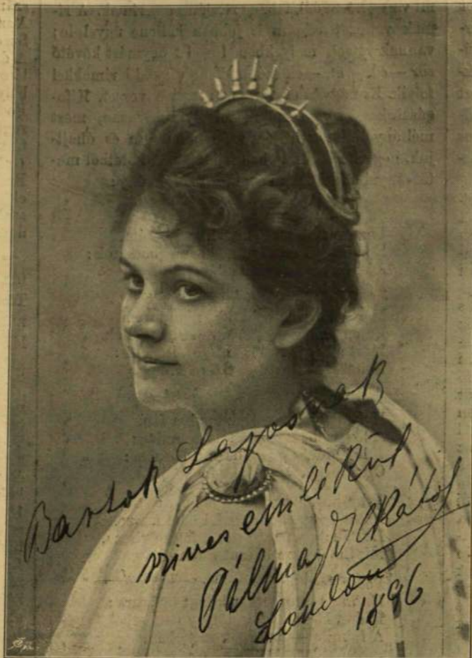
Londoni fénykép után.

Mária Dorothea főhercegnő eljegyzése. Mária Dorothea főhercegnő és orleansi Fülöp herceg házasságáról a párisi «Figaro» a következőket írja: Az orleansi herceg már régóta hajlandóságot érzett Mária Dorothea főhercegnő iránt, és Ferencz