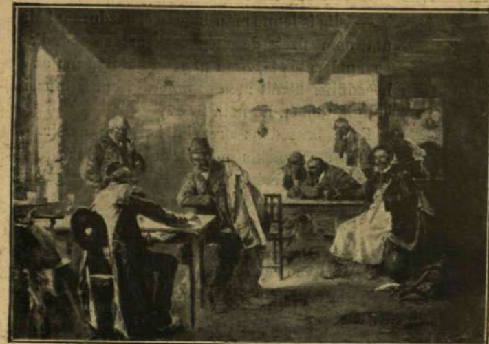
Blaskovics Ferenc: Gyanus alku.