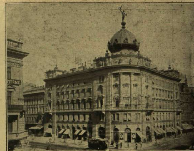
Czigler Győző: A Pesti Hazai Első Takarékpénztár Egyesület bérháza.