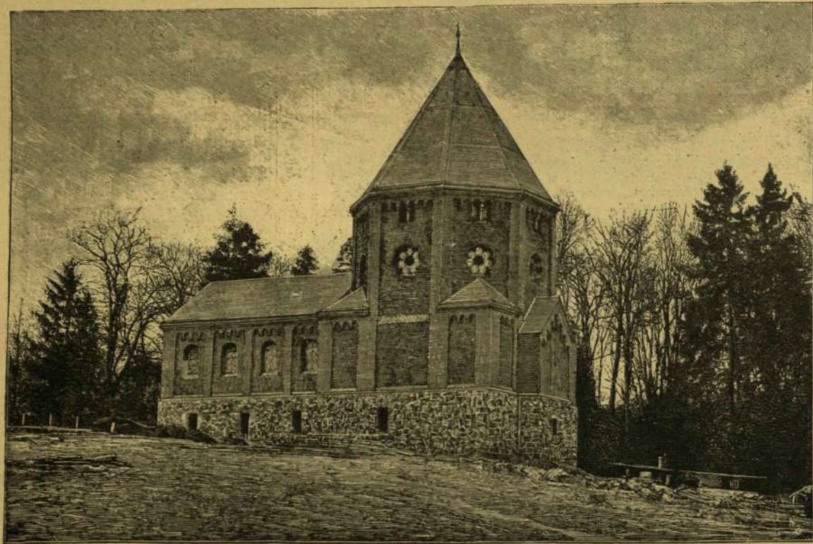
BISMARCK MAUZOLEUMA FRIEDRICHSRUHÉBAN.

telenül Stratfordra való visszaemlékezés határsának szüleménye; és pedig egészen friss nyomon.