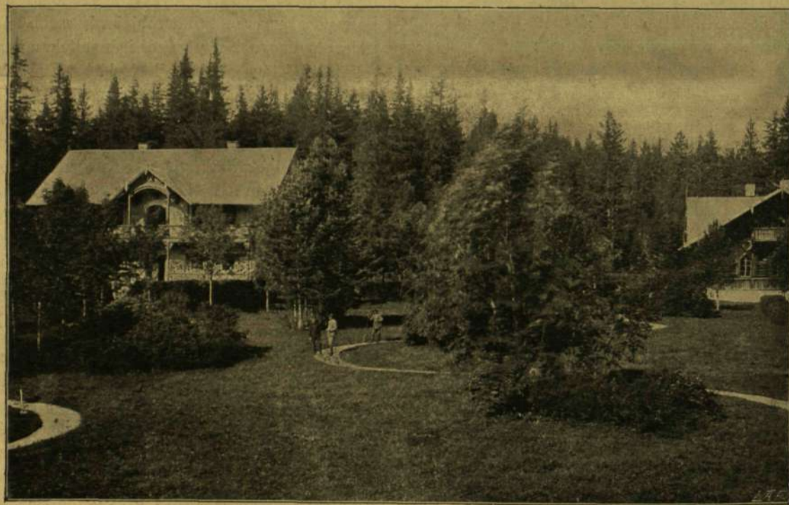
A PUSZTAMEZŐI VADÁSZLAK.

Nem tanulhatott ő sokat a stratfordi kis iskolában; sőt magánítón a szülői házban sem, mert mikor az ismeretszerzés korába került, az anyagi gondok terhe már ott nehezült az atyja