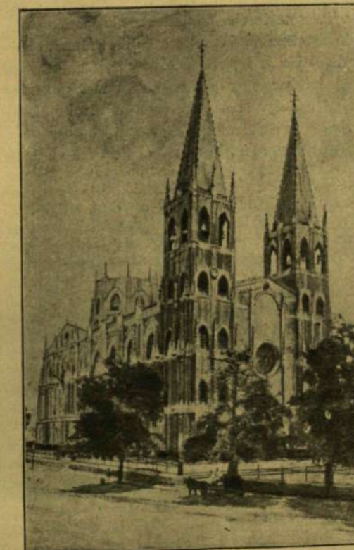
A MANILAI RÓMAI KATHOLIKUS SZÉKESEGYHÁZ.