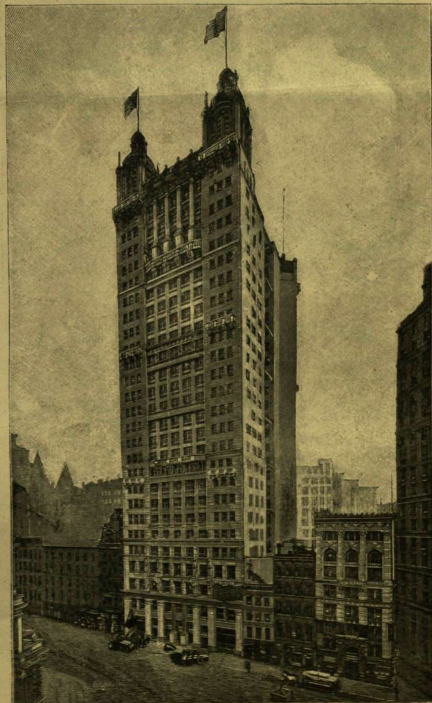
A LEGMAGASABB HÁZ. — A Park-Row épület New-Yorkban.

Az óriási épület nagyságának könnyebb áttekinthetése végett közlünk itt egy összehason-