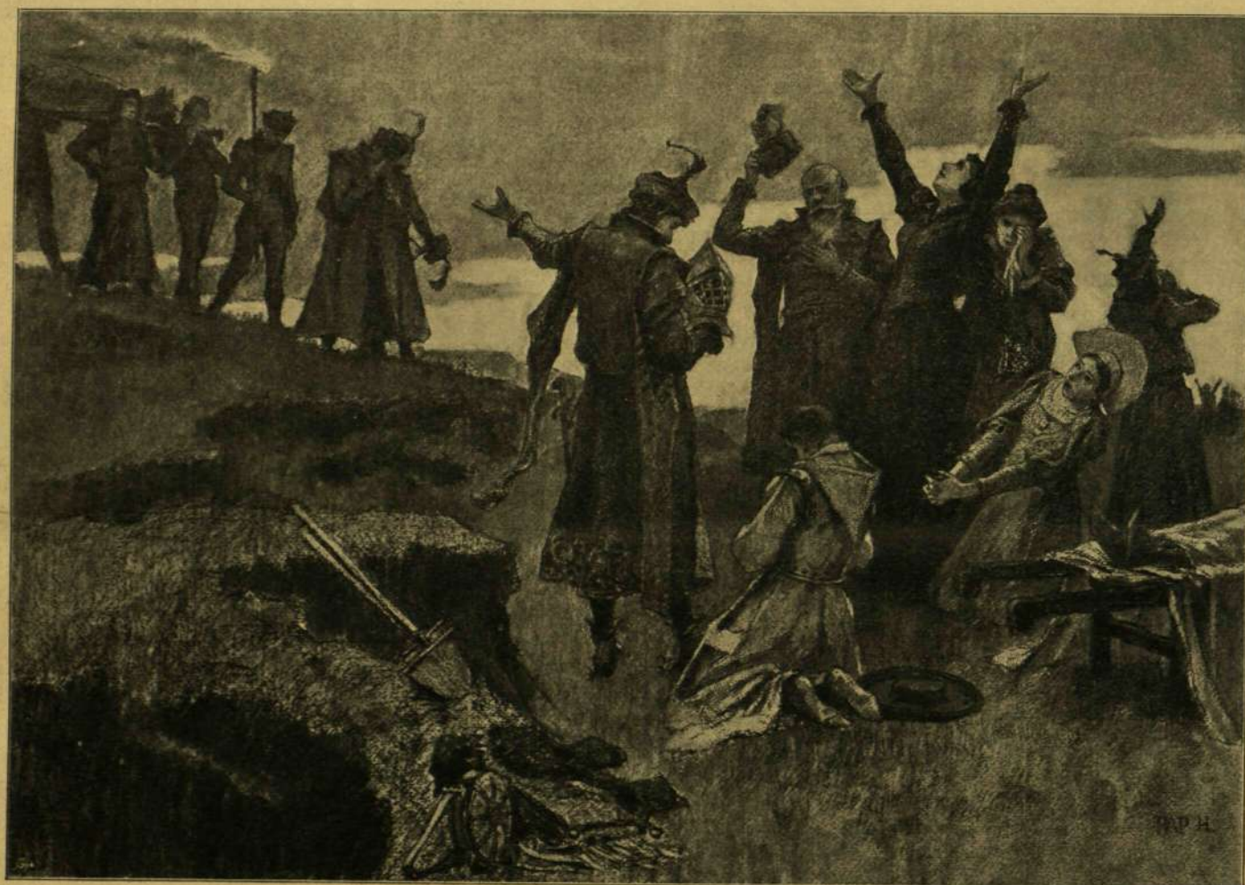
Öreg nemes: Királyunk holtteste! Perényiné: Jaj, jaj Isten!

* Húskimérés eleven emberen. Egy belga misszionárius a Kongó vidékén meglepetve látta, hogyan