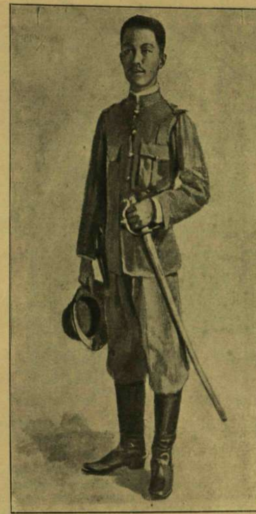
AGUINALDO EMIL, a filippini-szigeti fölkelés vezetője.