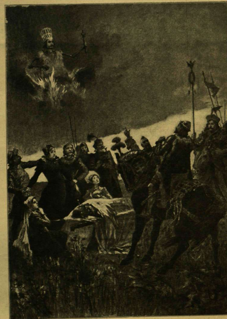
Zápolya: Mi ez? Te Dózsa György, a pórkirály vagy. De izzó trónra én ültettek!

És talán ez volt az Egyesült-Államok első szándéka; de újabban a terjeszkedési politika nagy pártolásra találtván Washingtonban, elkövetette Mac Kinleyvel a tévedést, a mely ellen a kongresszus oly nagy ellenállást tanúsított, s mely új és nehéz háborúra kényszerítette az Egyesült-Államokat, pedig egy ilyen háború még azzal sem dicsekedhetnék, hogy felszabadító háborúnak neveztessek. Az ellenállás élén ma is Aguinaldo Emil áll, kinek arcképét legutóbbi fotográfiája után bemutatjuk lapunk mai számában. Aguinaldo tiszta tagál vér. A kisebb természetű közé tartozik; szakálltalan és bajszatlan arcú; szinte gyerek-embernek látszik; arckifejezése egyáltalában nem vall fajára. A szerzeteseknek, főleg a jezsuitáknak e dühös ellenségét először a dominikanusok s aztán a jezsuiták nevelték; s általában mély