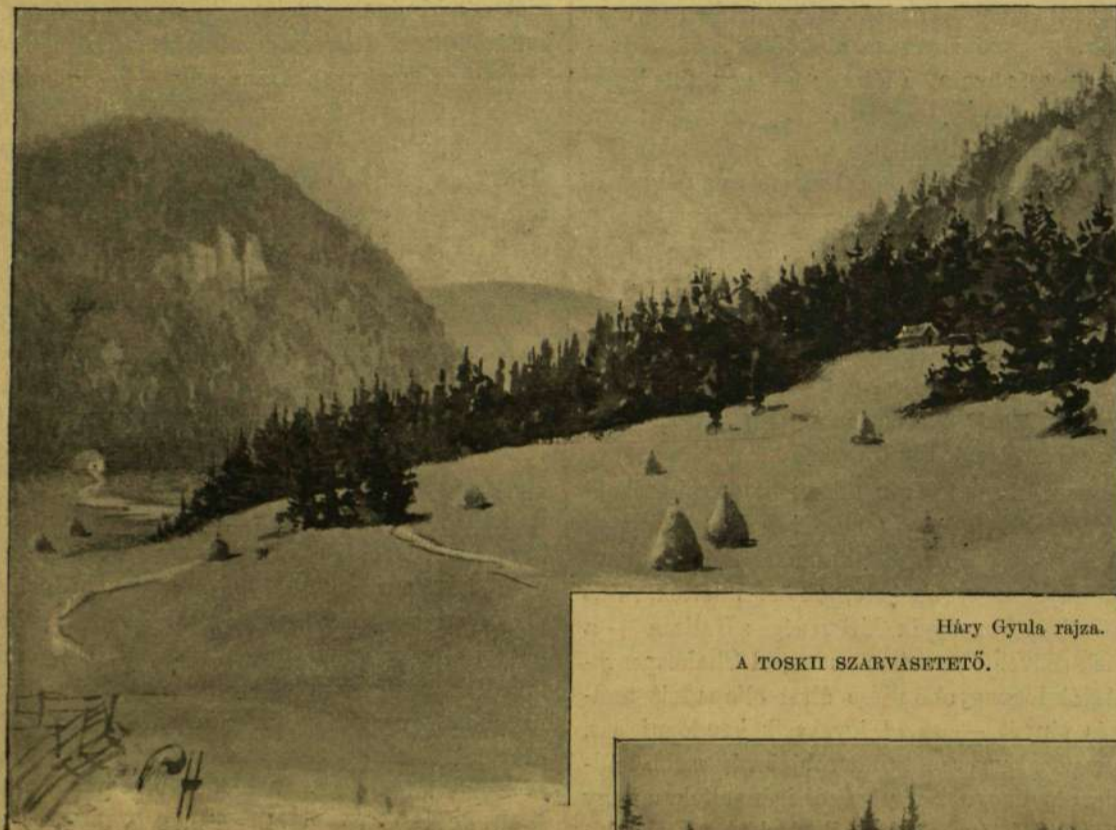
Háry Gyula rajza. A TOSKII SZARVASVETETŐ.

Hogy nélküle távozott, semmi esetre se bizonyítéka a húsz éves kor szenvedélyes ragaszkodásának, sőt nem bizonyítéka annak a gyengéd vonzalomnak se, a mely a fiatal apát a gyermekei édes anyjához fűzi. Minek ezeket azzal takargatni, hogy a családfenntartás erősebb kötelessége vitte őt a fővárosba, hiszen olyan korban volt, a mikor e kötelességnek még a tudatát is háttérbe szorítja az érzelmek hullámzása a szívben. Húsz évvel nem okoskodunk. A költészet és képzelet erejének olyan gazdagságával pedig, mint a minő az ő lelkében lakott: semmi esetre se. Vissza kell utasítani a rideg számítás, mint cselekvése rugóját. Számítás nélkül házasodott és a nélkül vitte Londonba az útja. Arra az ő családi élete csak kínáló alkalom volt, a mely egy vagy más alakban megjött volna az esetre is, ha a boldogság zavartalan fészket nyújtotta volna neki az otthona.