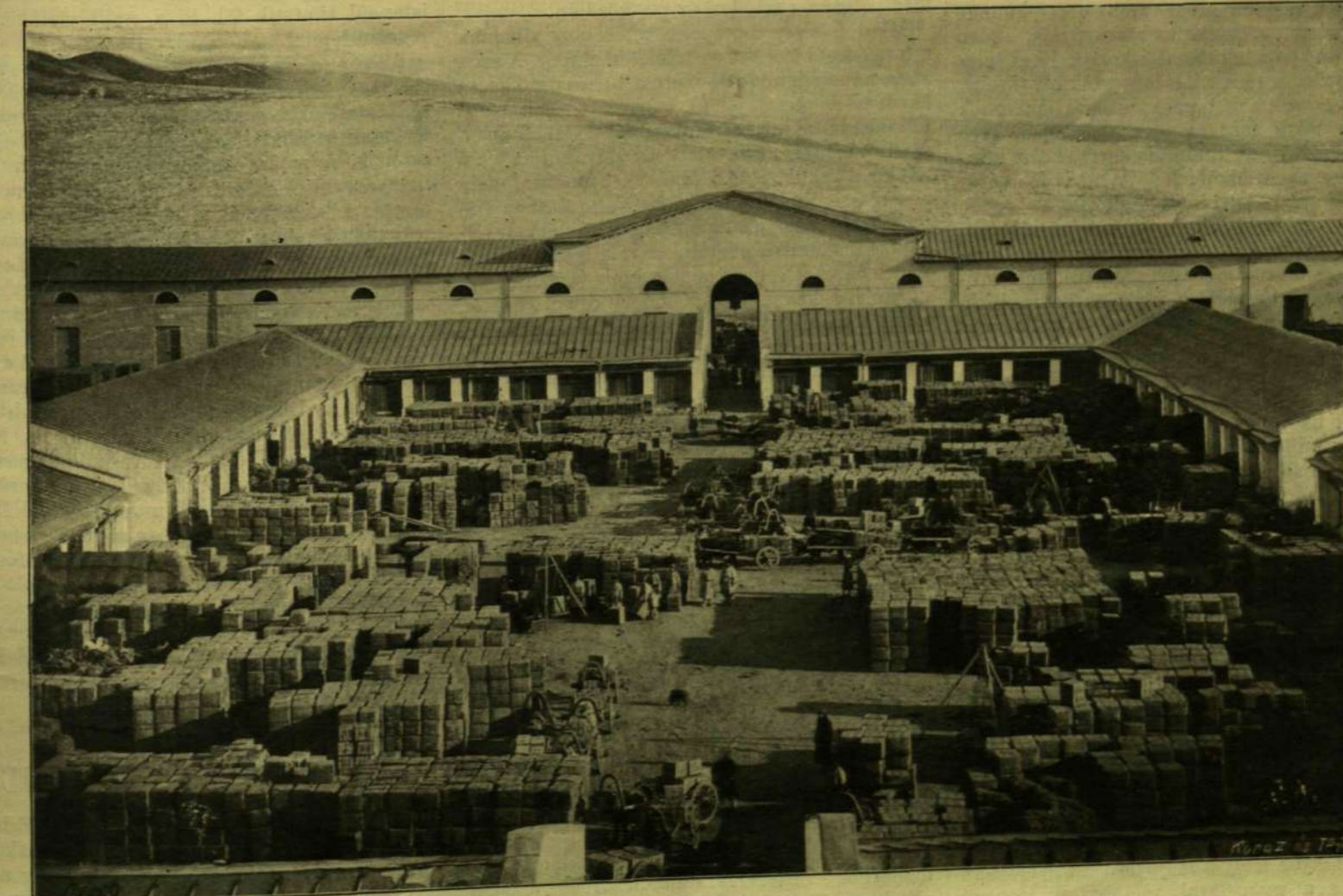
A EJACHTAI NAGY TEA-RAKTÁR.