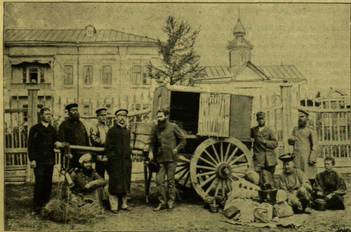
AZ URGAI OROSZ KONZULÁTUS ÉPÜLETE.

Szeptember 6-ika volt, mikor az 1750 méter magas «Chara mologojtu» hegyen át- és lehadtunk, borzasztó rossz úton a mongolok szent városa felé. Az iszonyú hőséget, szomjat, meg