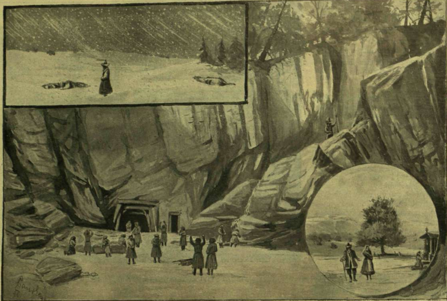
Rabok a szibériai ólombányában. (II. felvonás.)