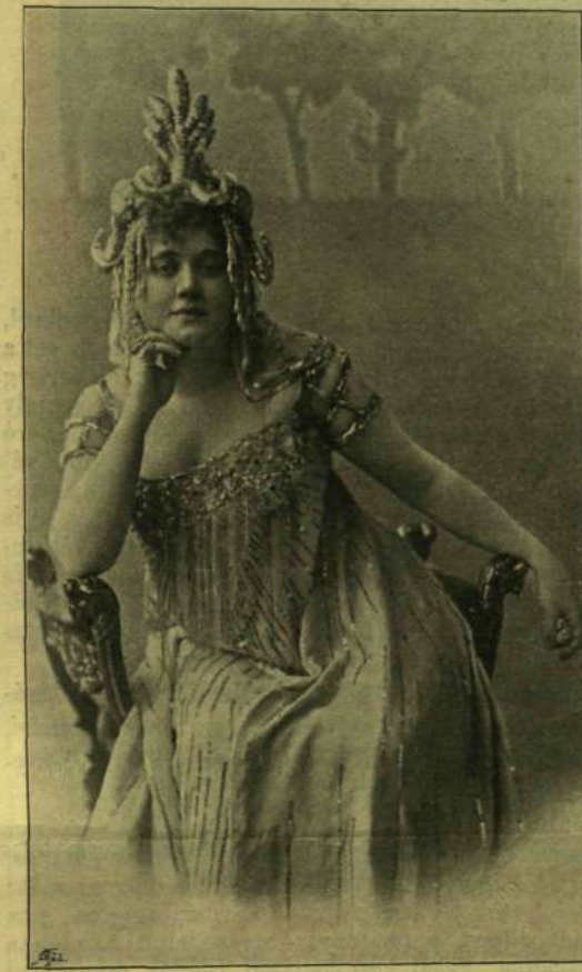
Uher Odón fényképei után.