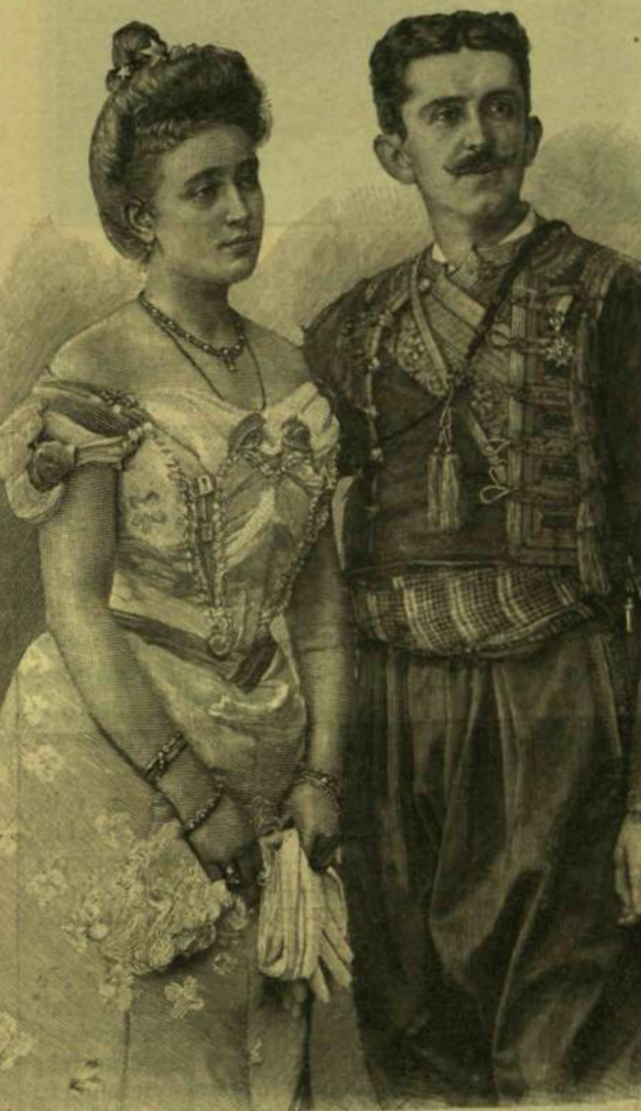
DANILO MONTENEGRÓI TRÓNÖRÖKÖS ÉS JEGYESE, JUTTA MECKLENBURG-STRELITZI HERCEGNŐ.

Halk, tiszteletteljes eljenzés hang-zott föl, aztán asztalához lépett Schlauch bibornok s megkezdte emlékbeszédet. Az alapító és védõ-asszony királynõ alakja iránt kívánja lerõni kegyeletét e napon az egyesület, — mondá — a melyhez különös kötelek fûzte az elhalt nagyasszonyt. Nehéz a fõladata, mert nem élõ kell dícsõitenie, hanem belemerülvé az iszonyu katasztrõfa gondolatába, a költõvel foljadjalni: infandum regina jubes renovare dolorem! A szenvedõk jõtévõ anyagha elszállt közülünk s a magyar história aranylapot nyit tettéinek, életé- nek, szeretetének. Ezután a fejedelemasszony ideális szívóságot, szíve szenvedéseit s a jó tettekben való enyhülést festette költõi lendü- lettel, majd sorra kerültek a király-asszony nemes munkássága, a gödöllõi szép napok. Erzsébet királynénak a nemzet politikai életében, a kiegyezésben való szereplése, szerete a magyarok iránt, Mailáth gróf, Falk Miksa és Ferenczy Ida szereplése, érdeklõdése a magyar irodalom iránt, részvéte nagyjaink halálán, majd a koronázás. A királyné Ô Felsége maga javították a Szent István palástján a hiányos helyeket.