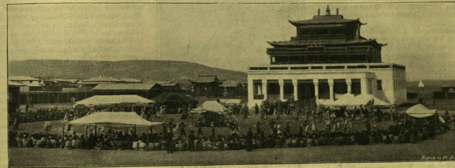
NAGY LÁMA-TEMPLOM URGÁBAN.