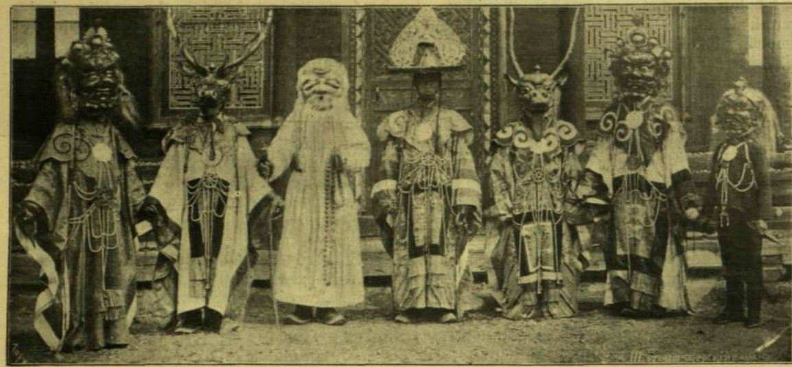
ISTENSÉGEK AZ URGAI TEMPLOMBAN.