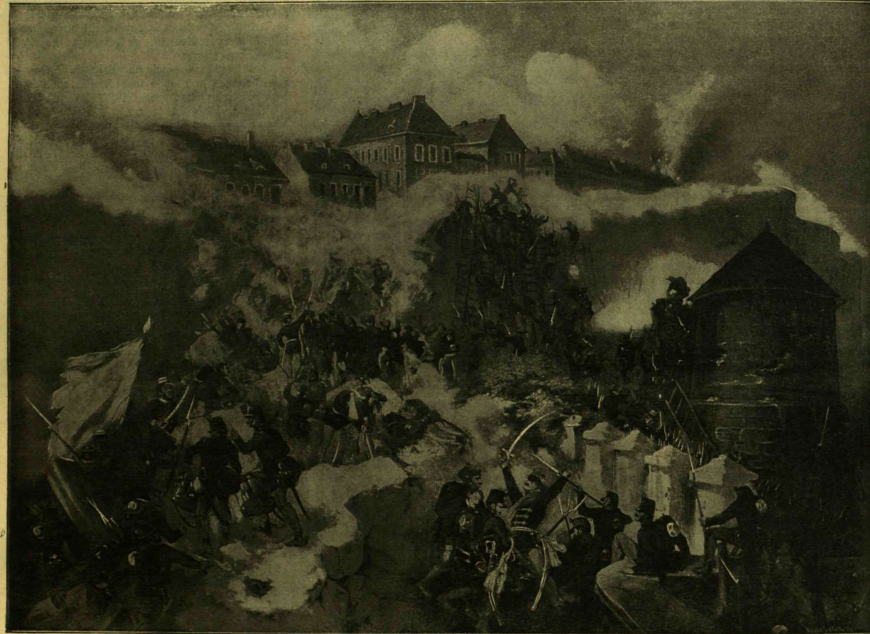
BUDAVÁR OSTROMA 1849 MÁJUS 21-ÉN. — A honvédek támadása a Teleki-ház alján levõ lőrésre.

* Manilában a háború elõtt rendkívül olcsó volt az élet. Igen szép 6—7 lakosztóbával, fürdõvel, mellék helyiségekkel, istállóval és kerttel ellátott házat lehetett kibérelni egyszáz forintért, öt fogásból és borból álló ebéd nem került többé 50 krajczárnál s egy egész család 3 cseléddel megélhetett 120—150 forintból havonként urisan.