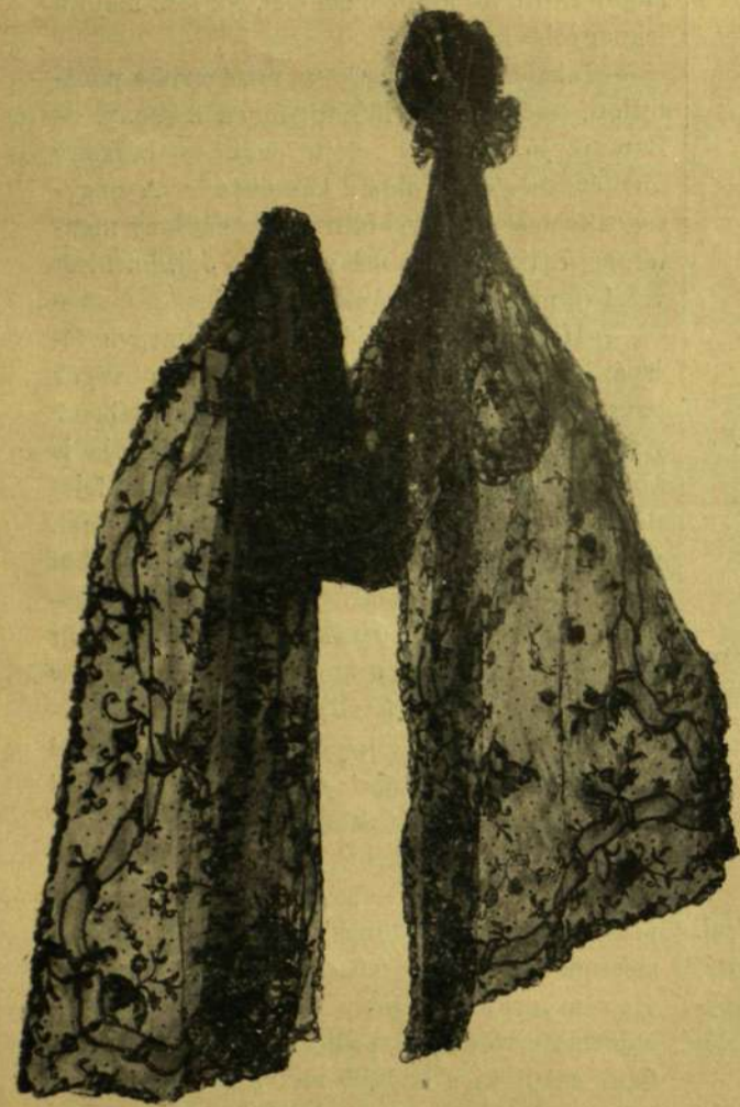
Fátyolos debreczeni főkötő.