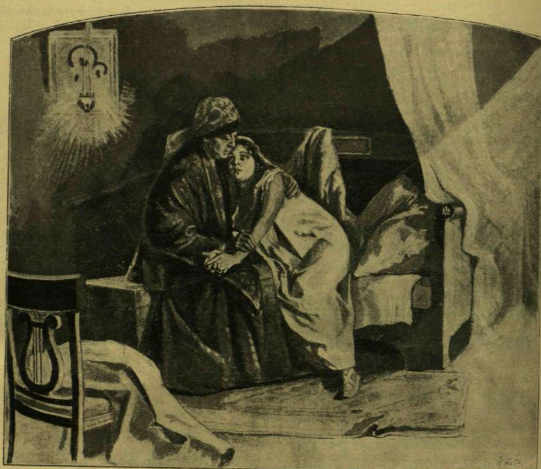
Szamokis-Szudkovszkoi E. P. eredeti rajza után.