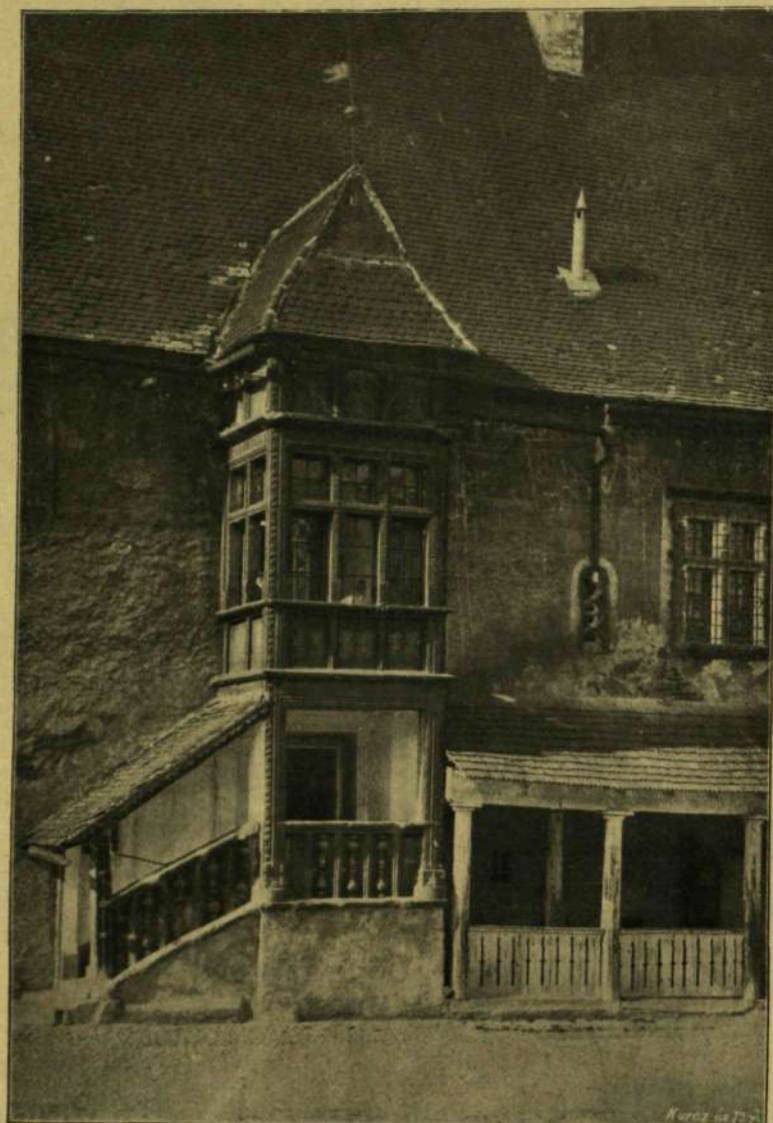
A BÁRTFAI VÁROSHÁZ ERKÉLYE.

fekete gyöngyörű fűzi össze, melynek vége a valódi fekete csipkéből készült kötényre hull. Úgy a magasan, a nyaknál csukódó, gazdag csipkebodorban fekvő ingváll, mint a bugyba kötött újjak fekete, valódi csipkéből való, csillogó gyöngydiszszel behintve. A parányi fekete bársony debreczeni fejkötőt keskeny fekete csipke köríti, mely hátul, remek csokorba kötve egészíti ki a fejdísz. A fejkötő alól, a fejről aláhulló gyöngyörű, hosszú, fekete fátyol szintén gazdagon van fekete üveggyönggyel kihimezve. Legyező, keztyű és a koronás E. betűvel himzett díszes szegélyű zsebkendő teszi teljessé az erkélyt.