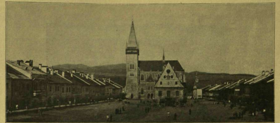
BARTFA FŐTERE A FŐTEMLOMMAL ÉS VÁROSHÁZZAL.

De el kellett hallgatniok, mert a tur-koppándi sziklakapuba érték. Mintha kard vágta volna ketté, rengeteg magasságra emelkedtek két oldalról a szikla-kapu falai, óriás tűkkel, rovátkos gúlákkal, szeszélyes alakú tornyokkal csipkézve. Alul meg fehér habot verve futott a Tur vize, el-elkapkodva a lovak lábát, a mint a sustergő, iszapos vízből kiálló sziklamederben ugráltak körül-köre. A nagy beszélgetést követő nagy hallgatástól észre sem vették, hogy a nehéz út miatt elkéstek, hogy mire a szikla-