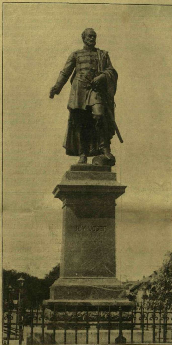
BEM SZOBRA HUSZÁR ADOLFTÓL, MAROS-VÁSÁRHELYT.