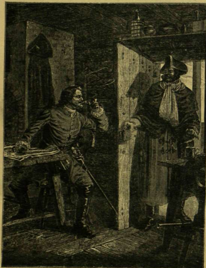
Stein R. eredeti rajza után.

Andrée levele. Július 11-ikén két esztendeje lesz, hogy Andrée harmadmagával léghajón indult el az éjszaki sark felé. Azóta elvesztek. A napokban Izland északi részén Mandelben két gyermek a tengerparton egy parafa golyót talált, szurokkal lepecsételve; a golyóban egy kis alumínium-doboz, s abban egy levél. A dobozon még «Andrée éjszak-