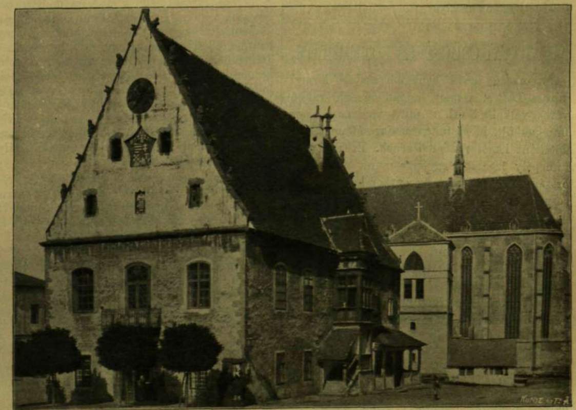
A BARTFAI VÁROSHÁZ.

* Társadalmunk egyik kiváló nőtagjának tollából közöljük ez érdekes ismertetést.