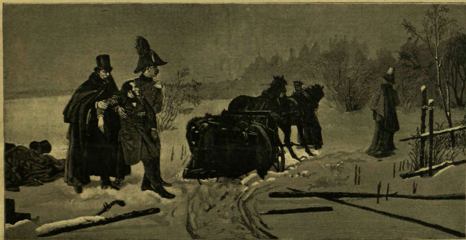
PUSKIN ÉLETÉBŐL. — PUSKINT A PÁRBAJ UTÁN SZÁNJÁBA VISZIK.