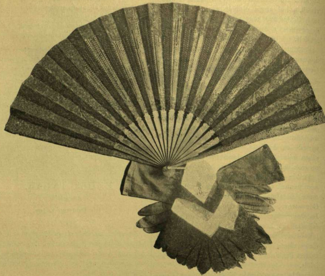
Legyező, keztyű és zsebkendő.