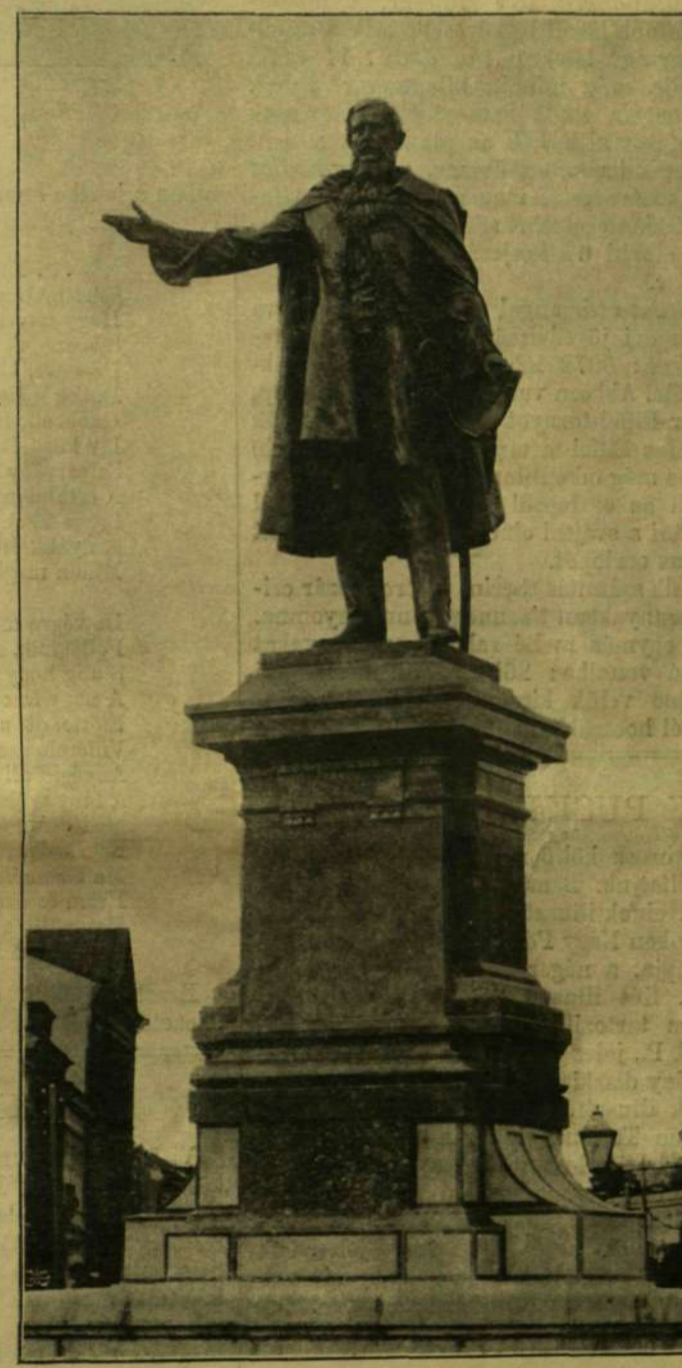
KOSSUTH SZOBRA KÖLLŐ MIKLÓSTÓL, MAROS-VÁSÁRHELYT.

hatást tesz a nézre. Hatalmas, fenkölt; merész, erős nézéséből, méltóságos, nyugodt, mégis kemény állásából azt érzem, hogy a kit ábrázol, egy nagy gondolat vezérének predestinálta az alkotó. A melyik napon eltávolították a szoborról a leplet, hogy lefotografálják, egy csomó kapás székely ember állingált a piacon, s mikor a napsugár jövedvében átölelte az érzékalakot, a férfiak áhitattal levették a süvegüket. Egy fehérbajszú öreg mély hangon így szólt az asszonyokhoz: