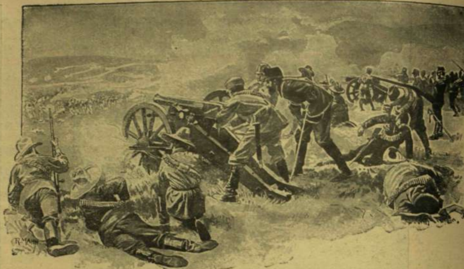
BOER TŰZÉREK HARCOZA.