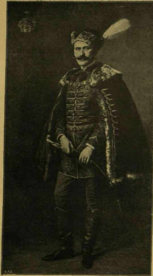
Stetka Gyula: Rónay főispán arcképe.

módra fogja őket kényszeríteni, a mely nem nekik való.