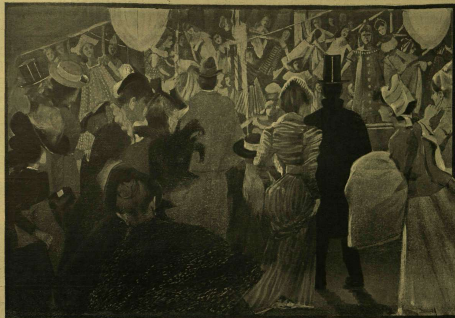
EGY BUDAPESTI JÁTÉKREKESKEDÉS KARÁCSONYI KIRAKATA.

A királyné budavári szobra. Néhai Erzsébet királyné születésnapja összesik karácsony ünnepével. Az országgyűlés és napra mindig elküldte szerencse-kívánatait. Most, halála után a második karácsonykor, a királyné emlékének megörökítésén buzgólkodik a kegyelet, s ép e napokban történetesen elhatározó intézkedések Erzsébet királyné nagy emlékezetének megörökítésére. A miniszterelnök palotában decz. 19-ikén értekezletre jött össze az Erzsébet-szobor országos bizottsága a miniszterelnök elnöklésével. A végrehajtó bizottság tett jelen-