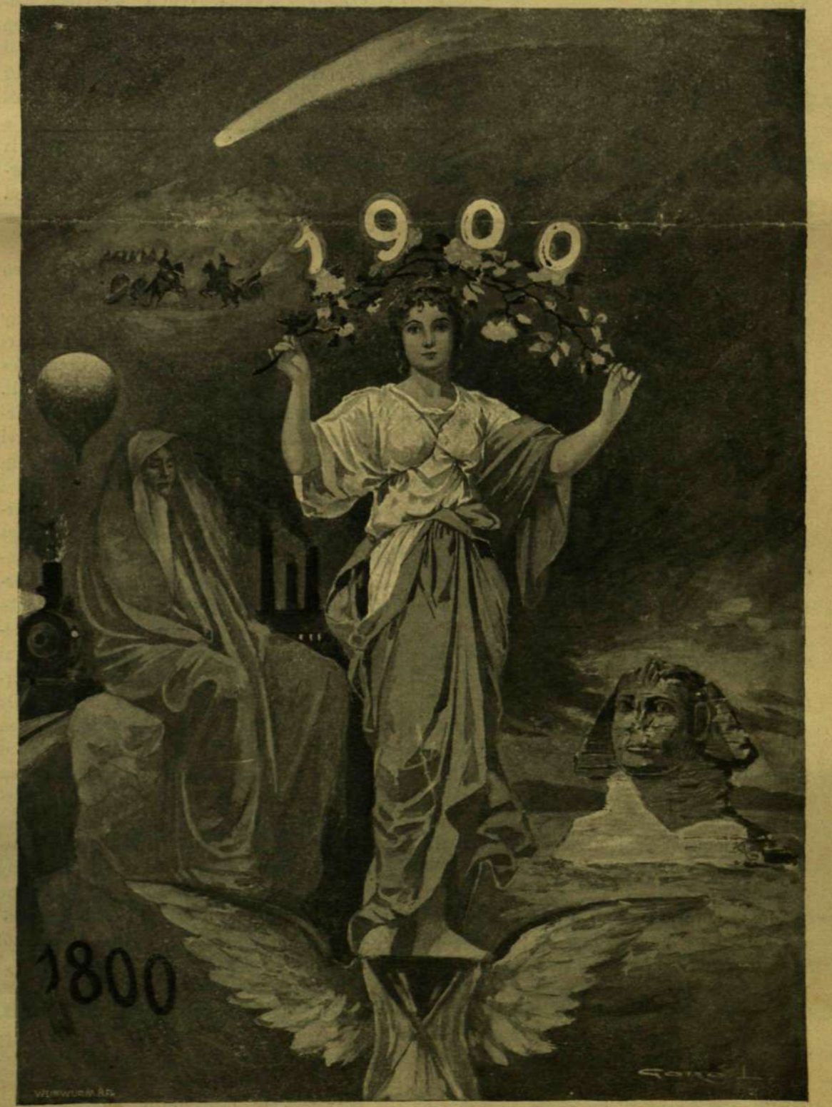
AZ ÚJ SZÁZAD KÜSZÖBÉN. Gerő Lajos rajza.

mely a szent szövetség és Metternich rendszerét elsöpörte. Igaz, hogy ezt a mozgalmat is elnyomták, s ott, a hol bölcsője volt, Franciaországban, III. Napoleon ragadta magához a hatal-