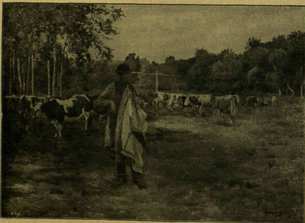
Zemplényi Tivadar: Itatónál.

* A hernyó oly falánk állat, hogy egy hónap alatt testénél 6000-szer nagyobb súlyú eledelt fogyaszt el.