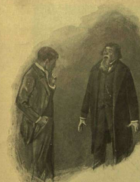
— Talán egy kis mustárflastromot a nyakára.

— Helyes. Úgy látszik, komolyabban veszi a dolgát, mint mi. — Az öreg asszony azt mondta, hogy úgy-e itt maradunk, a míg eláll a hóvihár. Persze, azt feleltem, hogy igen. E pillanatban bejött a cseléd.