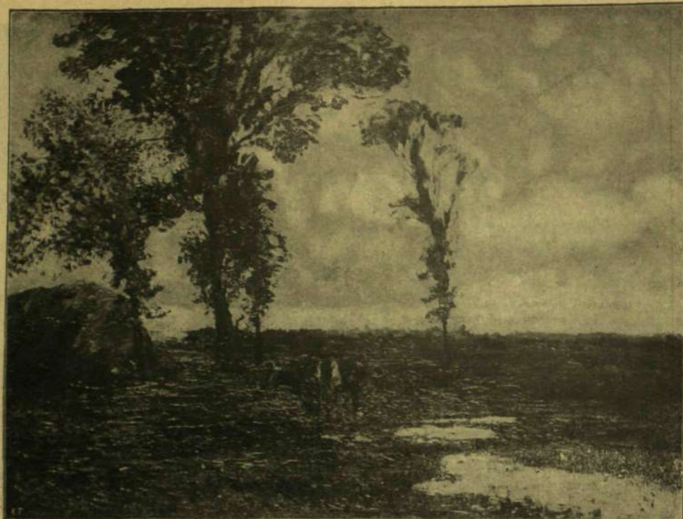
Szlányi Lajos: Csallókői tájkép.