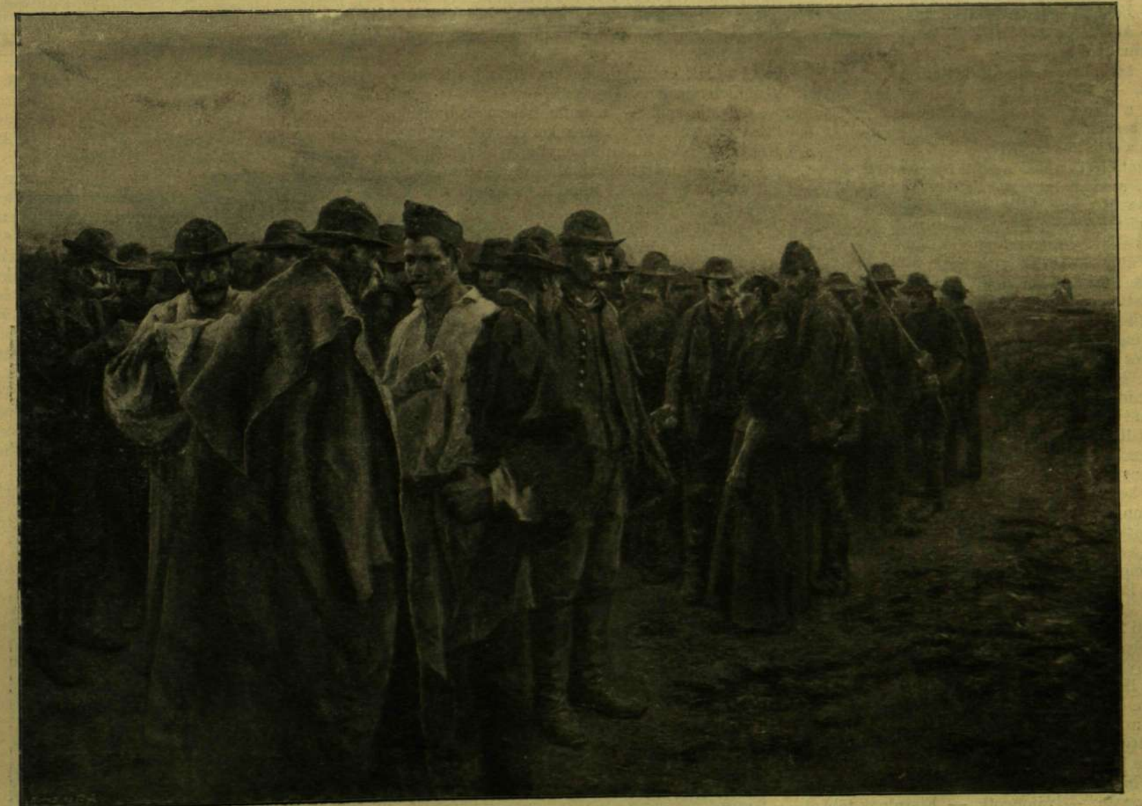
Révész Imre: Panem.