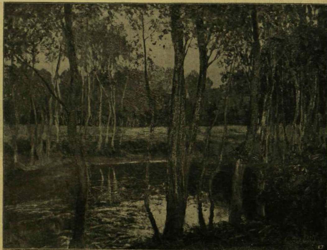
Olgay Ferenc: Törészet.

* A legnagyobb tudományos mű, mely eddig megjelent, az amerikai polgárháborúról szól. A kormány adta ki 100 nagy nyolczadérfát kötetben s minden kötetben átlag ezer lap van. A mű kötetei