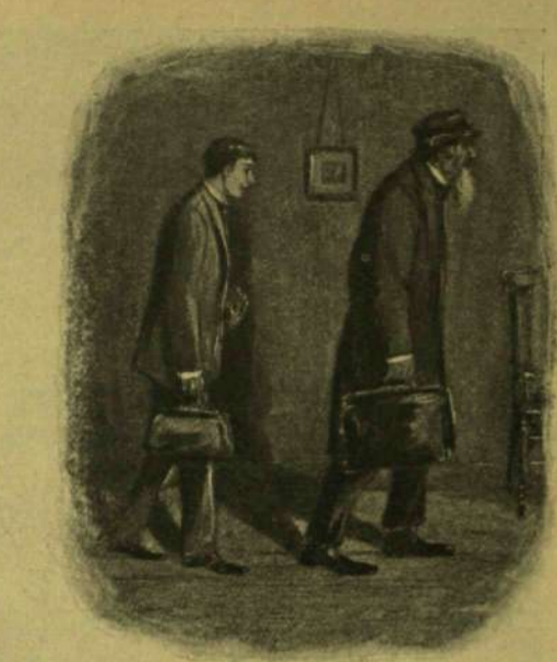
— Táskáinkkal kezünkben a konyha felé mentünk.

— Igen ám, ha volna, — morogott Beamish bácsi. — Csak üssön rá még egy párat.