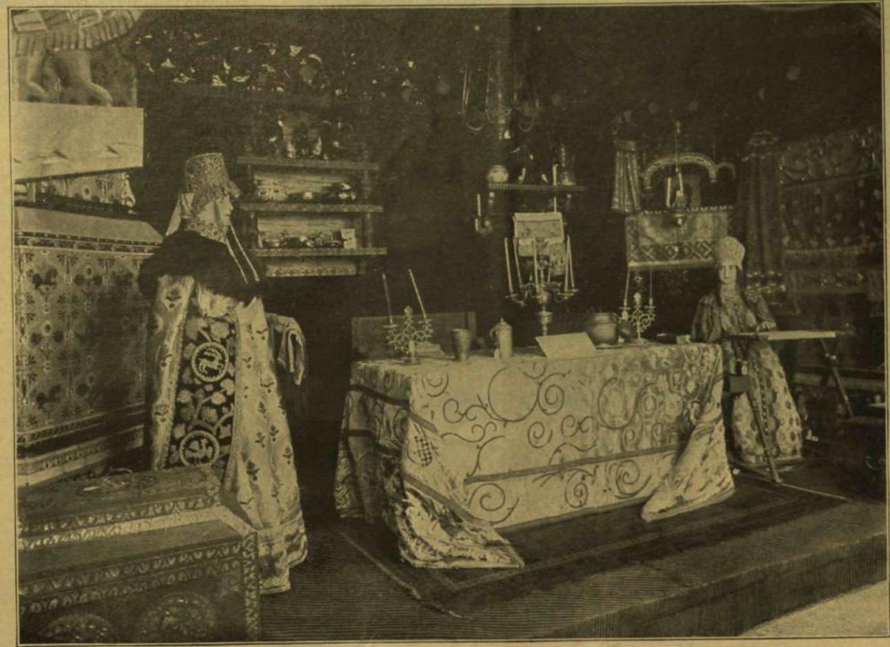
A PÁRISI VILÁGKIÁLLÍTÁS RÖL. — TEREM EGY RÉGI OROSZ FÖLDESÚRI LAKÁSBAN.

Az orosz házbán más látnivalók is vannak s ezek között sok a félvad népeké. Az európai