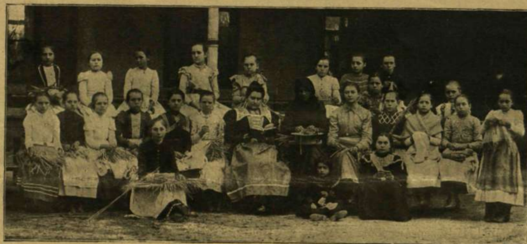
PELÓLVÁSÁS MUNKA RÖZBEN.

* Manila iparosai között nagyon ügyesek a drágakörmetszők és ékszerészek; különösen a nők oly ízléssel tudják az ezüst- és aranyékszereket