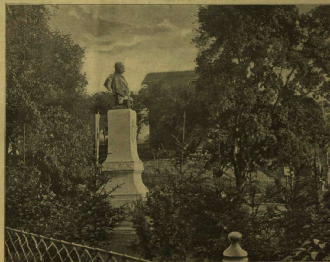
A KIRÁLY SZOBRA BRUCK-ÚJFALUBAN. Leírását múlt heti számunk közölte.

Kendi Pál a botjára támaszkodva megállt, úgy nézte a munkát. Az ő házat még az apja kezdte építeni, de ő toldotta ki, s a mikor falverők, ácsok, nádkötők dolgoztak rajta, épen