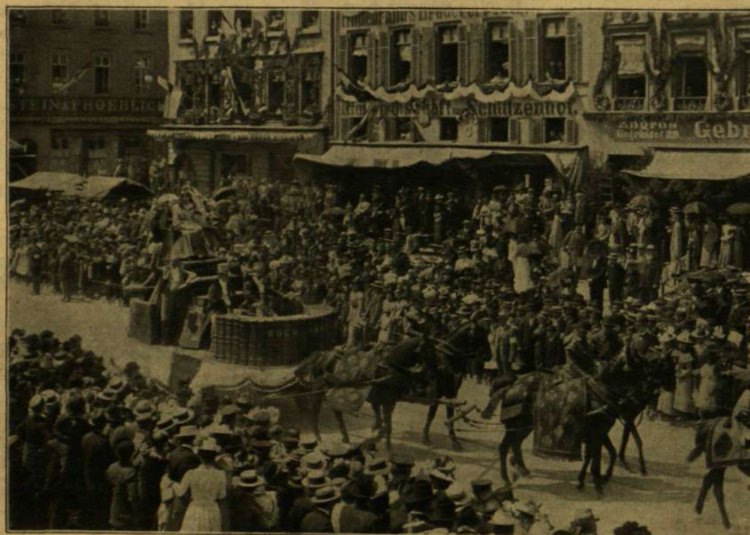
A LIPCSEI KÖNYVKERESKEDŐK KOCSJA.

Kendi Pál felriad. Mégis mintha valamit halana. A pitymalat szürkületében körülnéz a szobában. A Zsuzsa ágya üres, nem látja sehol az asszonyt. Erős hangon kiáltja a nevét. Mi az? Valami hang a pitvarban, fájó, hörgő, hosszas. A kutya kaparja a pitvar felőli konyhaajtót, nyöszörög, egyszerre pedig csak vonítani kezd azzal az ijesztő, fájdalmas hanggal, melylyel az állatok a rémületet és elizonyodást adják tudtúl.