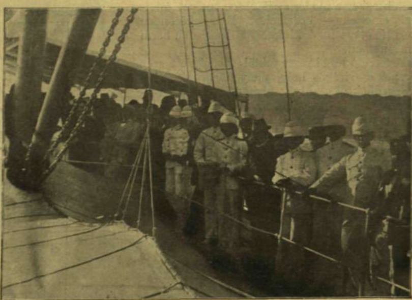
ANGOL TISZTEK EGY KIRÁNDULÓ HAJÓ FEDÉLZETÉN.