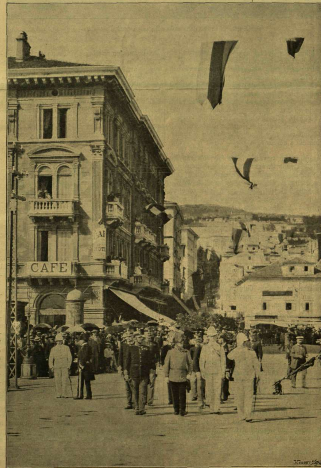
LORD BERESFORD ANGOL TENGERNAGY MEGÉRKEZÉSE FIUMÉRA AZ ADAMICH-MÓLÓRA.

Mint hogy a ministerek felelősek, nem lehet tőlük megtagadni azon jogot: hogy a tisztviselő-