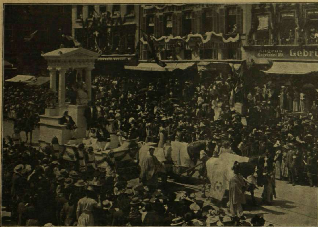
A NÉMET KLASSZIKUSOK CSOPORTJA.

Azt mondja, hogy kerül egyet, s a mint a tengerin túl befördül, a mikor Miska már nem láthatja, az erős és deresedő ember szeméből kicsordul két nehéz köny.