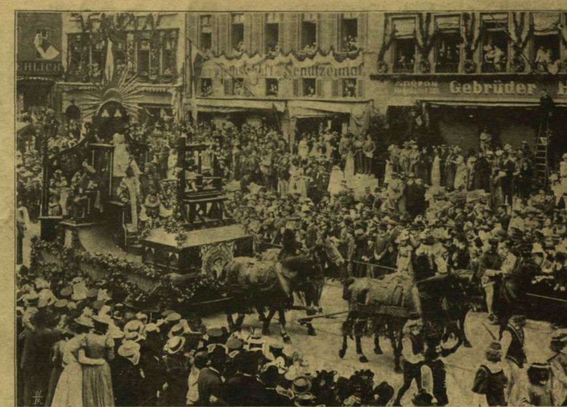
A TYPOGRAPHIA KOCSIJA, GUTENBERGGEL ÉS TANITVÁNYAIVAL.

A menet élén hírnökök, zászlóvivők, lovas zenészek haladtak, utánuk az első csoport fekete ruhás ifjakból állott, mindegyiknek mellén egy nagy fehér betű, a mozgatható betűkkel való nyomtatás jelképezői. Ezek után a Gutenberg tanítványainak jelmez csoportja, majd pedig a nyomdászat allegóriája: Typographia következett, négy ló vonta szekéren, melynek elején a megkoszorúzott kézi sajtó volt föllítva. A szekéren, mely egyik képünkön jól látható, Gutenberg üzletársainak, Fustnak és Schöffernek körében ül, a sajtó körül pedig első tanítványai foglalatoskodnak. Mainz város történetére emlékeztető páncélos lovagok alakjai kö-