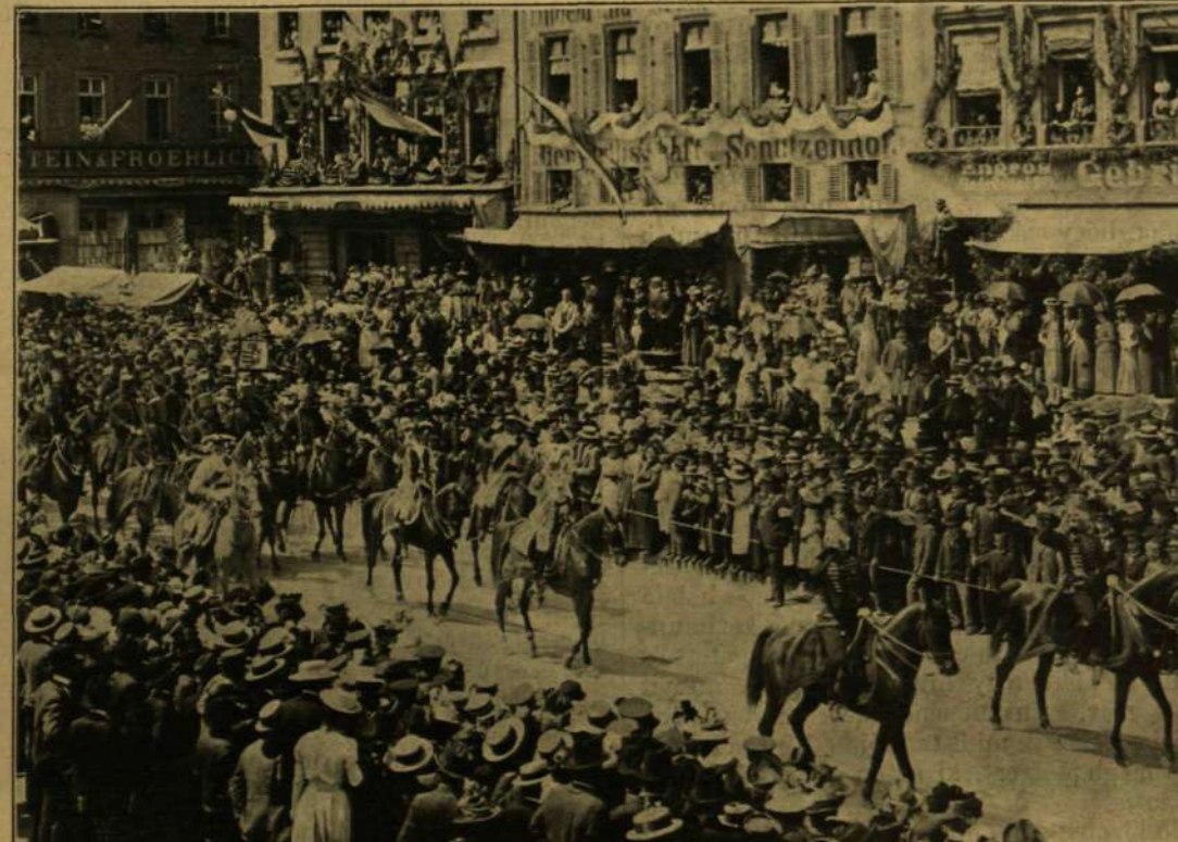
II. JÓZSEF CSÁSZÁR MAGYAR HUSZÁROK KISÉRETÉBEN.

Ez azonban korántsem jelenti azt, mintha a kínai nő természetétől fogva képtelen volna a tanulásra. A kínai kormány hivatalos felszólítása folytán a csikagói világkiállításán 1893-ban Kung-Kwang-Yu felolvasást tartott Konfuczius vallásáról. A mandarin egész behatóan ismer-