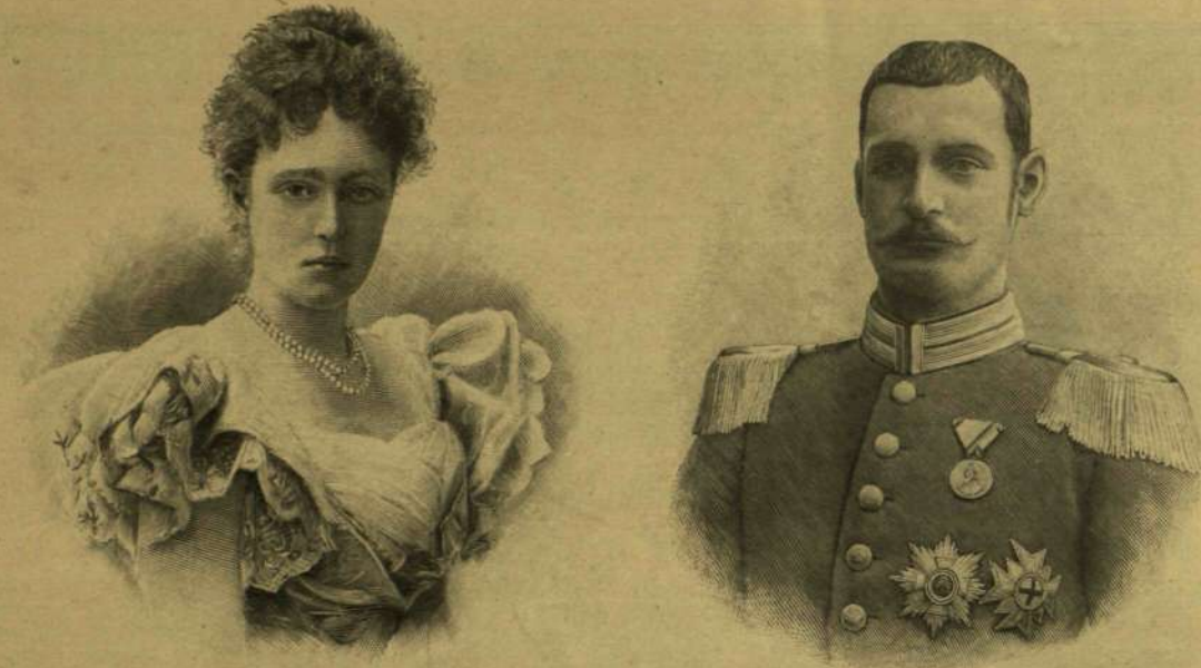
MÁRIA GABRIELLA BAJOR HERCEGNŐ ÉS FÉRJE, RUPPRECHT BAJOR HERCEGE.

tetvén a kínaiak e fő vallásfeleketét, a nők állásáról is nyilatkozott. Konfucius vallása, mely egyúttal a törvények s a szokásoknak is az alapja, azt tanítja, hogy a nőnek kötelessége férjéhez úgy föltekinteni, mint a férfi istenéhez föltekint. A nőnek nem szabad semmit se tanulnia, csak a mit a férjétől tanul s a mire ez őt tanítani akarja. A nevezett kínai tudósait is fejtegette, hogy a benszülöttek azért viseltetnek oly nagy ellenszenvvel a hittérítők iránt, mert ezek azt tanítják, hogy a nők, akár férjeiktől függetlenül s azok ellenére is, feltétlenül higgyenek a kereszténységben. «Khinában — mondja — a nők nevelésének és tanításának kötelessége a családöt illeti; első feladat, főerény a nő szerénységének megővése.»