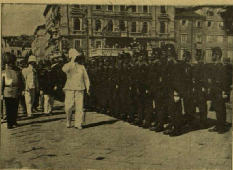
LORD BERESFORD FIUMÉBAN SZEMLÉLT TART A DÍSZSZÁZAD FÖLÖTT.