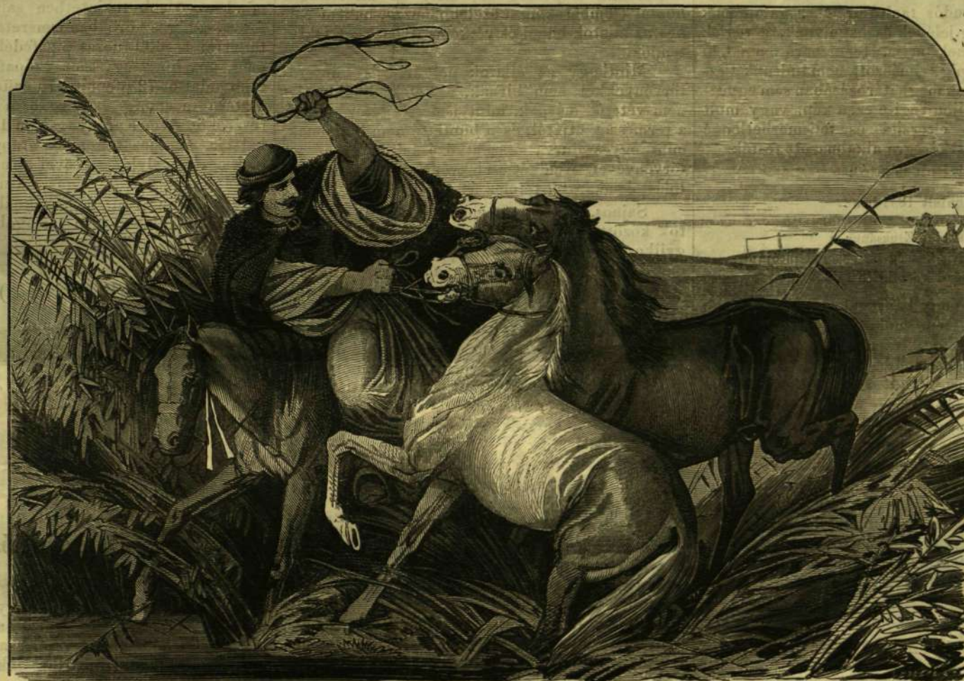
Képek a hazai népeletről. XXXIII. Lókötő a Tisza partján. — (Lotz után Jankó.)

(Pölöske. Sz.-Mihályi templom. Szent sűrű. Kettős várhely. Hahóti apátság. Tisztítsuk a szemét a polydótl. Szent négyuszög. Hahóli Zsuzsanna. Kételeg.)