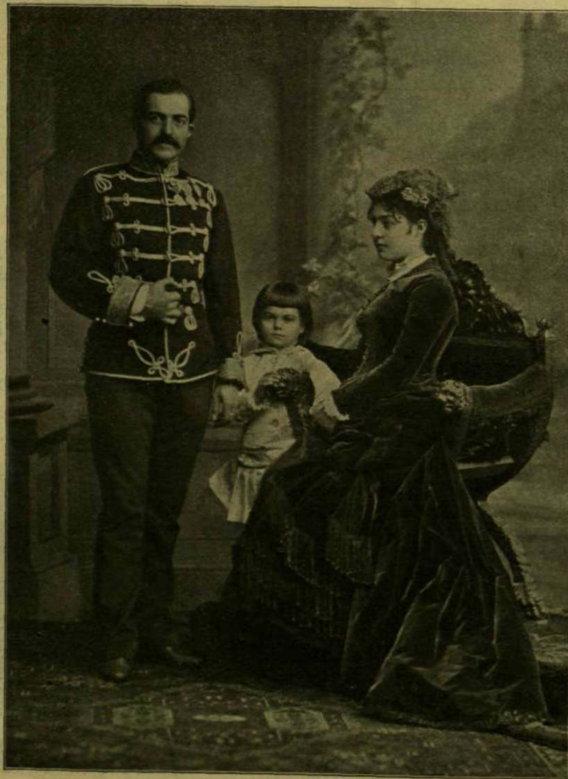
A nyolczvanas évek elejéről való fénykép után. MILÁN KIRÁLY CSALÁDJÁVAL.

Az ifjú Sándor király, a ki 1893-ban váratlan föllépésével nagykorúnak nyilvánította magát, nem bírván eligazodni a folytonos pártviszályokban, 1894-ben hazahívta atyját, a ki azonban csak egy évig maradt fia mellett, mint tapasztalt tanácsadó. 1895-ben ismét Párisba költözött, míg 1899-ben újra engedett fia hívó szavának. Ezúttal mint a hadsereg főparancsnoka tért vissza és sok érdemet szerzett a szerb hadügyi szervezése és fejlesztése körül. Ekkor követett el ellene merényletet egy Knezevics nevű ember s ő ezt az alkalmat fölhasználta a radikális párt vezetőinek porbe idézésére és elítélésére. Egy ideig benső volt a viszony Milán és fia közt s csak a múlt évben