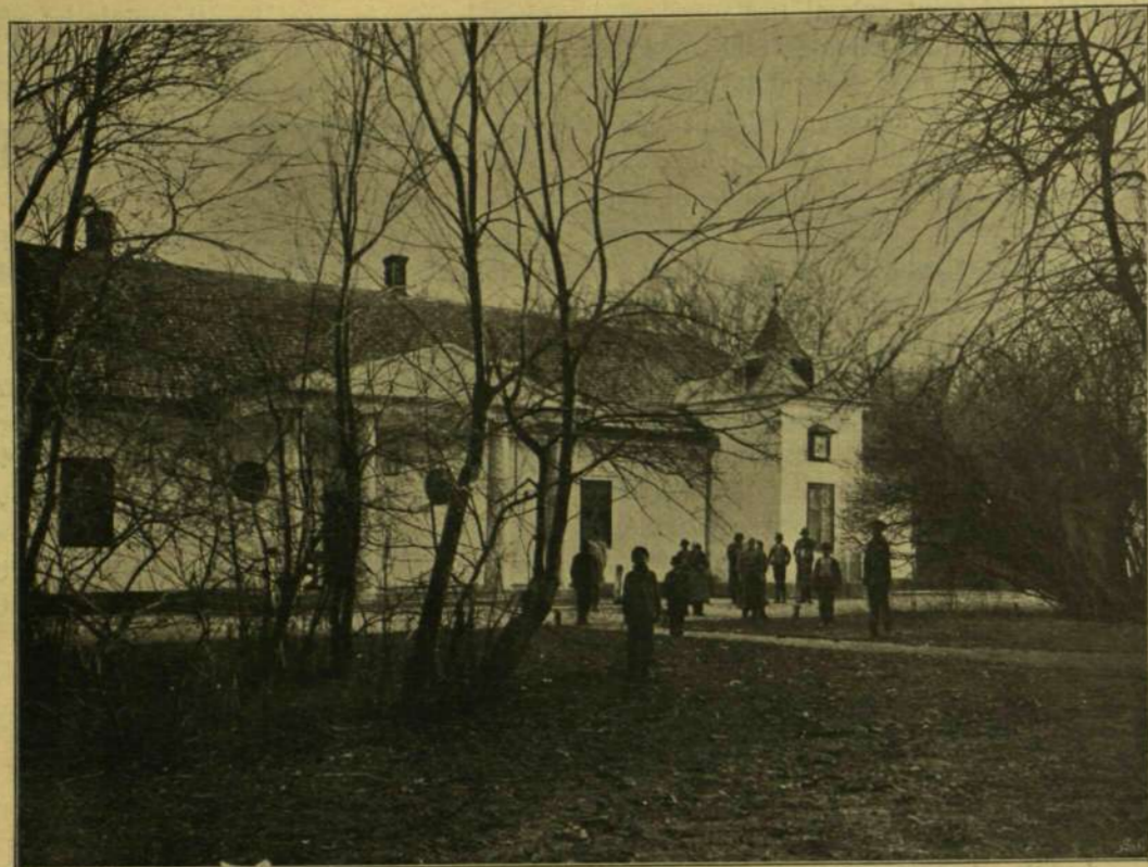
A TARNÓCZI KASTÉLY. (A „Gróf Butler János ifjúsága” című képművehez.)

háziúr huszárja s jelenti a grófnak, hogy a méltóságos grófné érkezett meg. A gróf nem érti a dolgot; a szolgáló ismétli mondókáját.