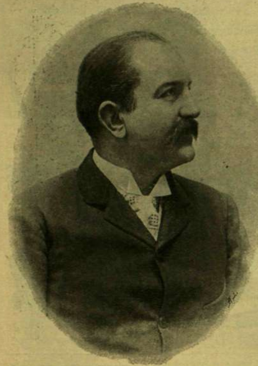
1893. évi fénykép után.