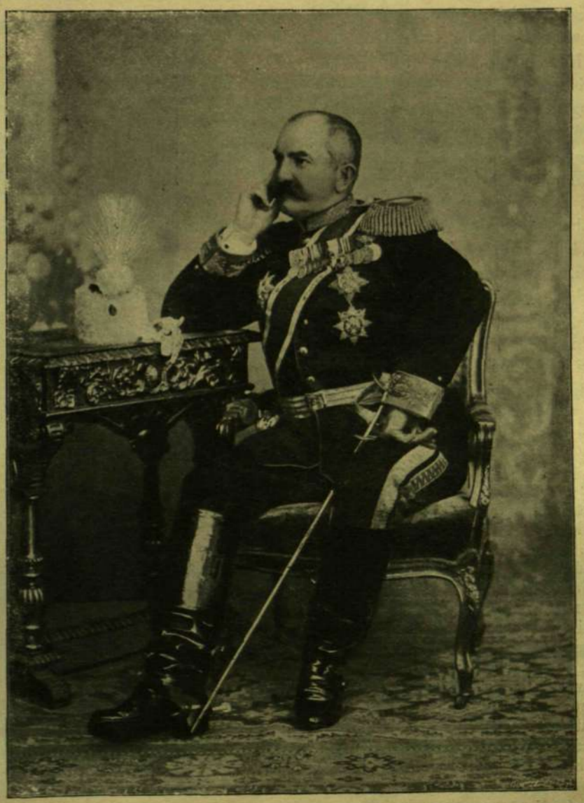
MILÁN MINT A SZERB HADSEREG FŐPARANCSONKA. — Belgrádi fénykép után.

ket, aligha fog oly szigorúan ítélni Milán királyról, mint a kortársak nagy része. Jellemében meg fogja találni azt, a mi családi örökség benne s nem a maga szerzeménye; javára fogja számitani elhibázott, czél és terv nélküli nevelése hatását; meg fogja látni benne a belső ellentétet a keleti ember veleszületett hajlamai és a lelkébe oltott, de lelkétől idegen műveltség között; elismeréssel fog megemlékezni államférfiúi tehetségéről; sok dologban, a miből ma még vádat kovácsolnak ellene ellenségei, neki fog igazat adni, tanuskodván jóhiszeműsége és jóakarata mellett, Kétségtelennek kell tartat-