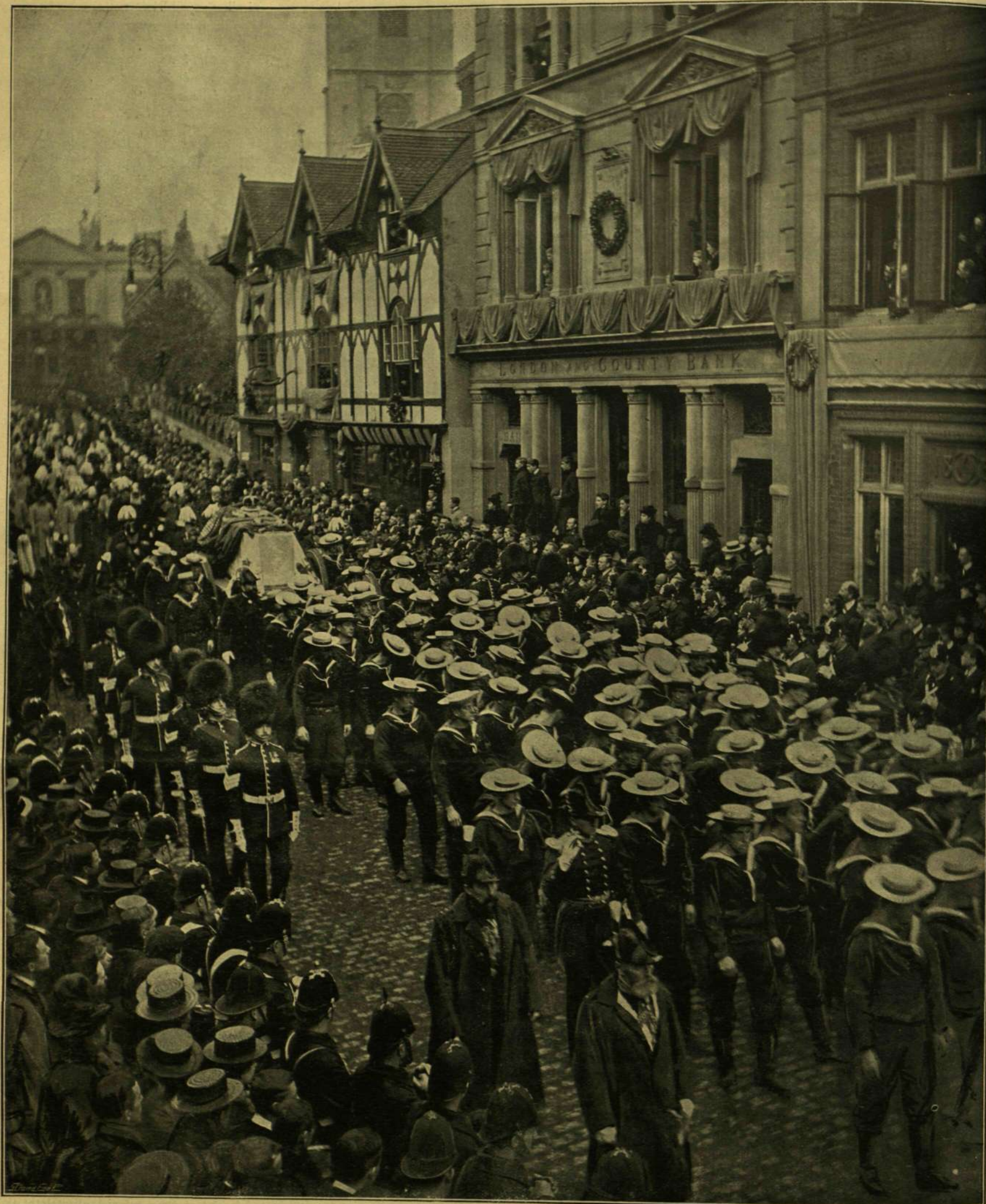
VIKTÓRIA KIRÁLYNŐ TEMETÉSE. — Tengerész katonák vontatják a királynő koporsóját.

* A bíbornokok piros kalapját a pápa adja az újonnan kinevezett bíbornokoknak, de a hagyományos szokásoknak megfelelően a kalap átvitele legalább 10,000 koronába kerül, mivel az új bíbornokok ajándékokat kell adni a Vatikán alkalmazottjainak, a kamarásoktól kezdve a szakácsokig, kéményseprőkig és a városi gárdistákig, továbbá a Propaganda fidei intézetnek, a bíbornok nevével viselő egyháznak; mindenekfelett kinevezésétől fogva egész addig, míg a nyilvános konsistoriumban a bíbornoki kalapot átadják, folyvást adományokat kell kiosztogatni a szegények között.