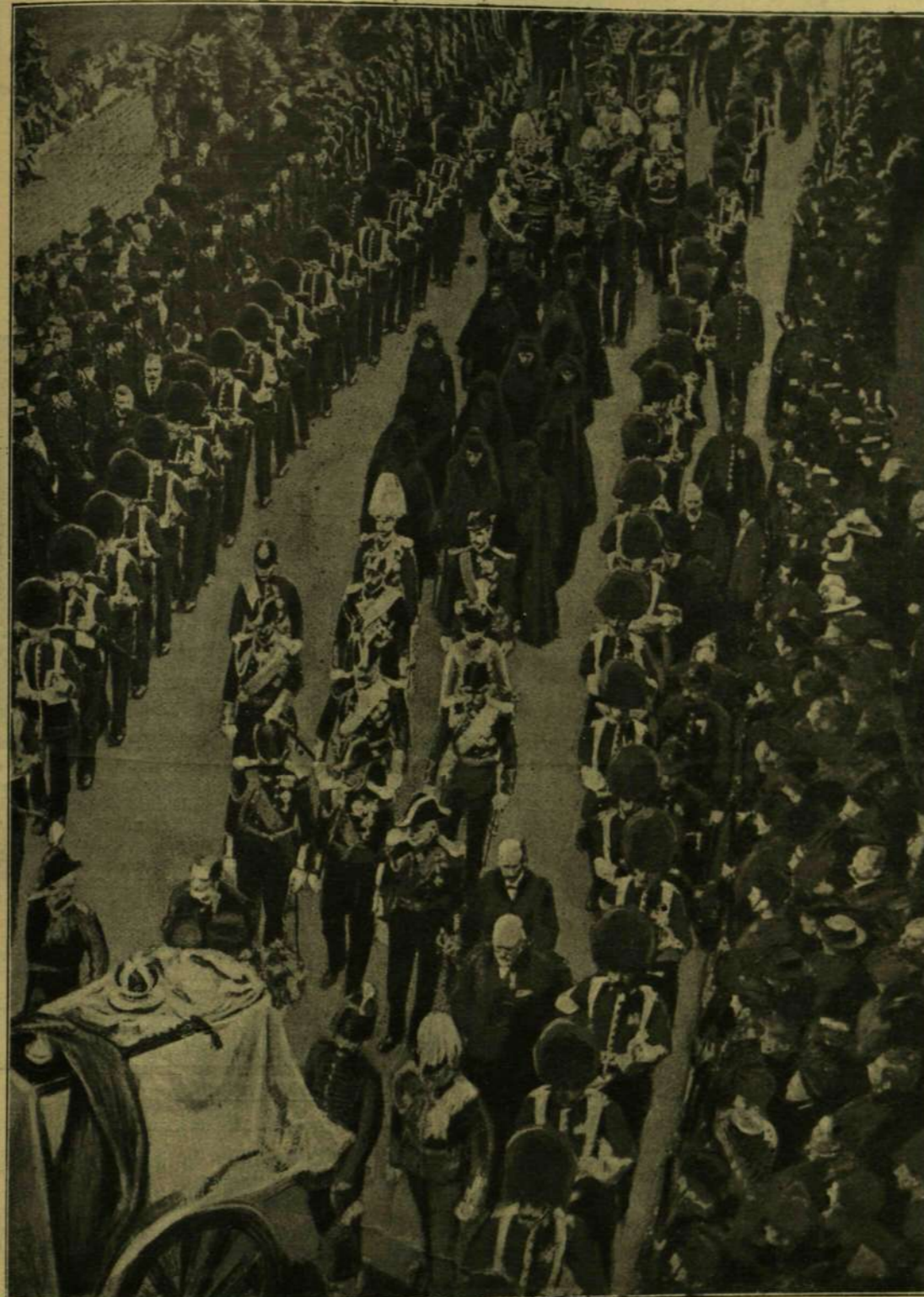
VIKTÓRIA TEMETÉSE. — A királyi család tagjai a királyi koporsója mögött, Cowesben.