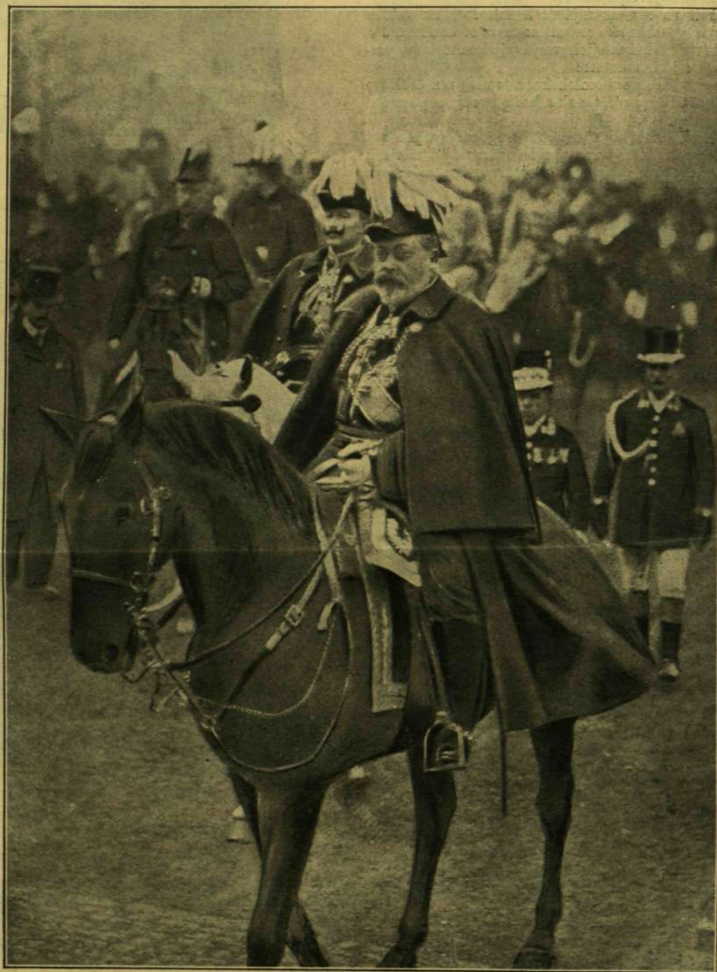
VIKTÓRIA KIRÁLYNŐ TEMETÉSE. — VII. Edvárd király és II. Vilmos német császár a gyászmenetben.

A magyar írók segély-egylete a mult esztendő második felében 2400 korona alapítványt nyaral-