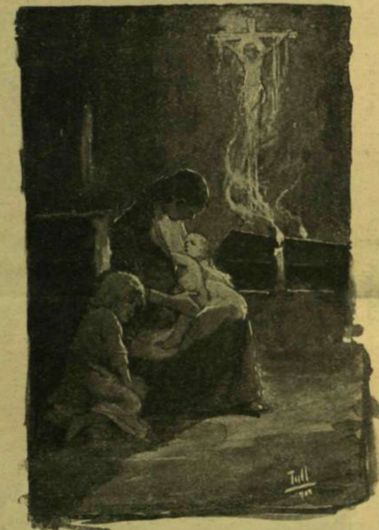
Tull Ödön rajna.