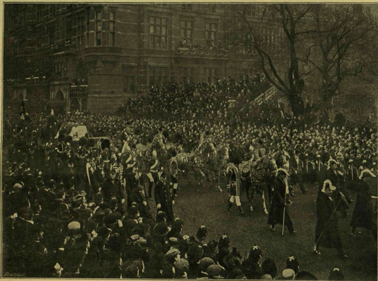
A KIRÁLYNŐ KOPORSÓJÁNAK ÁTVITELLE LONDONON, A PICCADILLY VÁROSRESZBEN.

segéde fogadott, azzal a kijelentéssel, hogy mi helyt a török követ, a ki a királynál kihallgatáson van, kijön, engem fog Milán király fogadni. Kívülem még vagy tíz más ember várt az előszobában kihallgatásra, mindenféle magasabb rangú katonák és különféle állami hivatalnokok. Midőn Milán király Ő Felseje elé járultam, barátságosan üdvözölt. Jobbját nyújtván, nagy szívélyességgel így szólt: «Isten hozta, kedves igazgató uram! Mi régi jó ismerősök vagyunk. Nemde ön volt az, a ki Budapesten az országos kiállításon kalauzolta a fiamat? Gyönyörű, szép kiállítás volt az, nem győztem eleget bőkolni a magyaroknak. Valóban nagy hazafiak ők! Így kell szeretni nemzetet és hazát! Mi szerbek sokat tanulhatnánk a magyaroktól!» A király elegáns, rövid polgári kabátban volt. A bolgár háború sikertelensége, az az után