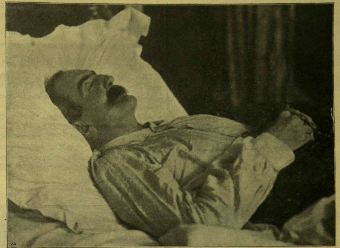
MILÁN A HALOTTAS ÁGYON.

A fekete kávénál már nagy változás állott be sorsomban. Milán király panaszkodott, hogy Tátrafüredről nem lehet nagyobbajta kirándulásokat tenni, legfeljebb gyalog, hegyi partikat, a minek ő nem valami nagy barátja. Erre én előhozakodtam a lengyel Szezavniczával, meg a dobsinai jégbarlanggal, a mire ő Felsője kijelentette, hogy nagyon szívesen kirándúlna ezekre a helyekre, de csak azzal a föltétellel,