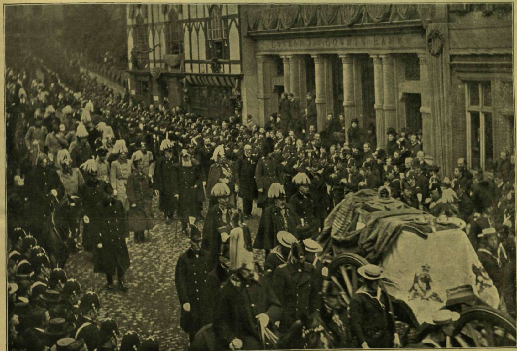
A KIRÁLYI CSALÁD TAGJAI A WINDSORI GYÁSZMENETBEN.