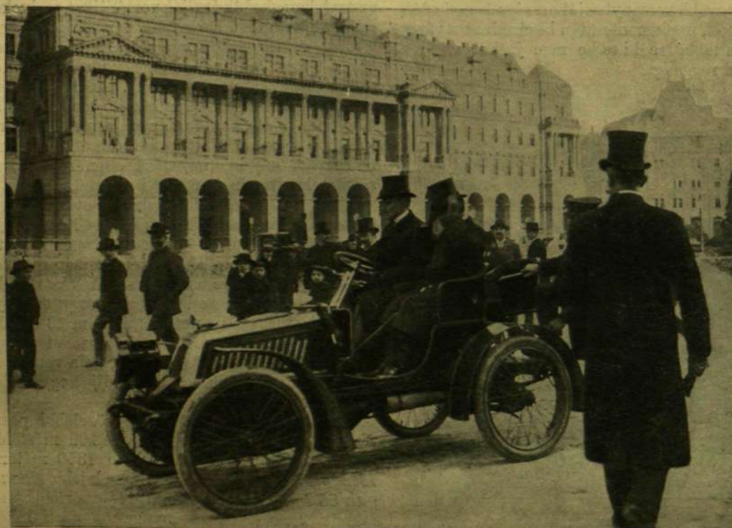
A SZÍMI TRÓNÖRÖKÖS GRÓF SZAPÁRY PÁL AUTOMOBILJÁN AZ ÚJ ORSZÁGHÁZ ELŐTTI TÉREN.