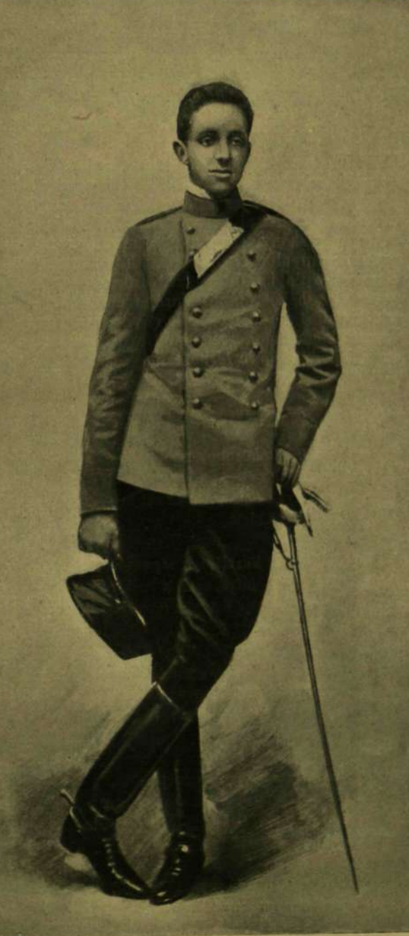
XIII. ALFONZO SPANYOL KIRÁLY.

Az ifjú király eddigelé természetesen keveset szerepelt a nyilvánosság előtt, csak nagyobb nemzeti ünnepeken jelent meg nyilvánosan anyja oldalán. Egy-egy kedves gyermek-adoma, egy-egy részlet neveltetése módjáról ha néha közölni válna; egyébként a nyulánk, halvány ifjú szorgalmasan készült jövendő feladataira, a melyek ugyancsak próbára fogják tenni ifjú erejét. Ideje legnagyobb részét tanulmányi foglalták el, a mi ezen felül maradt, testgyakorlatokkal, gyermeki szórakozással telt el. Gondos anyja szigorúan tartotta. Reggel hét órakor télen-nyáron fel kellett kelnie, nyolc órakor megreggelizett nevelője társaságában, aztán anyja üdvözlésére ment. A napi munka kilenc órakor kezdődött s két órai tanulás után ugyanannyi időt szentelt játéknak, testgyakorlatnak, lehetőleg szabad ég alatt. A katonai gyakorlatokat hét előkelő főúri ifjúval együtt végezte.