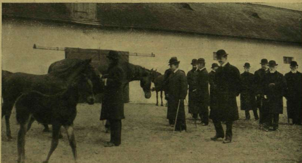
A SZÍMI TRÓNÖRÖKÖS A LOVAKAT SZEMLELI GÖDÖLLÖN.