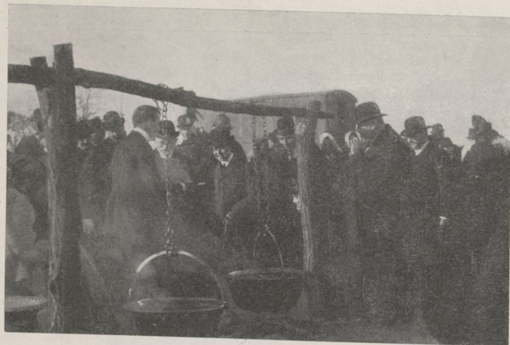
A trónörökös megkínálják gulyáshússal.

rendkívüli taggá nevezte ki, tizenegy évvel később pedig ezen tudományos testületnek rendes tagjává lett. Mint ilyen, számos orvostörténelmi és közegészségi ügyben felülvéleményt dolgozott ki és adott elő. Részt vett a budapesti orvosi kör megalapításában is s annak élete végéig választmányi tagja volt.