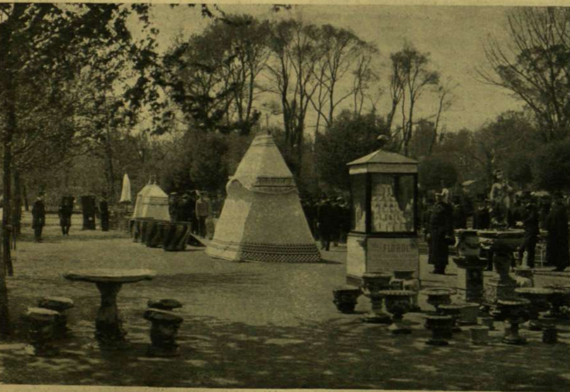
KERTI VÁZÁK ÉS SÁTRAK.