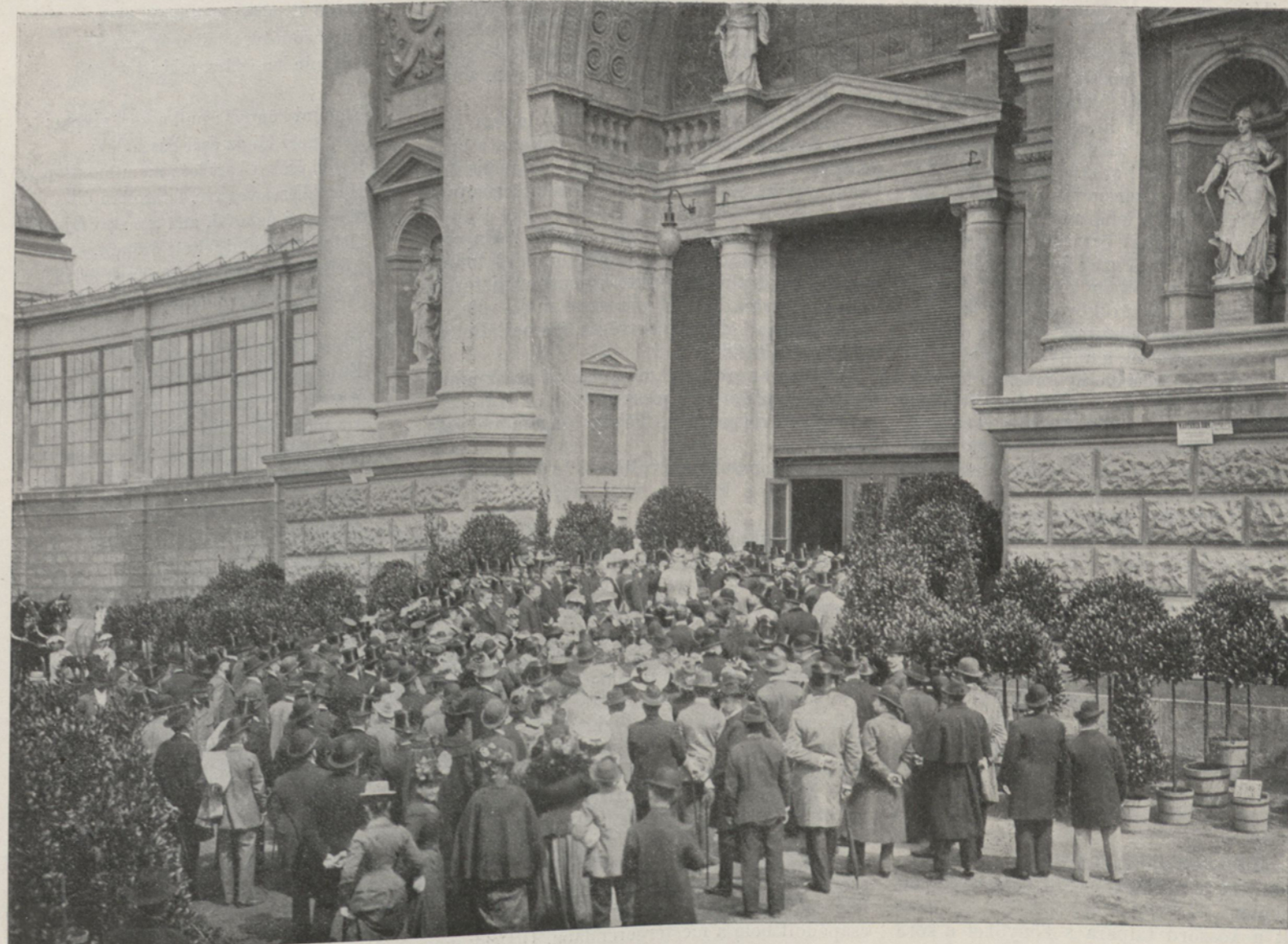
A KIÁLLÍTÁS MEGNYITÁSI ÜNNEPELYE.