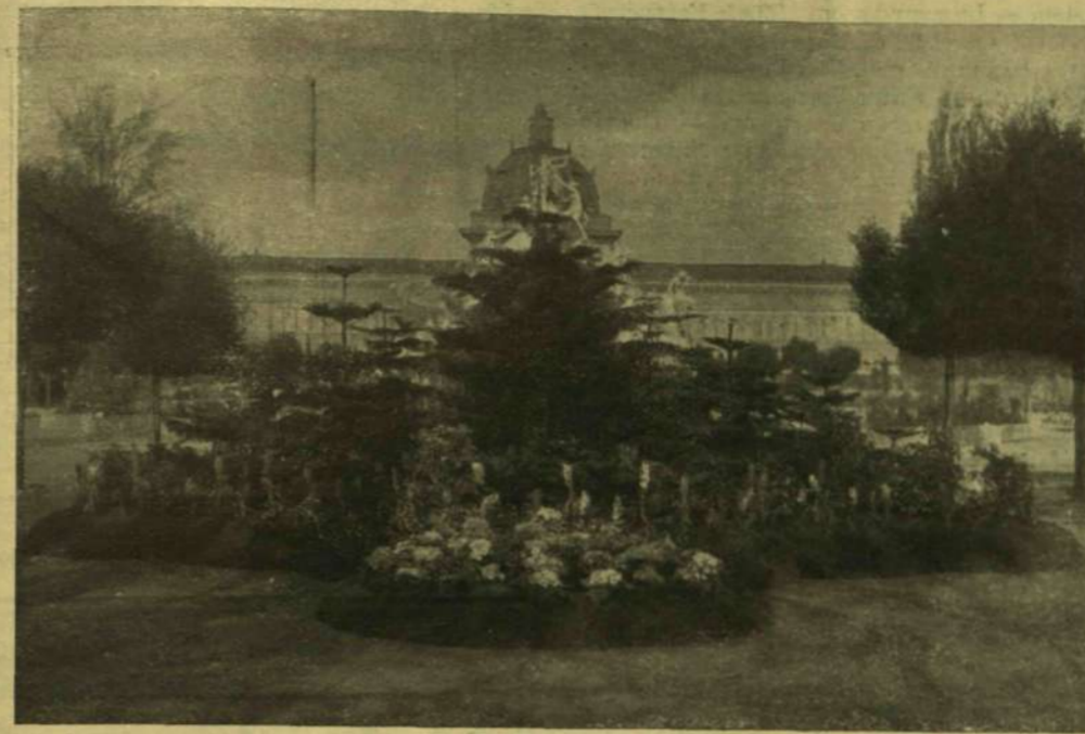
BUDAPEST FŐVÁROS FENYŐGYŰJTEMÉNYE.