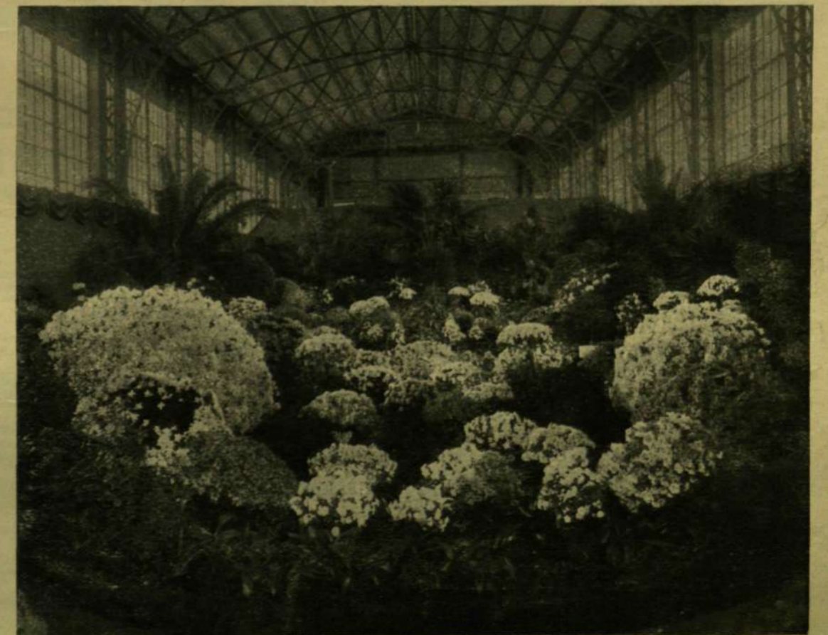
BUDAPEST FŐVÁROS KERTÉSZETÉNEK KIÁLLÍTÁSA AZ IPARCERNOKBAN.

A KERTÉSZETI KIÁLLÍTÁSBÓL.