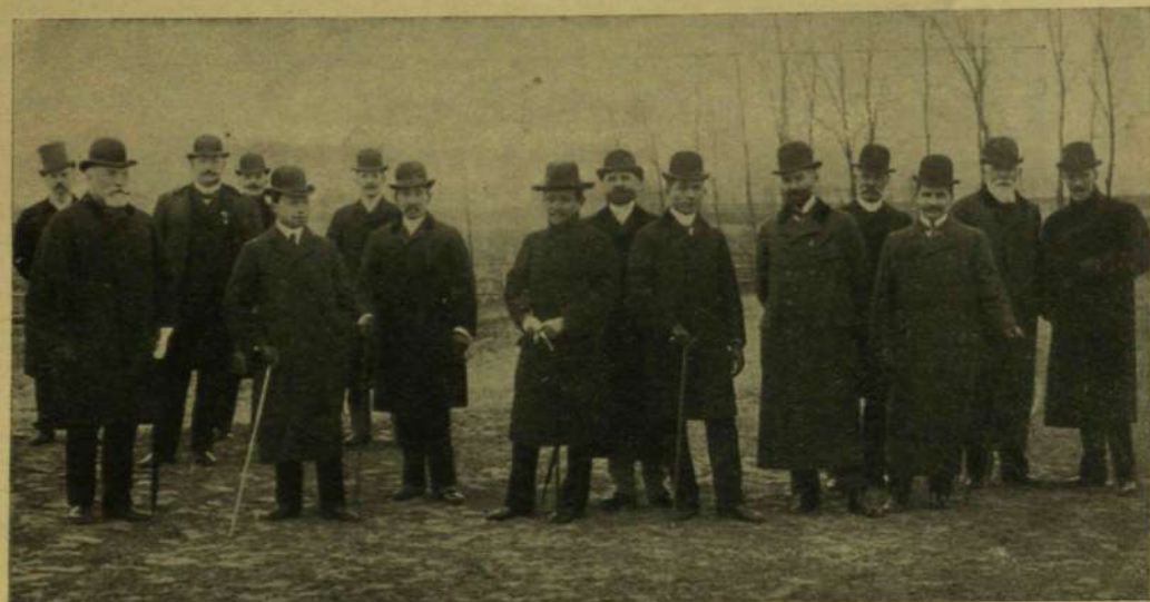
Darányi miniszter. A szími trónörökös.