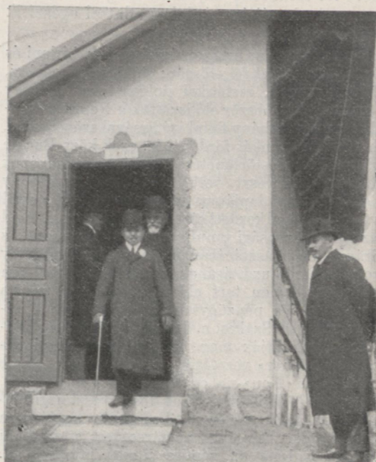
A trónörökös Darányi miniszterrel kijön a méhesből.

És nem kelt fel többé, de azért bátran nézette végzeté elé. Mint orvos tudta, hogy menthetetlen s mégis derült arccal fogadott mindenkit. Jó barátot és — páciens! Utolsó napjáiig rendelt a szenvedőknek, ő, a ki maga is annyit szenvedett. És megdöbbentő nyugalommal vizsgálta saját érverését s olvasta az ütések számát. És feljegyzett mindent pontosan, a szubjektív tünetekkel együtt, hogy tanuljanak rajta kártársai. Úgy halt meg, mint egy igazi