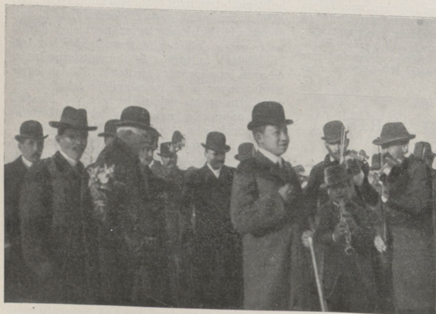
A trónörökös a népnünnepen.