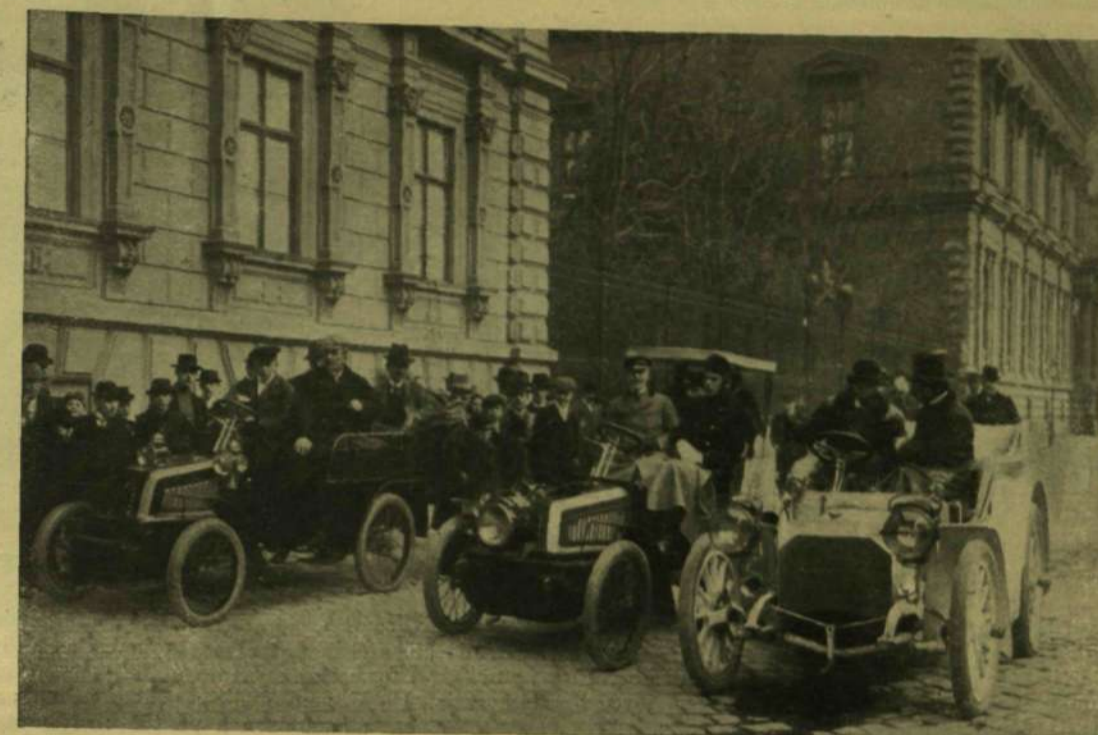
GYÜLEKEZÉS AZ AUTOMOBIL-KORZÓRA.

annál nagyobb örömmel üdvözölheti az újnák megjelenését.