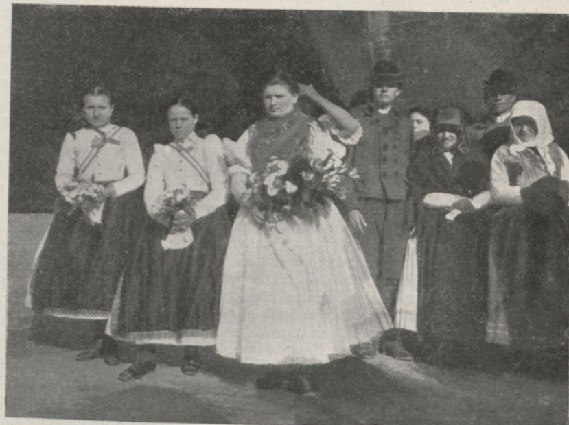
Alakok a népnünnepről.