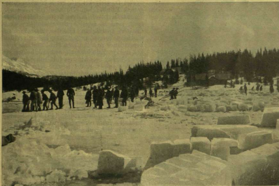
JÉGTERMELÉS A CSORBA-TAVON.

fuladtak meg, a nélkül azonban, hogy a haláluk felett borongó rejtély valaha véggé tisztázódott volna. Csontjaikat állítólag II. Károly idejében találták meg a Towerben, a hol be voltak falazva s a honnan később a westminsteri apát-ságba szállították át.