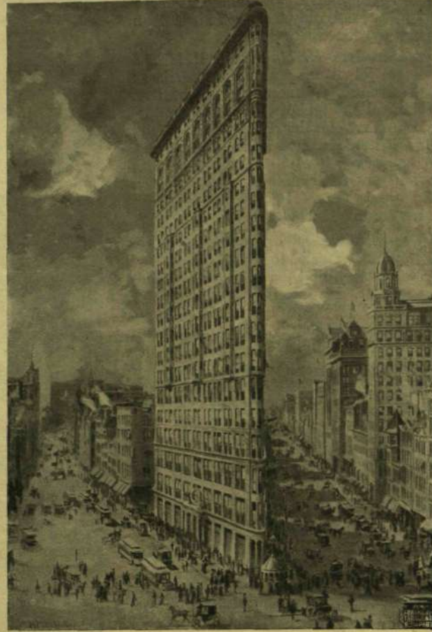
A «FLATIRON»-HÁZ NEW-YORKBAN, A FELÉPÍTÉS UTÁN.