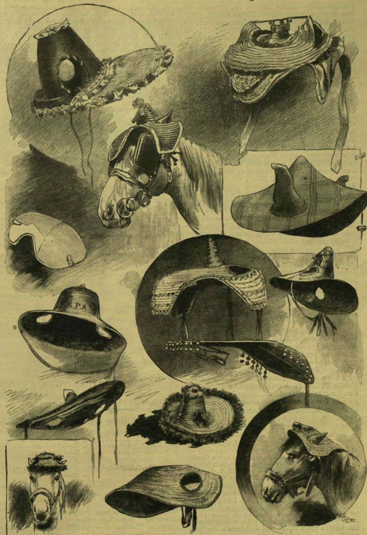
LOVAK SZÁMÁRA KÉSZÜLT PÁRIISI NYÁRI KALAP-MINTÁK.

Nagy életbiztosítók. VII. Edvárd angol király életét 18 millió koronára biztosította. Umberto olasz király meggyilkoltatása után három angol biztosító társulat a király családjának 36 millió