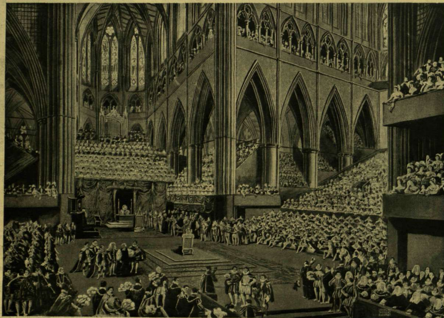
IV. GYÖRGY ANGOL KIRÁLY KORONÁZÁSA A WESTMINSTER APÁTSÁGI TEMPLOMBAN.