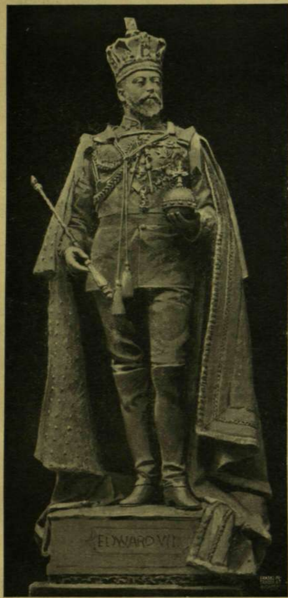
VII. EDVÁRD KIRÁLY SZOBRA. — Vade György szobornívő.

vendégeket. Két nap választotta el csak attól, hogy homlokát érintse Canterbury érseke Szent Edvárd koronájával, a mikor állapota egyszerre oly rosra fordult.