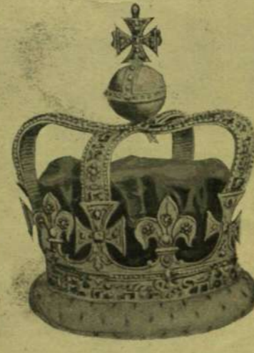
SZENT EDVÁRD KORONÁJA.

Nagyon sajátos régi szokás maradt fenn az újabb időkig a koronázási lakoma alkalmával, melyet ugyan Viktória királynő nem tartott meg, de most ismét fel akarták eleventeni. Abban áll ez, hogy a lakomán, mielőtt a második fogást behoznák, megjelenik teljes fegyverzetben, pompás szerszámu fehér lovon, a király lovagja . A király asztalához lépve, így szól: «Ha van valaki, bármi rendű és rangú személy, magas vagy alacsony állású, a ki tagadni meri, hogy a mi urunk ő felsége az egyesült királyság jogos és törvényes öröke, vagy ha van, a ki azt mondja, hogy a királyi czímet viselnie nem szabad, itt van a lovag, a ki azt mondja, hogy hazudik az illető és hazug áruló. Kész vagyok vele megvíni életre-halálra.» A lovag ekkor maga elé dobja keztyűjét. Természetesen a kihívásra nem felel senki. Erre a király ezüst billikomból a lovag egészségére iszik; a billikomból a lovag kapja jutalmul s azután hódoló meghajlással kivonul. E régi, a középkori istentételekben s lovagi tornákban gyökerező szokás értelmében mindig a Dymoke-család egyik férfitagjának joga, hogy mint a király lovagja szerepeljen.