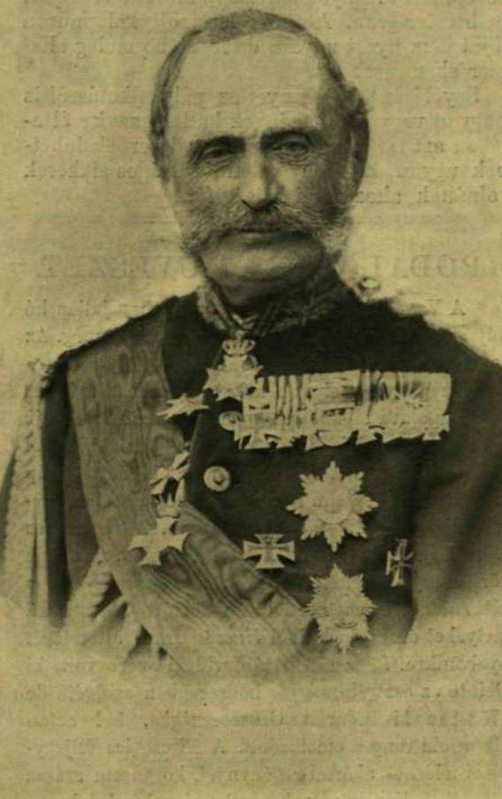
GYÖRGY SZÁSZ KIRÁLY.

Atyja trónralépte (1854) óta elnöke a szász régészeti társulatnak, 1864 óta kurátora a művészeti akadémiának. E két hivatalában, melyeket soha sem tekintett tires címeknek, sokat tett a tudomány és a művészet érdekében.