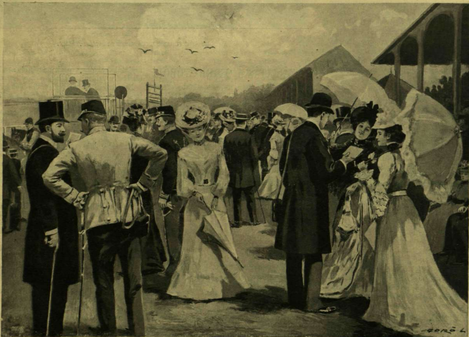
Goró Lajos rajza.

* Az oroszországi vasutakon egy millió utas közül évenként átlag harmincz ember veszt életét.