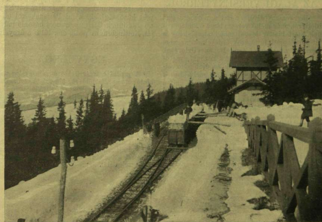
A CSORBA-TÓI FOGASKERÉKŰ VASÚT ÁLLOMÁSA TÉLEN.