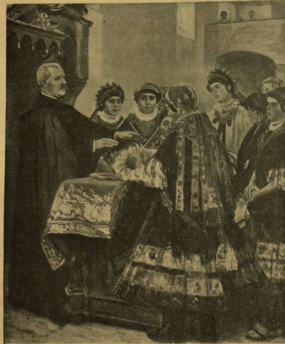
«Könyves Kálmán» intézet tulajdona. Csók István: Sárközi keresztelő.

halkan, hosszúkas, ráncos arcán feltűnő kedvetlenséggel.