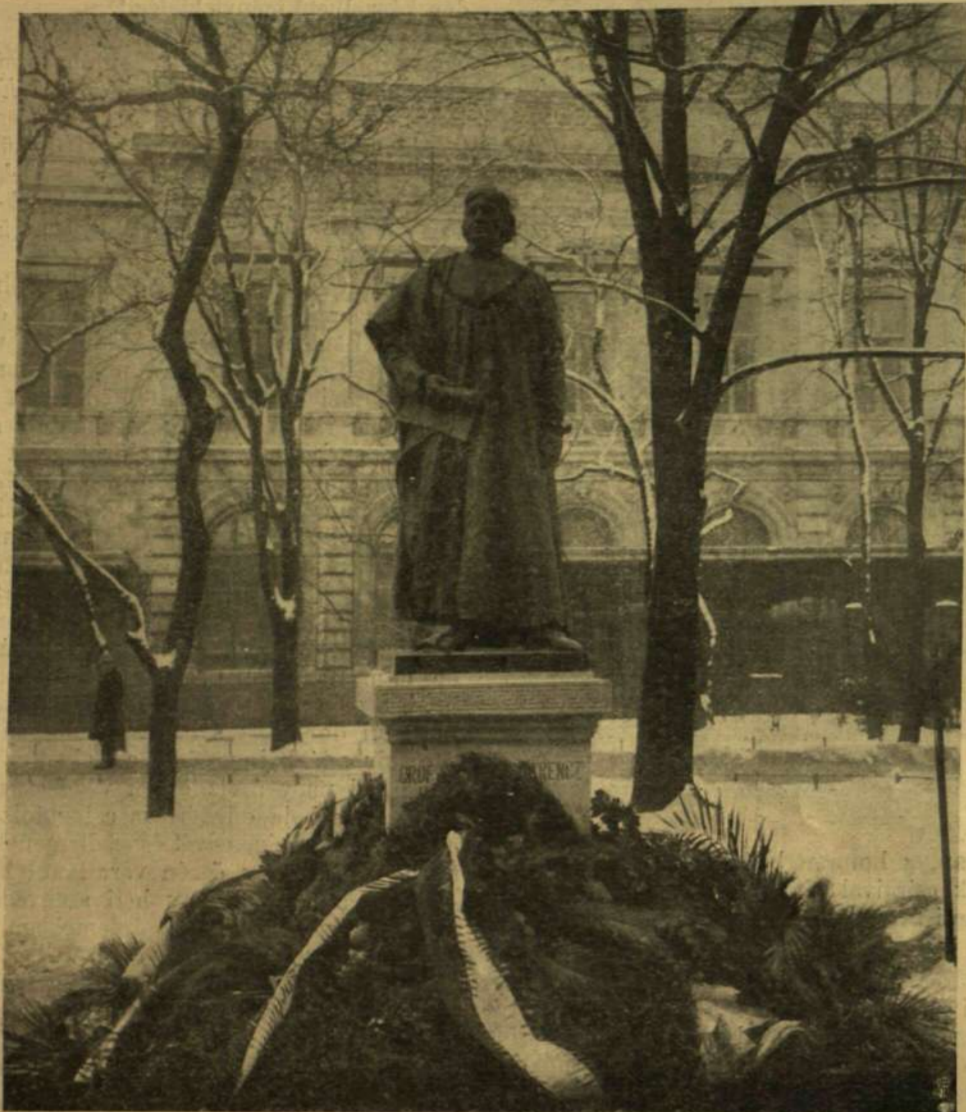
GRÓF SZÉCHENYI FERENCZ SZOBRA A NEMZETI MÚZEUM KERTJÉBEN, A LELEPLEZÉS UTÁN.

azt hiszi, ez elég arra, hogy megóvjon az izléstelenségtől. Pedig tekintetbe kellene venni, hogy nincs se abszolút szép, se abszolút csunya. A színek összetételének megválasztására nem lehet szabályt felállítani. Ebben csak a tapasztalat és a kísérlet vezetheti az embert. Látni néha merész összeállítás, melynek a régi arany szabályok szerint okvetlen csúnyának kellene lennie, s mégis nagyon szép hatást tesz, annival is inkább, mert az újdonság, a szokatlanság hatása is hozzájárul. Ilyen merész kísérletre azonban nem mindenkinek van bátorsága s minden esetre biztos ízlés kell hozzá, mert könnyen vezethet a neveltség útjára.