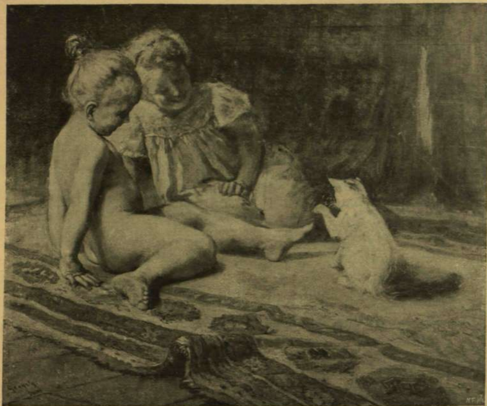
Gerjely Inre : Macskával játszó gyermekek.

A KÉPZŐMŰVÉSZETI TÁRSULAT TÉLI KIÁLLÍTÁSÁBÓL.