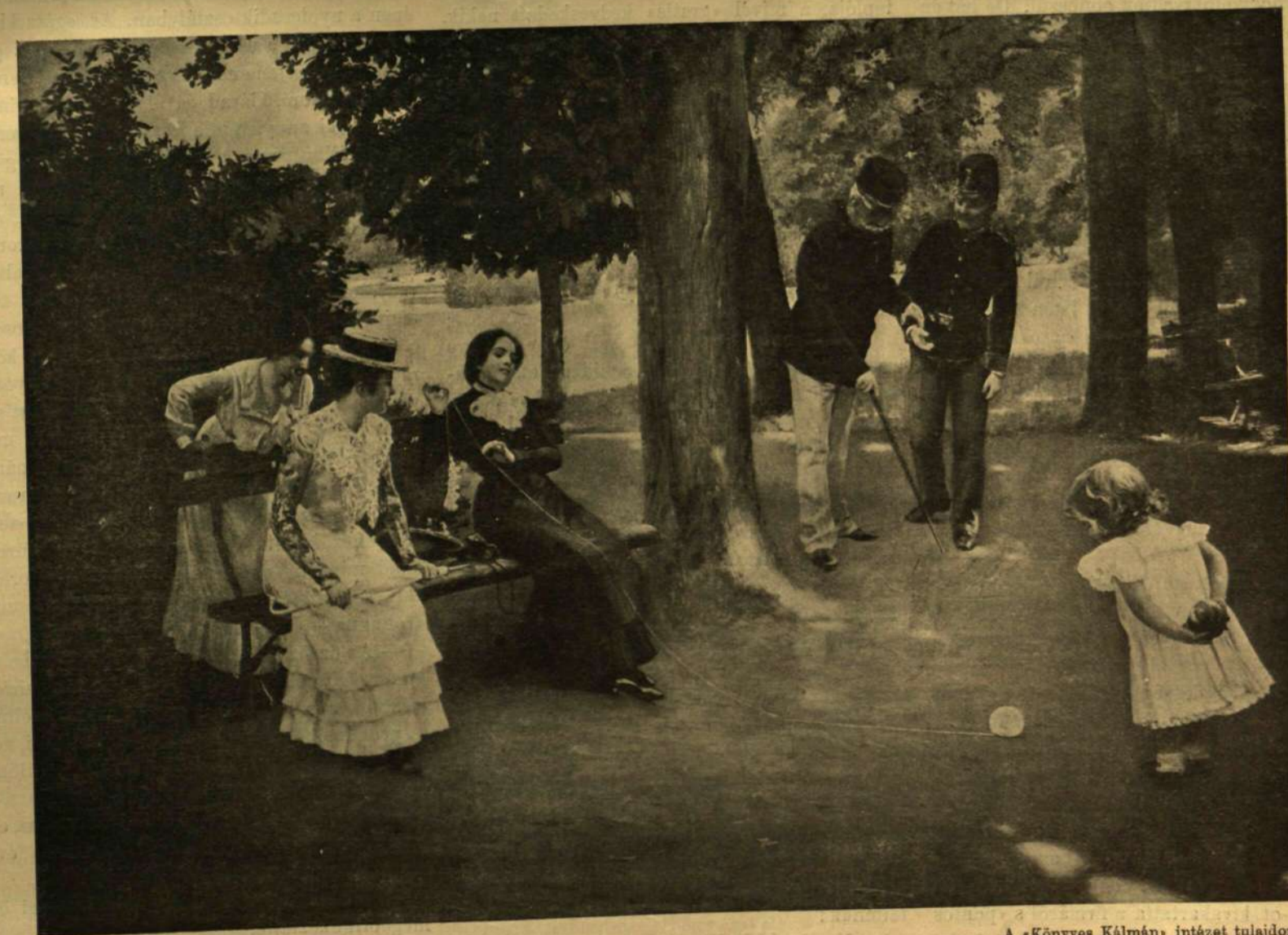
ODISSEUS ÉS A SZIRÉNEK. — Skutesky Döme festménye.

A KÉPZŐMŰVÉSZETI TÁRSULAT TÉLI KIÁLLÍTÁSÁBÓL.