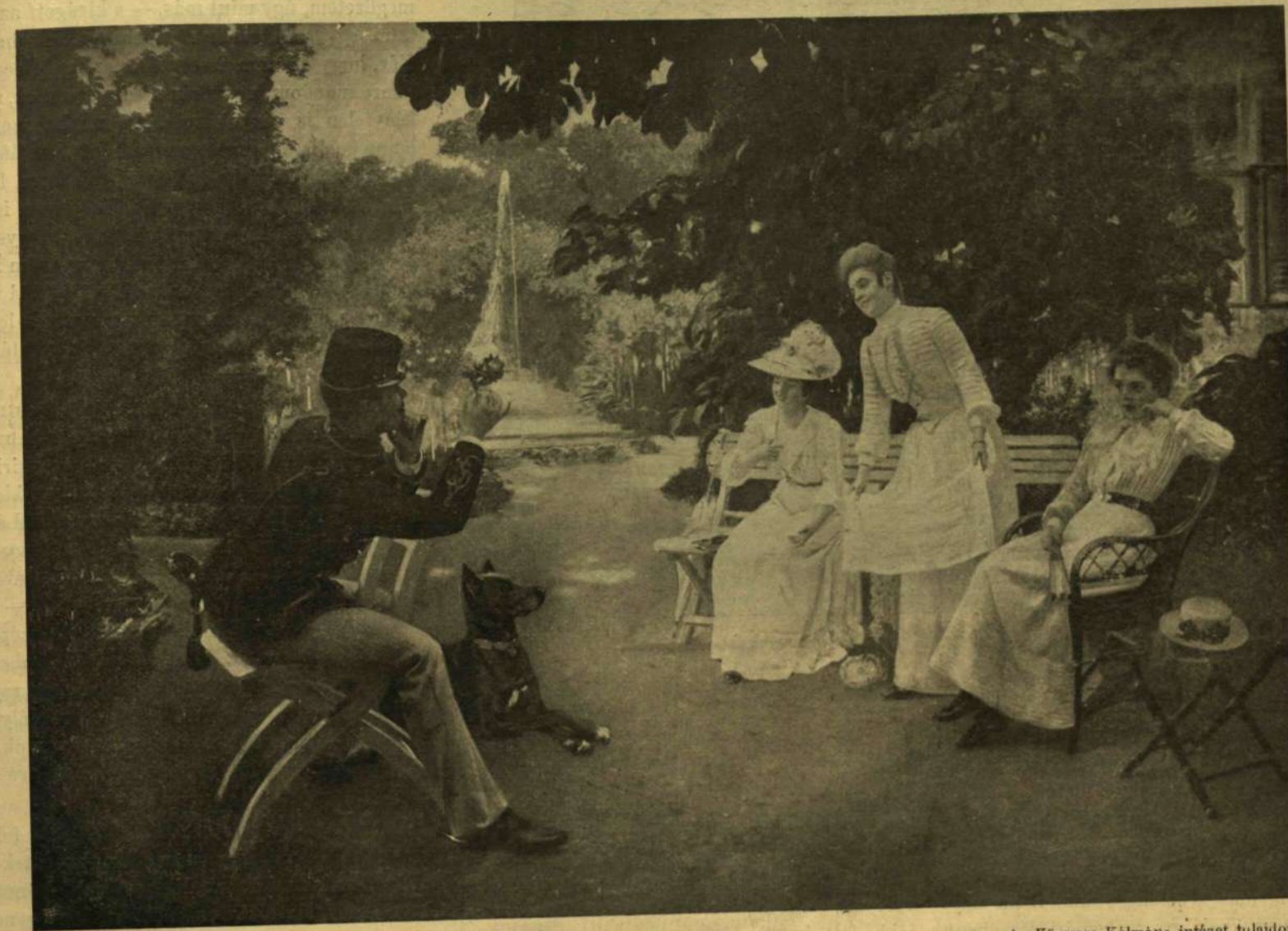
A MODERN PÁRIS. — Skutesky Döme festménye.

Természetesen minden szem a menyasszonyt kereste, figyelte ma este. Az vidám, eleven volt,