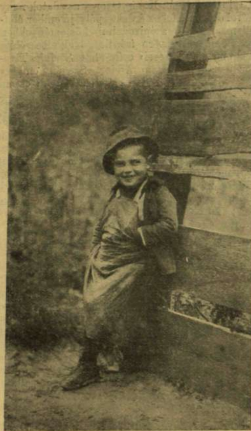
A kis Lenczi.

A király az utóbbi napokban annyira jól érezte magát, hogy visszatért szokott életmódjához és fáradhatatlannal végezte az országos teendőket. Míg a király Schönbrunnban tartózkodik, a világ minden tájáról ezrével érkeznek a főudvarmesteri hivatalhoz levelek, a melyekben tanácsokat