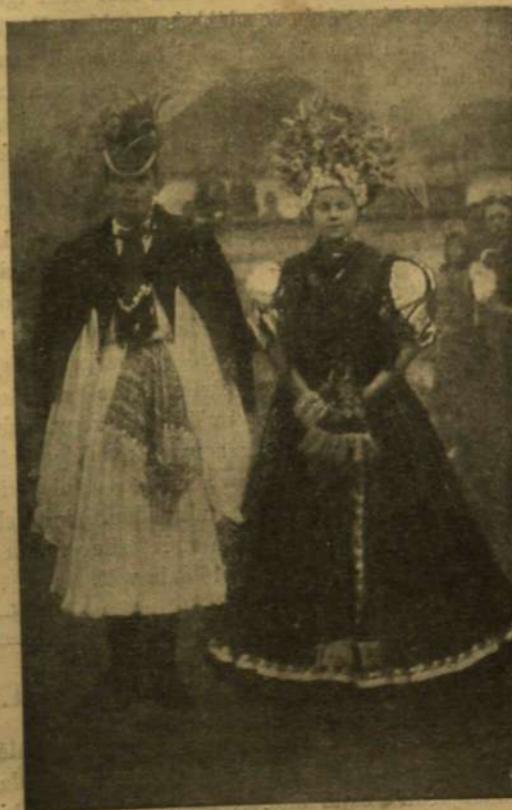
AZ ÚJ HÁZASPÁR.