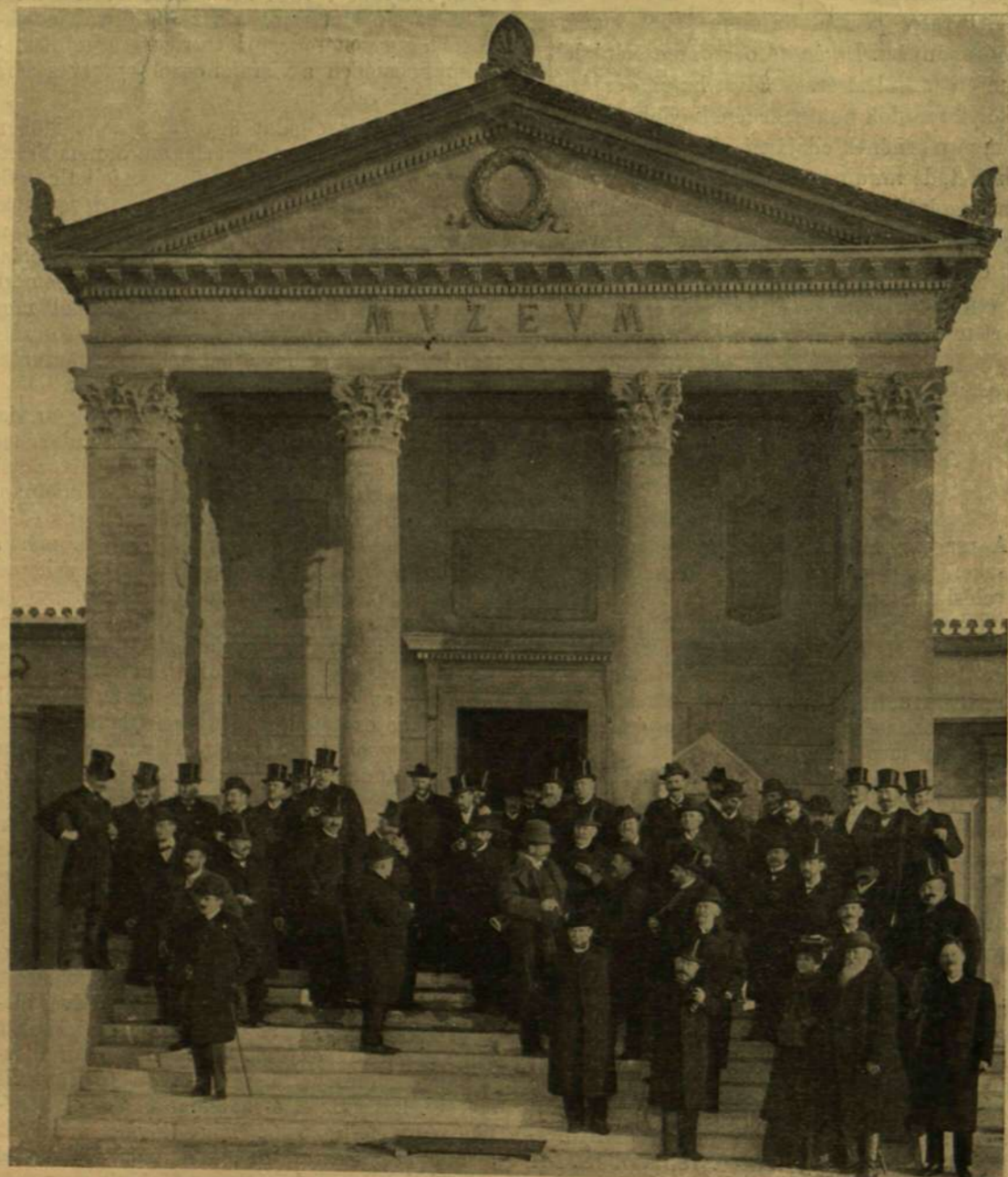
KIRÁNDULÓK AZ AQUINOMI MÚZEUMNÁL.

* Egy vasúti mozdony átlag 15 évig használható s ezen idő alatt kerek számban 1.500.000 koronát érő munkát végez.